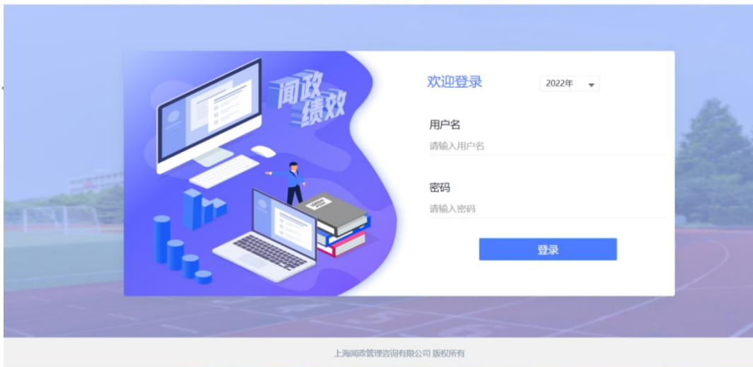
图 2 预算绩效一体化平台界面图