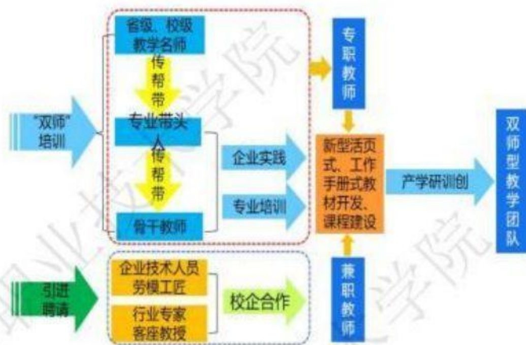
图3 双师型教师团队建设体系