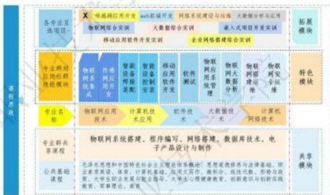
图 2. 专业群课程体系

创新团队：打造专业群双专业带头人模式，比例达 100%；形成建设总结报告 10 个，委托第三方机构开展专业群评估，覆盖率 100%。紧密对接区域产业结构转型升级需求，专业结构不断优化，影响力持续增强。