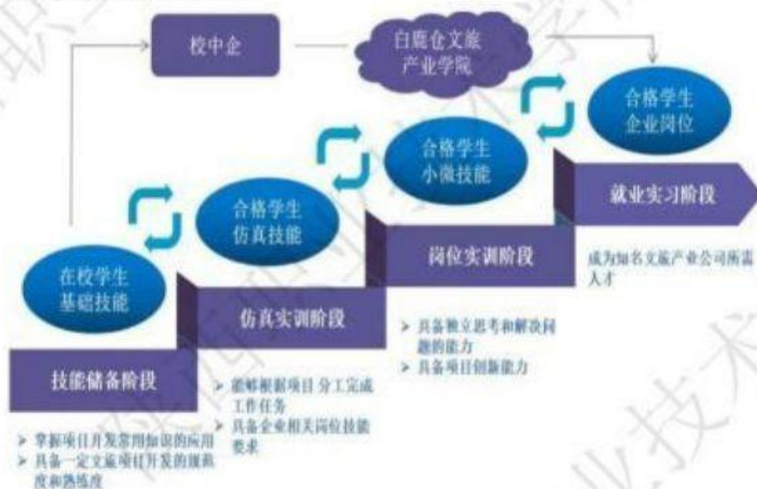
图 5 协同共建产业学院

旅游管理专业群“实践教学基地”中期任务 25 项，数量指标 13 个，质量指标 8 个，完成率 100%。完成麦道—82 全机舱、航空 CBT 实训室、航空急救实训室、白鹿原五星餐饮生产性实训基地等建设，启动建设智慧文旅综合实训中心。建成白鹿仓文旅产业学院，与陕西文化投资控股集团、陕旅集团、陕西宾馆、白鹿仓景区、杠杠研学等龙头企业签订校企合作协议，建成学生实习实践基地；与三亚凤凰机场、西安咸阳国际机场、西咸会议中心、西安会展中心等单位进行紧密联系，推进校企合作。