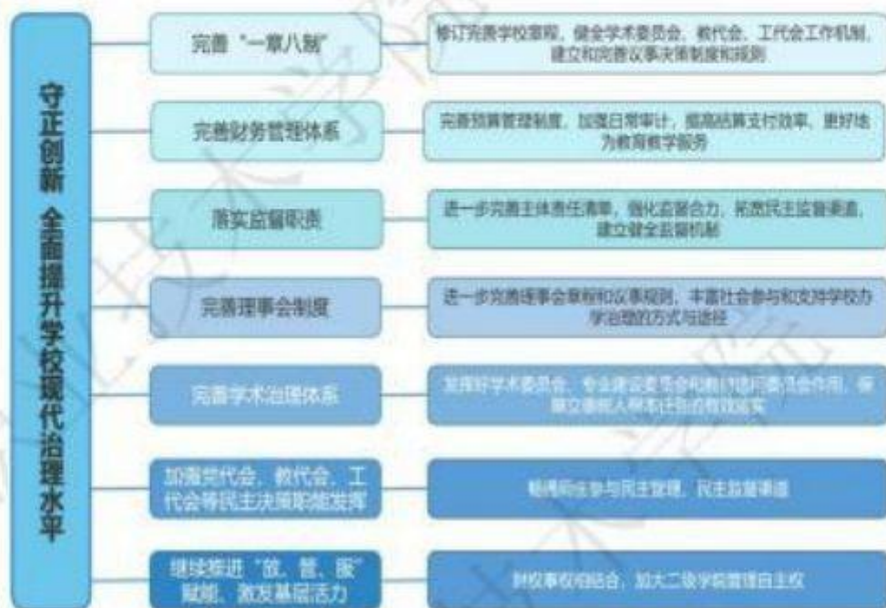
图6 学校内部治理体系

学校通过强化党委管党治党、办学治校主体责任，完善内部治理结构（见图6）；实施党委“一委六部”大部制改革，将23个职能部门统整，畅通了部门间的沟通协作；实施常态化校内政治巡查，营造出风清气正的工作氛围；依法治校，充分发挥各类理事会、委员会及群团的作用，形成多元参与的民主治理机制；强力推进“放管服”、职员制改革，施行扁平化治理，充分激发学校的办学活力；加快职务晋升制度改革、职务评审制度改革和绩效工资制度改革，形成了人人参与的文化生态。