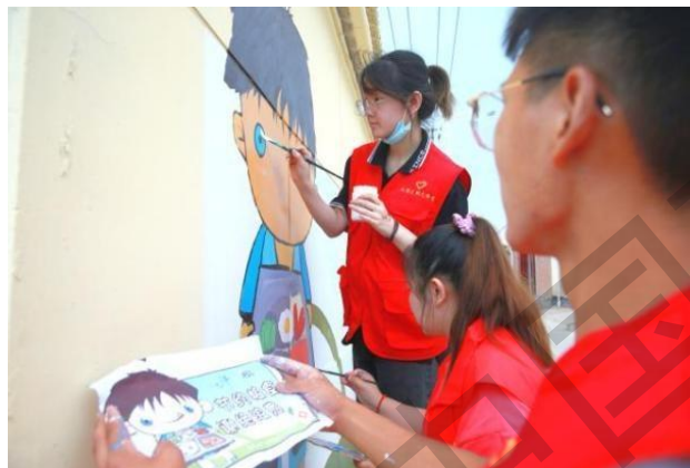
艺工学院学生绘制农村文化墙