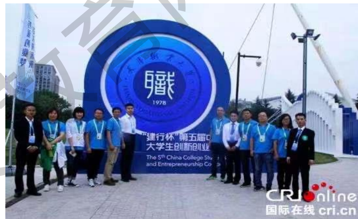
第五届“互联网+”创新创业大赛金奖团队

在“创青春”、“挑战杯”等大赛中，获国赛铜奖1项，市赛金奖1项，银奖8项，铜奖6项。