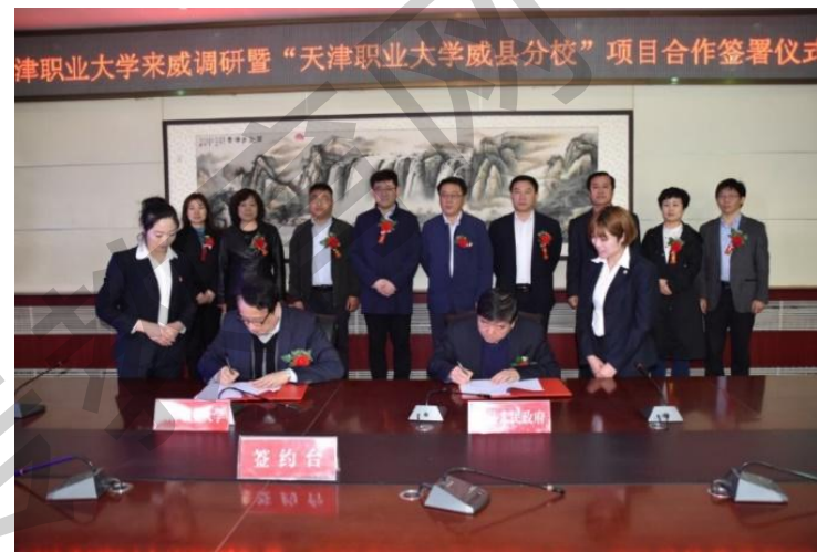
签订威县分校共建合作协议