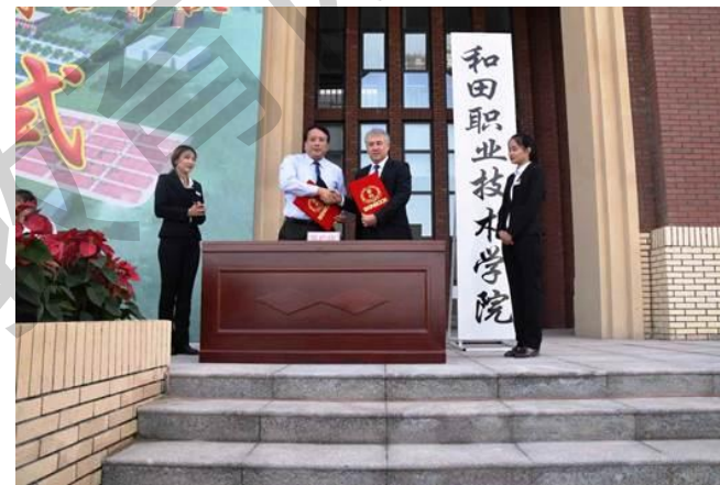
与和田职院签订对口帮扶框架协议