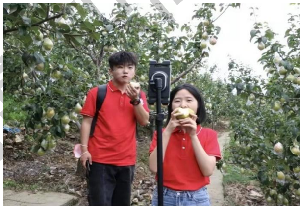
电商专业直播团队推广优质梨