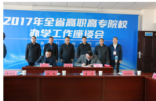
与武威职院签订对口支援合作协议