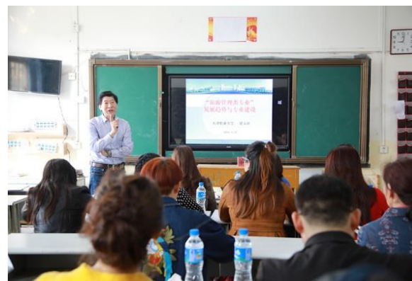
云南红河酒店专题讲座