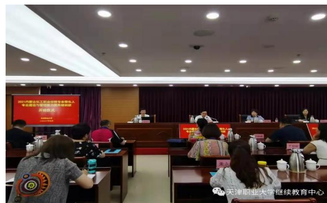
内蒙化工职业学院师资培训