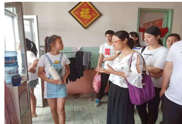
公管学院师生入户调研