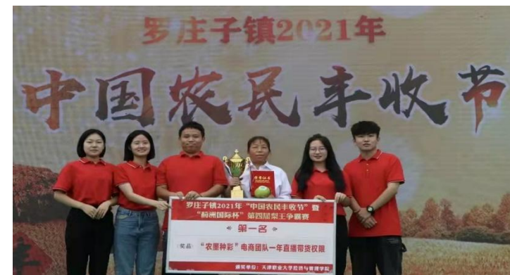
天津职业大学电商技能培训基地