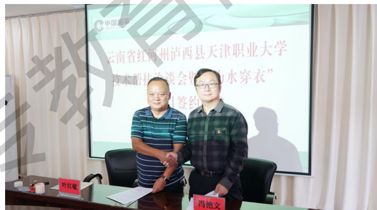
与泸西县高原特色产业发展服务中心 签署科创项目成果转化协议

以“农作物种植-农作物茎秆回购-加工半成品-生产产品-商品销售”的产业链条建设所形成各节点的问题为导向，深入开展科创项目调研和再开发工作。