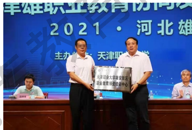
建设雄安新区职业教育师资培训中心

2021年上半年，学校面向和田、雄安三县教育中心、内蒙化工职业学院等中高职院校 开展师资培训近1000人次 ，持续发力帮扶地区乡村振兴建设阶段技能人才培养。