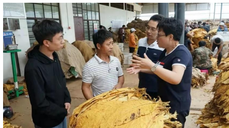
到收购网点采集数据