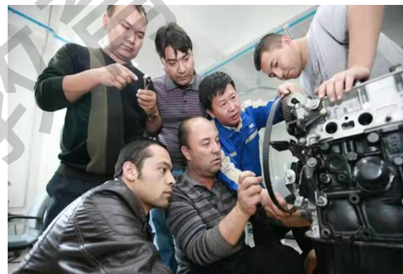
和田职院汽修培训