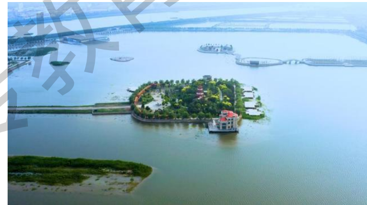
参与北辰区“曙光水镇”项目建设

挂牌建立电商培训基地。 在蓟州区罗庄子镇挂牌建立农业电商技能培训基地，培训农村网格员电商技能。