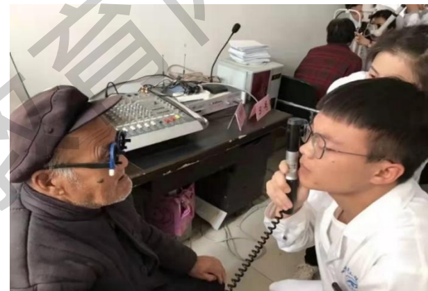
视光学院学生为村民开展视力检查

今年上半年，学校积极开展“传承红色基因 勇担时代使命”系列实践服务活动，各学院先后成立“新时代·乡村振兴战略实践行”团队14支，开展乡村振兴暑期社会实践活动共计41次。