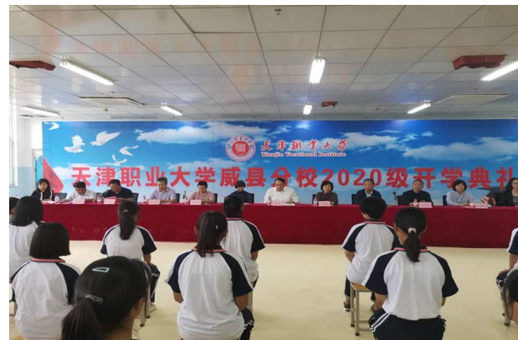
威县分校2020级学生开学典礼