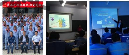
滨州职业学院 魏桥铝电高级进修班学员留影 2012.12.

董事长张波“企业的发展离不开人才，人才的培养离不开教育，滨州职业学院就是我们魏桥铝电的黄埔军校。”