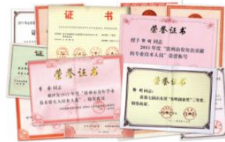
与富海集团联合申报科研课题2项，实现技术服务收入10万元