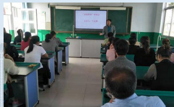
第一书记扶贫培训