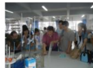
与富海合作举办全国和省级化工专业骨干教师培训

校企联合申报纵向科研课题5项，社会培训600人次、 职业技能鉴定800人次。投入325万元共建校内实训基地，实 现“校中厂”、“厂中校”等形式的实践教学。