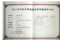
化工实训中心获批为“全国化工行业职业技能鉴定实训基地”