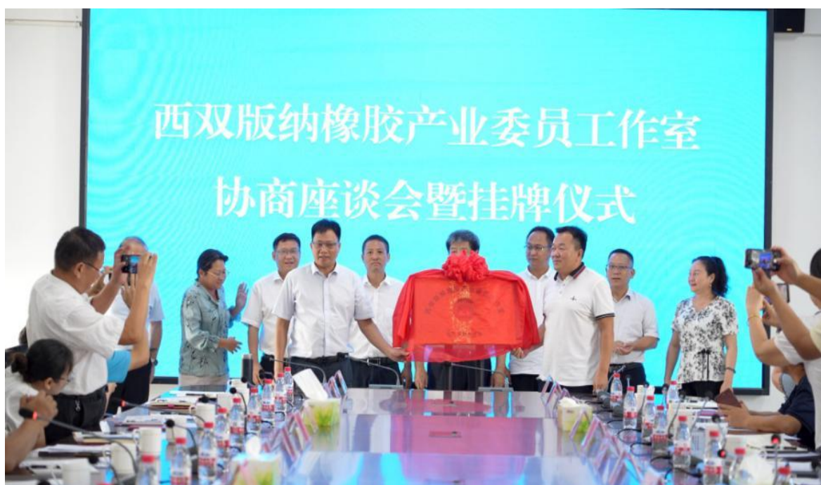
图 3：西双版纳橡胶产业委员会工作室挂牌仪式

学院将充分利用橡胶工作室这个桥梁纽带，汇集各方力量，“校—企—政”三方共同推进完善橡胶种植、资源保护与利用等热带作物专业技术人才培养。下一步，学院将新开设“现代农业技术”