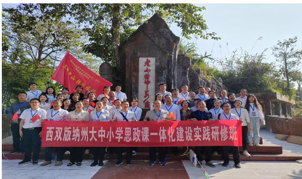
图 2：西双版纳州大中小思政课一体化建设实践研修培训班 扎根西双版纳了解州情民情，在实践中增长智慧才干，在艰苦奋斗中锤炼意志品质，不断拓展实践类课程思政建设方法和途径。 悟红色历史，领悟先辈家国情怀。

革命文化蕴含的生动气息、人文精神、价值理念来涵养新时代思政课教师落实“立德树人”根本任务目标，践行“为党育人、为国育才”的初心使命。组织全州大中小学思政课教师围绕中心工作，着力推动开展大中小学思政课建设、“三全育人”模式研究、“如何培养时代新人”等内容的论坛。学院组织开展大中小学思政课一体化建设“红色的丰碑”寻访体验活动，组织思政教师积极参加大中小学思政课一体化建设实践研修培训班。将读万卷书与行万里路相结合、专业学习与社会服务相结合、知识教育和劳动教育相结合，