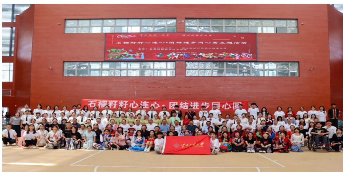
图 4：与云南民族大学师生联合开展民族团结进步活动