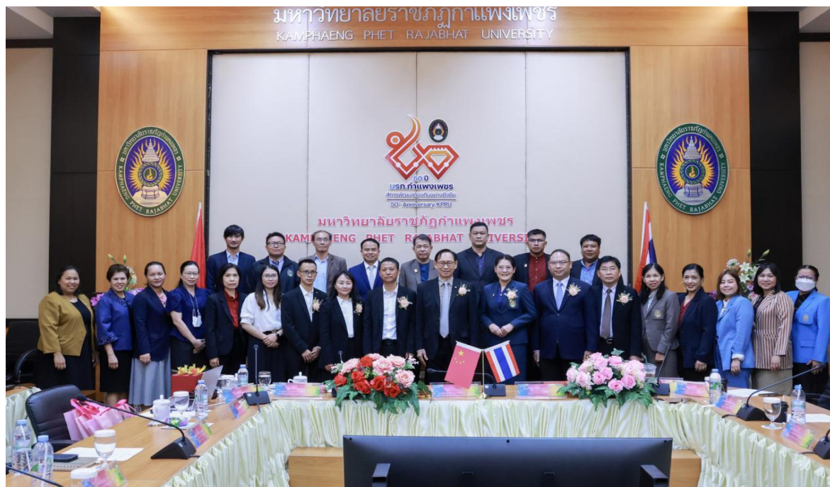
图 6：学院与泰国院校合作签约仪式

建“教育合作基地”，为泰国、老挝合作院校学生学习中文、交流中国文化提供平台。项目既实现了联合培养“一带一路”应用型泰语、老挝语、缅甸语人才又传播了中文和中国文化。