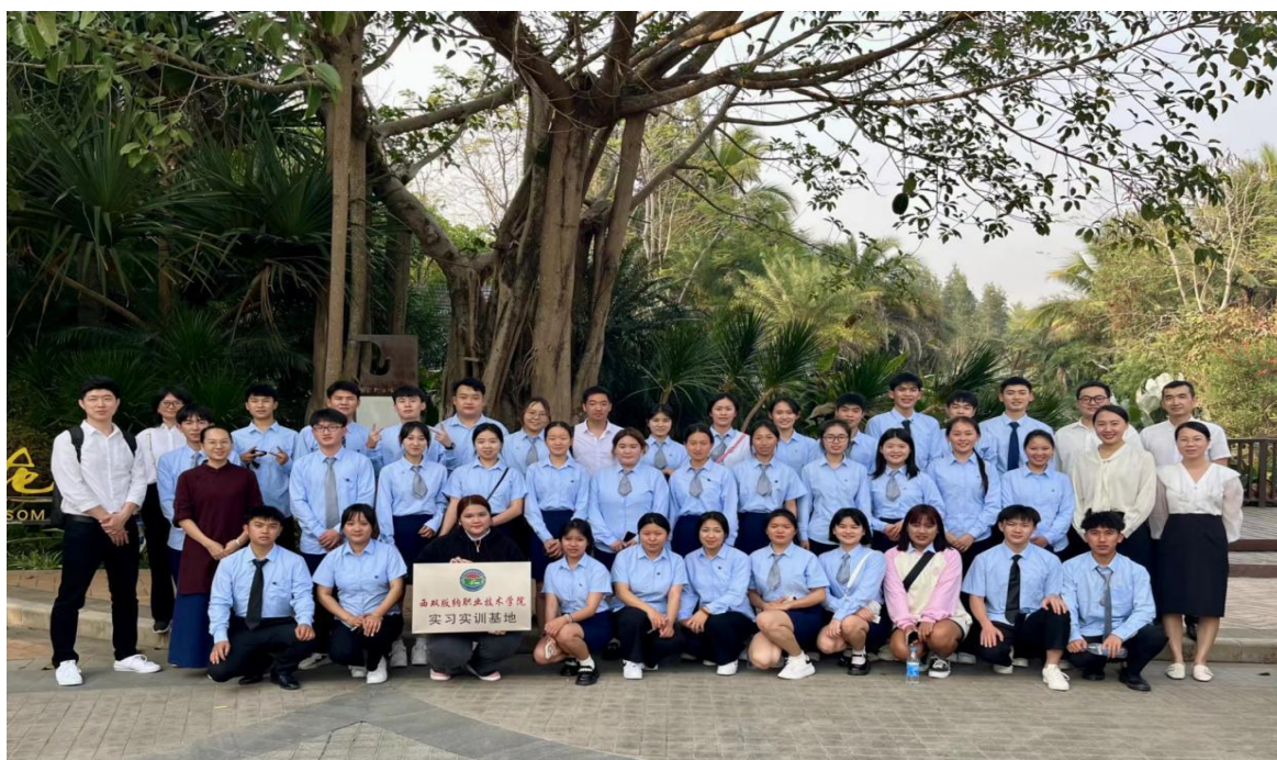
图 8：学院“华住班”全体学员

同时，校企共建实训基地，把企业生产、管理、经营、服务的实际工作活动作为课程核心，在职业活动的情境中开展教学活动，设计教学过程；创新教学方式，积极开展项目化、场景化、虚拟仿真和岗位教学，建立以单项任务模拟训练为主的工位操作环境、以专业综合实训为主的工作环境 and 以任务训练为主的企业工作环境，建立“师傅带徒弟”传帮带模式及“3+2”培养模式，学生半工半读，边学习边实践。由“华住”委技能能手、企业名师入校，