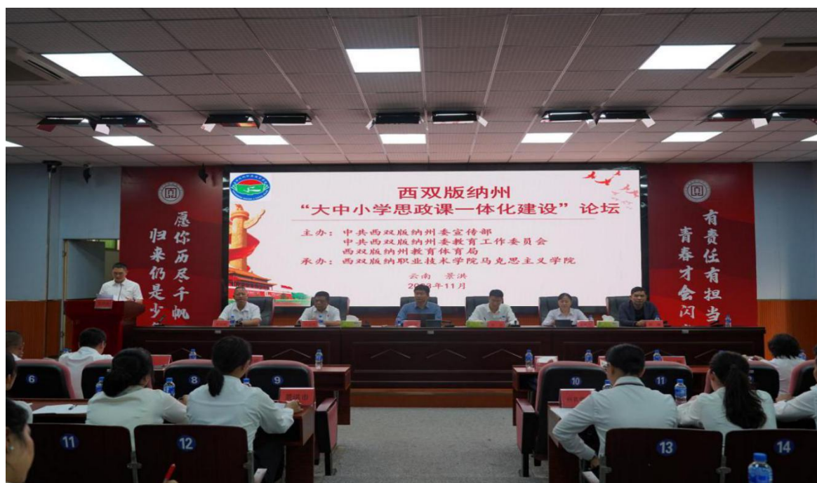
图 1:西双版纳州“大中小学思政课一体化建设”论坛 合”“大中小学思政课一体化建设”的重要内涵，用中华优秀传统文化、

学院按照大中小学思政课一体化建设工作要求，开展了一系列实践教学活动，积极加强同红色文化基地联系和沟通，开拓思政课实践教学基地，打造大中小学思政课一体化建设“实践教学基地”。组织知名专家学者走进学院，广泛宣讲“教育强国”“两个结