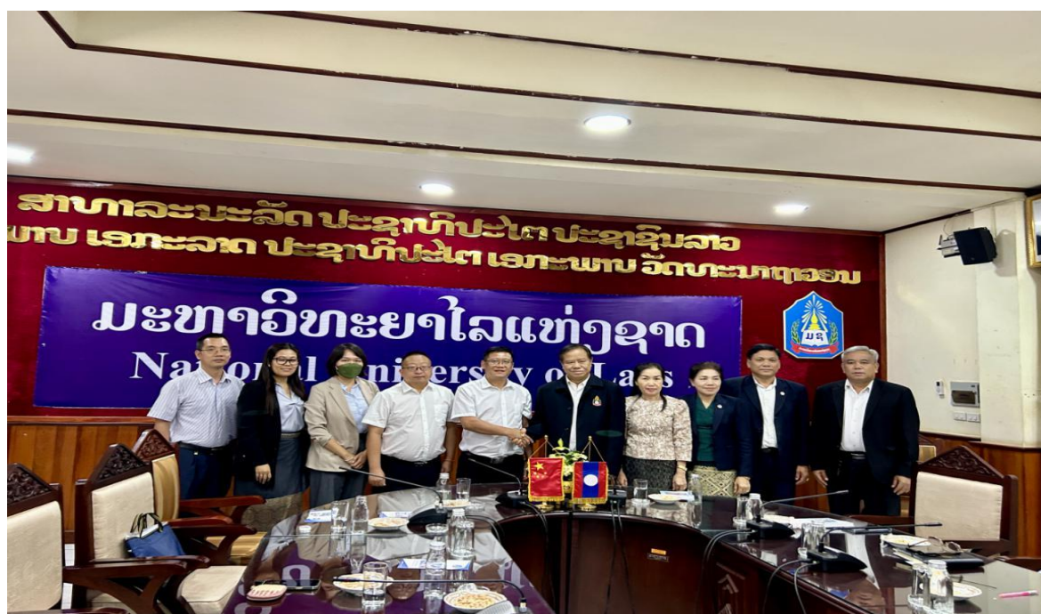
图 7：学院与老挝院校合作签约仪式