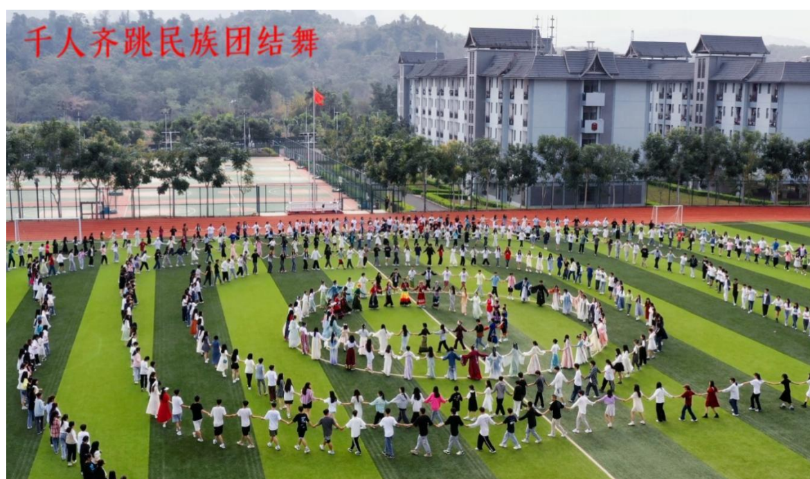
图 5：学院学生组织开展千人齐跳民族团结舞

中华民族共同体意识教育内容纳入学生思想政治领航计划。在校园文化环境建设中突出国旗、国徽等国家标识，立体的呈现出中国共产党人精神谱系和社会主义核心价值观等。持续开展丰富多彩的校园文化活动，将铸牢中华民族共同体意识教育内容融入党团日、主题班会等各类活动中。利用好中华民族传统节日，开展富有中华民族共同体内涵的文化活动。分别打造铸牢中华民族共同体意识主题广场和主题教育电子馆各 1 个，常态化组织各族师生参观学习，不断巩固中华民族共同体思想基础。实行不同民族家庭背景学生合班混宿制和贫困档案，加强对各族学生学业和就业帮扶资助。践行好学校网站、校园广播、校报校刊等的宣传教育作用。成功创建成为州级和省级民族团结进步示范单位。通过常态化、长效化教育宣传，坚定引导各族师生做民族团结进步事业的维护者、践行者、建设者。