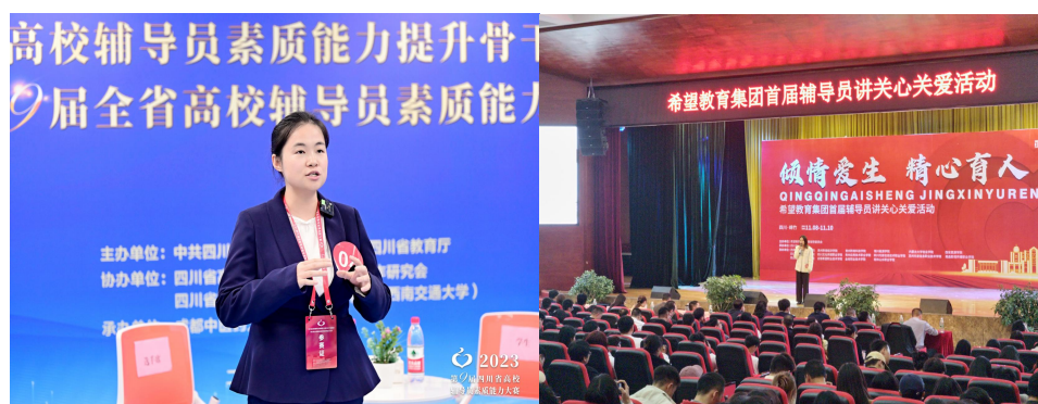
图 4-2 辅导员素质能力大赛现场

3. 结合专业建设和发展的需要,及时从行业、企业引进具有丰富工作经验的优质教师资源,充实教师队伍。