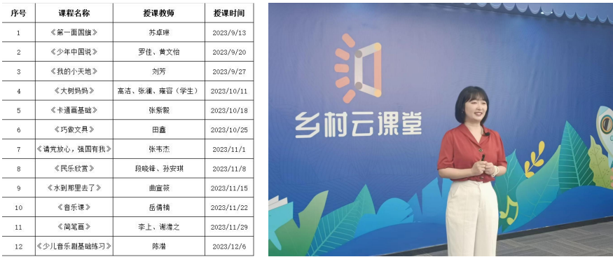
图 6-2：“乡村云课堂”课表及线上教学图片

堂”升级版，为藏区小学生远程教学的过程中，“乡村云课堂”教学团队多次深入甘孜藏区调研，青年教师得到了锻炼，促进了教育观念的转变和教学方式方法的改进，拓展了教学资源 and 教学视野，取得了一些教学成果，收集整理“真达锅庄”艺术的采风实录记谱 5 首，据此制作了纪录片《跳进小康的真达锅庄》，荣获“时代光影 百部川扬”文旅优秀作品并参加精品展播，在高教学会第四届省大学生原创影视作品推优活动中获省三等奖；纪录片《在尔玛底村的日子》获省大学生艺术节一等奖；《乡村振兴战略下偏远藏区小学美育课程实践教学探究——以四川文化传媒职业学院“乡村云课堂”为例》获省大学生艺术节优秀案例二等奖。