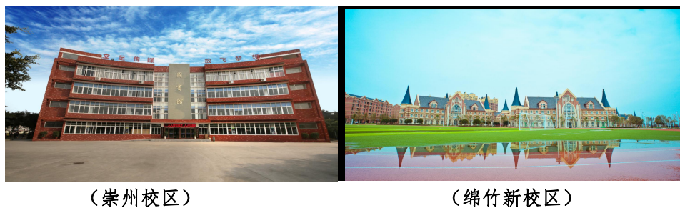
图 1-1 学校风貌

学校坚持以习近平新时代中国特色社会主义思想为指导,坚持中国特色社会主义办学方向,全面贯彻党的教育方针,依法办学,落实立德树人根本任务,以服务发展为宗旨、以促进就业为导向,以质量求生存、以特色创品牌,走校企合作、产教融合的道路。依托文化产业、融入文化产业、服务文化产业,努力为文化产业转型升级提供高素质技术技能型人才,把学校建设成为文化艺术人才培养、创作生产、传承创新的高等职业教育重要基地。