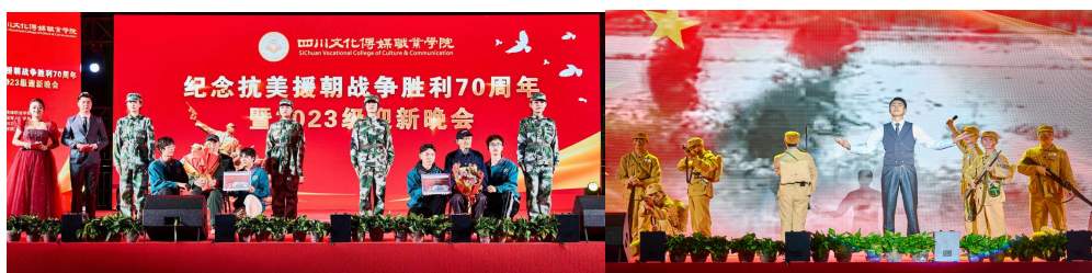
图 2-1 纪念抗美援朝战争胜利 70 周年晚会现场

通过这次活动，不仅回顾了历史，更重要的是对学生们进行了爱国主义的深刻教育。这不仅是一场文化和艺术的盛会，更是一堂生动的思想政治课，学生们能够深刻理解和平的珍贵，继承和发扬抗战精神，为建设更加和谐美好的社会贡献自己的力量。