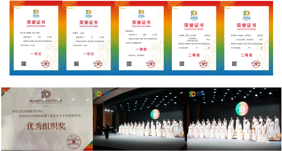
图 2-2 获奖证书、参展现场

2023 年 5 月 10 日，四川文化传媒职业学院成功举办“向学融园 • 共育英才”首届幼儿园园长论坛。四川幼儿师范高等专科学校，绵竹市教育局、市教师培训中心、市融媒体中心，川内 20 余家幼儿园，希望教育集团及其旗下院校以及学院近 150 余名领导、专家、园长及师生代表参加了论坛。论坛开幕式上，学院党委书记（督导专员）周世伟教授指出，学院学前教育专业办学中还存在许多捉襟见肘的问题，人才的培养方案、年轻教师的实践经历还需不断完善，适应新时代新形势的学前教育体系还需要不断探索创新。希望教育集团教指委副主任姚寿广教授指出集团教指委将以构建高质量学前教育发展体系为目标，围绕健全制度保障、创设友好环境、打造精良队伍、全面提升质量等方面，继续保持好集团化办学优势，通过以优带薄、以强促弱的方式，形成集团学前教育整体优化的良好局面。