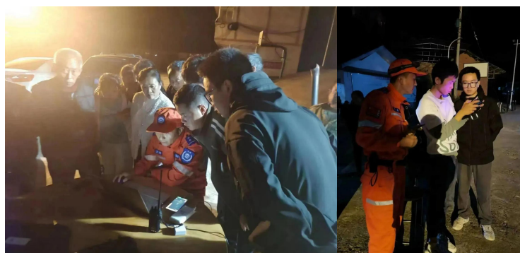
图 6-1：“科技助力成功寻人”搜救现场

技助力成功寻人，管理局深受感动。同时，管理局也表示会积极推荐他们参与更多的社会服务和应急救援任务，让他们的专业技能发挥更大的作用。无人机专业师生表示，我们始终牢记技术服务社会，如今，德阳市管理局搜救工作需要我们，社会需要我们，我们义不容辞，并将继续探索无人机热成像在社会救援中发挥更大作用的方法。