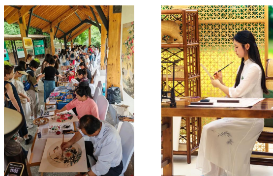
图 6-3：探寻竹编文化，领略非遗魅力

这次实地探访圆满结束了，通过一个个传承人、一件件非遗作品，学生们目睹了传统工艺的精湛技艺与创新融合的完美呈现，对非遗传承，同学们深感责任重大，愿意为传统技艺注入新活力，为非遗的传承与创新而努力。他们热切期望未来能够参与更多类似的活动，为保护和传承非遗贡献出自己的青春力量。