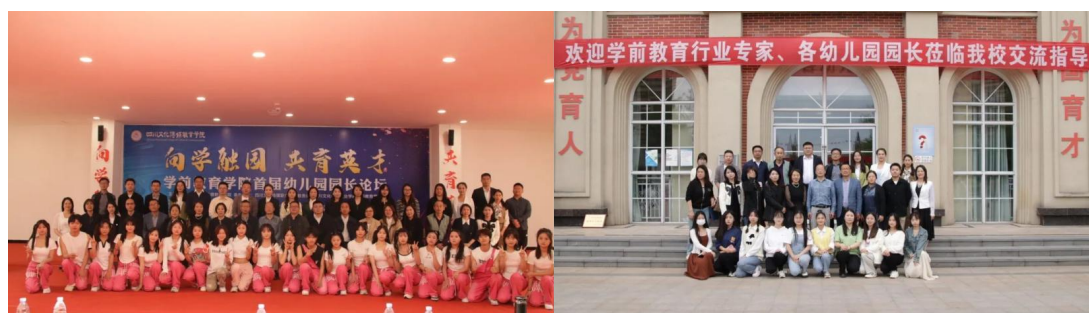
图 2-3 活动照片