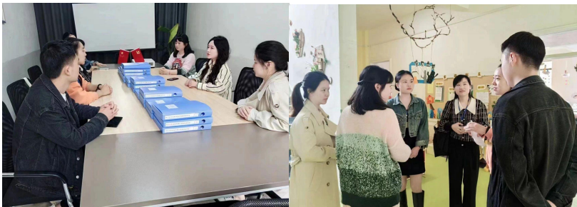
图 3-3 教师赴幼儿园挂职锻炼

学校加强学前教育专业建设，落实师范专业认证的相关要求，秉承学前教育“融园模式”的人才培养理念，学前教育学院组织教师到合作幼儿园进行挂职锻炼。老师们在完成自己的教育教学工作之余，还需定期或不定期到幼儿园进行听课、授课、观摩、评课等，按园方要求参与幼儿园的各项活动和工作中。挂职锻炼旨在增强学前教育专业教师的行业经验，努力将教师教学和幼儿园实际的教育教学紧密地结合起来，并能在课堂上进行成果转换，为学前教育专业的学生提供更为丰富的理实知识和经验。教师赴幼儿园挂职锻炼见图 3-2。