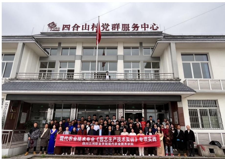
图 20 现代农业技术学院与合作单位开展学生专项技能实践

——学校工程技术学院工程技术学院持续与旭硕科技（重庆）有限公司依托现代学徒制试点项目，探索电子信息工程技术专业“任务 \Rightarrow 中心 \Rightarrow 工岗”现代学徒制人才培养模式。专业围绕工岗任务构建“一主线、三能融合”的课程体系，协同搭建校企互补的实践中心，校企双方共同制定人培方案、岗位考核标准、共同实施教学，三阶段工学交替的岗位实践形成特色。2023 年，21 级、22 级电信专业现代学徒制分别召开了阶段性实习总结会。与深圳市嘉立创科技发展有限公司联合开展《电子电路制图》课程改革实践，为电信专业 60 人 PCB 项目设计提供了支持。依托泸州市智能机电控制工程技术研究中心、泸州市李凌林铣工技能大师工作室、四川省高技能人才培训基地等平台条件，开展泸州市社区矫正人员培训 31 人，完成中级工培训 323 人，高级工培训 358 人。