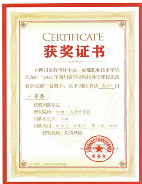
图 4 学校英语教学团队荣获外语课程思政教学比赛一等奖