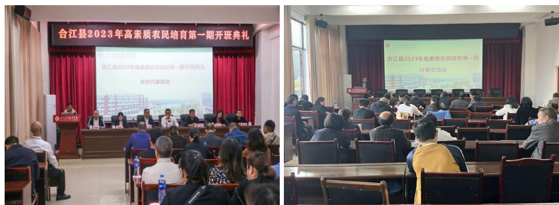
图 28 学校开展高素质农民培育