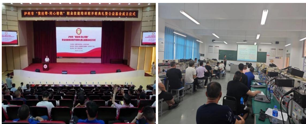
图 25 学校对社区矫正人员开展职业技能培训

学校受泸州市司法局委托，于 2023 年 5 月 29 日至 6 月 2 日期间，对 50 名社区矫正对象和强制隔离戒毒人员开展了泸州市“黄丝带·同心帮教”职业技能培训，培训内容包括专业技能、心理健康、安全教育等方面，帮助他们为往后的就业打下了基础。