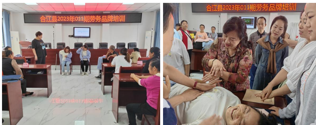
图 23 学校开展劳务品牌培训

学校受合江县人社局委托,于2023年9月至11月期间,先后开展了四期劳务品牌培训,培训专业老年护理135名,全部学员参加专项能力考核鉴定并获得专项职业能力证书。