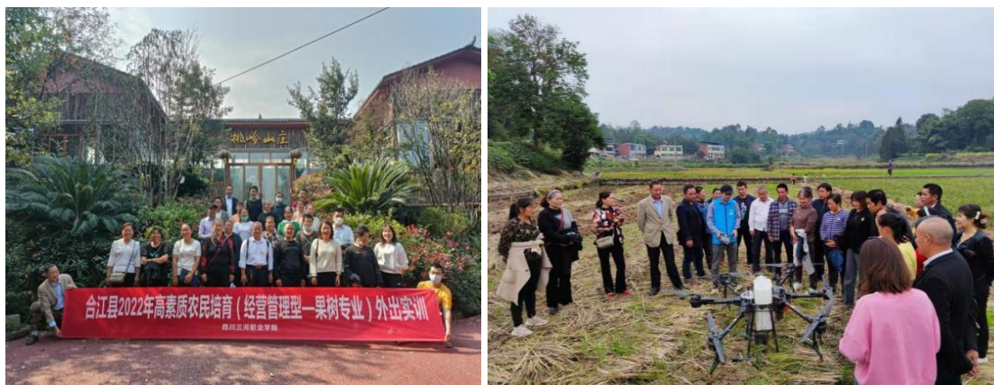
图 29 高素质农民知识、技能更新培训