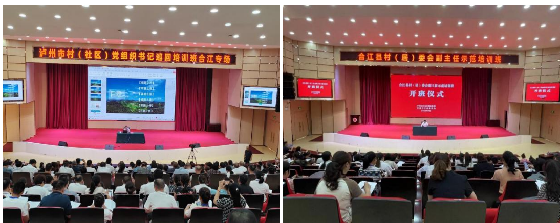
图 24 学校开展村社干部培训

学校受合江县组织部委托,于2023年4月至7月期间,先后开展5期村社干部培训。来自27个村社党组织书记、副书记、村委主任、监委主任、村文书等632人参加了培训。