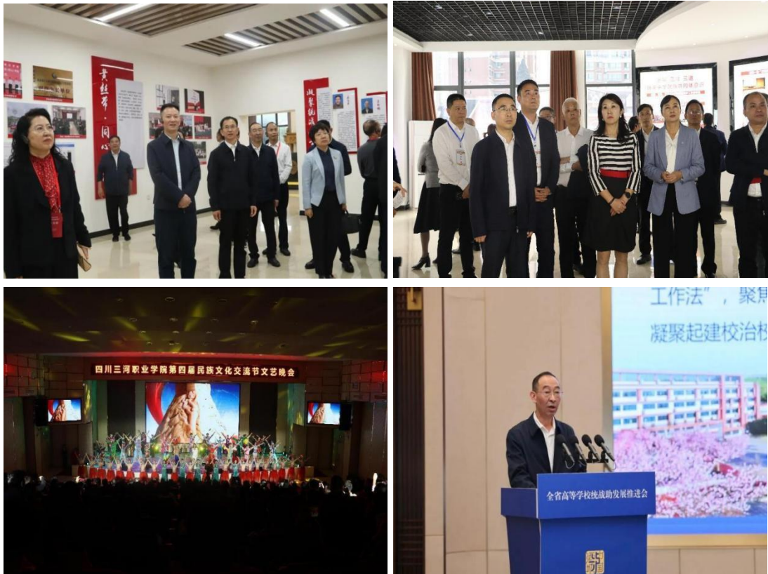
图1 统战部副部长陈武、教育厅副厅长石静等近200名领导莅临我校考察指导，参加民族文化交流节活动，学校党委书记叶昌伦在推进会上发言