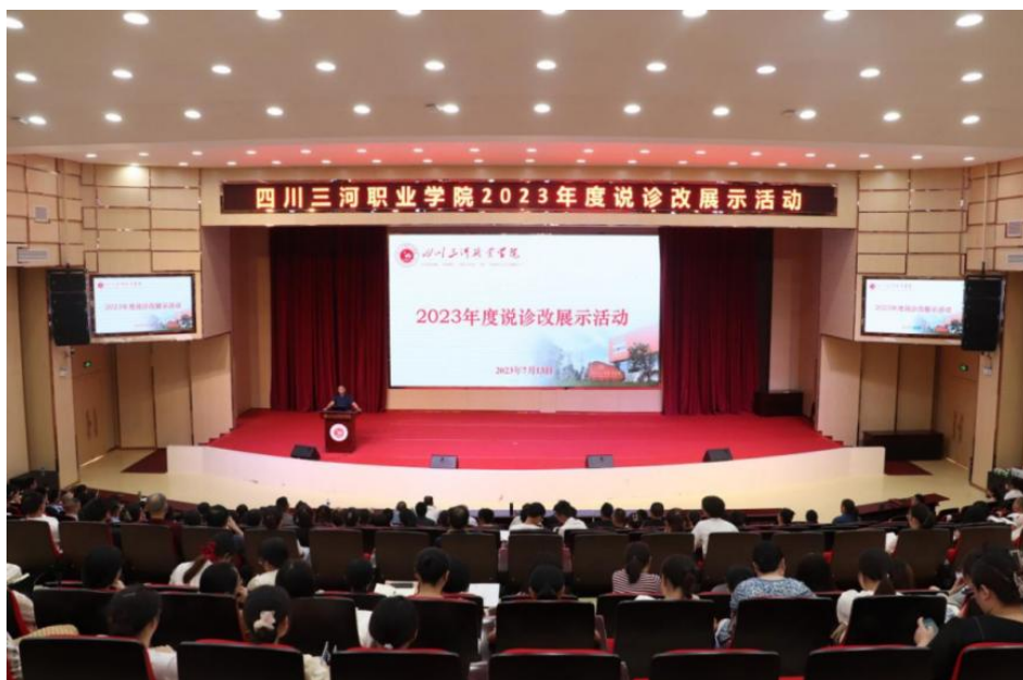
图5 学校持续深入开展诊改，常态化举办年度说诊改比赛