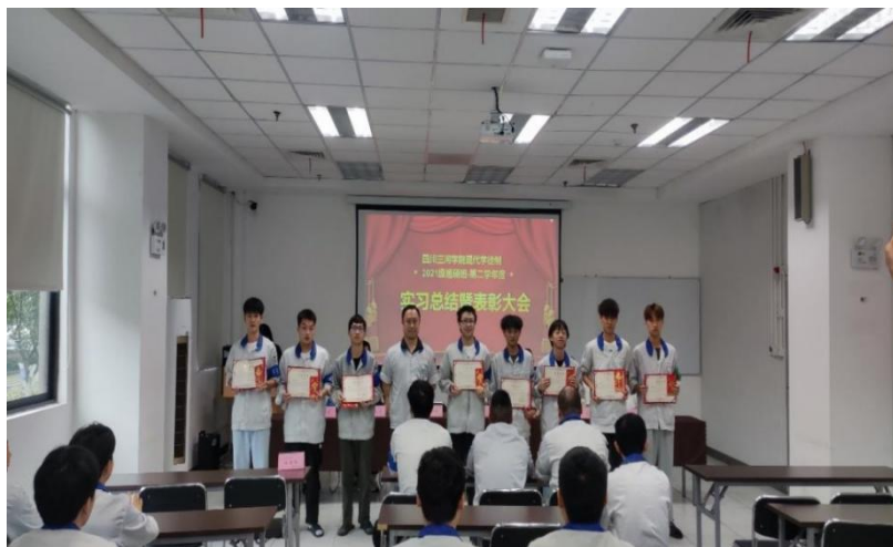
图 21 工程技术学院现代学徒制试点班级开展总结表彰会

——学校学前教育学院与合江县第一幼儿园、合江县第二幼儿园、合江县自强幼儿园、合江县快乐阶梯幼儿园、三河学院附属幼儿园等建立了深度的园校合作。2023 年，学前教育学院与合作园所建立“双导师制”，校外导师进入班级进行分享与指导 4 次，合作园所接收教师实践研修 25 人，园校合作共同开发教材《幼儿美术》，园校合作共同参加四川省教师教学能力大赛（二等奖），合作园所接收学校学生参加教育研习 430 人次，参加教育见习 1300 余人次。