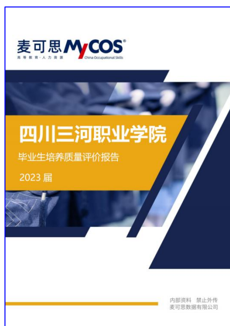
图 15 麦可思公司出具学校 2023 年毕业生就业质量年度报告

占比 87.6%。根据麦可思《四川三河职业学院 2023 年毕业生就业质量年度报告》显示：（1）2023 届毕业生就业相关度为 68%，平均月收入为 3892 元，薪资或职位有提升的占比 43%，就业于中国 500 强企业的占比 14%，就业满意度为 82%，对就业服务工作的满意度为 93%；（2）2023 届毕业生西部就业占比 89.5%、成渝地区双城经济区就业占比 68.6%、省内就业占比 75.7%（其中泸州 24.4%、成都 20.9%），主要就业行业包括医疗和社会护理服务业（33.6%）、教育业（8.9%）、建筑业（7.8%），学校的区域贡献度高；（3）此外，2023 届毕业生升学率为 15.35%，创业率为 5.8%。