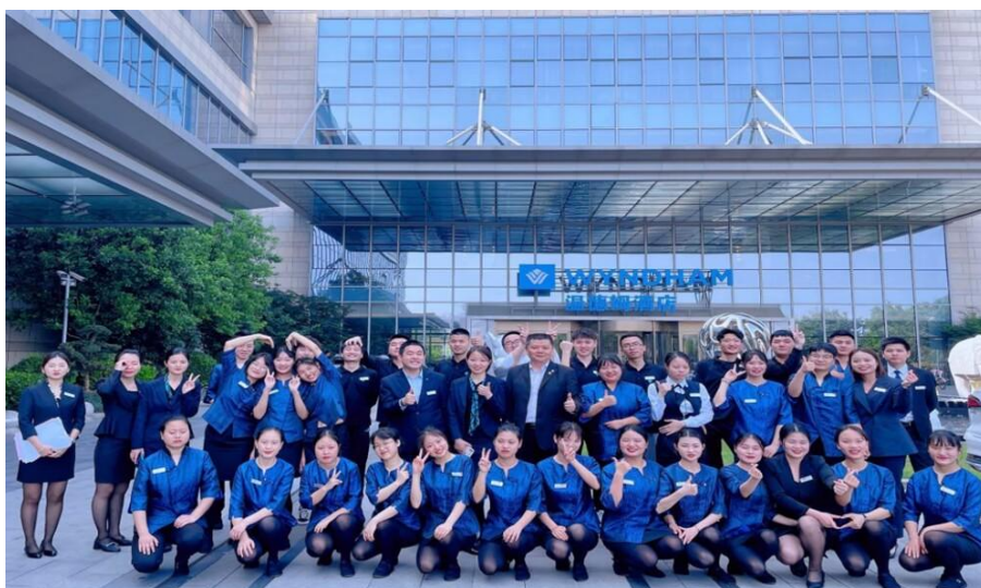
图 19 经济管理学院与合作企业开展课程“订单式”培养

——学校现代农业技术学院先后与泸州三益生态农业发展有限公司、泸州欣旺动物医院有限公司、四川省茶业集团股份有限公司、合江县现代农业园区服务中心等企事业单位开展合作，成功创建了泸州市合江县现代农业园区乡村振兴高技能人才培育基地、四川省第五批粮食安全宣传教育基地。2023 年邀请企业高级畜牧兽医师、高级农艺师到校开展 6 场专题讲座，共同培育县级高素质农民 270 人，组织学生参与真龙柚授粉、彩色马铃薯种植、蘑菇种植等农业生产实践 1080 人次。