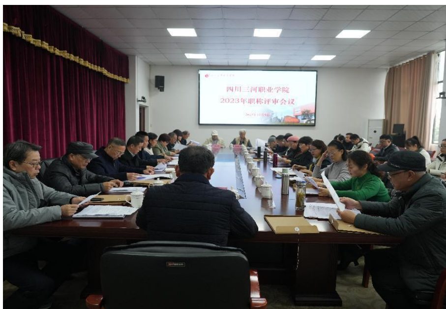
图 2 学校持续加强教师队伍建设，开展 2023 年度职称评审工作

师 98 人，其中高学历教师 71 人，高职称教师 6 人；评定副高级职称教师 6 人，中级职称教师 18 人，初级职称教师 60 人；组织教师参与岗前培训 106 人、国培 14 人、网络培训 982 人次、挂职锻炼 12 人、学历提升 1 人。