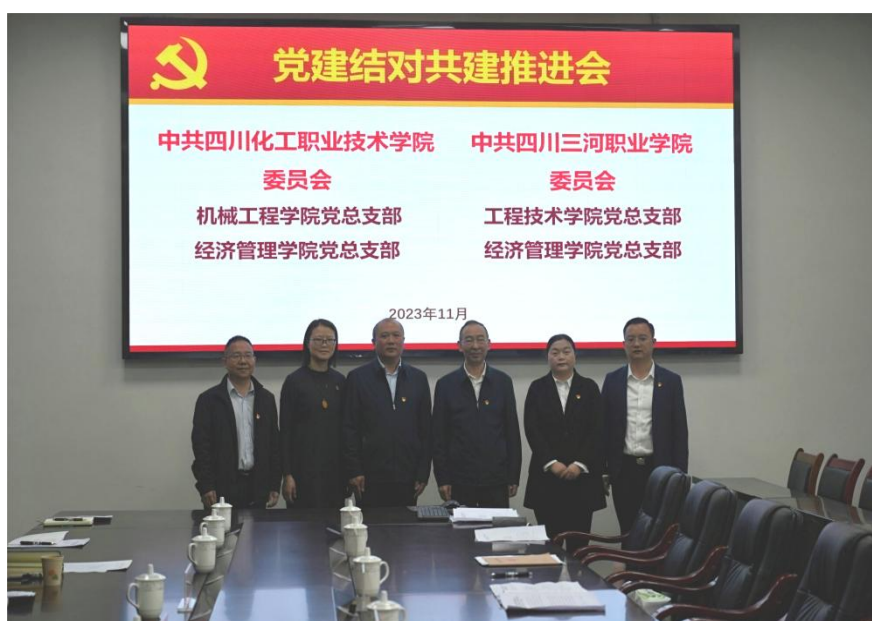
图7 学校党委与四川化院党委开展党建结对

《二级学院党政联席会议议事规则》等制度。落实干部“一岗双责”，定期召开思想形势分析会、网络意识形态专题会等，严格宣传信息发布审批，加强网络信息安全和舆情监管，抓好重大活动、重要会议和敏感时段安全稳定工作，思想教育持续加强。2023年9月，学校与四川化工职业技术学院党建结对共建，以党组织“1+2+2”模式深化合作，支部组织功能明显加强。