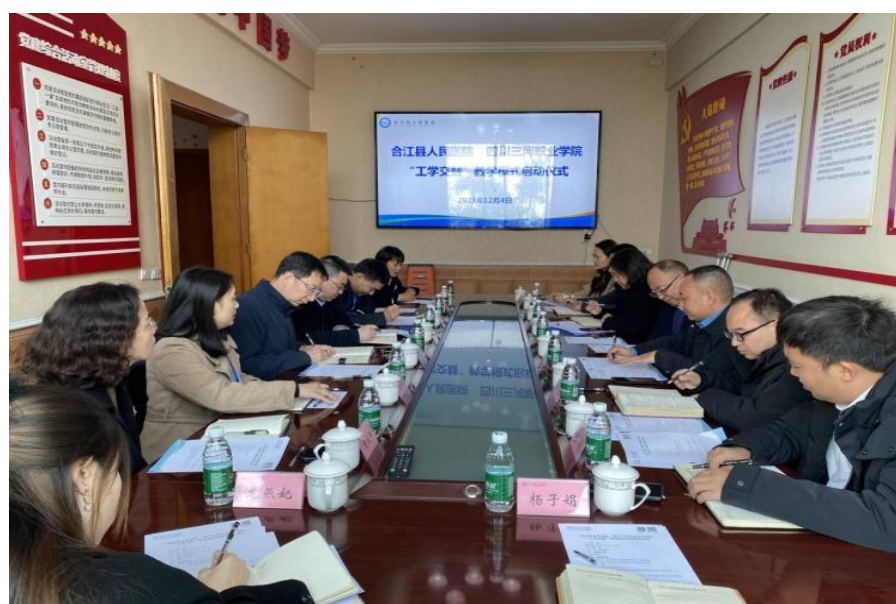
图 18 卫生健康学院与合作医院开展“工学交替”共同培养学生

——学校卫生健康学院先后与合江县人民医院、合江县中医医院、泸县人民医院共建四川三河职业学院非直管附属医院和双师型教师培训基地。2023 年，医院接收教师挂职锻炼 8 人，接收学生临床实习 2248 人次；学校培训医院员工 92 人次，聘请医院校外兼职教师 30 余人；与合江县人民医院举行“工学交替”教学模式，每两周为单位按班级滚动派出学生入医院见习。