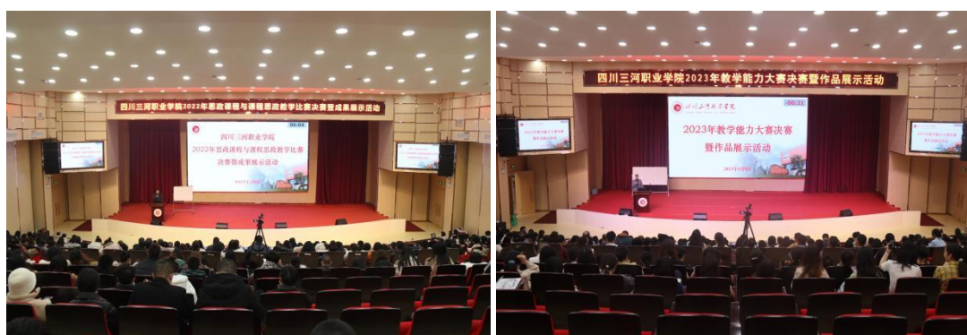
图 3 学校以赛促教，常态化举办课程思政教学比赛、教学能力大赛

2023 年，学校教师积极参加四川省职业院校教师教学能力大赛等省市级赛项，荣获奖项 13 项；教师积极投身科研教改，获批四川省教育厅、泸州科技局等省市级课题立项 35 项，发表论文 70 篇，获取专利授权 6 项，成果获各级各类奖项 10 项，详情见表 3-7：