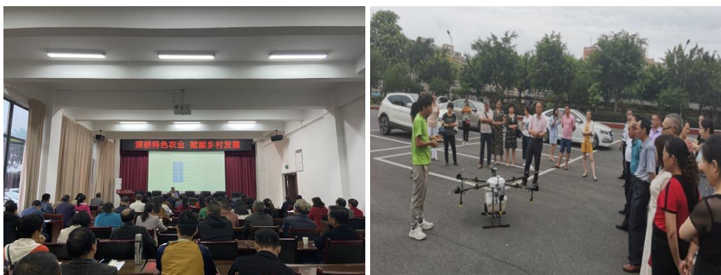
图 27 学校开展基层农技人员培训

学校受江阳区农业局委托，于 2022 年 10 月 17 日至 26 日期间，先后开展了 2 期基层农技推广人员培训，来自江阳区农业农村局和基层乡镇农技服务中心的 78 名学员参加了培训。