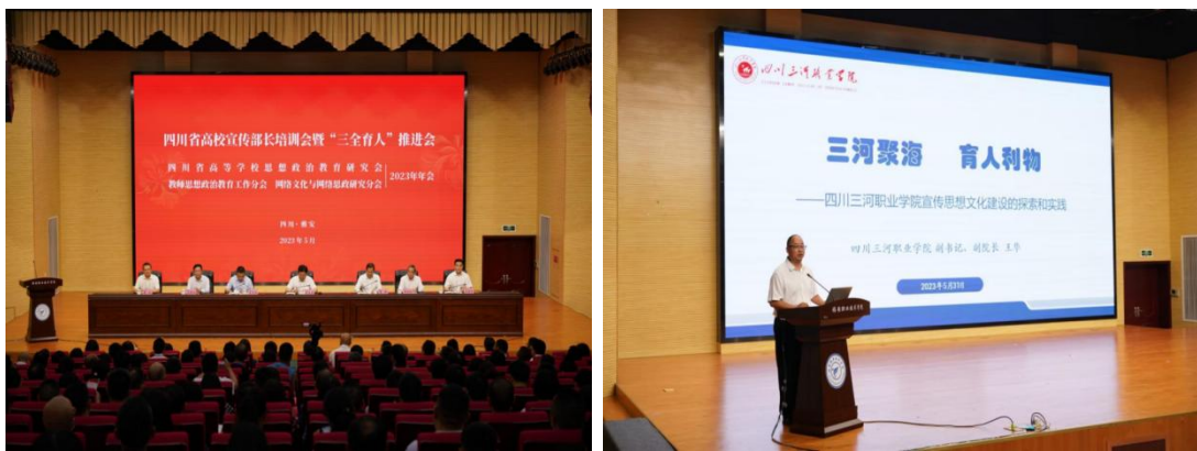
图 8 学校党委副书记王华在四川省高校宣传部长培训会暨“三全育人”推进会上发言