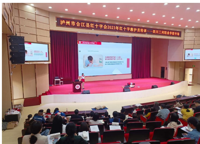
图 10 校红十字会开展学习活动

达镇等地举行了 6 次捐赠活动，合计衣物 600 余箱，折合人民币 50 余万元。