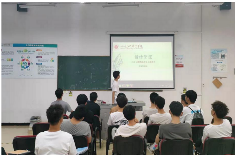
图9 学生开展心理健康教育主题班会