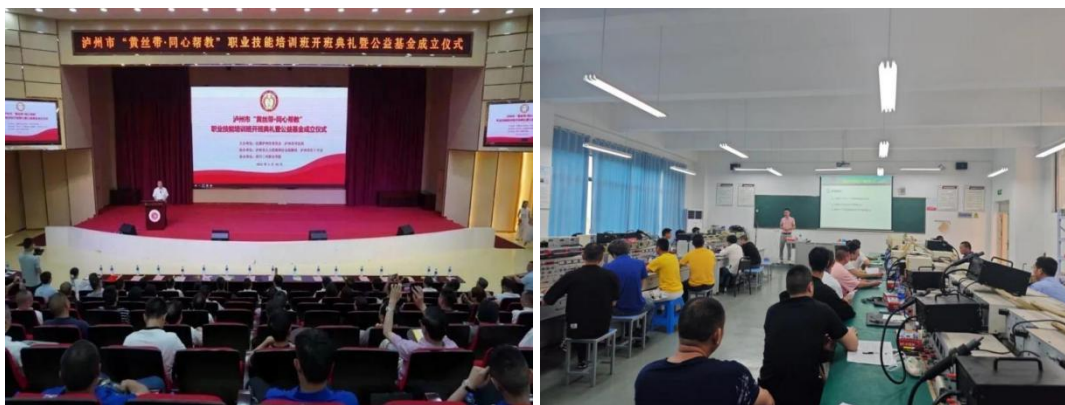
图 30 学校开展“黄丝带·同心帮教”职业技能培训