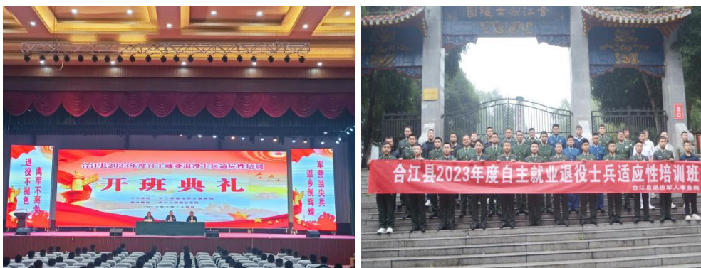
图 26 学校开展自主就业退役士兵适应性培训