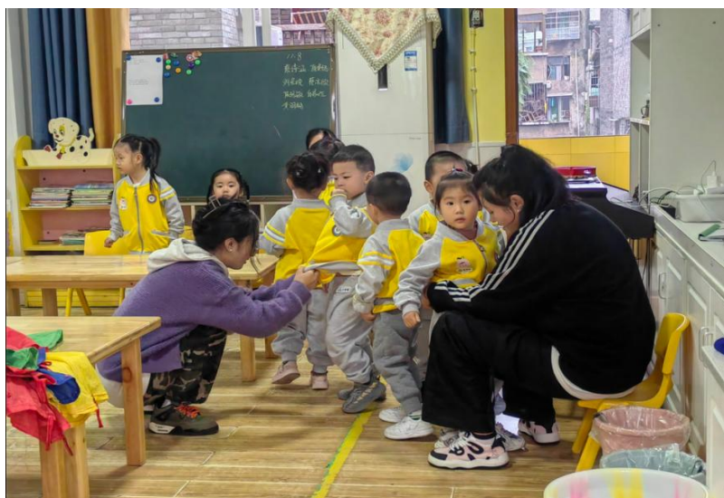
图 22 学前教育学院学生到幼儿园开展见习研习

——学校学前教育学院与合江县第一幼儿园、合江县第二幼儿园、合江县自强幼儿园、合江县快乐阶梯幼儿园、三河学院附属幼儿园等建立了深度的园校合作。2023 年，学前教育学院与合作园所建立“双导师制”，校外导师进入班级进行分享与指导 4 次，合作园所接收教师实践研修 25 人，园校合作共同开发教材《幼儿美术》，园校合作共同参加四川省教师教学能力大赛（二等奖），合作园所接收学校学生参加教育研习 430 人次，参加教育见习 1300 余人次。