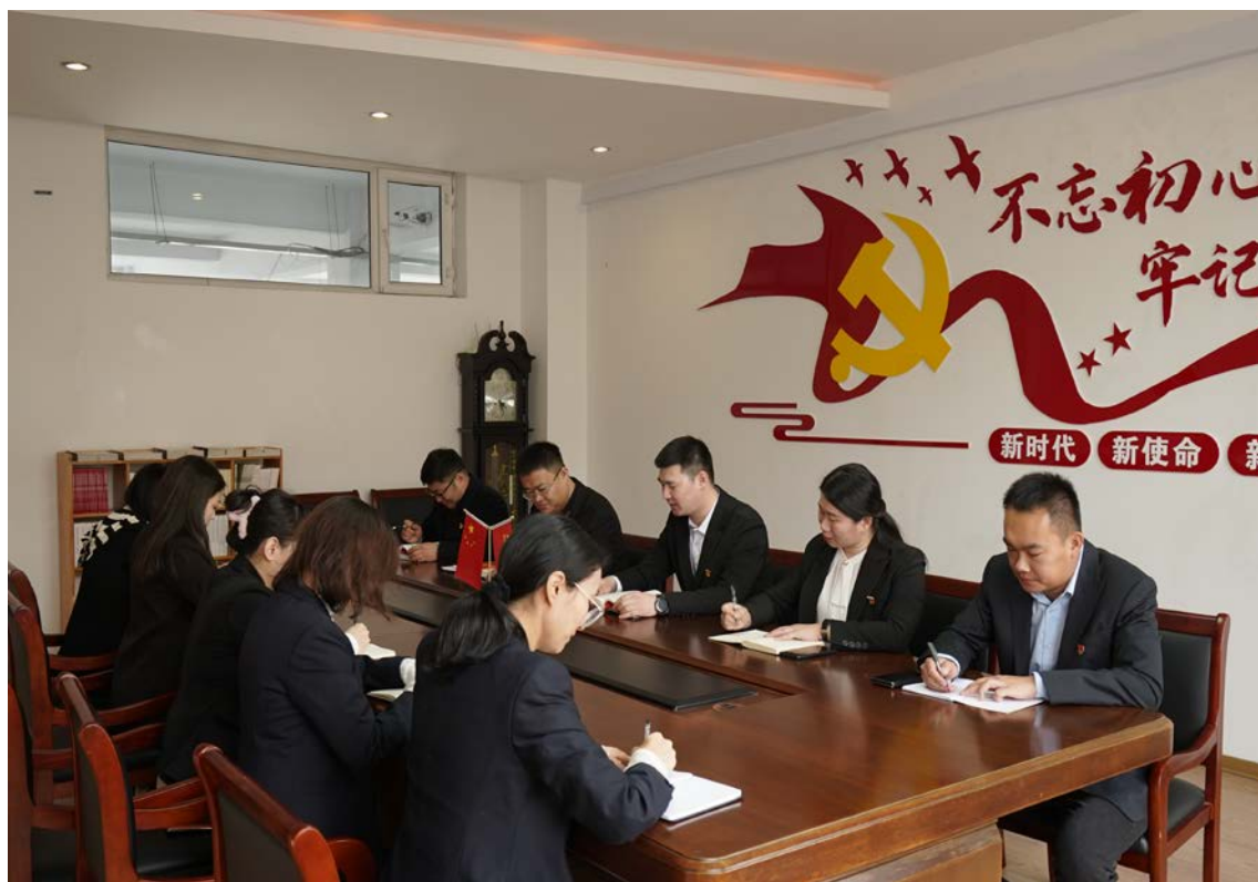
图 1-3 基层党组织理论学习

坚决做到“两个维护”。基层党组织理论学习如图 1-3 所示。结对共建签约仪式如图 1-4 所示。