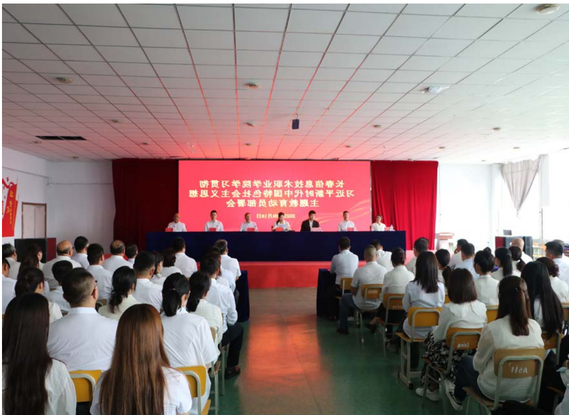
图 1-2 主题教育动员部署会