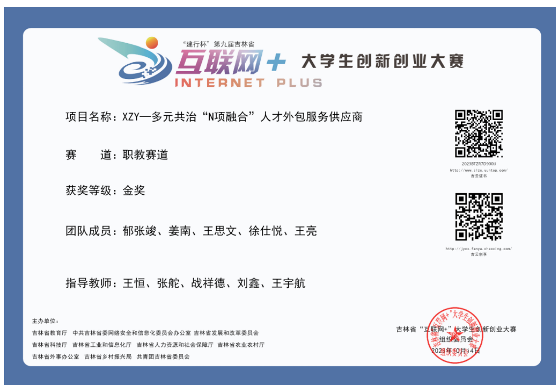
图 1-10 “建行杯”第九届吉林省“互联网+”大学生创新创业大赛获奖

学校充分发挥创新创业教育改革示范高校的引领作用，加强对学生的就业指导和创业教育，促进创新创业教育与教育教学改革深度融合。按照国家和省级赛事时间安排，积极组织师生参加各项赛事，并取得显著成绩。本学年，在第十一届中国 TRIZ 杯大学生创新方法大赛中荣获三等奖 2 项，并获优秀组织单位奖；在“建行杯”第九届吉林省“互联网+”大学生创新创业大赛中荣获金奖 1 项（如图 1-10 所示）、银奖 1 项、铜奖 6 项；在第九届“东方财富杯”全国大学生金融挑战赛中荣获国家级三等奖 1 项（如图 1-11 所示）；在 2023 年中国创新方法大赛吉林赛区比赛中获三等奖 1 项（如图 1-12 所示）；在吉林省第六届中华职教社创新创业大赛中荣获一等奖 2 项、二等奖 3 项、三等奖 5 项。