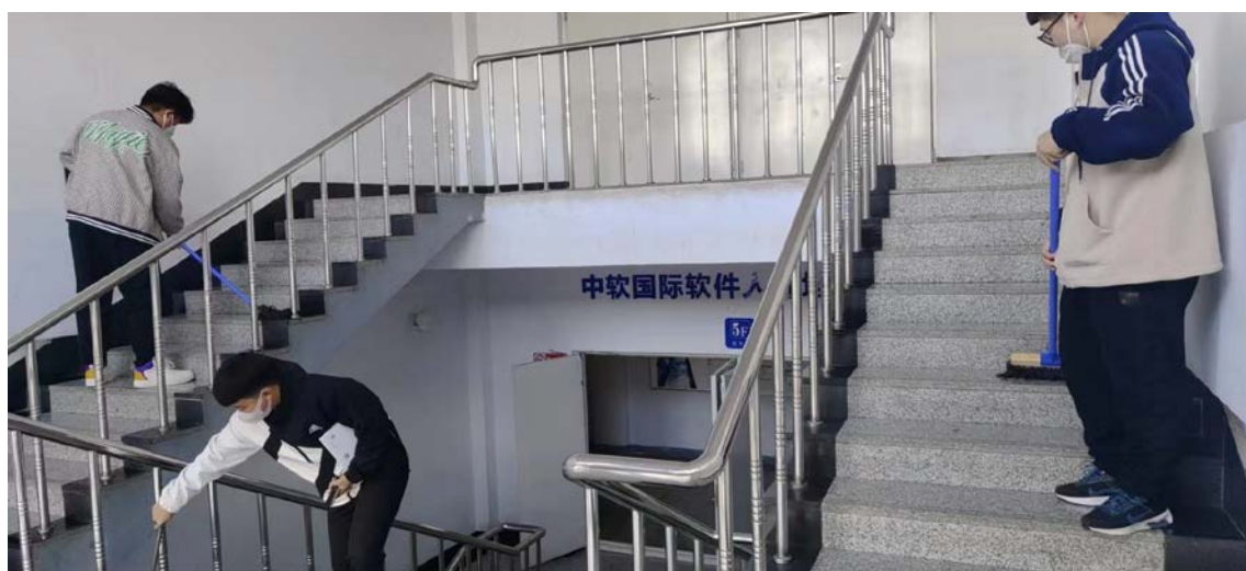
图 2-5 学生劳动实践

（二）把劳动实践教育与德育工作相结合。在劳动实践过程中，把德育工作与培养学生良好的行为习惯和掌握知识技能有机地结合起来，使学生的劳动实践成为强有力的教育手段。通过进行多种形式的劳动，在实践中对学生进行品德教育，使学生养成正确的劳动观点，获得比较全面的劳动知识，掌握基本的劳动技能，形成良好的劳动习惯，把学生培养成德、智、体、美、劳全面发展的人才。学生劳动实践如图 2-5 所示。