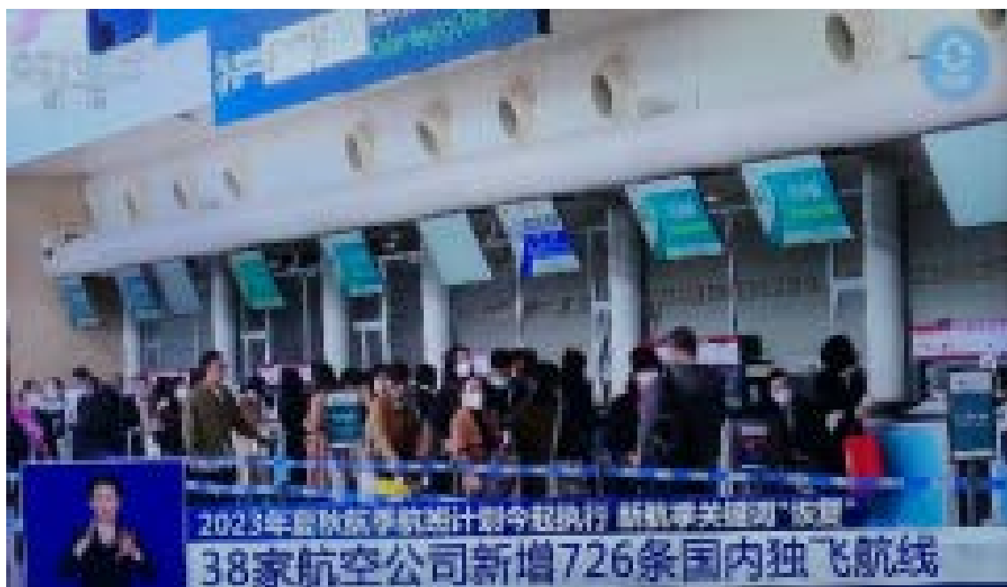
图 5-1 央视报道 2023 年国内航空运输业强势复苏

而且其职业发展空间更大，能够吸引数量更多、综合素质更好的学生来报考，为专业建设和发展提供了强劲动力和源泉。