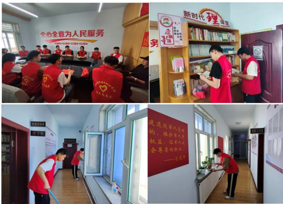
图 2-1 范家屯镇东河村村委会实践学习

促进社会文明，校团委组织校青马工程班、学习筑梦班、校学生会学生代表不定期前往学校附近的富强社区开展社区志愿服务活动。在每次开展社区活动前，校团委老师都会事先和社区工作人员进行对接，了解社区方面的相关诉求，根据工作需要，为志愿者团队策划并制定工作方案，有序开展社区服务工作。同时，依托我校在“志愿长春，爱在社区”长春青年志愿服务项目大赛中申报的“助力社区送温暖 筑梦青春志愿行”项目，发挥校园与社会协同育人机制，致力于引导更多大学生参与到社区志愿服务活动。如图 2-1、图 2-2、图 2-3、图 2-4 所示。