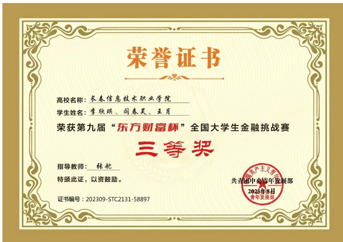
图 1-11 第九届“东方财富杯”全国大学生金融挑战赛获奖