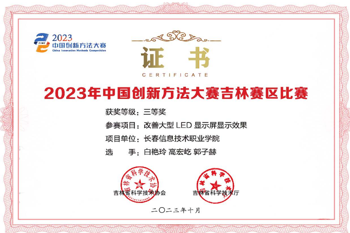
图 1-12 2023 年中国创新方法大赛吉林赛区比赛获三等奖