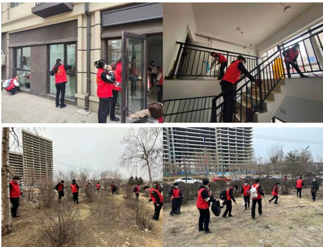
图 2-4 富强社区志愿服务