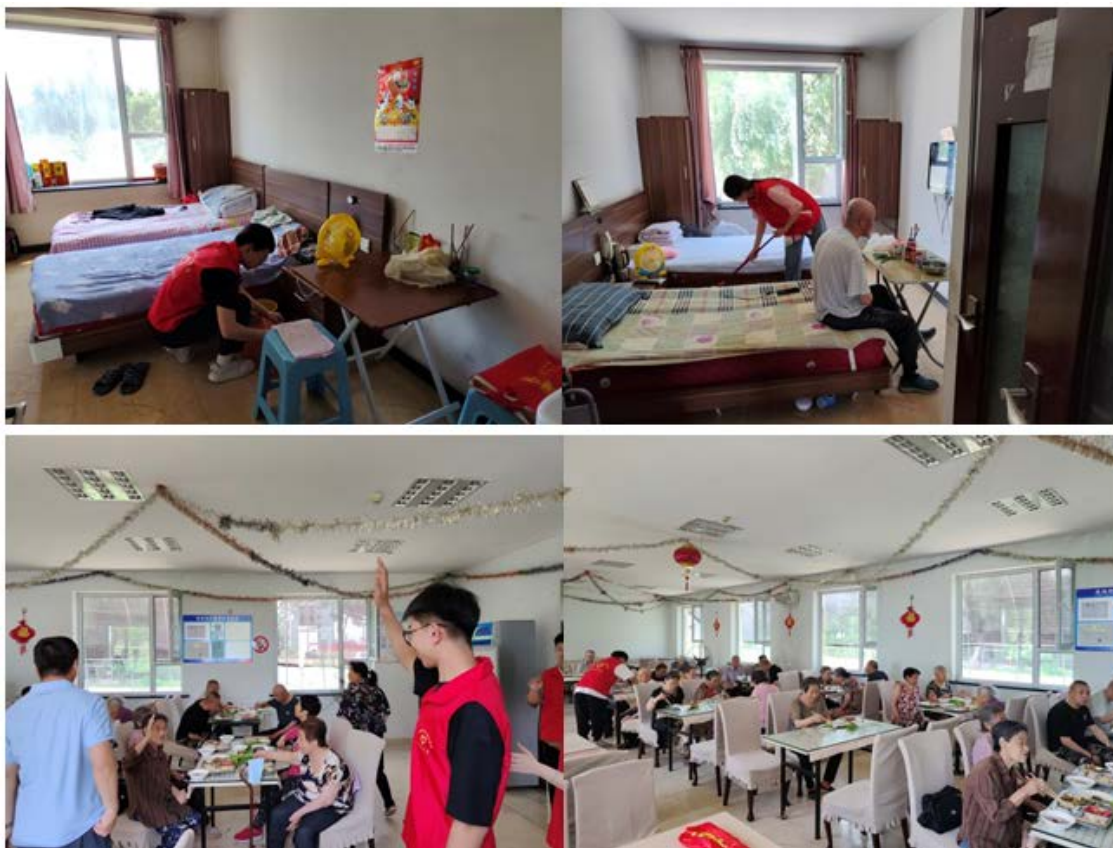
图 2-2 公主岭市爱老园敬老院志愿服务