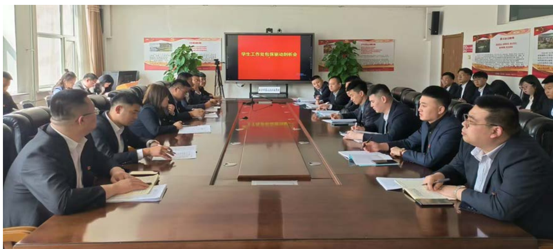
图 1-8 学生工作处包保驱动工作剖析会

引导学生理性认识疫情，提高自我防范意识。把疫情防控工作常态化与教育教学工作正常化有机融合起来，全面实施包保驱动管理机制，由包保负责人带领辅导员做好学生“一日三测温”、行程卡、吉祥码排查、学生心理疏导等工作，确保学校疫情防控工作无死角。