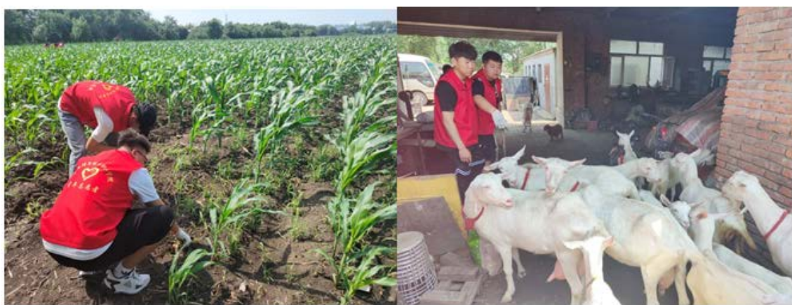
图 2-3 范家屯镇东河村六纵农间劳作