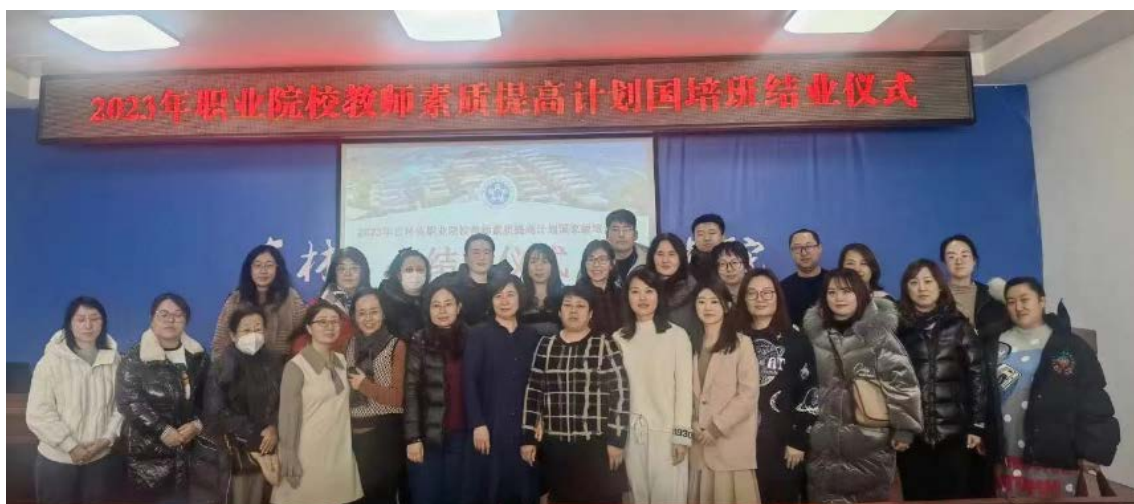
图 1-15 2023 年吉林省职业院校教师素质提高计划-教学质量评价国培