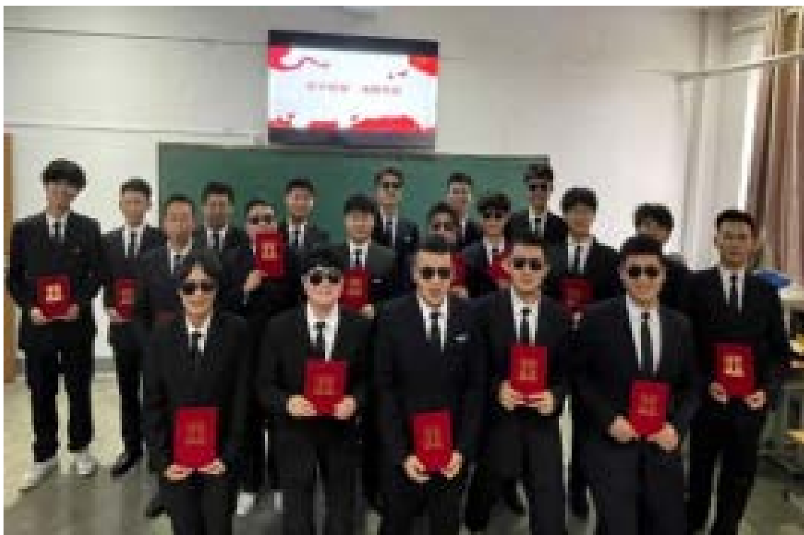
图 5-2 “航空报国 强国有我”系列活动获奖学生合影

赛、球类比赛等各种专业竞赛和文体活动。通过航空文化熏陶培育航空精神和工匠精神，为充分展示航空学子的良好形象和素质提升，搭建锻炼平台和提供机会，激发了学生勇争上游的朝气，实现了超越自我的目的，坚定了学好专业的信心，培育了航空报国、服务国家经济发展的理想信念，有效提升了就业应聘竞争力。