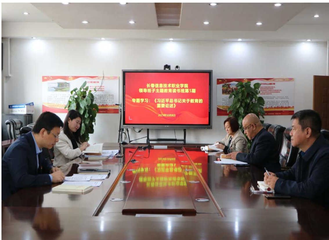
图 1-1 领导班子主题教育读书班

进教材、进课堂、进头脑,不断增进广大师生对党的创新理论的政治认同思想认同情感认同。在长春工程学院党委支持下,积极开展民办高校党建工作,开展了“同在党旗下,携手添光彩”结对共建活动,通过深化结对共建活动,促进党建工作、思政工作、教学科研等方面优势互补、共同提高。领导班子主题教育读书班如图 1-1 所示。主题教育动员部署会如图 1-2 所示。