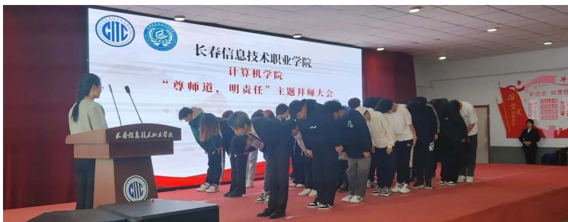
图 1-9 计算机学院举行 2023 级学生拜师大会

尊师重道，薪火相传。为进一步落实学校包保驱动工作，促进师生之间的交流与传承，2023 年 12 月 12 日，计算机学院在 618 教室举行 2023 级学生“尊师道，明责任”主题拜师大会活动（如图 1-9 所示）。计算机学院专业教师、全体辅导员教师、全体 2023 级新生参会。