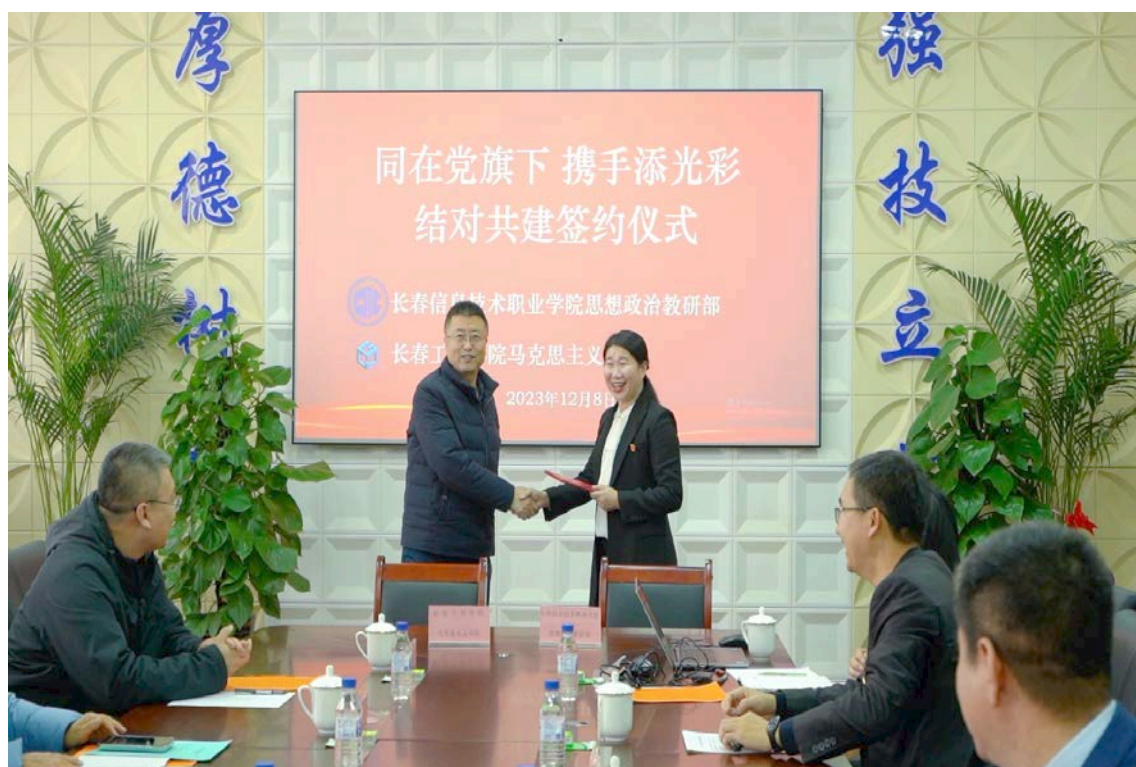
图 1-4 结对共建签约仪式