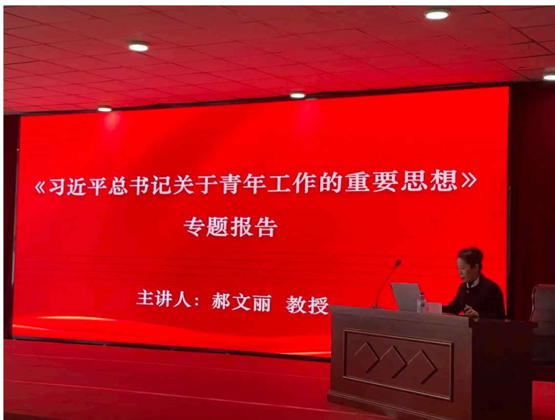
图 3-1 郝文丽教授作专题报告