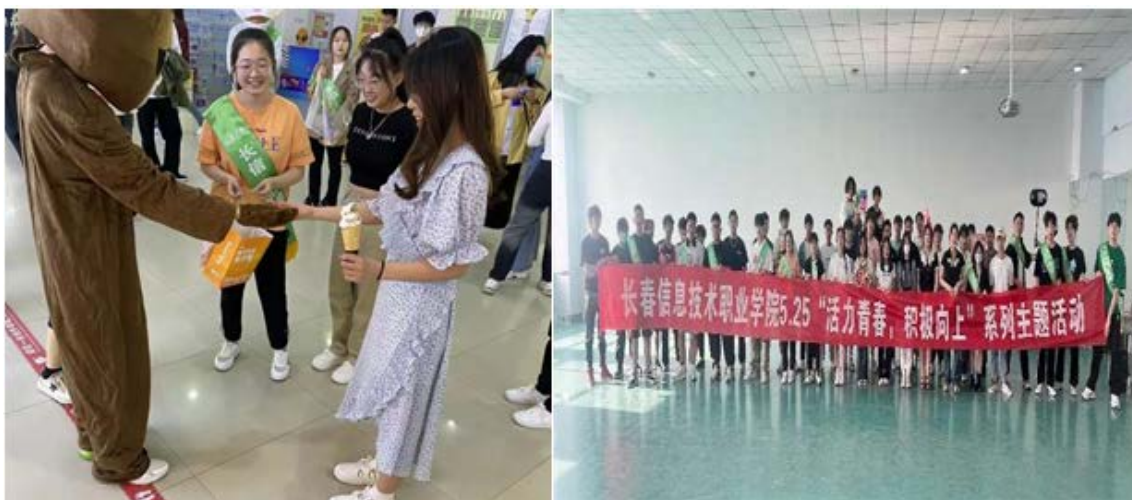
图 1-7 525 心理活动月活动

举行一系列大学生心理活动。其中校园快闪“锦心妙计”、“击打生活 boss”学生团体活动倍受学生们的喜爱和支持，通过这些活动的举办，使得同学们丰富了课余生活，激发积极情绪，身心收获愉悦。学校心理咨询与疏导工作组多措并举疏导学生情绪，24 小时解决学生心理困惑，通过微信、QQ 和心理直播多种形式，为师生心理健康保驾护航。