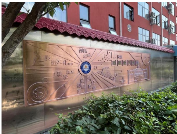
图 4-1 质量文化墙图

质量文化墙以中国质量文化的起源、发展、现状和世界质量成果为主元素，通过写实仿真的工艺手法融合中国国潮表现手法为基础，以小故事的表现形式融合到类浮雕的展示效果。文化墙结合校园文化特有的历史沉淀和青春活力，采用仿古铜和中国国潮的艺术表达方式传递文化信息，形成学院特有的质量文化宣传及沉淀。整个文化墙内容分为四个章节，第一章节为“质量之门：立德树人与质量强国”，第二章节为“质量春秋：规天矩地与璀璨文明”，第三章节为“质量时代：大国质量与大国崛起”，第四章节为“质量强国：美好生活与伟大复兴”。