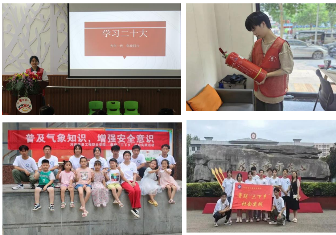
图 2-4 志愿者社会实践活动图