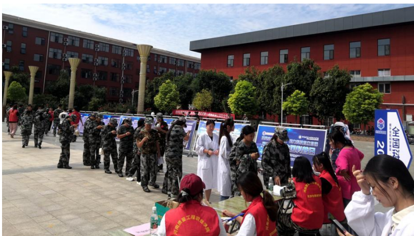
图 3-2 科普展览暨知识竞答活动图

2023 年科普展览暨知识竞答活动分别在主校区和示范校区举办。展览主要涉及食品安全、海洋污染、5G 通信、心理健康等内容，展览的同时举行了科普知识竞答活动。现场同学们积极参与活动，气氛热烈。此次科普展览及知识竞答活动普及了科学知识，提升了大学生的科学素养，丰富了校园文化生活，受到同学们的一致好评。