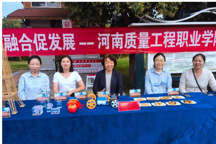
图 3-1 学院参加全国科普日主场活动图