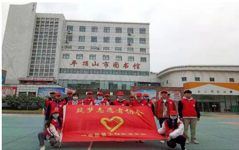
图 2-3 志愿者图书馆合影图

随后，志愿者们凭借自己的双手、右脑、积极的展开志愿服务，对馆内卫生清洁方面，志愿者们不怕苦不怕累，为广大读者提供了一个良好的读书环境。经过两个多小时的整理与打扫后，图书馆的书架焕然一新，各类书籍也排列整齐。本次活动，培养了志愿者“服务他人、奉献自己”的志愿服务精神和社会会测人敢，还在弄的书卷香中传递了“激杨青春、书写奉献”的爱心和精神，塑造了新一代的新青年形象。