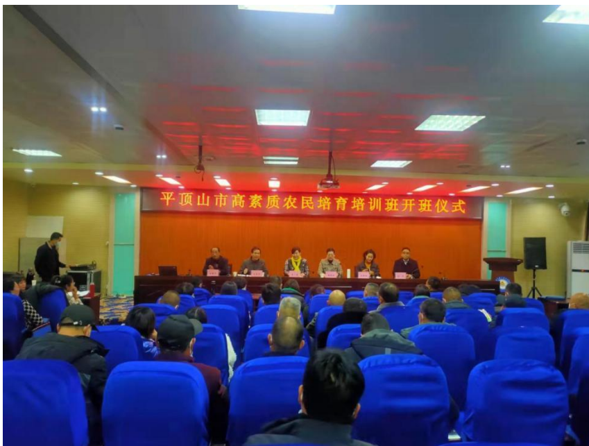
图 3-4 高素质农民培育培训图

为此我院与平顶山市农业农村局主办、河南省广播电视学校平顶山市分校联合举办了 2022 年高素质农民培育培训班。本次培训共有学员 109 名，全部为来自农村生产一线的致富能手，农业企业家、种粮大户等，培训时常 9 天，培训内容分课堂讲授和实地考察两部分，在我院的精心组织和相关单位的积极配合下，此次培训取得了良好的效果，获得了广大学员的一致好评。