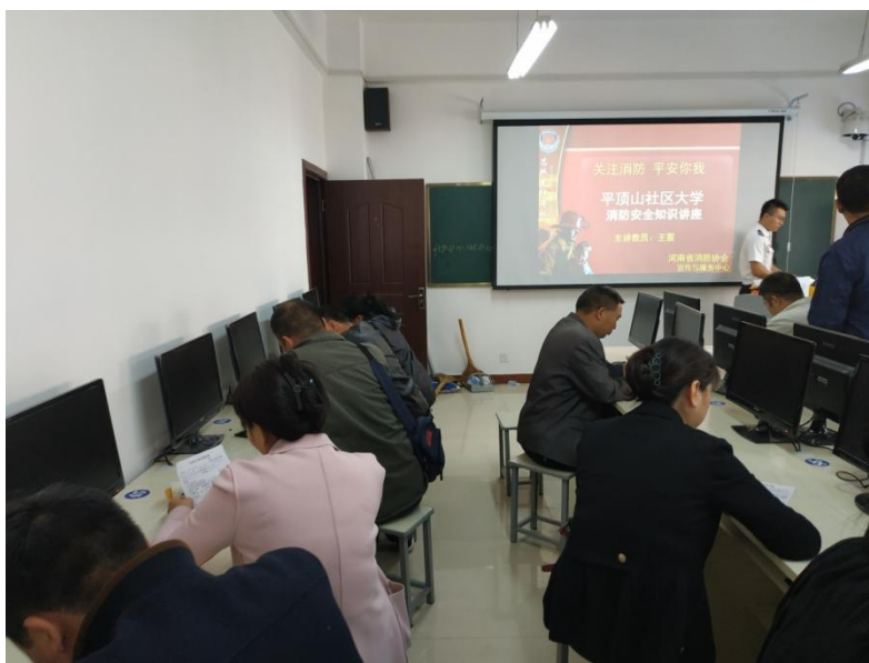
图 3-5 消防局专家讲解消防安全知识图

此次社区大学与神马集团联合举办的消防安全知识讲座，不仅提升了大家的消防安全意识，也为构建和谐、安全的社会环境做出了积极的贡献。