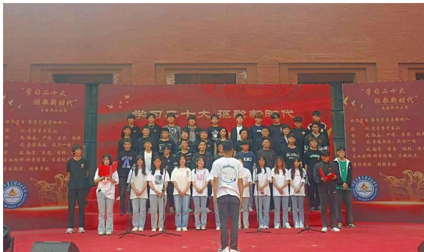
图 7-1 学院学生爱国歌曲展演图

成为国家的栋梁之材。希望广大师生进一步激发荣誉感、使命感与责任感，不忘初心，牢记使命，砥砺前行，以更加昂扬的精神状态、以奋斗不息的精神彰显新担当，展示新作为，树立新形象。