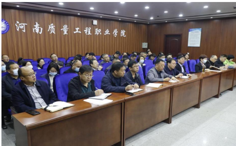
图 7-3 学院召开创建全国文明城市工作推进会图

学院喜获“河南省文明校园标兵”称号，这是我院精神文明建设工作取得的又一重大标志性成果。