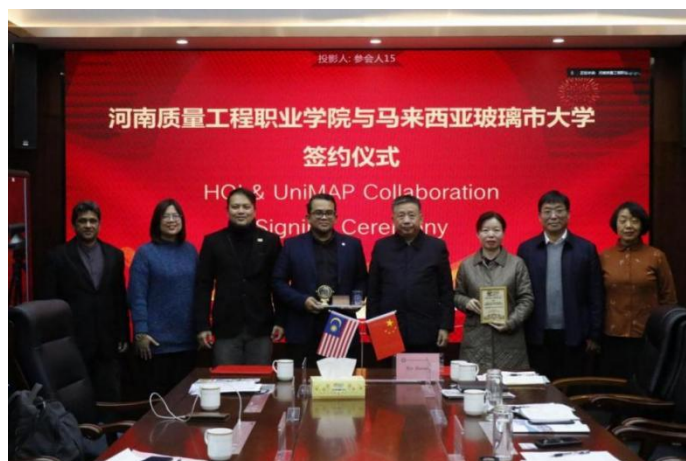
图 5-1 马来西亚玻璃市大学访问学院图