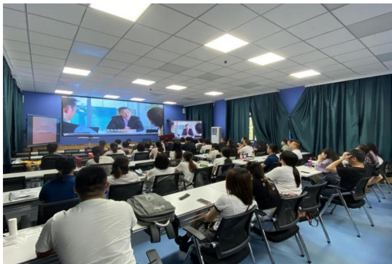
图 3-3 职业技能等级培训图

农村讲政策、教操作、解疑惑，了解培训需求，建立需求清单，开发针对工种考核的培训课程和网络学习软件，指导各二级学院制定培训方案、调整培训内容、开展技能等级认定。2022年在社评机构原有8个职业（工种）的基础上，追加申报职业（工种）18个，主动深入县区和农村，完成职业技能等级认定培训4000人次，组织取证3100余人次，取得良好的社会效应和经济效益。