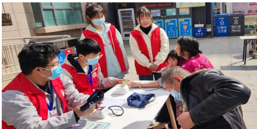
图 2-2 社区群众测量血压图

志愿者与社区工作人员配合，整理此次活动所需物品，向社区中老年人群体进行健康宣传，并在多个服务点为社区群众测量血压，为患有高血压和低血压的社区群众普及预防和治疗知识。此次社区志愿服务活动的开展，满足了社区广大群众的健康需求，受到社区干部和群众一致赞赏。志愿者们锻炼了沟通交流能力，了解认识社区工作的不易，也为基层社区的治理贡献质院青年的应有之力。