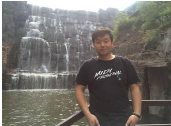
图 2-6 毕业生就业典型图二