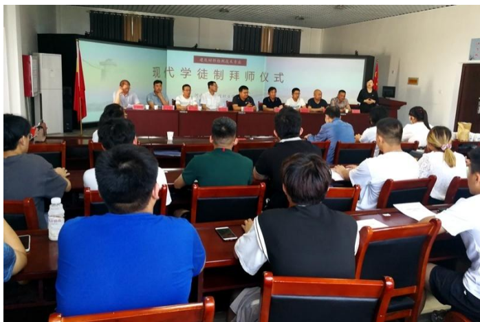
图 6-2 现代学徒制拜师仪式图