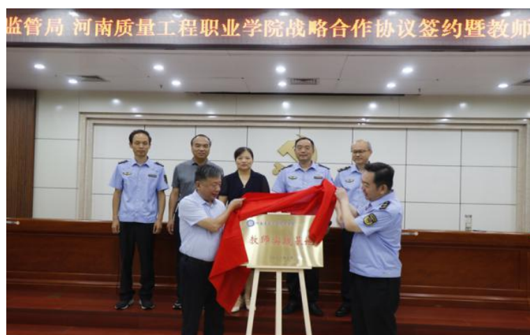
图 6-1 学院与市场监督管理局签订战略合作协议图

为充分发挥高等职业教育服务区域经济发展的功能，为平顶山市“壮大新动能、奋进百强市”提供质量基础，7月13日与平顶山市市场监督管理局签订合作协议，双方在促进产业升级，检验检测，产教融合，社会培训等方面开展深度合作，构建全方位、多层次、宽领域的合作格局。围绕共建质量产业学院、共建实习实训基地、共建平顶山市质量科研中心、共建平顶山市质量教育培训基地、共建平顶山市质量检验检测技术公共服务平台、共建平顶山市中小学质量教育科普基地、共建中原质量文化馆、共建平顶山市质量服务专家团队、共同推进职教集团实体化运作等多方面工作内容，展开了揭牌仪式。