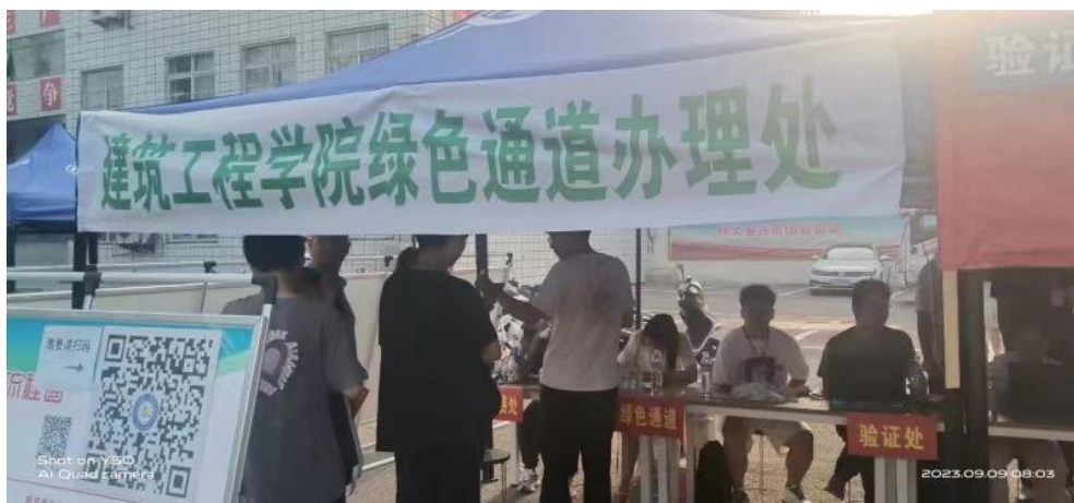
图 2-1 资助政策服务宣传图

学校资助中心宣传建档立卡资助政策，拉近家校、师生的距离，增进感情，凝聚共识，传递党和政府以及学校的关爱，搭建学校与学生、家长和社会的良好沟通平台，提升资助工作水平和资助效果。