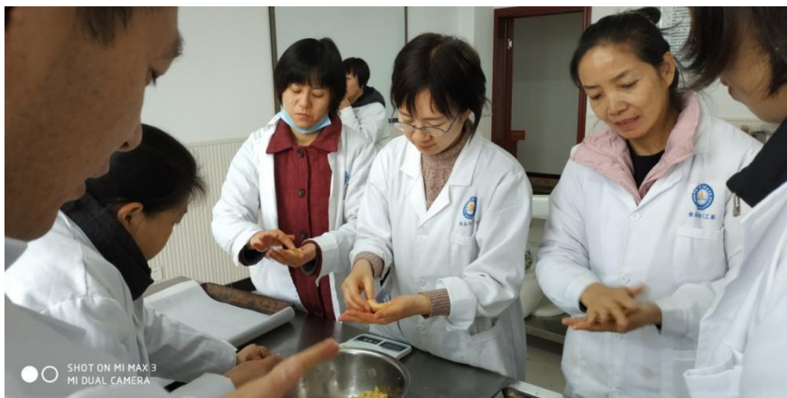
图 3-6 教师培训烘焙企业图