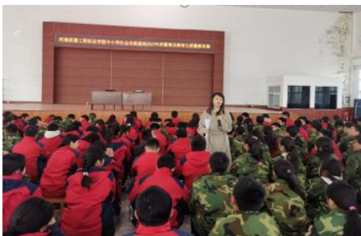
图 7-2 学院教师进行中小學生素质教育图

下一步，学院将进一步优化讲师团队，丰富教学内容，创新教育教学方式，使中小學生质量普及教育工作成为我院质量特色、服务社会的一张“教育名片”，以此打响我院“特色名片”，为提升全民质量意识，普及质量知识，实现质量强市，助推区域经济社会高质量发展做出贡献。