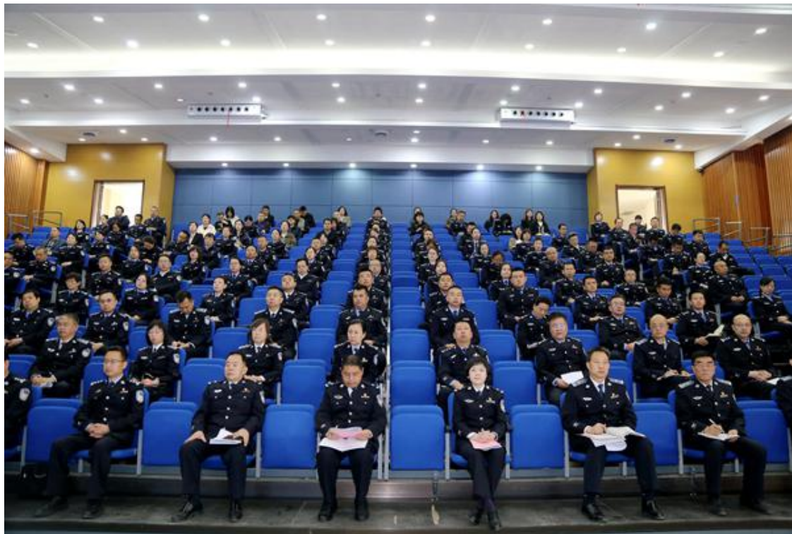
学院教职工参加动员部署会议

有机结合、一体推进，确保圆满完成主题教育各项任务；要全力抓好组织领导，在笃行担当上下功夫，要把从严从实要求贯穿主题教育的全过程、各方面，精心组织、周密安排，压实责任、强化指导，在全院范围内掀起开展主题教育的热潮。