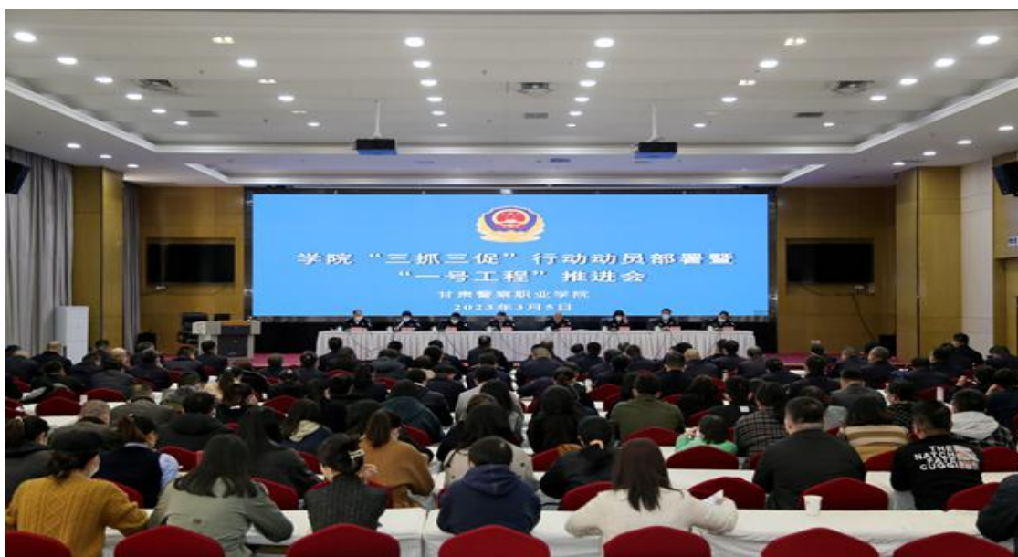
学院组织召开“三抓三促”行动动员部署暨“一号工程”推进会

先后召开十余次动员会、推进会、研讨会，解读升本政策、细扣指标内涵、分析困难问题、提出推进措施。针对师资数量结构、仪器设备总值、土地校舍产权、学科专业基础等重点指标存在的薄弱环节，领导小组统筹谋划、集中攻坚。厅党委会议专门听取了相关情况汇报，研究决定将“五基地一中心”所属共计 9965.567 万元的科研仪器设备资产无偿调拨学院。在全厅各部门警种选派 72 名具有研究生学历或高级专业技术职称，同时有高校教师资格的民警，聘任为学院兼职教师，为“双师型”教师队伍注入了新的活力和支撑。积极向省委编办、省人才办、省机关事务管理局等主管部门汇报协调，将学院纳入省属高校急需紧缺专业目录，争取到 65 名编制，招录引进 52 名高层次人才。全力推进完成 700 亩土地及附属 21 幢建筑物产权登记事项，有力夯实了办学基础。