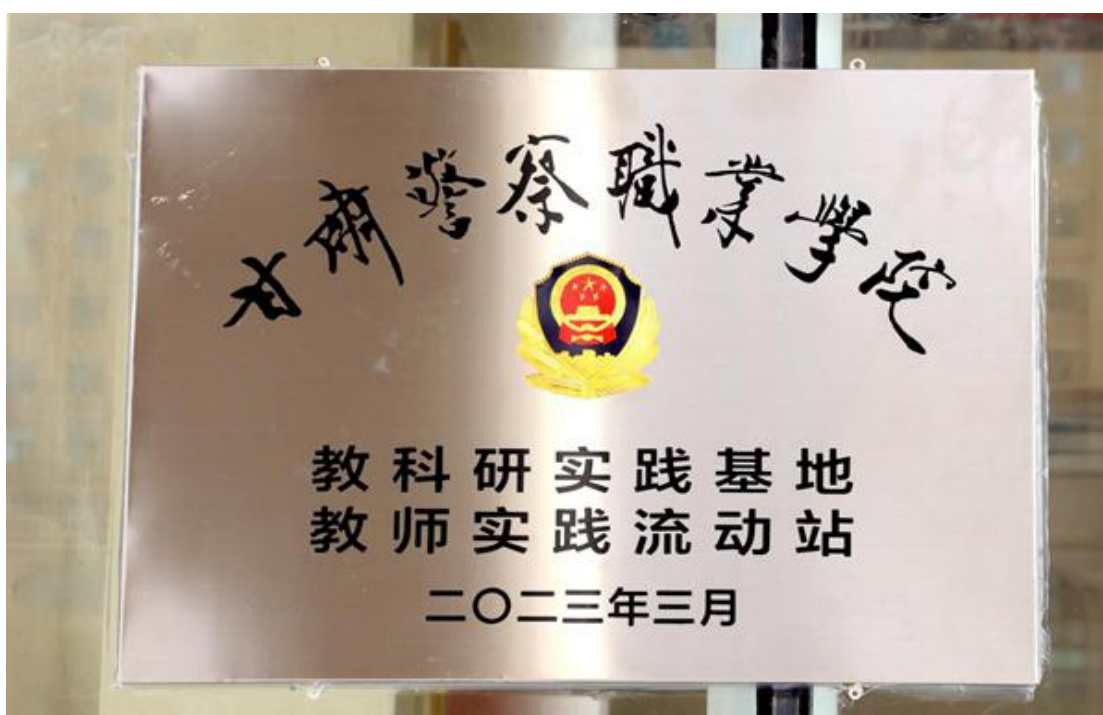
校外实践基地挂牌

学院与张掖市公安局开展“校局合作”，是双方实现资源共享、优势互补、协同发展的长远务实之举，对进一步加强基层公安机关执法规范化建设和提升公安院校服务公安工