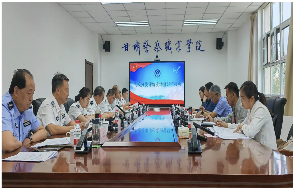
学院组织召开分类评价督导汇报会

督导工作期间，专家组实地走访警犬基地、射击馆、安检安防实验实训中心、刑事侦查系实训基地、警训馆、甘肃警察博物馆等，并实地观摩犯罪现场勘查和城市街道暴骚乱处置模拟演练。分别与学院班子成员、中层干部代表、教师代表、学生代表进行了座谈交流。