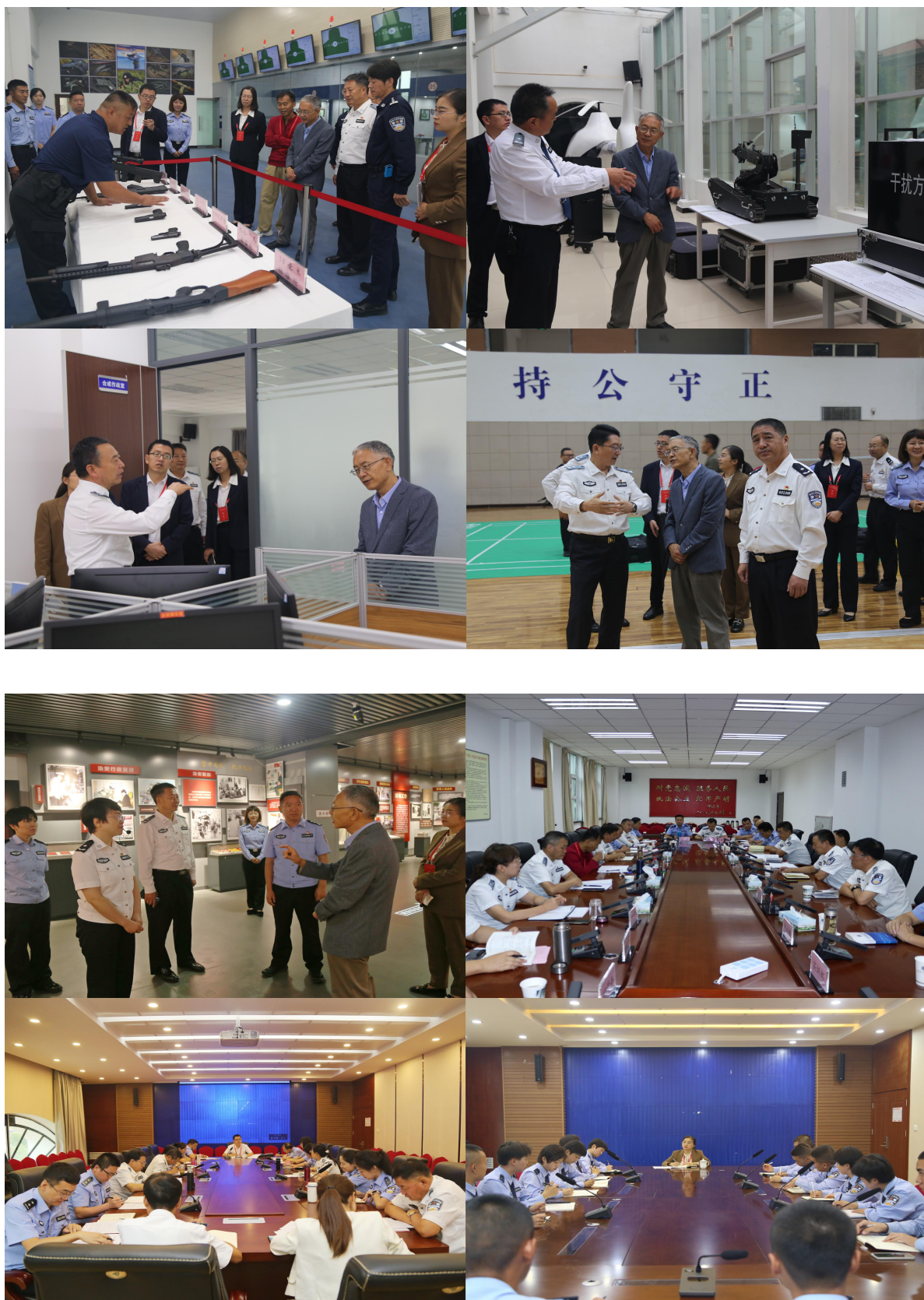
专家组开展实地督导工作