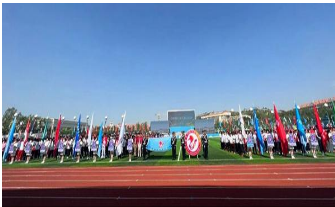
参赛院校代表队入场仪式

省体育局主要负责同志，省委宣传部、省发展改革委、省科技厅、省公安厅、省财政厅、省人社厅、省卫健委、省应急厅、团省委、省妇联相关负责同志，省内各高校主要负责同志，兰州市及皋兰县相关负责同志，省田径、武术、羽毛球、排球、乒乓球、篮球协会负责同志，各高校代表团成员、运动员、教练员，各比赛项目技术代表，以及捐助单位代表、社会各界群众代表和媒体代表，陕西、青海和内蒙古等兄弟省份教育厅相关负责同志参加开幕式。