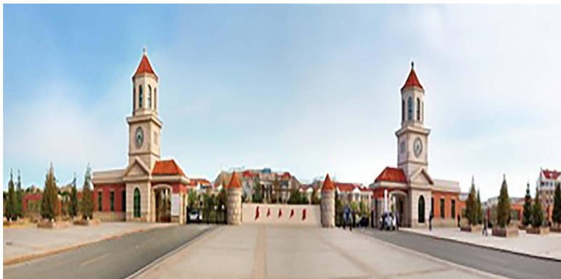
甘肃警察职业学院新校区

本馆以学院 74 年的风雨奋斗历程为脉络，着力讴歌甘肃公安队伍各个时期对学院建设发展作出突出贡献的英雄模范与典型代表人物的精神风貌，激励全体教职员工艰苦奋斗、自强不息、矢志不渝、砥砺前行。