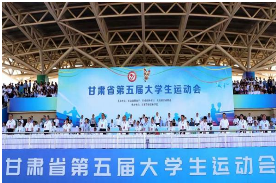
甘肃省第五届大学生运动会隆重开幕

7 月 24 日，甘肃省第五届大学生运动会在甘肃警察职业学院隆重开幕。大运会组委会主任、甘肃省人民政府副省长李刚出席开幕式。大运会组委会副主任、省政府副秘书长王晓阳主持开幕式，大运会组委会副主任、省委教育工委书记、省教育厅党组书记、厅长张国珍致开幕词，大运会组委会秘书长、省公安厅党委委员、政治部主任杨喜军致欢迎辞，运动员代表景祺、裁判员代表曹明宣誓。