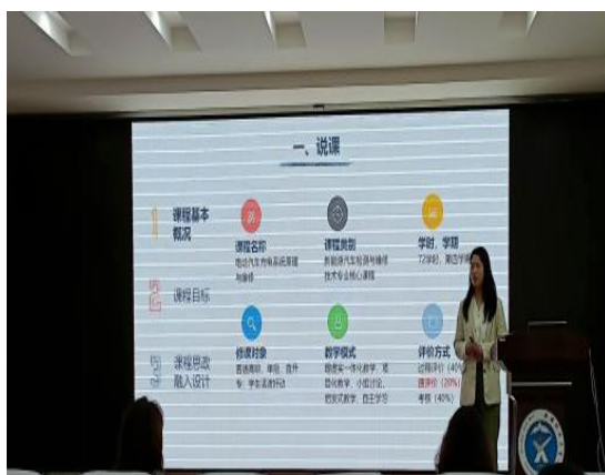
图 1-1 教师展示课程

沙龙分为主持、展示、讨论、点评、指导、交接等环节，随机抽取的薛喜红老师展示了《电动汽车充电系统原理与维修》的说课、教学设计及示范教学，分享了实际教学过程中的课程思政设计方案与学生反馈情况，从遵守行业规范着手，培育学生树立安全责任意识与终身学习的意识。