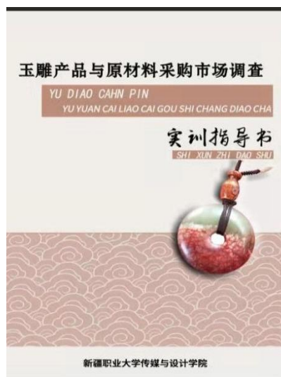
图 2-2 校内实训指导书