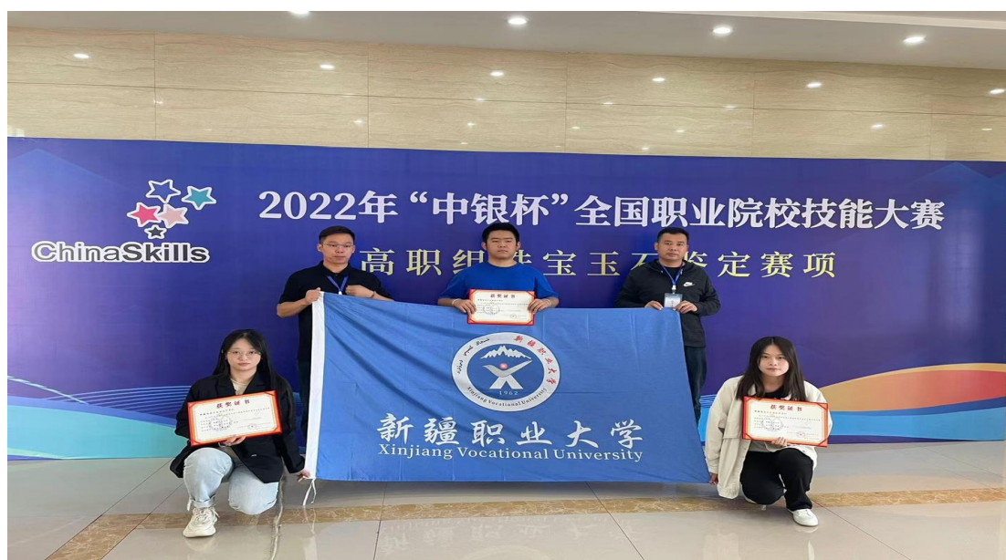
图 1-4 荣获全国职业院校技能大赛三等奖

在做好疫情防控的同时，积极组织开展“互联网+大学生创新创业大赛”“新疆首届职业技能大赛”“职业院校技能大赛”等各类竞赛，共计荣获各类竞赛一、二、三等奖共计29项，其中传媒与设计学院代表队荣获全国职业院校技能大赛珠宝玉石鉴定赛项团队三等奖。职业教育活动周活动，参与教师260人，参与学生19500人次，学生参与覆盖率达100%，参与企业3家，观摩体验活动项目36项。