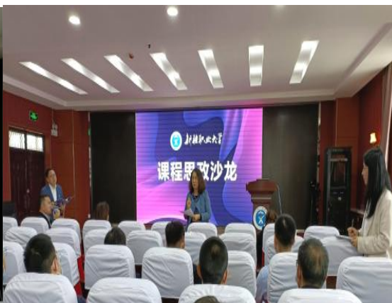
图 1-2 专家点评

1.2.3 统筹做好铸牢中华民族共同体意识各项工作。 深入学习贯彻习近平总书记视察新疆重要讲话重要指示精神，认真贯彻落实中央统战工作会议、民族工作会议、第三次中央新疆工作会议和自治区相关会议精神，将铸牢中华民族共同体意识写入学校党委一届六次党代会报告，纳入党委重要议事日程，常委班子与马院教师定期集体备课会，常委会专题研究铸牢中华民族共同体意识的教育教学，压实党委主体责任。注重发挥思政课的主渠道功能，将《中国传统文化》等教程列入教学课程，将中国新疆历史印记泥塑、民族团结十字绣融入第二课堂教学，让铸牢中华民族共同体意识可写、可画、可演、可讲。坚定不移推广普及国家通用语言文字，促进各民族师生交流交往交融。