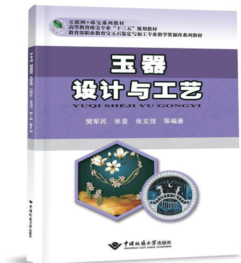
图 2-1 规划教材《玉器设计与工艺》