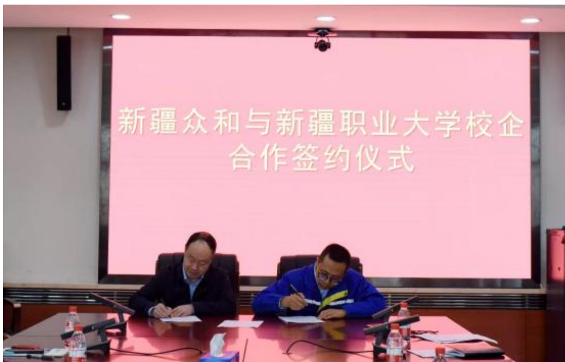
图 2-3 校党委常委、副校长徐耀宗和新疆众合股份有限公司总经理薛冰签订订单班合作协议

新疆众合股份有限公司总经理薛冰对新疆职业大学校领导的到来表示热烈欢迎，人力资源部部长董国文介绍了实习学生基本情况，实习指导教师日孜完古丽对实习工作开展情况做了汇报，实习生代表电力 1902 班学生孙腾霄分享了实习感悟，表达了对母校的思念和感恩。