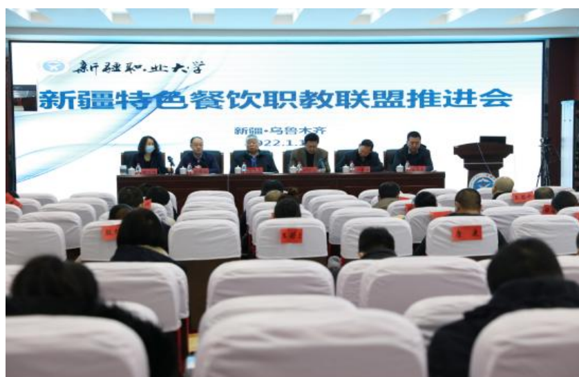
图 4-1 新疆特色餐饮职业教育联盟 2022 年推进会

一是选派 400 余名学生在墨玉县、巴楚县和库尔勒市小学、幼儿园开展实习支教，有力提升了当地