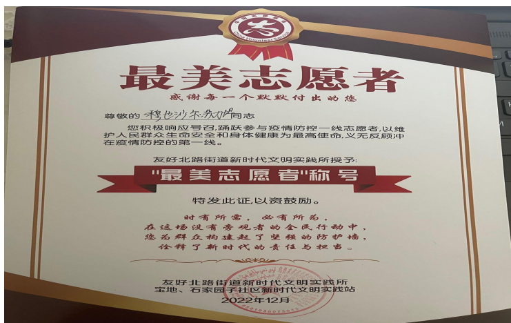
图 4-4 学校教师荣获“最美志愿者称号”

学校严格落实疫情防控“动态清零”总方针，主动配合实现社会面动态清零目标，学校党委积极动员全校各基层党组织和 132 名党员，带头落实疫情防控要求，参加属地一线志愿服务。全校全部基层党支部和超过三分之一的教职工党员、472 名学生参加防疫志愿服务。