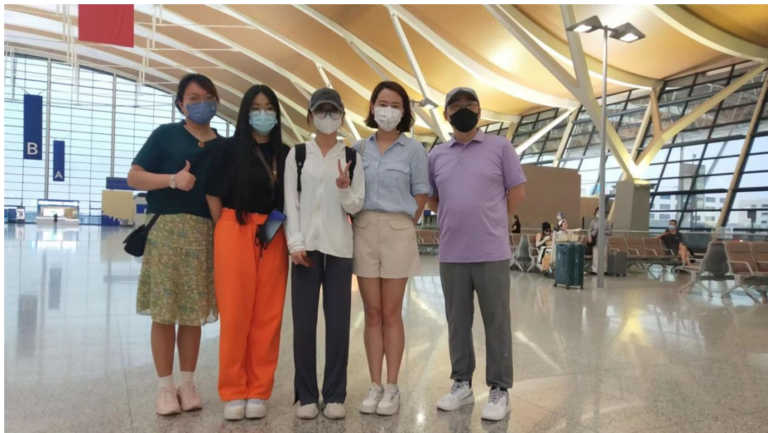
图 13 合作办学学生赴韩国留学

影学院祝华东书记更是自录了一段送给赴韩同学们的影像，来表达学院对第一届学生们的殷切希望。同学们带着老师们的殷殷嘱托启程。