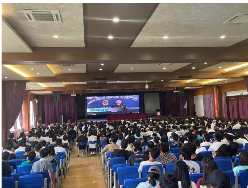
图 18 反诈宣传促防范宣讲现场

通过这些丰富多彩的校园文化活动，形成了浓郁的诚信文化氛围，在潜移默化中教育学生、感染学生。引导他们直面困难、锐意进取、心怀感恩、健康成长。广泛宣传国家资助政策，大力普及征信、金融等相关知识，促进学生树立诚信观念，增强法律知识，及时履行国家助学贷款合同，有效地将诚信美德转化为大学生的自觉素养和行为。