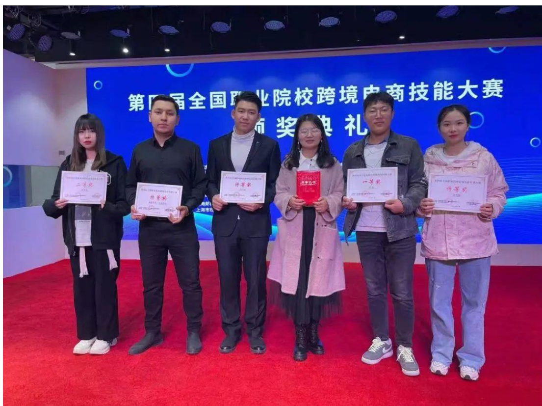
图7 跨境电商技能大赛获奖

竞赛过程充满汗水，竞赛结果满是收获。在竞赛中，同学们加深了对课程的理解，提升了跨境电子商务知识素养与核心技能，提高了对行业岗位技能的认识，明确了职业发展和就业方向。