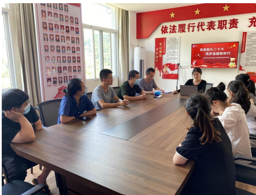
图 15 宣讲团走进社区

过通俗易懂的语言，向群众宣传习近平新时代中国特色社会主义思想。前期准备阶段，通过发放调查问卷，对不同年龄段的居民进行访谈。根据调查问卷的情况，将内容增添到宣讲当中。在宣讲过程中，还针对发现的问题及时为群众答疑解惑，让每一位群众都清楚每一项政策、明白每一个知识点、搞懂每一个问题，真正做到习近平新时代中国特色社会主义思想“进村、进组、进户”。