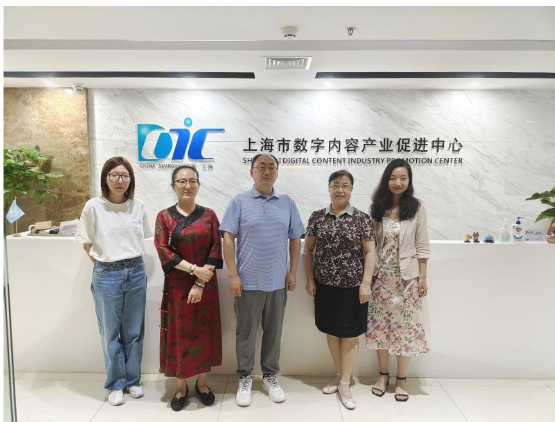
图 12 产教融合管理办与智能工程学院共同走访企业开展校企合作洽谈