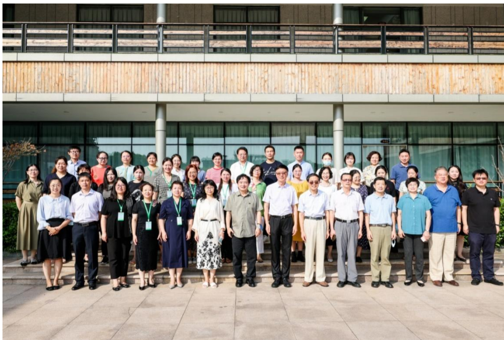
图 16 研修班结业

本着民办高校的实践情况，在政府的支持下，震旦职业学院承担起实施民办高校心理健康教育社会协同的教育体制机制。并遵循“政府支持、专家领衔、一流合作，聚集队伍、服务师生”的要求，做到了“集合了国内外一批知名专家队伍；提高了民办高校部分党政领导的心理素质；带出了一批心理专业和思政相关专业的教师队伍；培训了一批学生班、团干部队伍；如，2022年8月，为更好地提升上海民办高校的学生心理健康教育工作水平，进一步加强高校思想政治工作体系建设，提升心理育人质量，总结疫情期间心理健康教育成果，在上海市民办高校工作委员会指导下，上海震旦职业学院、上海市民办高校心理健康教育基地与