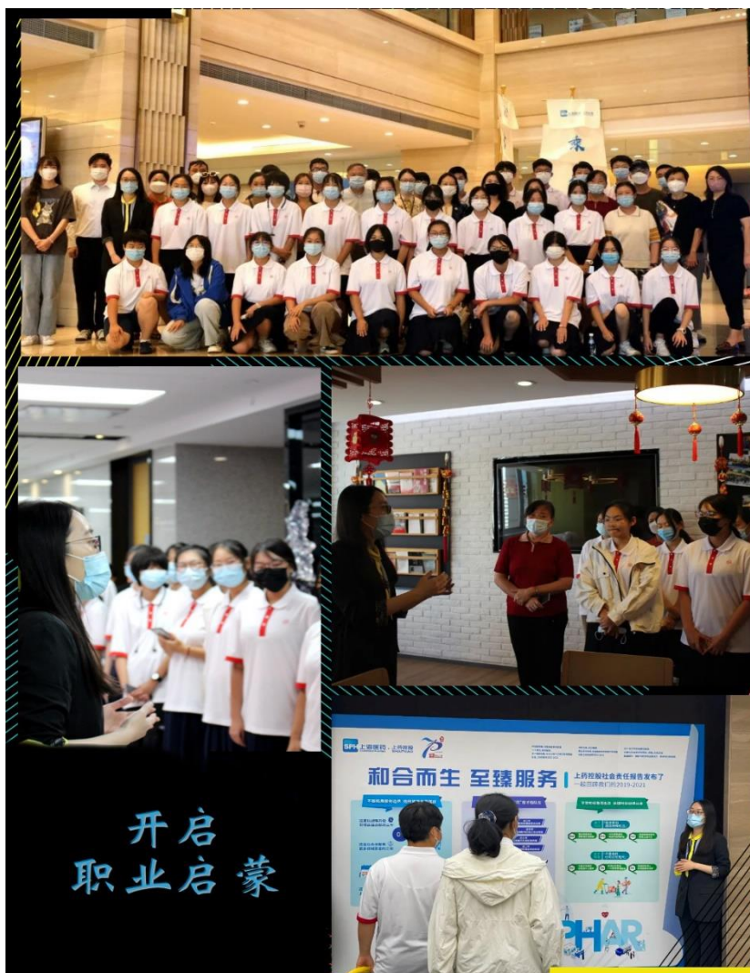
图 14 走进医药控股集团

限公司主办，分别从医药行业背景、未来发展前景；企业创立发展，到精神文化、校企合作开展情况向与会师生、家长做了详尽介绍和参观，使他们更为清晰地了解了上药控股、企业文化、行业发展，药学专业岗位需求，让同学们近距离感受了医药行业的特色与职业魅力。