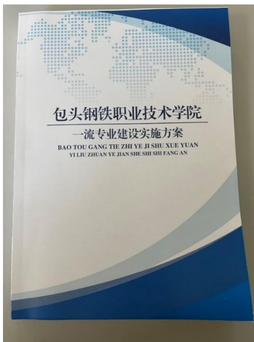
图 3-1 一流专业建设方案册子图