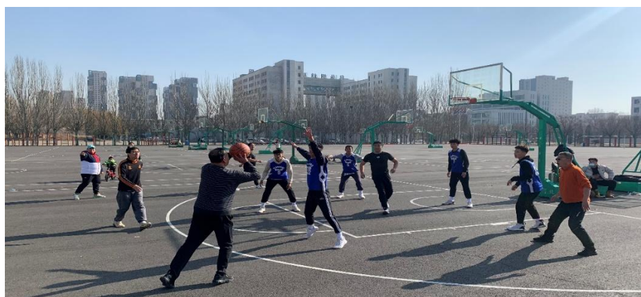
图 2-5 师生篮球比赛图

发挥“第二课堂”在高校思政教育工作中的作用，本年度共计开展大型活动6次，包括党史知识竞赛、经典诵读、大合唱、十佳歌手大赛、电竞比赛、文明宿舍评比，涵盖学院所有在校生，直接参与活动学生3000余人；积极参与自治区主办的“三下乡”活动，共有10支团队150余位志愿者参与到暑期三下乡活动中，完成三下乡志愿者帮扶项目4项。