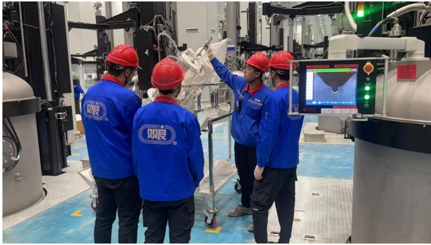
图 2-8 毕业生工作场景图