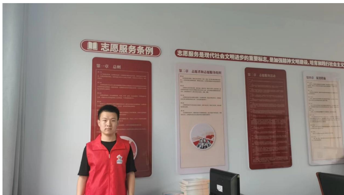
图 2-7 学生在察右后旗参加志愿者活动

为发挥学院在劳动教育中的主导作用，每学期以教学班为单位安排为期一周的劳动实践周。结合学生日常管理，遵循学生身心发展规律，在确保安全的前提下，利用劳动实践周，为学生创设参与校园卫生保洁、绿化美化、食堂劳作、教室环境美化、实训室清扫等校内劳动实践活动。