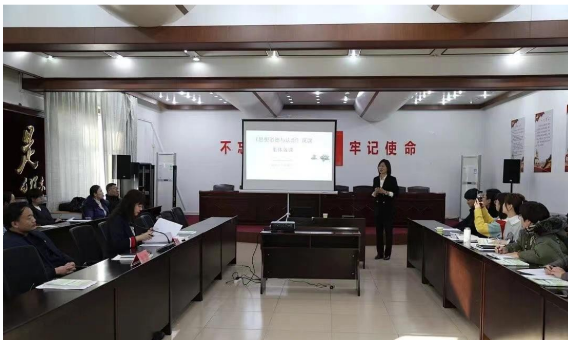
图 2-1 《思想道德与法治》集体备课图