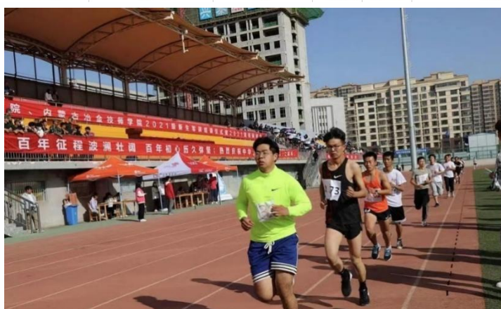
图 2-4 学生参加运动会图