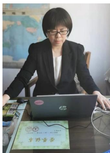
图 3-3 教师线上授课图

2022 年包头市疫情多点突发形势严峻，为保证听课不停学，通过超星网络平台开展线上教学，学院各部门全面统筹、整合和调配教育资源，扎实开展线上教学、自主学习和在线辅导答疑等工作，做到了延迟返校不停教、不停学，最大程度降低了疫情对教学工作的影响，教学秩序正常，教学效果良好。