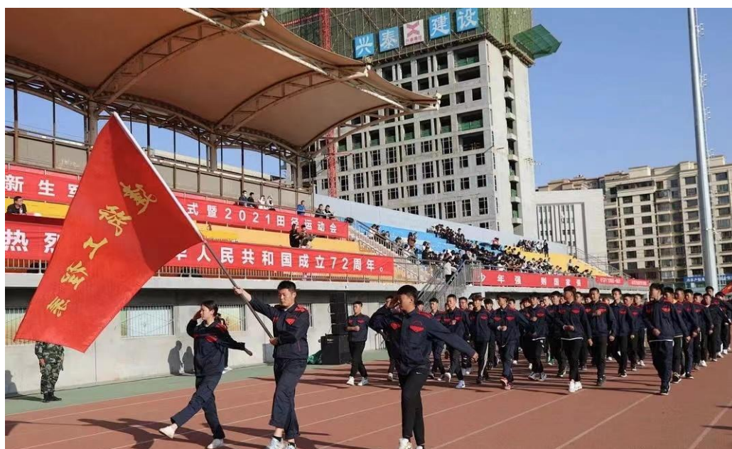
图 2-6 2021 年 10 月学生军训结训仪式