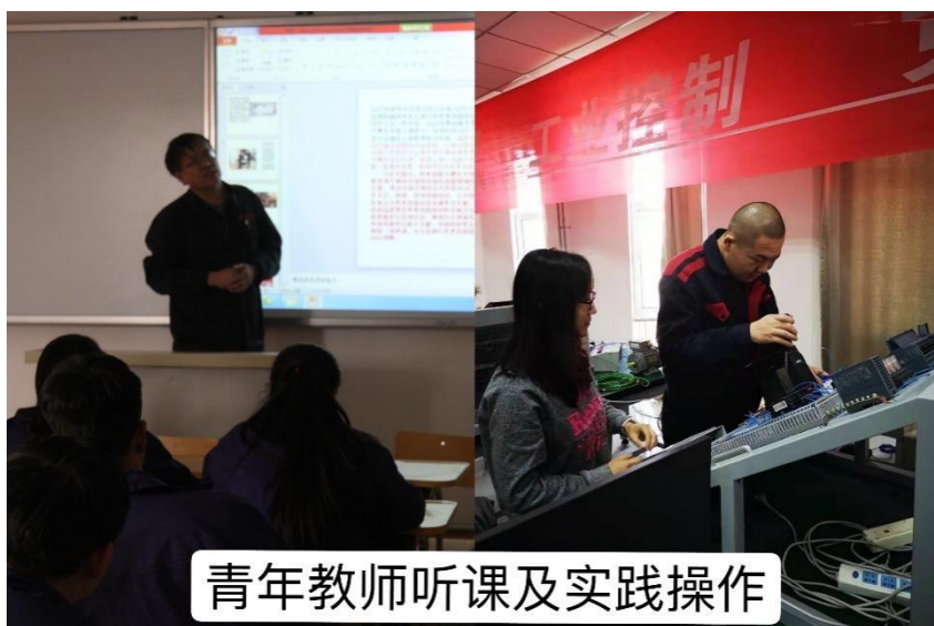
青年教师听课及实践操作

2021年10月，学院印发了《包头钢铁职业技术学院青年教师“师带徒”人才培养计划完成情况考核细则》和《包头钢铁职业技术学院青年教师实施“双师型”素质人才培养管理暂行办法》。