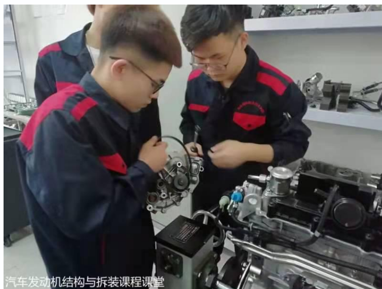
图 2-2 学生专业课程课堂图片

为进一步贯彻落实“用心为师，学技做人”的校训，深化以“学技”为核心的教学改革，树立良好的学风，激发全院师生的工作热情和学习积极性。在学院各部门共同努力下，继续对学院为完成课改的课程进行课改，对完成课改的课程继续进行理实一体化的课程的改革。使得课程对应工作岗位和真实的工作任务，提高学生和教师的实际动手能力，提高课堂实践时间。