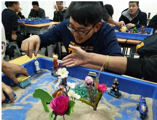
图 2-3 学生心理沙盘活动图

疫情期间和疫后的返校复学，不仅需要身体上的“严防控”，更需要心理上的“有效导”，针对学生返校后的心理变化，强化心理健康服务，从多维度为学生健康保驾护航。建立学院—心理健康指导中心—系部心理工作站—班级心理委员—宿舍心理信息员等五级心理健康工作机制，有效掌握学院学生的思想及心理状况。