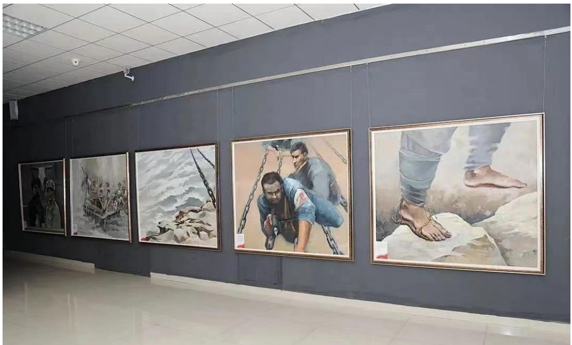
图 3-2 长征油画展红色教育基地图

针对扩招学生工学矛盾突出、年龄跨度宽、学习能力差异大、学历层次多样化、专业素养跨度大等特点设置跟班和弹性两种学习形式,制定并执行两种人才培养方案。教学方式采取分散和集中相结合,线上线下相结合;教学地点校内与校外相结合,本地