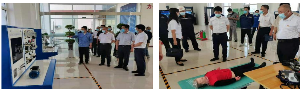
图为学院领导和主管部门领导参观腾格里职业培训基地

2022 年上半年，学院进一步改进校企双方合作方式，将职业培训利润分配向企业倾斜，调动企业对职业培训基地资金投入的积极性。已将建在内蒙古莱科作物保护有限公司院内的“校企合作”的腾格里职业培训基地搬迁到阿拉善左旗腾格里额里斯镇，使学院腾格里职业培训基地符合疫情防控要求，更好地满足对社会提供职业培训的需求。