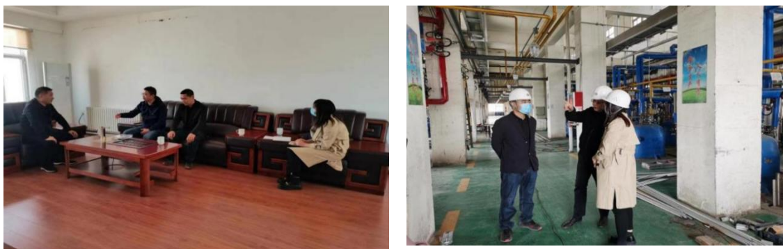
图为化工系与鲲鹏化工企业科研项目合作洽谈

三是企业研发技术人员到学校来进行实验数据比对交流，实验数据比对期间，专任教师和任课班级学生共同参与，校企共同开展实践教学，同时，专业技术人员以严谨认真的工作态度和一丝不苟的工作作风，言传身教，对学生进行了“科学精神”“工匠精神”的现场教育，体现了思政教育与课程思政协同育人的目标要求。进入企业有针对性地研究企业生产研发新产品问题，并由在外访学的老师搭线，让企业技术人员与兰州大学专家教授进行线上技术咨询。