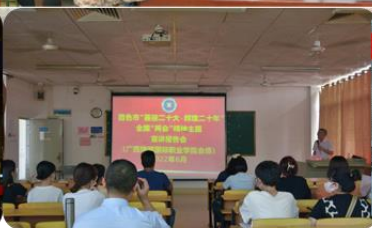
我校召开百色市“喜迎二十大·辉煌二十年”全国“两会”精神主题宣讲报告会