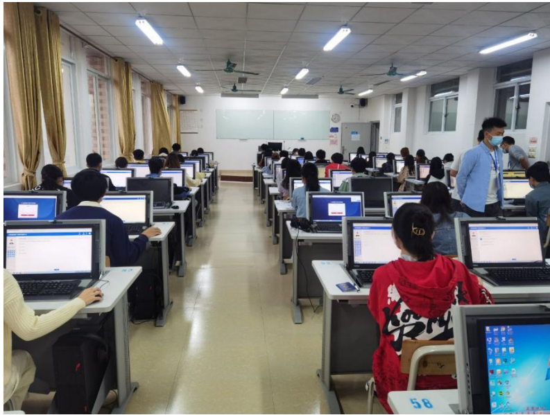
课证融通教学现场

年分批次组织学生参加“1+X”电子商务数据分析、和“1+X”网店运营推广考证培训与考试。