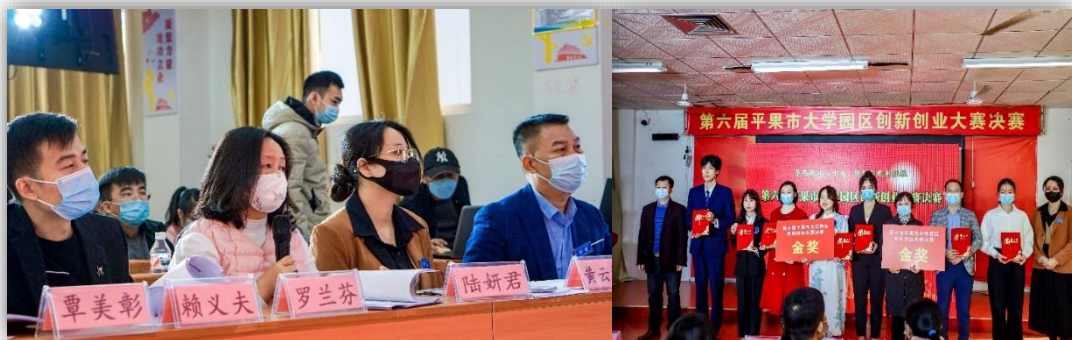
第六届平果市大学园区创新创业大赛决赛现场

本地运营服务项目、“长寿山茶油”的致富之路、八角种植生态园、“校园通”互助平台，分别获得 1 金 2 银 2 铜的佳绩。