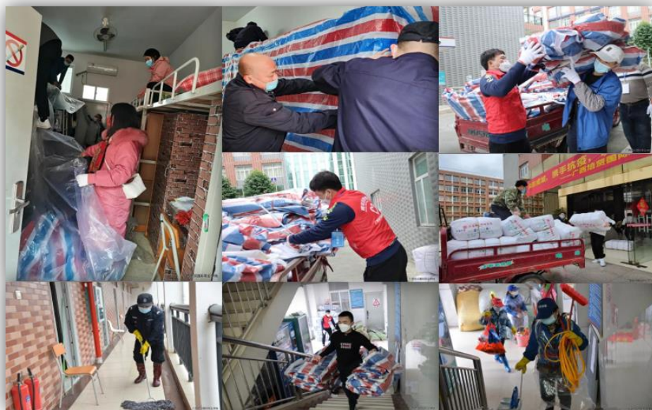
众志成城，奋战在抗疫一线的培贤教职工和志愿者

2022年2月，百色市疫情防控形勢嚴峻，為積極響應百色疫情防控工作需要，培賢國際大酒店、我校學生宿舍、部分教師公寓加入抗“疫”隊伍，作為隔離房，以及和实训室被臨時征用作為防控指揮中心，共同戰“疫”，配合政府防控工作形成強大合力。我校用實際行動詮釋了新時代院校的責任和擔當，在服務大局中彰顯了新時代院校的良好精神風貌，為此，市委、市人民政府發來感謝信，感謝學校為全市上下打贏疫情防控阻擊戰作出了重要貢獻。