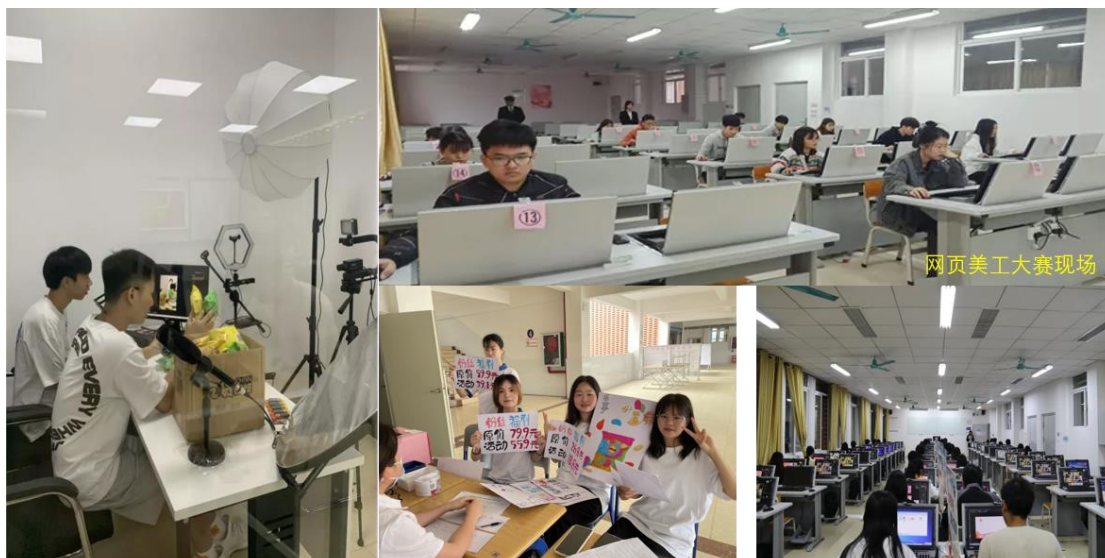
模拟直播大赛图片

根据不同专业的特点，在校内综合开展各类专业技能比赛，如电子商务运营与推广、PS 网页美工、模拟直播、宣传海报设计等赛项，参赛队伍总计 262 队，参赛学生数达 623 人次。通过比赛，为学生提供了实战的机会和平台，帮助学生发现自身的短板，便于及时改进提高。