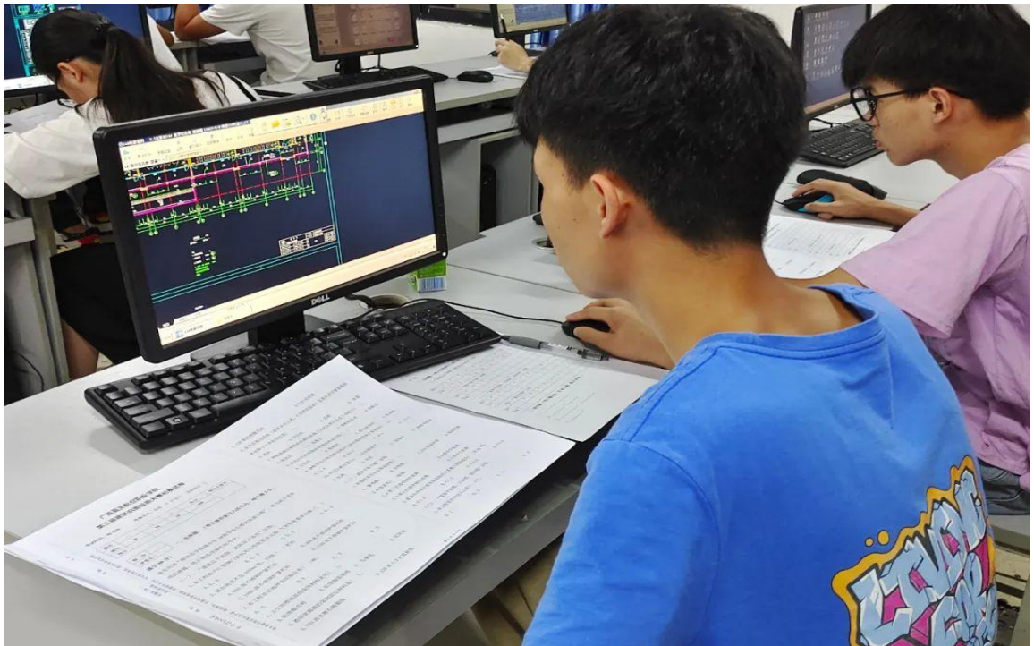
图 14 本次“建筑识图技能大赛”学生参赛图

本次技能大赛活动是为了丰富校园文化生活，活跃校园气息，培养和提高本校学生的学习热情和积极性，促进学生之间的交流，共同进步，同时了解学生掌握和运用专业知识的能力，充分调动学生学习的积极性和主动性，努力提高学生的识图能力，达到以赛促学，以赛促教的教学目的。