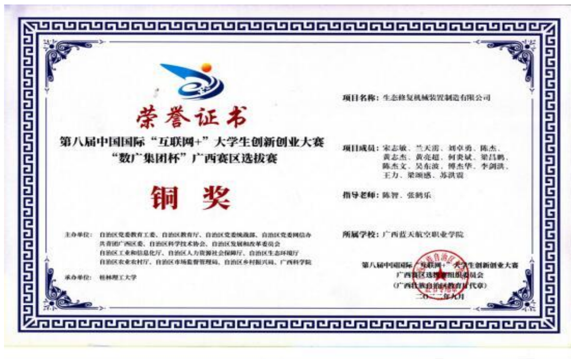
图 9 第八届中国国际“互联网+”大学生创新创业大赛 “数广集团杯”铜奖