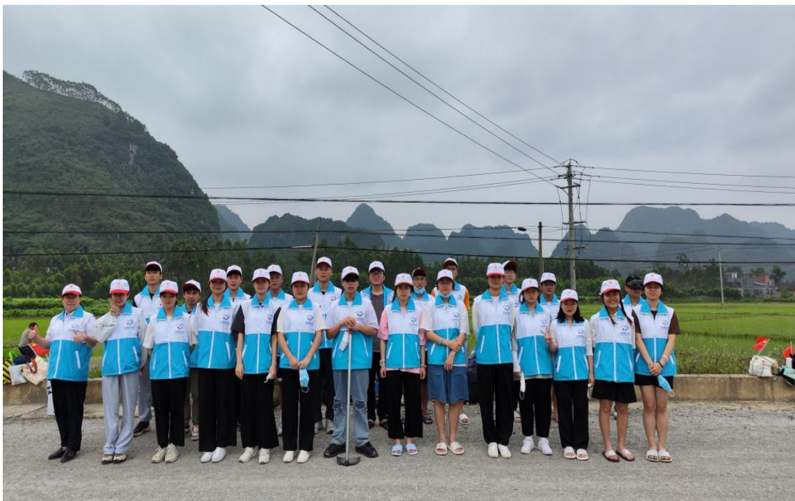
图 4 丰富的社团活动