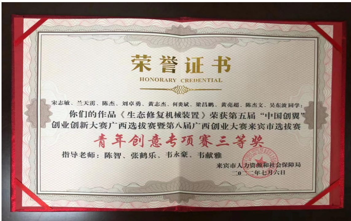
图 5 第八届广西创业大赛来宾市选拔赛中荣获三等奖