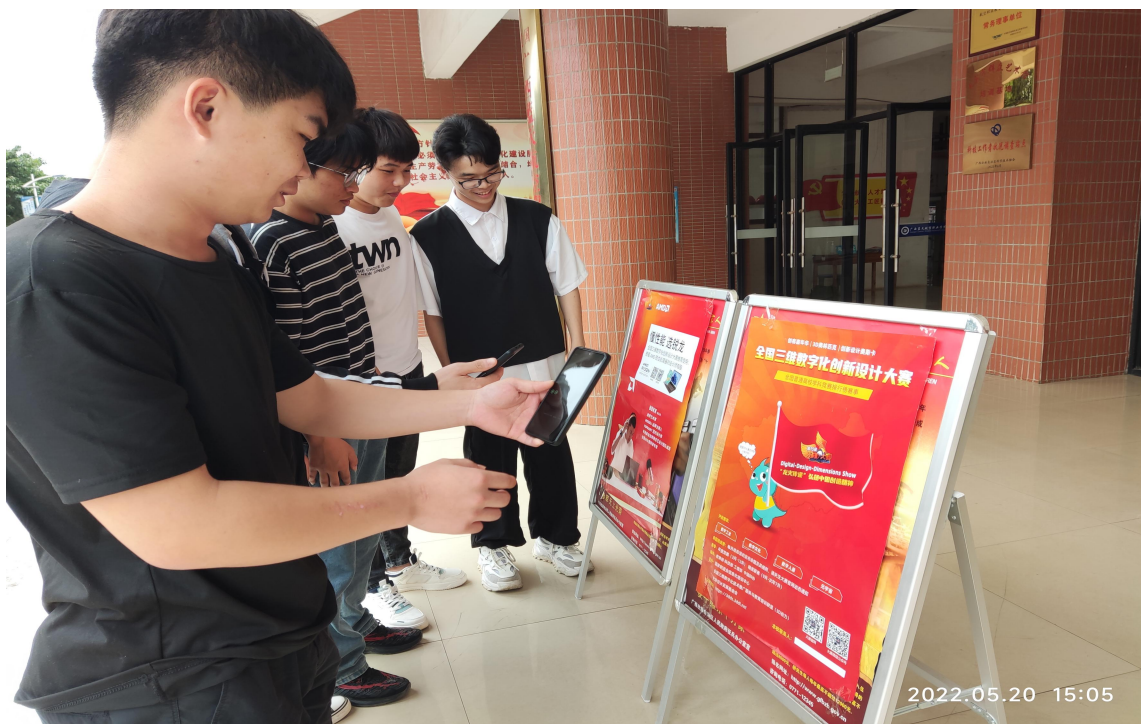
图 11 在校内开展赛事宣传

自从今年 3 月份收到了组委会的参赛文件后，学校高度重视此次大赛，为学生提供了良好的仪器设备和专业实验室进行备赛。学校“大学生科技创新实训中心-工程创新基地”积极开展各项准备工作，对工作做出了全面的规划和部署。