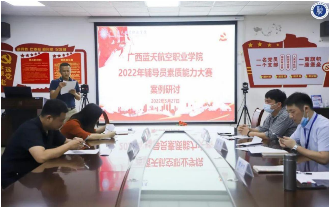
图 2 2022 年辅导员素质能力大赛案例研讨