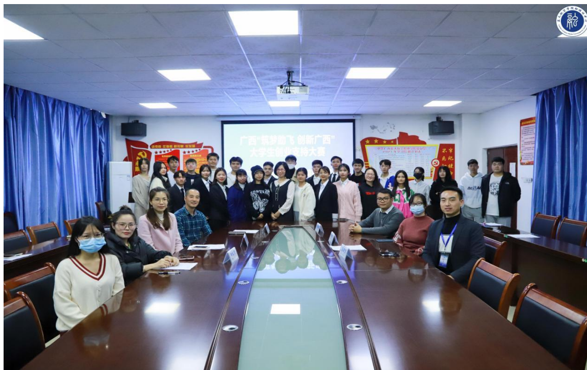
图 10 创新创业学院组织师生开展创新创业校赛活动