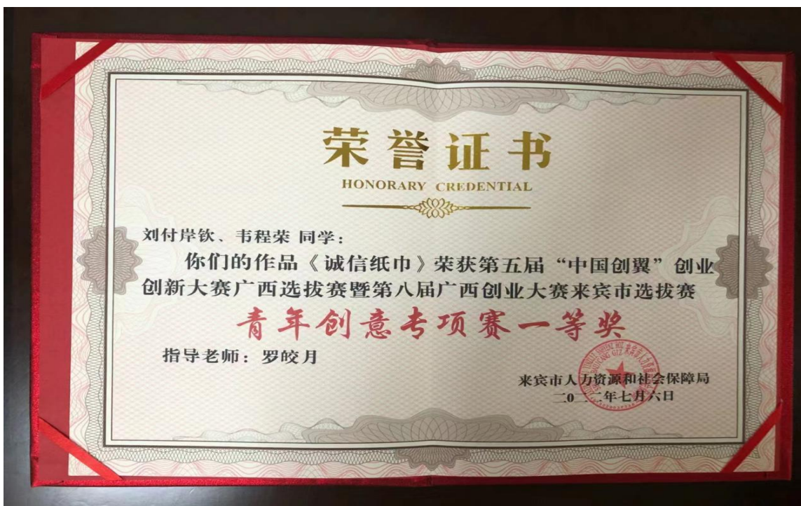
图 6 第八届广西创业大赛来宾市选拔赛中荣获一等奖