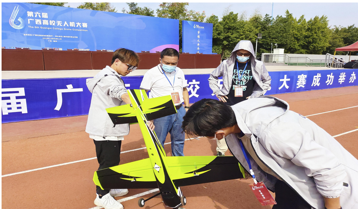
图 16 学校参赛选手在进行赛前准备