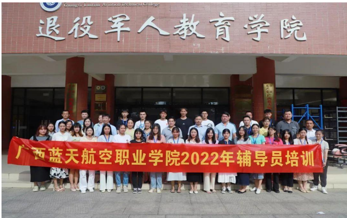
图 3 2022 年辅导员培训班合影