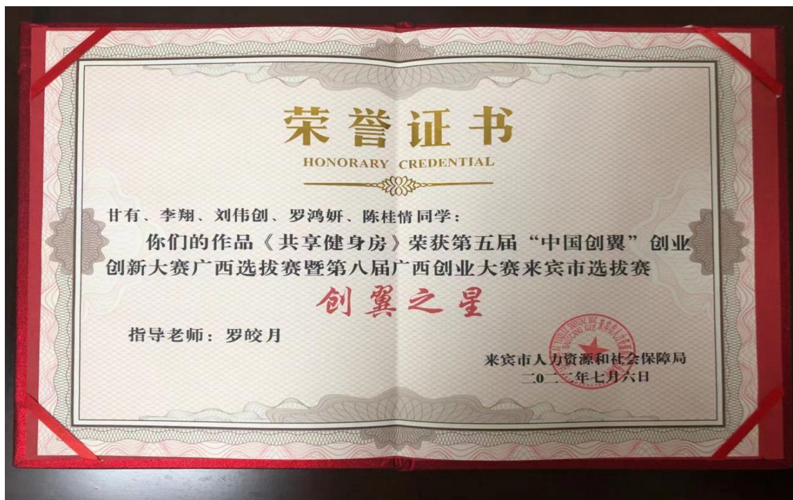
图 7 第八届广西创业大赛来宾市选拔赛中荣获创翼之星