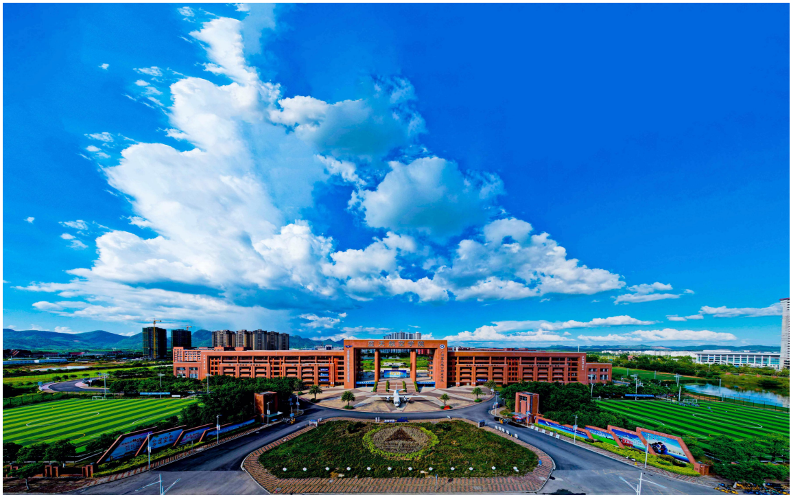
图 1 广西蓝天航空职业学院南门

广西蓝天航空职业学院是经广西壮族自治区人民政府批准设立，国家教育部备案，具有独立颁发学历文凭资格的全日制普通高等院校。学校坐落于桂中腹地，红水河畔“世界体操王子”李宁的故乡——来宾市，地处来宾市教育园区。学校教学实训设备与生活运动设施完善，校园环境优美，交通便利。