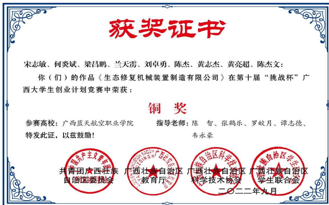
图 8 第十届“挑战杯”广西大学生创业计划竞赛中荣获“铜奖”