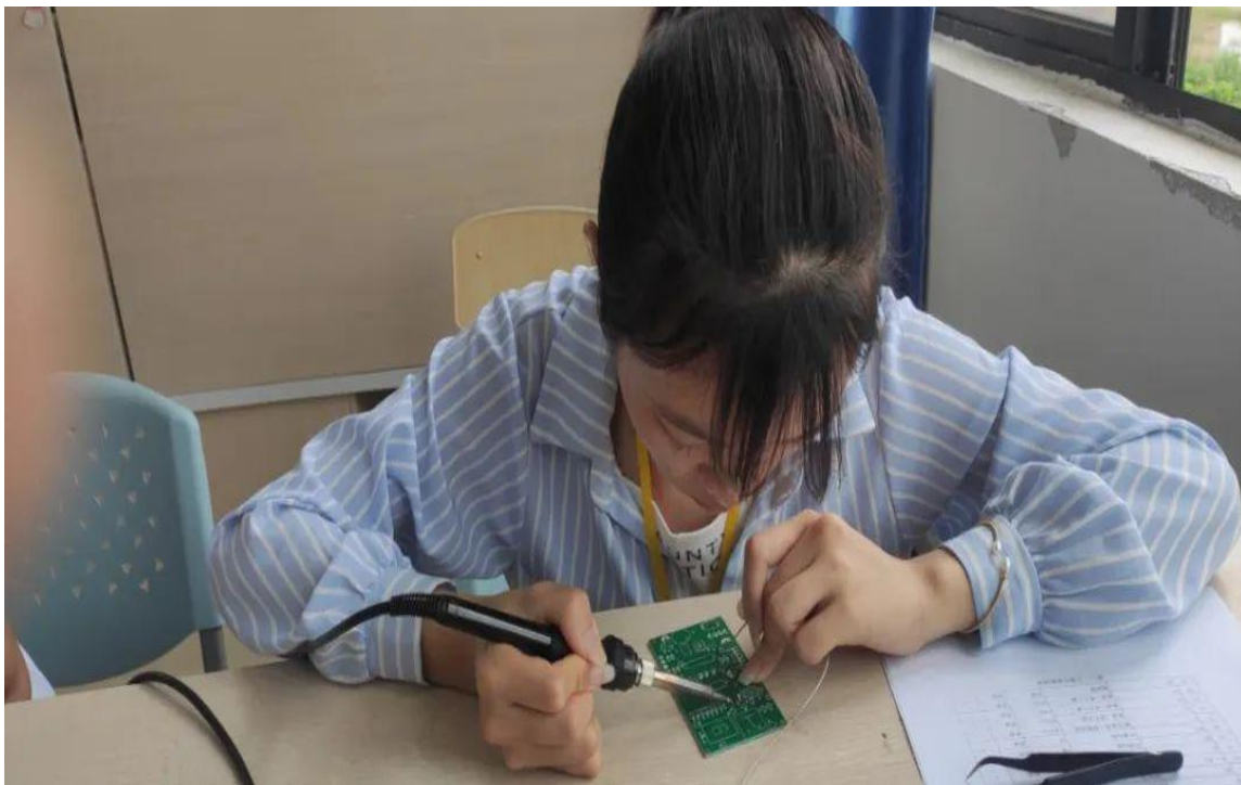
图 13 参赛选手组装电路板