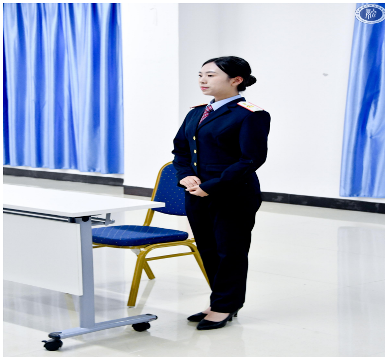
图 15 参赛选手进行面试