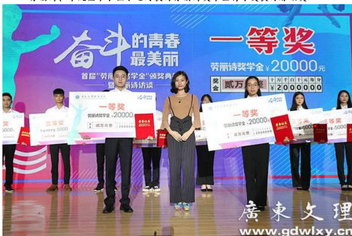
劳丽诗奖学金一等奖颁奖现场