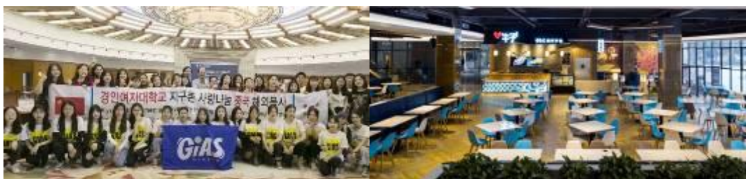
图 3: 文理师生代表带领韩国访学团参观文理校园的校内设施和各处美景, 并一一介绍校园建设的细处亮点。韩国访学团参观了实训大楼、图书馆、健身房等地, 并给予了高度评价。