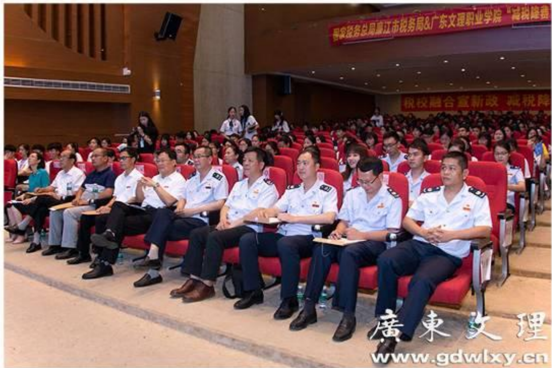
廉江市税务局和广东文理职业学院共同举办的“减税降费”宣传策划创意大赛