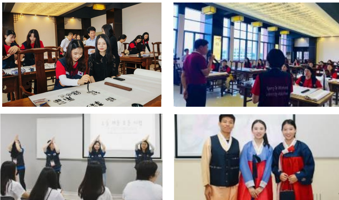
图 4: 中韩文化交流课堂上, 广东文理与韩国访学团进行了一系列的文化交流互动。在中方展示的环节中, 文理特设一堂中韩学生共同学习的书法课, 韩国学生在练习书法的过程中, 一点一点亲身领略到中国的汉字与诗词之美; 韩国学生们展示了有关韩国民俗、流行文化、语言以及大学课程特色专业方面的内容。