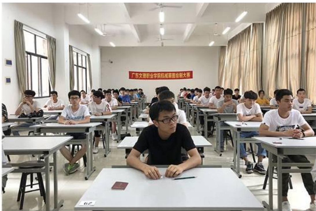
机电工程系举行2019年机械草图绘制大赛