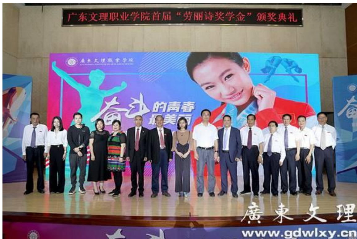
出席颁奖典礼的领导、嘉宾合影