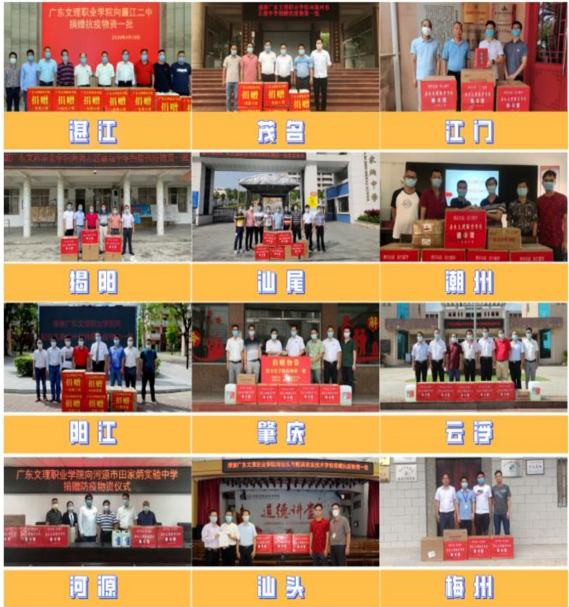
▲ 部分已捐赠的城市