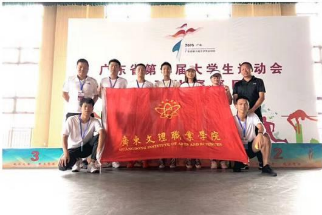
省大运会网球队集体照