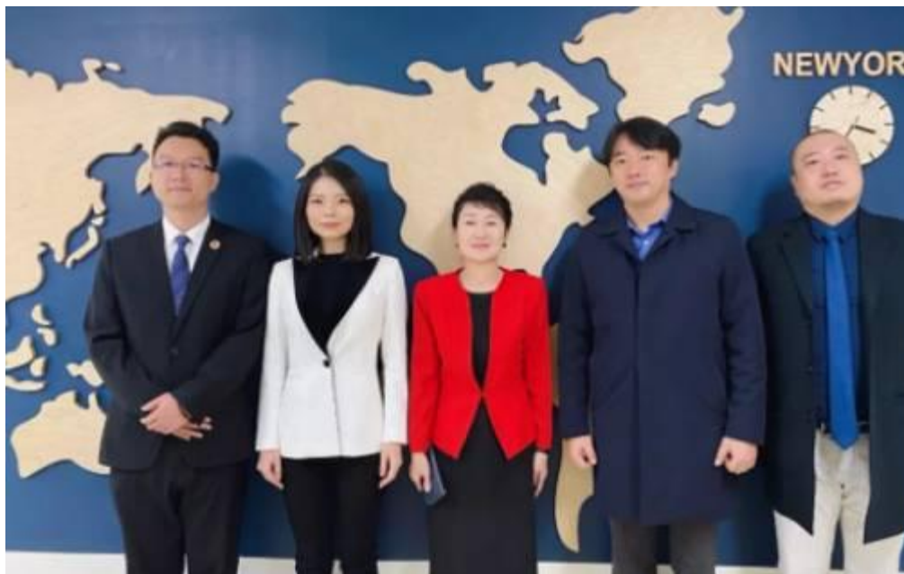
广东文理代表团与韩国敬仁女子大学领导 合影