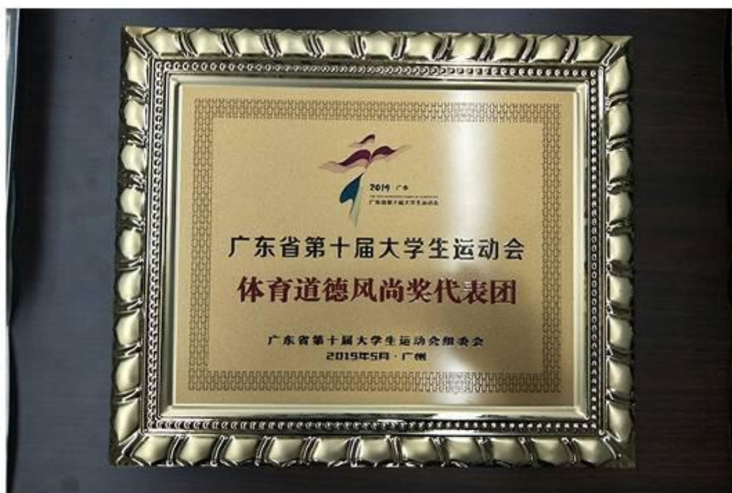
省大运会代表团体育道德风尚奖