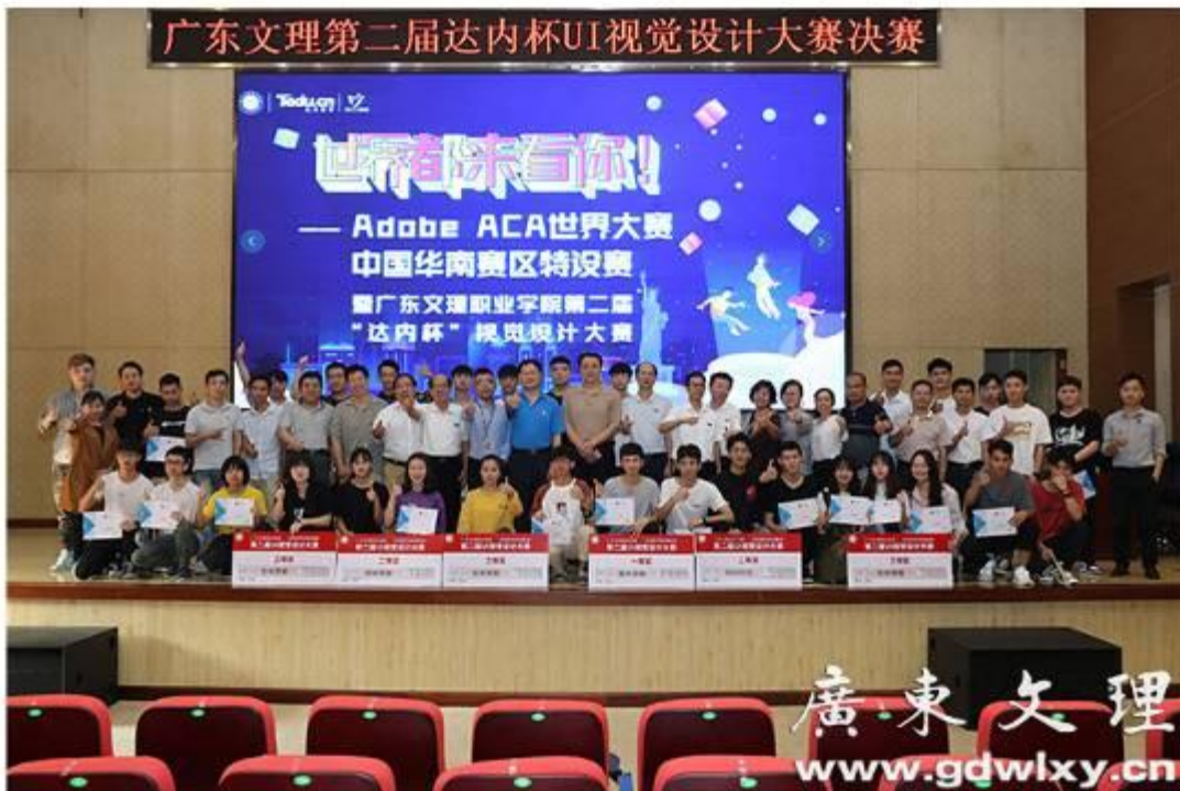
学院第二届达内杯设计大赛