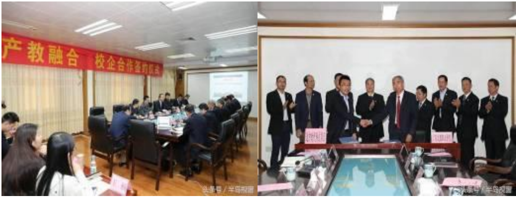
广东文理职业学院与达内时代科技集团签约校企合作协议书