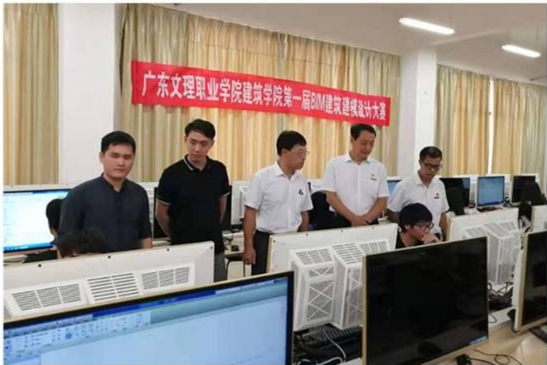
举行第一届 BIM 建筑建模设计大赛