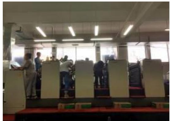
我院学生在银海印刷有限公司实训