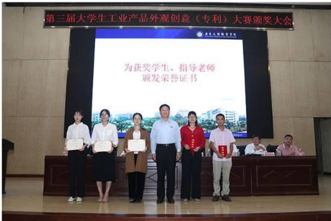
举行第三届大学生工业产品外观创意（专利）设计大赛颁奖会

为深入贯彻落实党的十九大报告提出的“完善职业教育和培训体系，深化产教融合、校企合作”，推动校企精准对接、精准育人，创新人才培养模式，提高人才培养质量。广东文理职业学院举办 2019 年第三届大学生工业(产品)设计（专利）大赛。湛江知识产权局为获奖的师生颁发了证书和奖金。本次大赛不仅增强学生自主学习能力和实践能力，为学生提供真实历练的平台，激发创新意识和提高创新能力，又起到精准育人的效果。