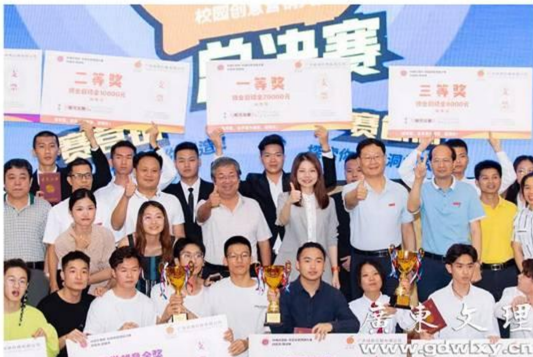
第一届“岭南红橙杯”校园创意营销大赛完美收官