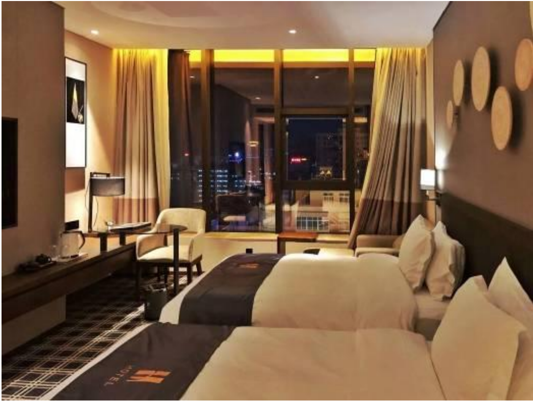
图 5: 韩国访学团下榻学院 H 酒店 (H 酒店系广东文理院办酒店, 是酒店管理和烹饪营养与工艺专业学生的实训基地), 24 小时管家式服务让韩国访学团的师生们赞不绝口。