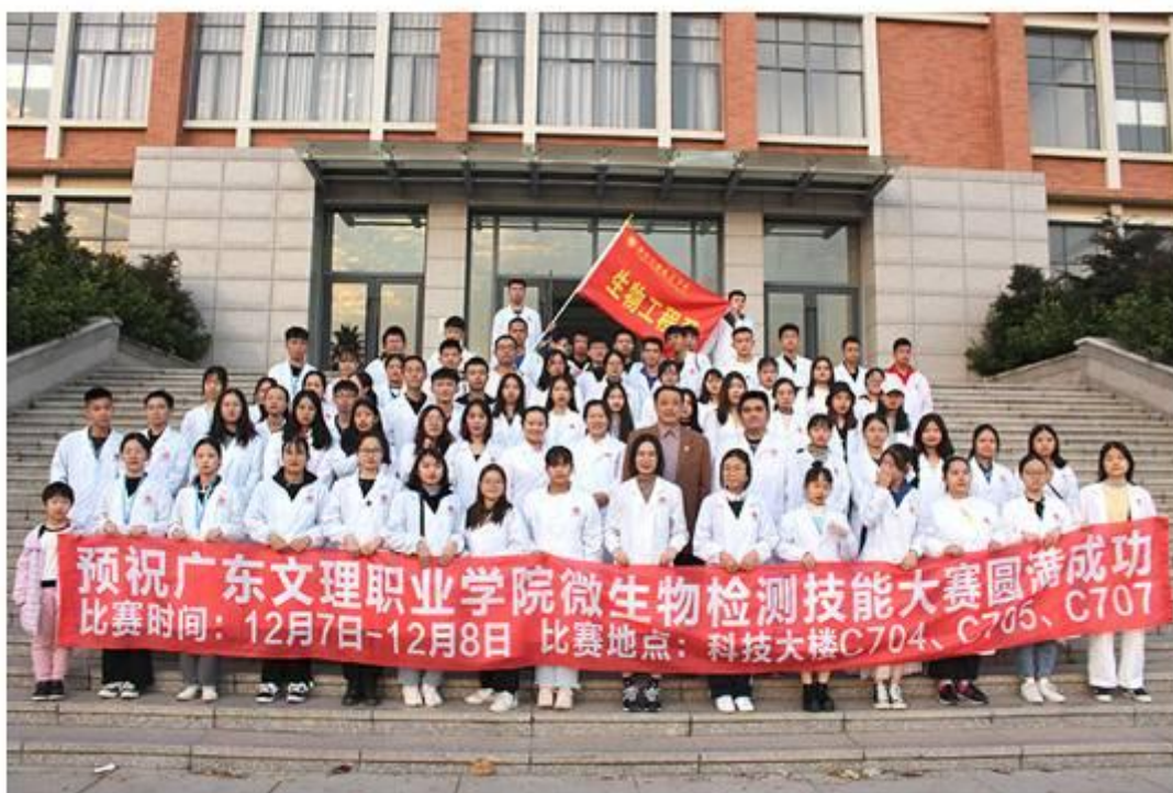
生物工程系微生物检测技能大赛