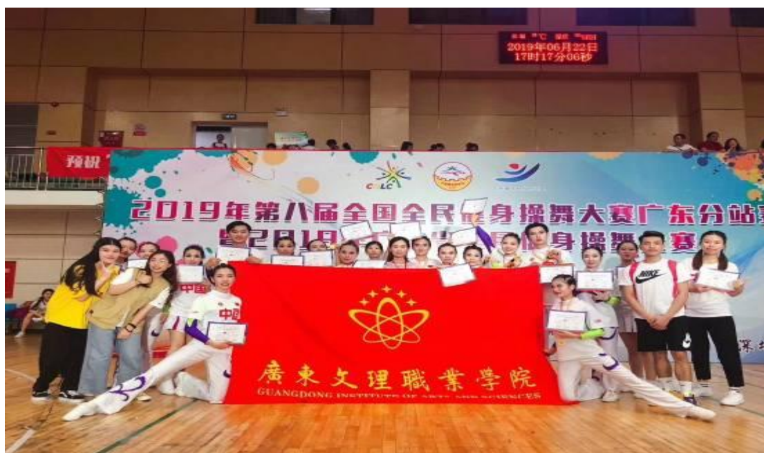
2019年第八届全国全民健身操舞大赛广东分站赛获两项一等奖