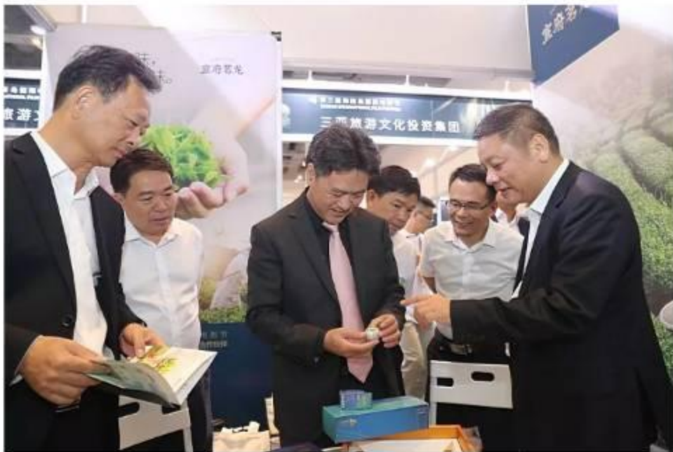
▲ 在H!Market市场展会现场，廉江市委书记林海武一行来到岭南红·廉江红橙和宣府茗龙茶展位，仔细询问这两个来自廉江的品牌的参会参展情况。宣府茗龙联合岭南红·廉江红橙为本届海南岛国际电影节创作了官方指定唯一礼品用茶。

在H!Market 市场展会现场，廉江市委书记林海武一行来到岭南红·廉江红橙和宣府茗龙茶展位，仔细询问这两个来自廉江的品牌的参会参展情况。宣府茗龙联合岭南红·廉江红橙为本届海南岛国际电影节创作了官方指定唯一礼品用茶。