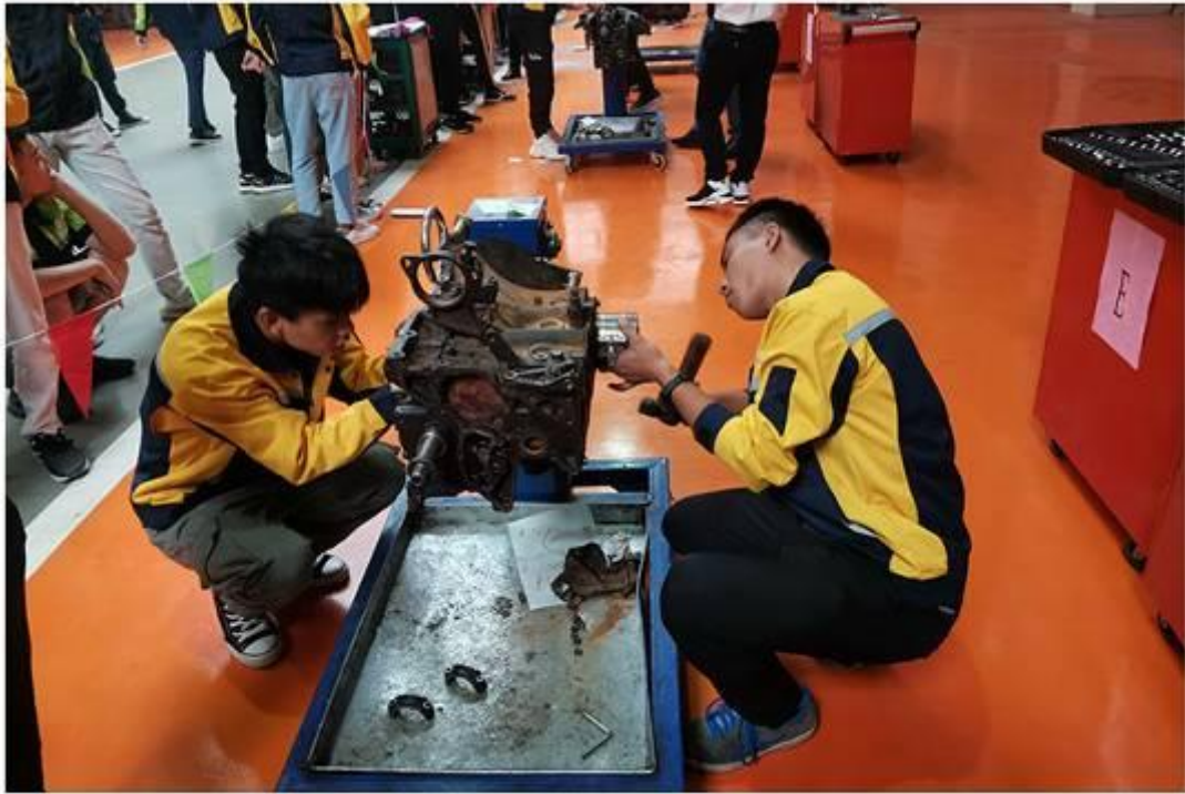
开展第五届汽车技能大赛