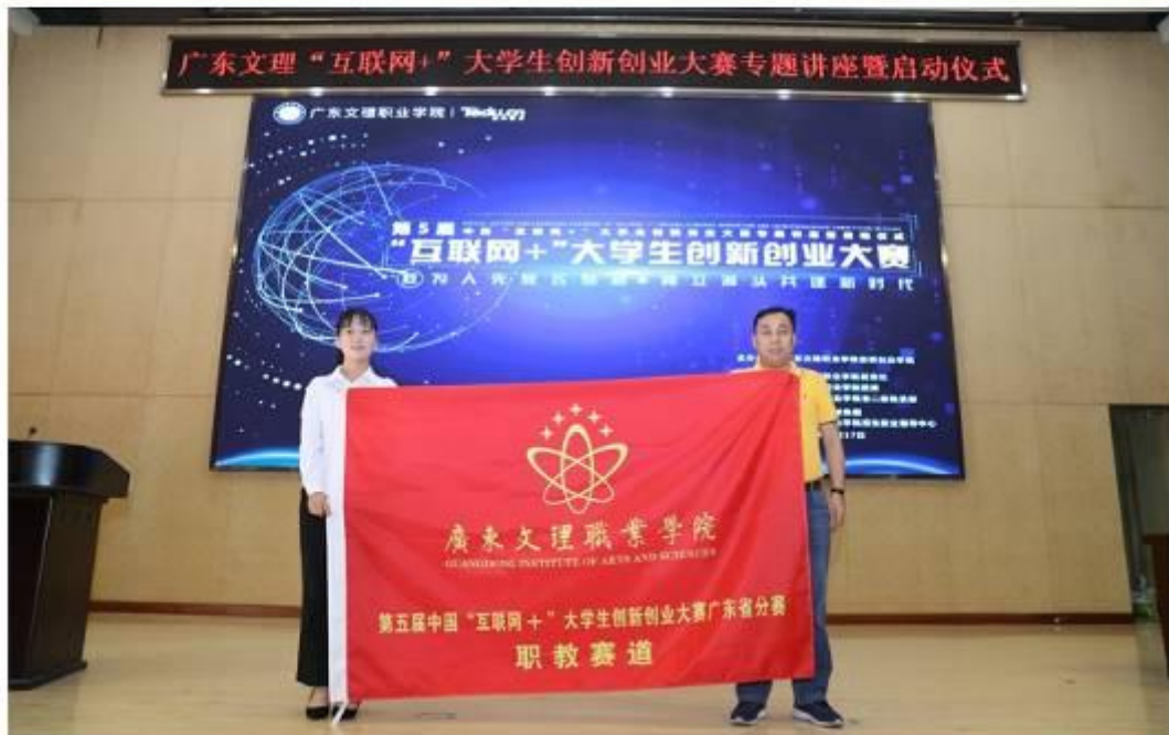
学院举行“互联网+”大学生创新创业大赛