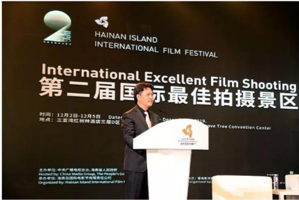
▲ 中共廉江市委书记林海武在“国际最佳拍摄景区推介大会”启动仪式上致辞