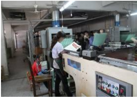
我院教师在生产现场教学

我院积极推进印刷技术专业现代学徒制试点工作。通过探索联合校内外企业，以制订校企“双人才培养方案”“双教学培养标准”为重点，以建设校企“双教学团队”为保证，探索印刷技术专业现代学徒制人才培养模式，实现校企一体化育人，进一步满足粤西印刷业人才需求，加强粤西印刷人才培养，促进粤西乃至广东省印刷产业的繁荣。结合我院生物工程系开设专业，积极与廉江农产品行业“宣府茗龙”（广东省重点农业龙头企业）与“岭南红”（广东省重点农业龙头企业）做好对接，共同培养专业人才。