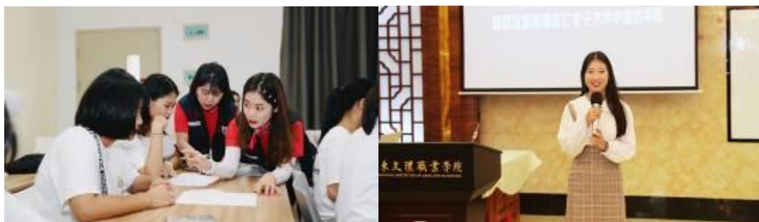
图 2: 文理 25 名学生参与到本次韩国访学团的活动, 其中有部分学生自学了流利的韩语, 并担任起翻译小助理的角色。