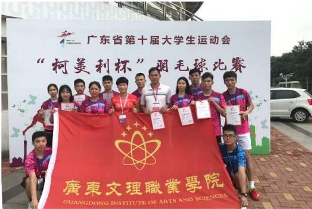
省大运会羽毛球队集体照