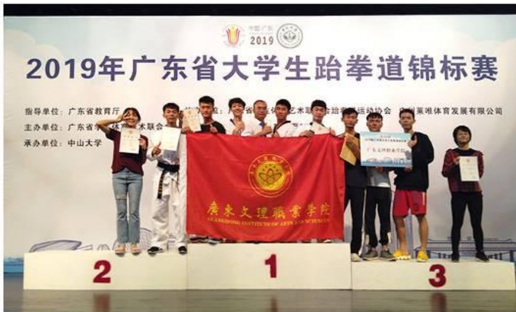
2019年广东省跆拳道锦标赛获两项第三名，五项第五名