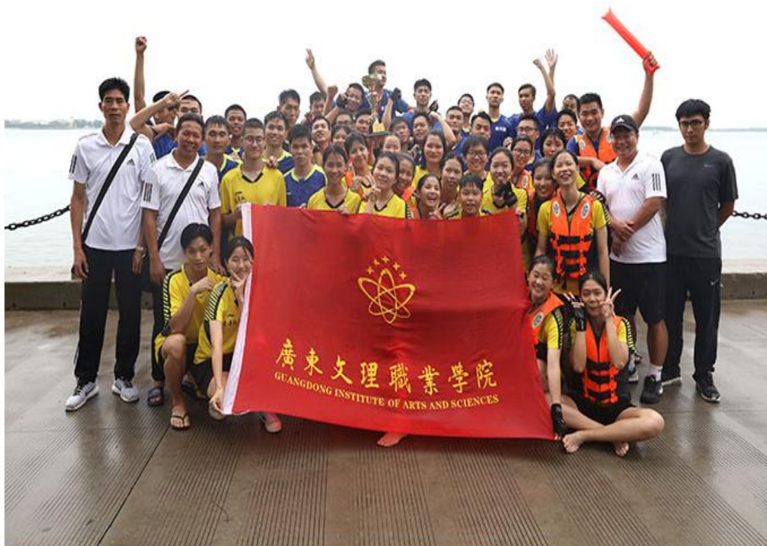
学院龙舟队出征湛江海上龙舟赛女队卫冕该赛事冠军，男队摘得第三名