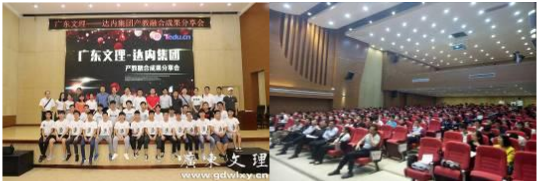
广东文理职业学院与达内时代科技集团产教融合成果分享会