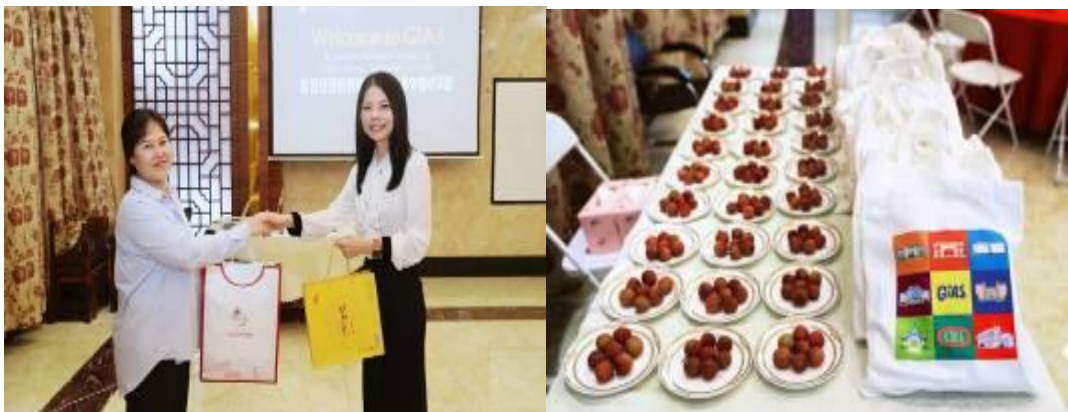
图 1: 为了表达欢迎的心意, 文理为远方的客人们准备了特别的礼物: 国际教育学院学生设计的帆布袋、降暑小风扇以及文理实训基地种植的茗龙有机茶。