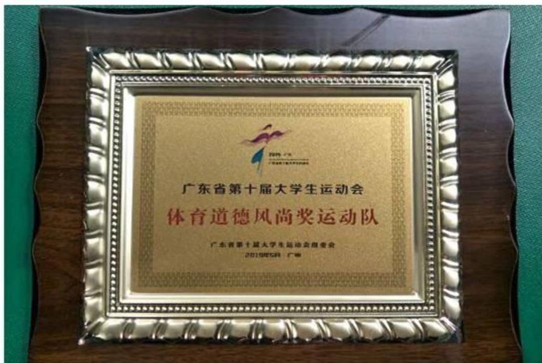
省大运会（羽毛球运动队）体育道德风尚奖