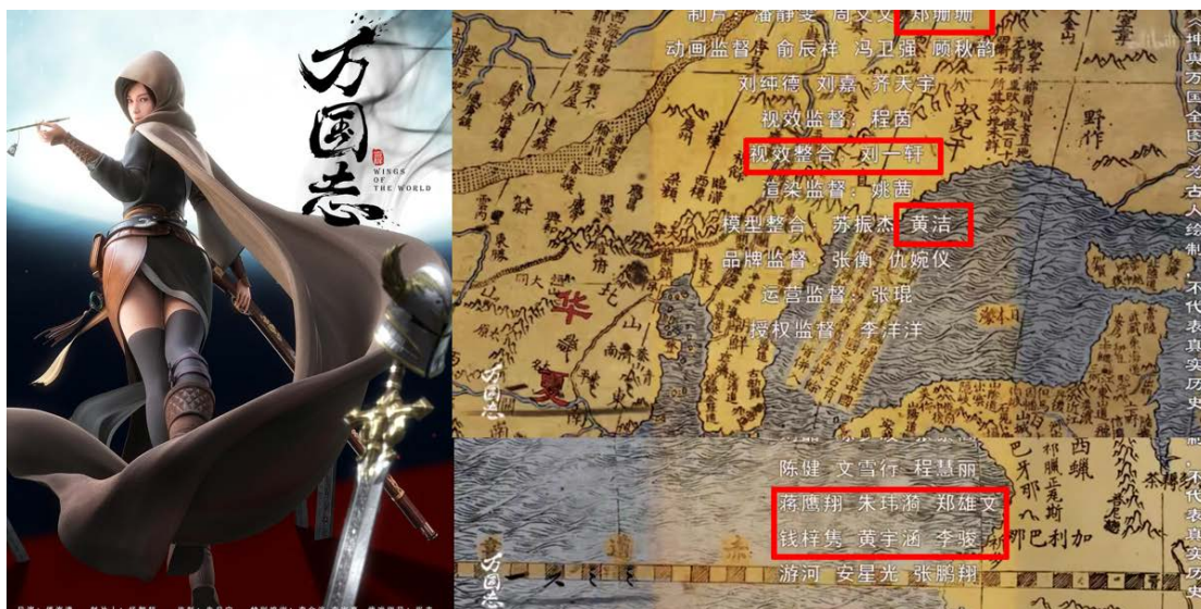
图3 师生参与《万国志》三维制作在影片尾署名