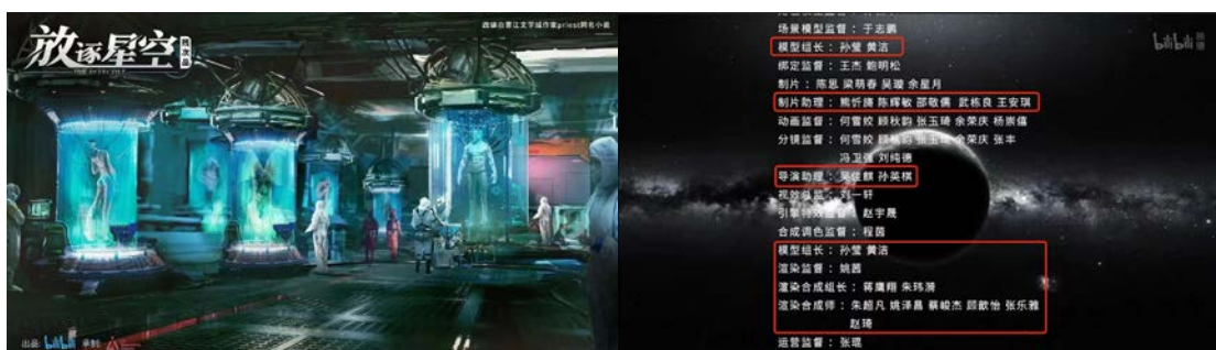
图4 师生参与《残次品》三维制作在影片尾署名