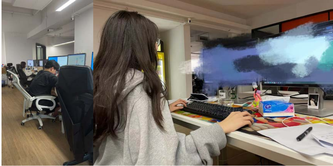
图4 影视制作中心在灵樨全新的实习环境中参加多工种实习实践