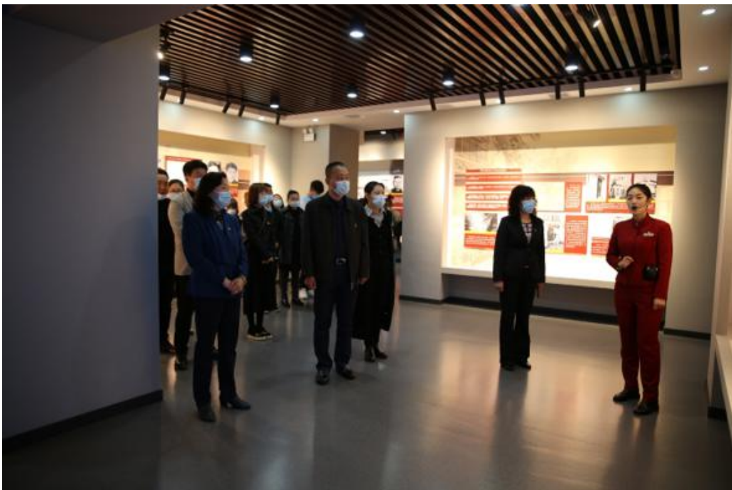
图为学校领导及师生代表参观中共满洲省委旧址纪念馆