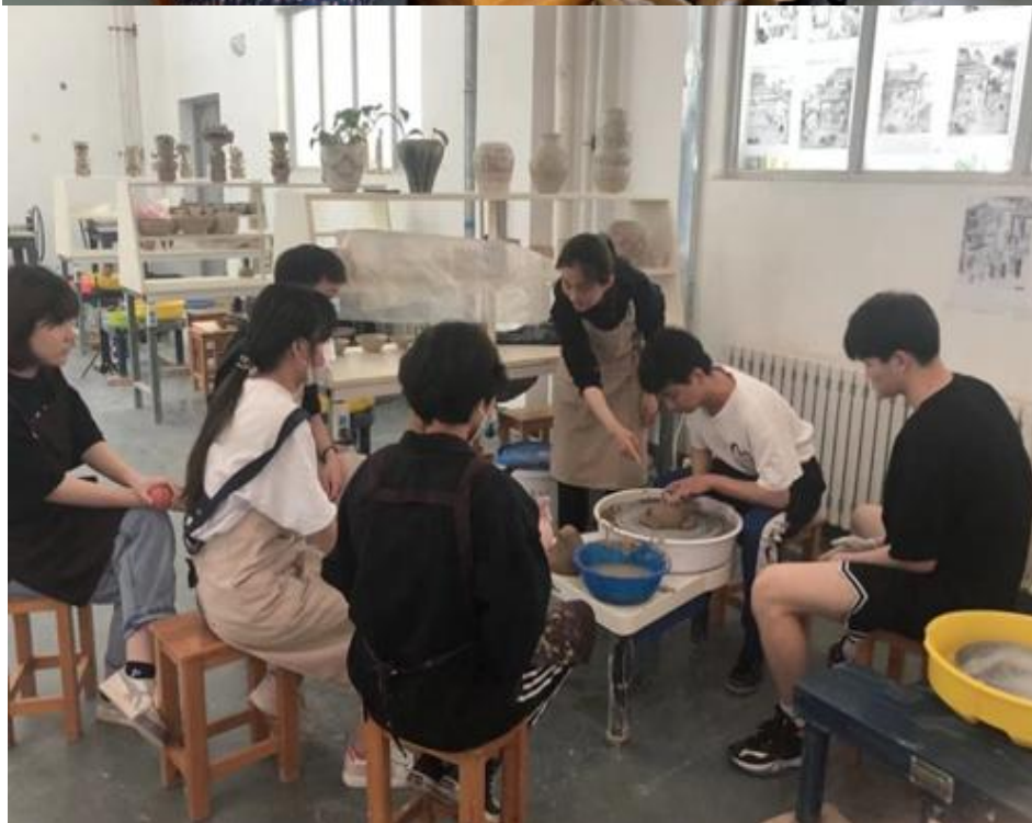
学生在首饰、陶艺教室体验制作过程