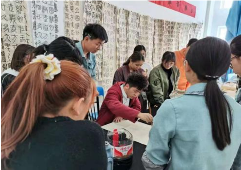
美术（书法）专业开放专业课堂，参加师生进行书写体验。