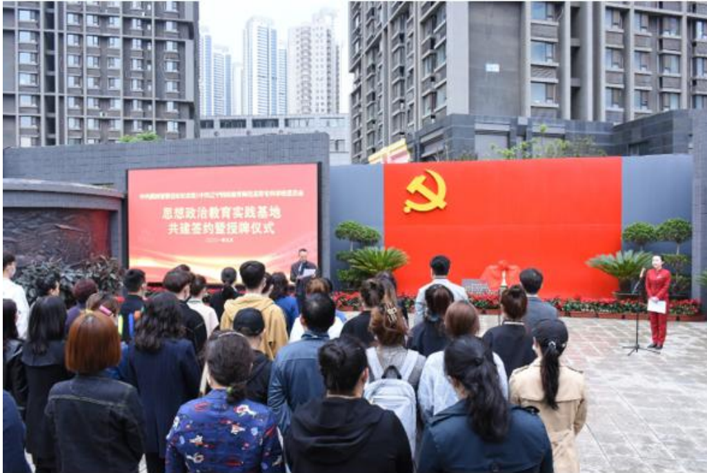
图为共建签约暨授牌仪式活动现场