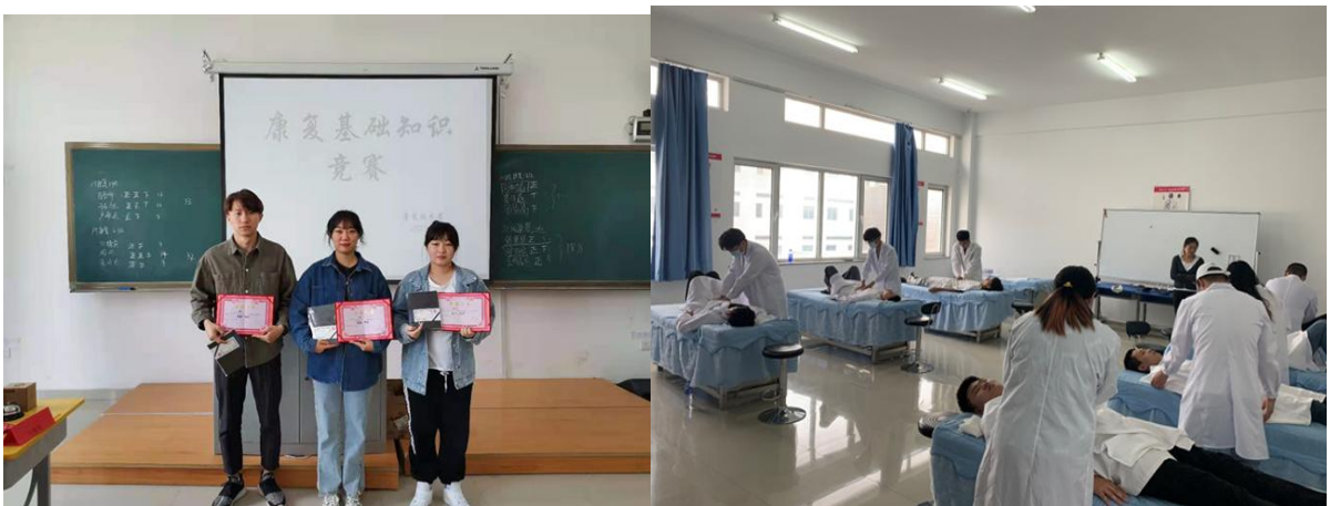
康复技术专业（推拿）学生在参加比赛

根据《教育部等十部门关于做好2021年职业教育活动周相关工作的通知》（教职成函【2021】5号）文件要求，为贯彻落实全国职业教育大会相关精神，展示职业教育发展的新成就，宣传职业技能创造美好生活，营造全社会关心支持职业教育的良好氛围。结合学校工作实际和我校学生专业特长，我校于5月22日—28日举办活动主题“技能：让生活更美好”2021年职业教育活动周。活动内容包括：比赛活动、教学过程观摩体验、教学成果及作品线上展览以及社会服务。通过此次活动，进一步让社会了解我校职业教育发展成效，营造全社会支持职业教育的氛围。一周来，通过精心策划，内外联动，多方参与，展示我校职教成果，办学条件和社会服务能力。进一步凝练了学校的文化底蕴，扩大职业教育的影响力。