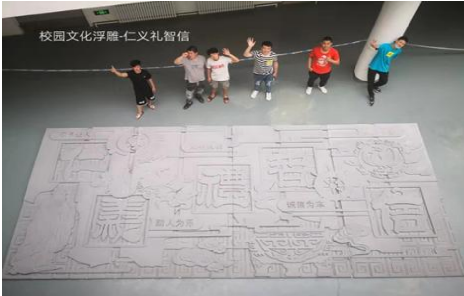
艺术设计专业木雕方向创作“仁义礼智信”文化浮雕