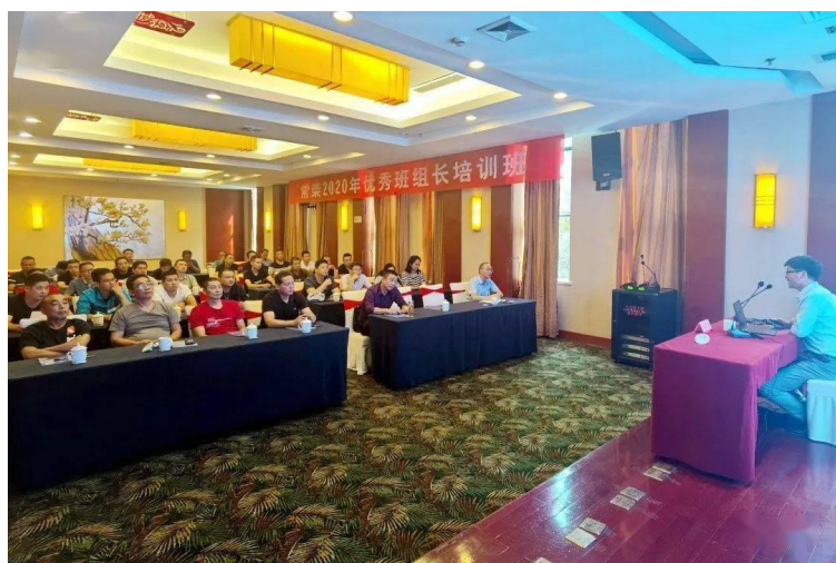
图 4.1 常柴股份有限公司《班组长管理能力提升培训》