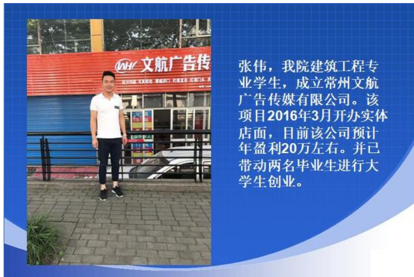
图 2.3 创业案例 2