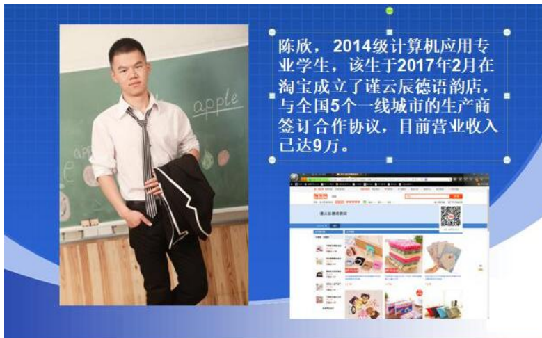
图 2.2 创业案例 1