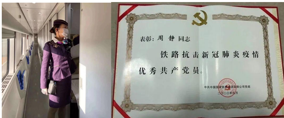
图 2.1 优秀毕业生周静工作现场及获奖证书

案例 1: 我院与上海铁路局紧密合作，共同构建校企合作平台，为学生提供课程实践，毕业实习与就业岗位，学院根据铁路各岗位需求制定人才培养方案，将铁路作业标准融合进课程标准，为零距离就业打下坚实的基础，2016 级高铁乘务专业对口就业率达 80%。我院 2019 届高度铁路客运乘务专业生、上海客运段高铁四车队列车长周静同志，被中国铁路集团有限公司党组表彰为“铁路抗击新冠肺炎疫情优秀共产党员”称号。