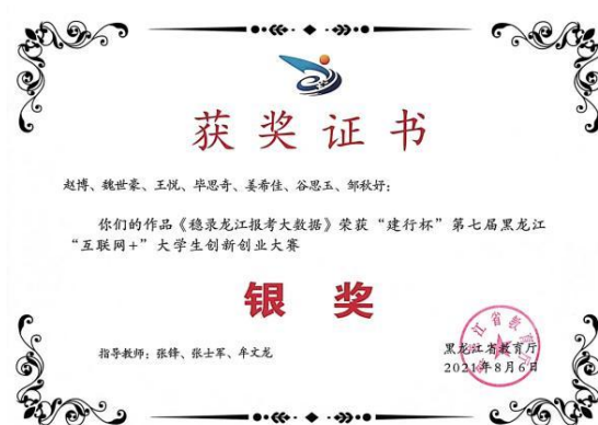
图7 互联网+创新创业大赛职教赛道获奖证书

2021年是我校创新创业教育和比赛实现历史性跨越的一年，经过职能部门和各系部的积极配合与系统指导，广大学生积极参与大学生创新创业实践，营造了浓厚的大学生创新创业参赛氛围，在2021鹤岗师范高等专科学校“互联网+”大学生创新创业大赛中共有参赛项目127项，参与学生900余人，通过一周时间的线上评审，共评出校级金奖10项、银奖20项、铜奖30项。按照省教育厅的名额分配，学校选派8个优秀项目参加第七届中国国际“互联网+”大学生创新创业大赛黑龙江赛区比赛，取得2银5铜的优异成绩。在第七届全国移动互联创新大赛东北赛区比赛中，获得银奖1项、铜奖2项，学校被评为全国移动互联创新大赛优秀组织奖。