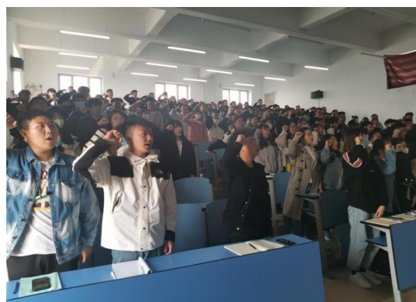
图4 新党员宣读入党誓词