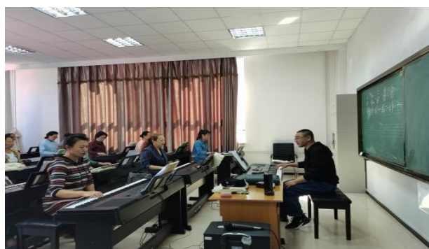
图 27 学校教师在老年大学任教