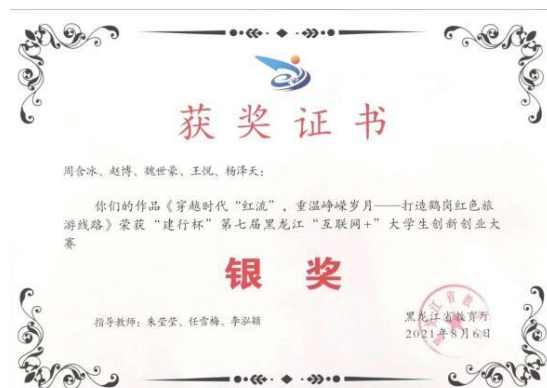
图8 互联网+创新创业大赛红旅赛道获奖证书