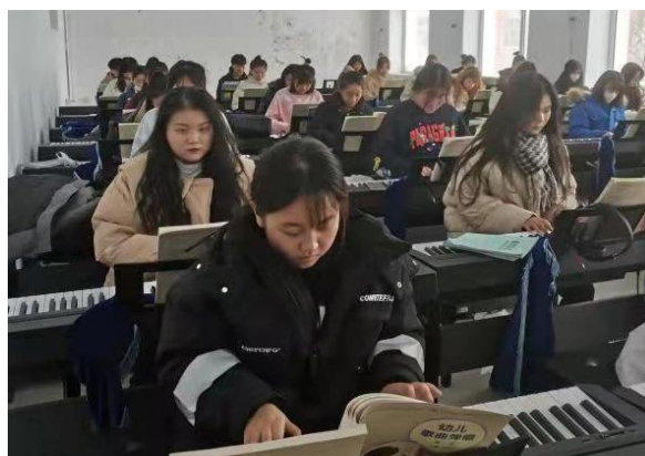
图 22 学生在电钢教室学习