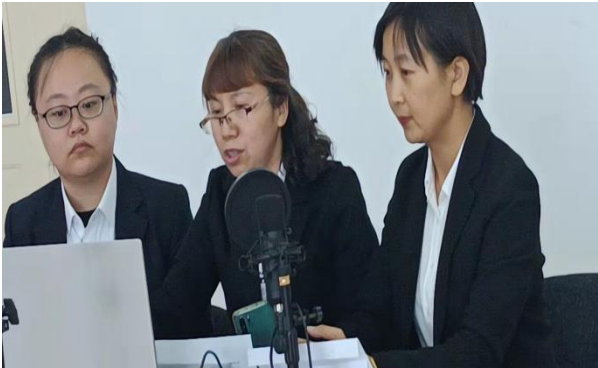
图 26 参赛团队正在答辩

充分发挥思政课教师优势，积极参与市委讲师团工作，讲解党的百年历史辉煌，讲解党的十九届五中全会精神，积极参加市委宣传部专题理论研讨，现已成为鹤岗市重要的理论研究基地。小学教育系党总支书记、心理健康研究所所长李志强副教授定期深入社区、医院、部队、中小学开展心理咨询活动，为各方面人群提供心理疏导服务，采取线上线下两种方式回答群众心理健康问题，为促进家庭和谐和社会稳定贡献了高校智慧。选派 15 余名优秀教师到鹤岗市老年大学任教，承担钢琴、舞蹈、美术、健美操、文学鉴赏、艺术鉴赏等课程，广大教师展示了专业素养和职业道德，得到了鹤岗市老年大学和老同志的充分肯定。