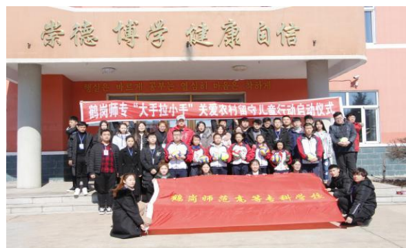
图 32 学生社会实践活动