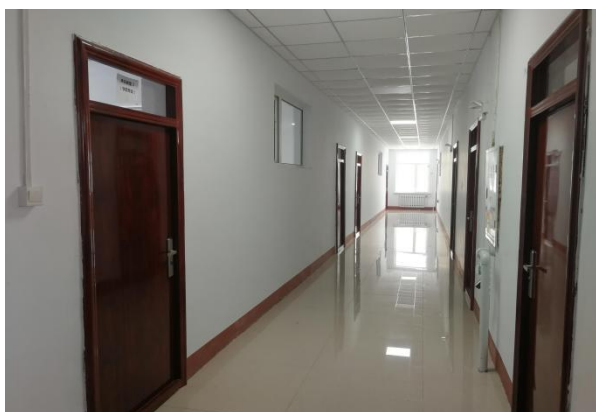
图 21 改造后的实验楼走廊

坚持以教学为中心，以学生发展为主线，以项目建设为引领，投入专项资金改善办学条件，自 2019 年以来，学校投入近 700 万元对艺体楼和实验楼进行装修改造，对艺体楼进行篮球馆天棚改造、运动地板更新改造、供热管线更新改造、更新门窗、全楼粉刷、外墙保温改造，对实验楼进行屋面防水改造、外墙保温改造、室内琴房改造、供热管线更新、供电系统改造、全楼粉刷，艺术体育教育和自然科学实验条件得到根本改善。