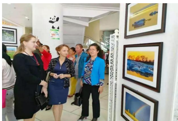
图 23 俄高校教师参观我校手工展室

我校与俄罗斯友好合作关系为两国国家关系健康稳定发展发挥了积极的作用。中俄两国人民因交流而相互了解，因了解而彼此尊重，而尊重一个国家的文化，就是尊重这个国家本身。我们相信，在中俄两国人民的共同努力下，两国的文化交流之树必将根深叶茂，硕果累累。