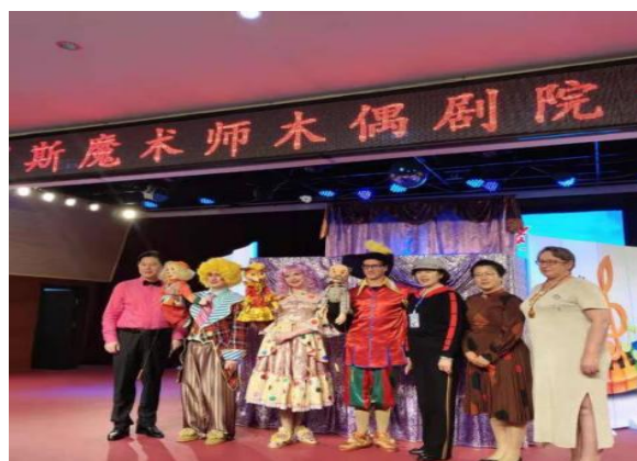
图 24 俄木偶剧团来我市演出