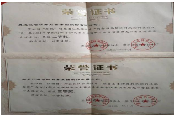
图 25 创新方法大赛获奖证书