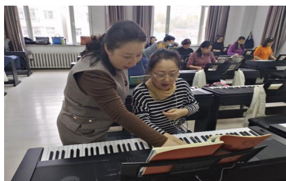
图 28 学校教师在老年大学作指导