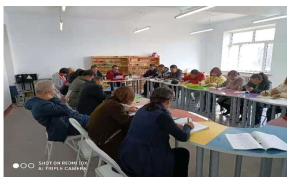
图 18 数学教研室教学研讨