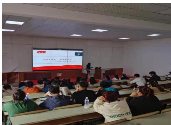
图3 学校组织新党员党史学习教育

学校党委始终把发展党员工作作为重点工作来抓，明确党委、党支部书记为党员发展工作“第一责任人”，把发展党员作为学校思想政治工作的重要目标，作为基层党组织目标考核和基层党总支书记工作述职的重要内容。2020-2021学年，先后举办入党积极分子、发展对象短期培训班2次，采用网络授课方式举办发展对象短期培训班1次，共发展学生党员96人，占总人数的95.9%；少数民族党员9名，占总人数的7.4%。