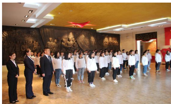
图 31 疫情防控学生志愿者活动

我校团委认真贯彻学校党委的总体工作思路，广泛开展大学生志愿者和社会实践活动，定期深入社区、学校、敬老院等单位开展献爱心活动，为经济社会发展传递正能量，引导大学生树立了解社会、服务社会的意识，发动团员青年积极参加志愿者活动，得到了全社会的高度评价，2020 年被评为鹤岗市优秀团组织，2021 年 4 月荣获全市“五四”红旗团委，评为全市优秀青年志愿服务集体，黑龙江省青年大学习活动先进集体。