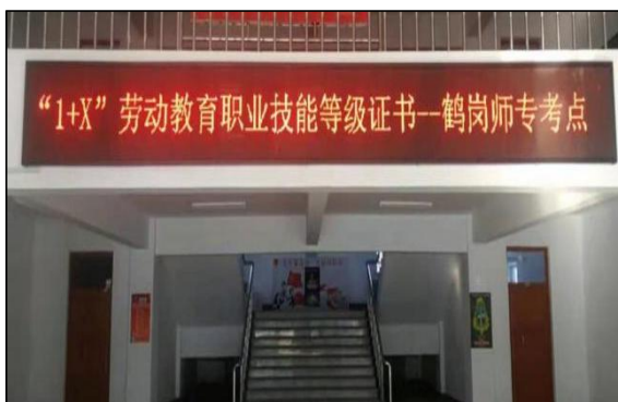
图 16 鹤岗师专考点