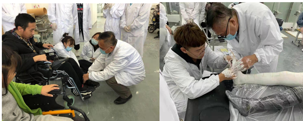
假肢与矫形器专业学生为肢体残疾学生制作矫形器