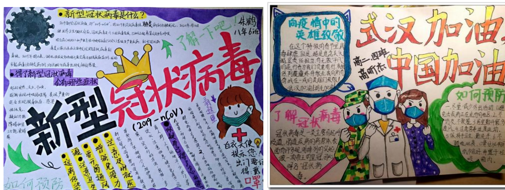
部分参赛学生作品展示

为了进一步展示我校职业教育改革发展成果和职校学生风采,根据省教育厅关于职业教育活动周的工作安排,我校于 11 月 8 日—14 日举办活动主题“人人出彩,技能强国”2020 年职业教育活动周。活动周包括线上知识分享、线下社会服务等一系列丰富多彩的活动,大力宣传职业教育,让社会了解、支持职业教育,从而扩大职业教育的影响力,使职业教育宣传周真正成为宣传职业教育思想和理念的阵地、展示职业教育成果的舞台。