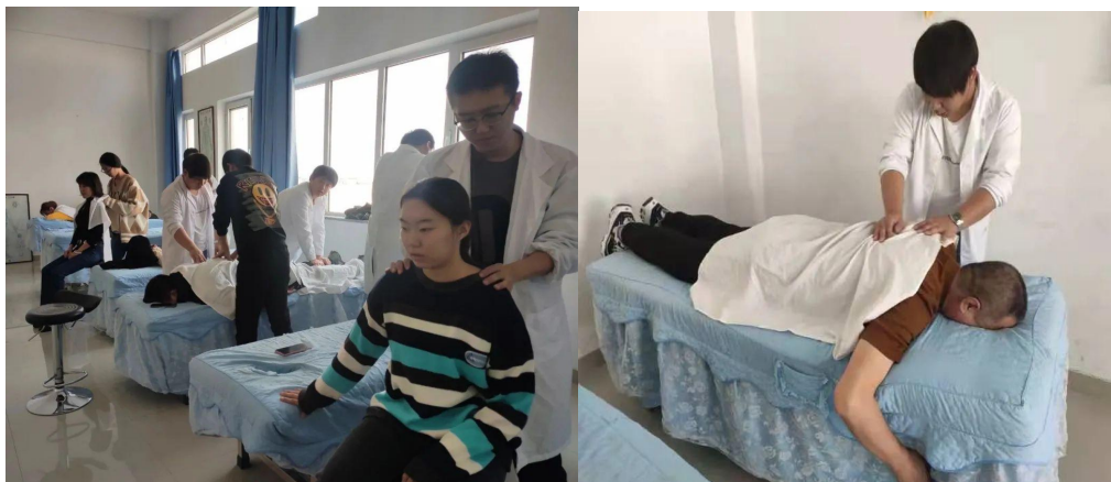
学生在实践按摩技能