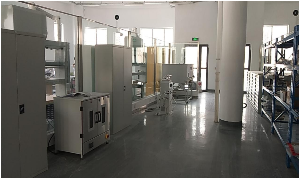
假肢矫形器实训室