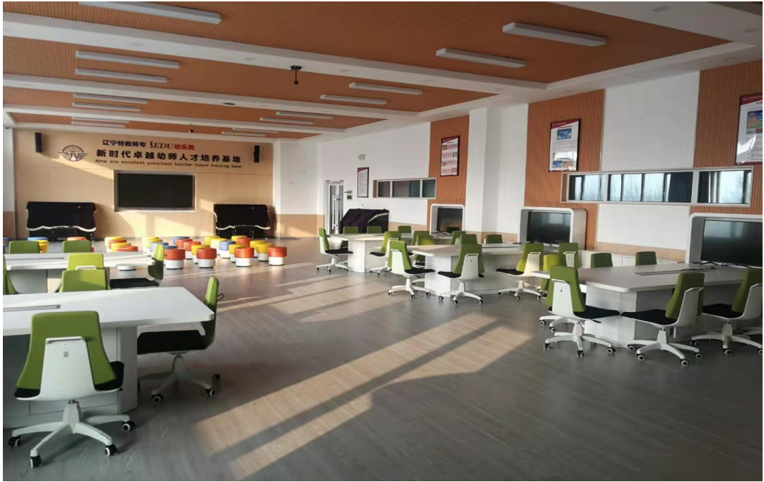
教育系 智慧化实训室