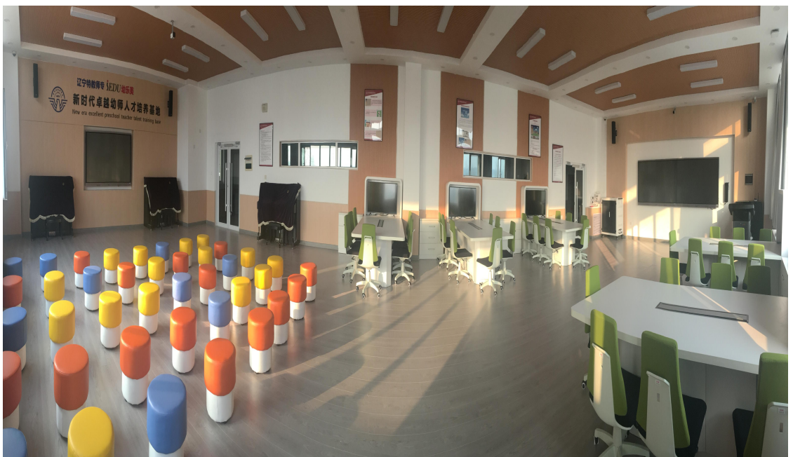
教育系 智慧化实训室