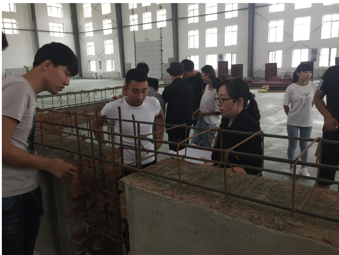
建筑施工技术实训教学