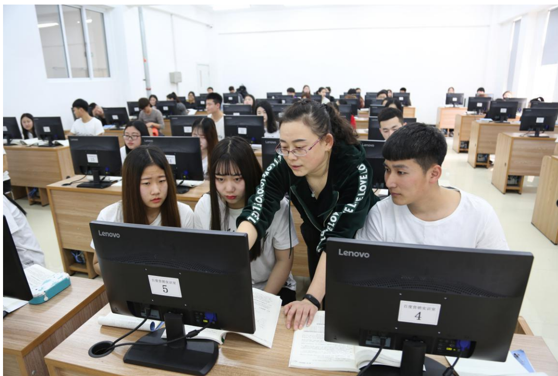
程序设计实训教学