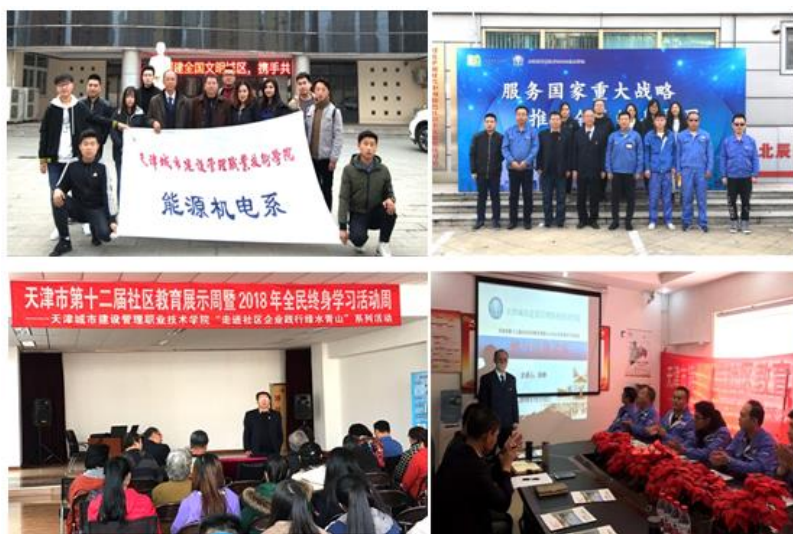
图8 天津市 2018 年全民终身学习活动周主题活动