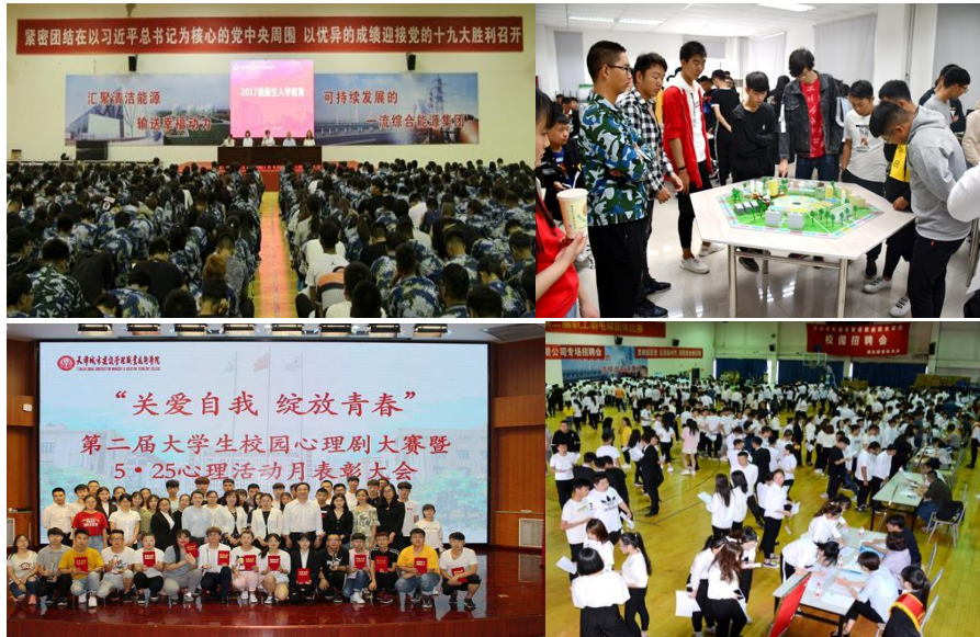
图7 发挥支部堡垒作用，实施全过程育人

完善服务学生的机制建设。 一是建立“两个体系”，即：学生德育评价体系（含“学生心理健康工作”和“学生综合测评”两个子体系）和“三全育人”体系；二是健全学生思想政治教育长效机制，建立“党委统一领导、党政齐抓共管、院系两级负责，全院紧密配合、学生自我教育”的思想政治教育工作领导体制和工作机制；三是开展“五项教育”，思想品德教育、使学生形成自信感恩的品质，职业发展教育、使学生形成求学上进的品质，身心健康教育、使学生形成诚信友善的品质，文化素质教育、使学生形成担当守正的品质，创新创业教育、使学生形成爱岗敬业的品质。