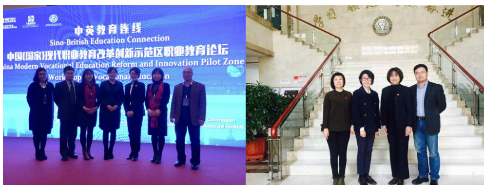
图6 开展国际合作提升国际影响力

中英双方就人才培养、师资培训、师生互访、现代学徒制专业、课程开发及教学研究等领域开展合作洽谈，并在教师专业课程英语授课能力培训、现代学徒制专业标准开发、在第三国合作输出教育资源等方面达成合作意向，并签署合作备忘录。