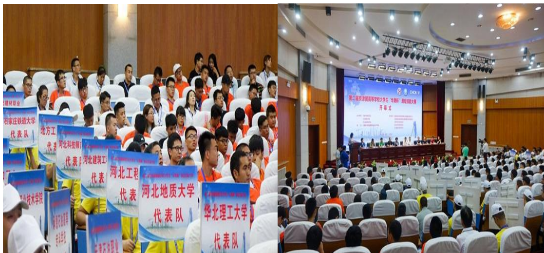
图4 第二届京津冀高等学校大学生“华测杯”测绘技能大赛