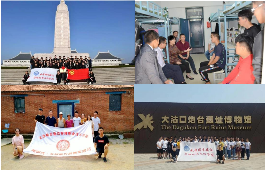
图1 “第二课堂”育人活动丰富多彩