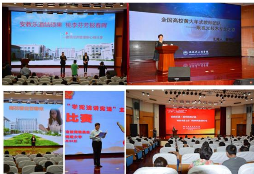
图5 “安教乐道·现代职教之品”师德师风建设研讨会

开发优质资源，提升信息化教学能力。通过骨干专业项目建设，开发了建筑工程技术、建筑装饰工程技术两个专业 8 门核心课程教学资源；并建设了 2 个专业模拟仿真实训和紧密联系生产实际装饰工作室。通过教师信息化教学能力提升培训，不断提高教师的信息素养，促进信息技术环境中教师角色、教育理念、教学观念、教学内容、教学方法以及教学评价等方面的改革。更新了教务管理系统，不断提高管理和服务水平。