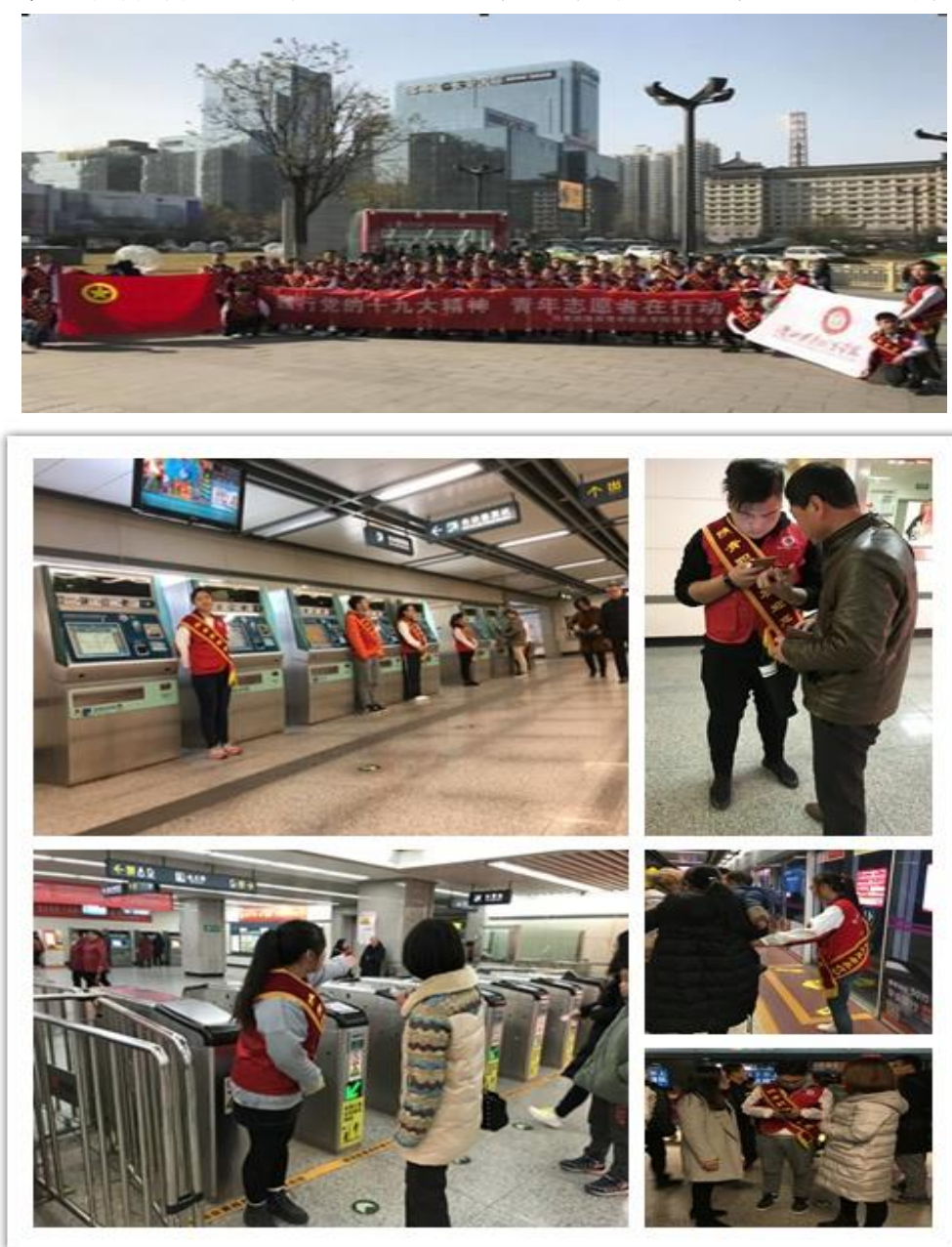
图 4.3 “文明地铁、美丽西安” 志愿者服务队开展地铁引导服务工作

乘车、文明乘梯，提供安检、购票咨询，突发故障组织疏散乘客等。每个志愿者都在自己的岗位上认真地为乘客们服务，恪尽职守地做好每一项工作，耐心地回答来往乘客们的每一个问题。第一次来西安的外地乘客在志愿者们的指引下顺利进站，不熟悉搭乘、换乘地铁流程的乘客在志愿者们的帮助下顺利购票、乘车，青年学子志愿者们用自己的热情服务和实际行动传递着团结、互助、友爱、进步的志愿精神。