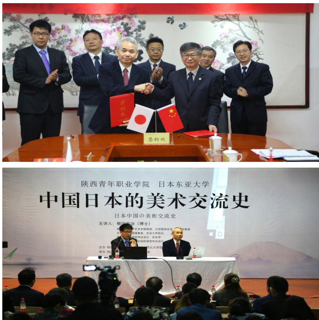
图 5.1 日本东亚大学校长栉田宏治一行来院访问交流

访问交流。在灞桥校区召开座谈会，讨论了两校未来的合作框架，即从学生留学、短期交流开始，逐步拓展到教师及科研方面的合作交流，并签署了交流与合作协议书。栉田宏治参观了学院衍纸工作室和画室，并为文化传媒系师生作了题为《中国日本美术交流史》的演讲，阐述了从古至今中日两国在美术方面的交流与影响，分享了当代日本艺术设计方面的知识，为学院与日本东亚大学搭建了互相交流学习的桥梁全方位合作奠定了基础。