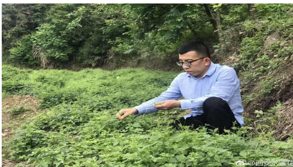
图 4.1 学院助力电商创业, 把陕西优质农产品推向全国