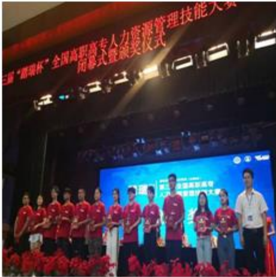
图 3.2 管理系学生获第三届“踏瑞杯”全国高职高专人力资源管理技能大赛一等奖