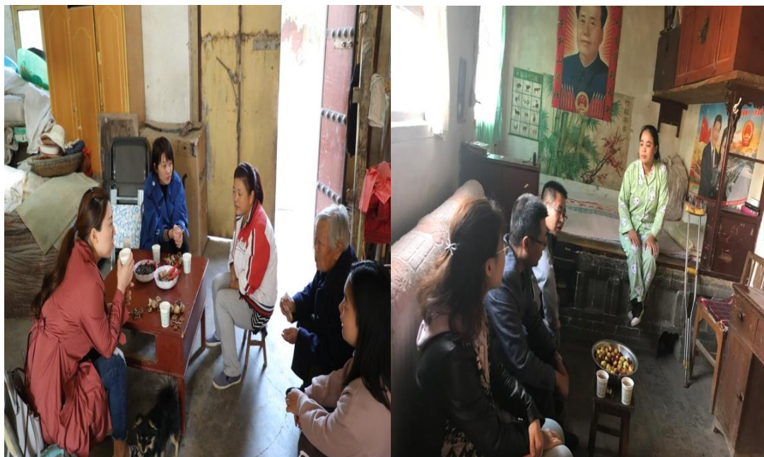
图 2.4 走访建档立卡户家庭

心，提升就业竞争力，做细做实就业帮扶措施，切实保障了每一名建档立卡户家庭学生安心就学、顺利完成学业，实现全部就业，兑现了承诺，体现了责任。