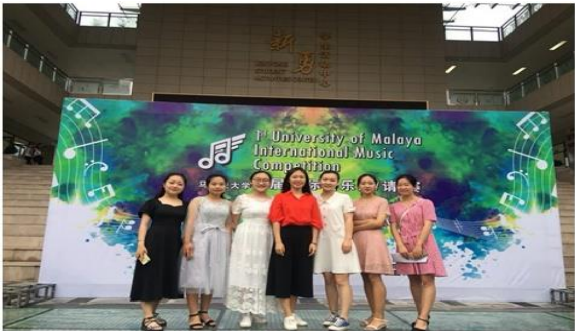
图 5.2 公共事业系学生在国际钢琴大赛中喜获大奖

公共事业系学前教育专业学生在指导教师的带领下赴新勇学生活动中心参加马来西亚大学和陕西师范大学联合主办的2018年首届国际器乐邀请赛陕西赛区选拔赛。本次大赛设立钢琴、民乐、合奏三个比赛项目，参赛的六名学生经过激烈的角逐，最终获钢琴合奏组一等奖1项、钢琴独奏公开组一、二、三等奖各1项，优秀教师指导奖1项。