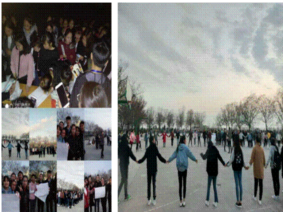
图 2.3 学院启动“善爱自己，追逐梦想”阳光护航心理健康活动