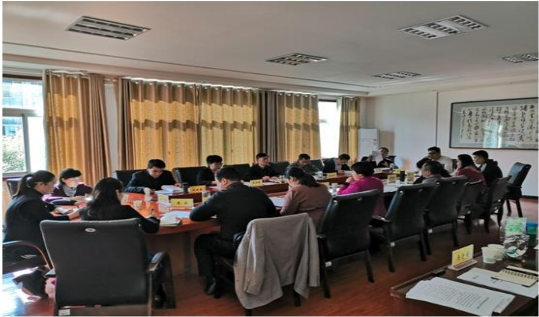
图 6.1 学院召开 2018 年度诊改工作推进会