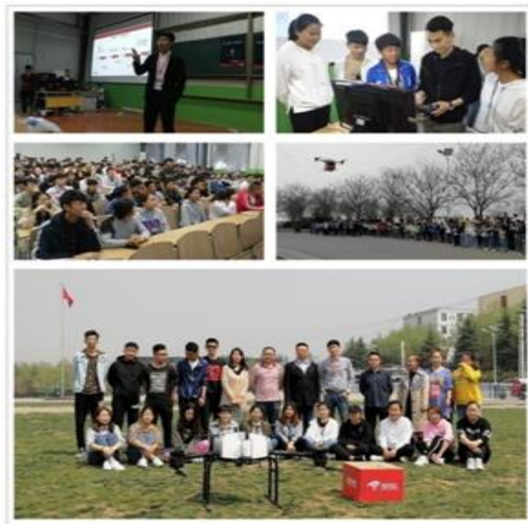
图 3.5 “京东无人机”物流配送创新创业公开课走进学院