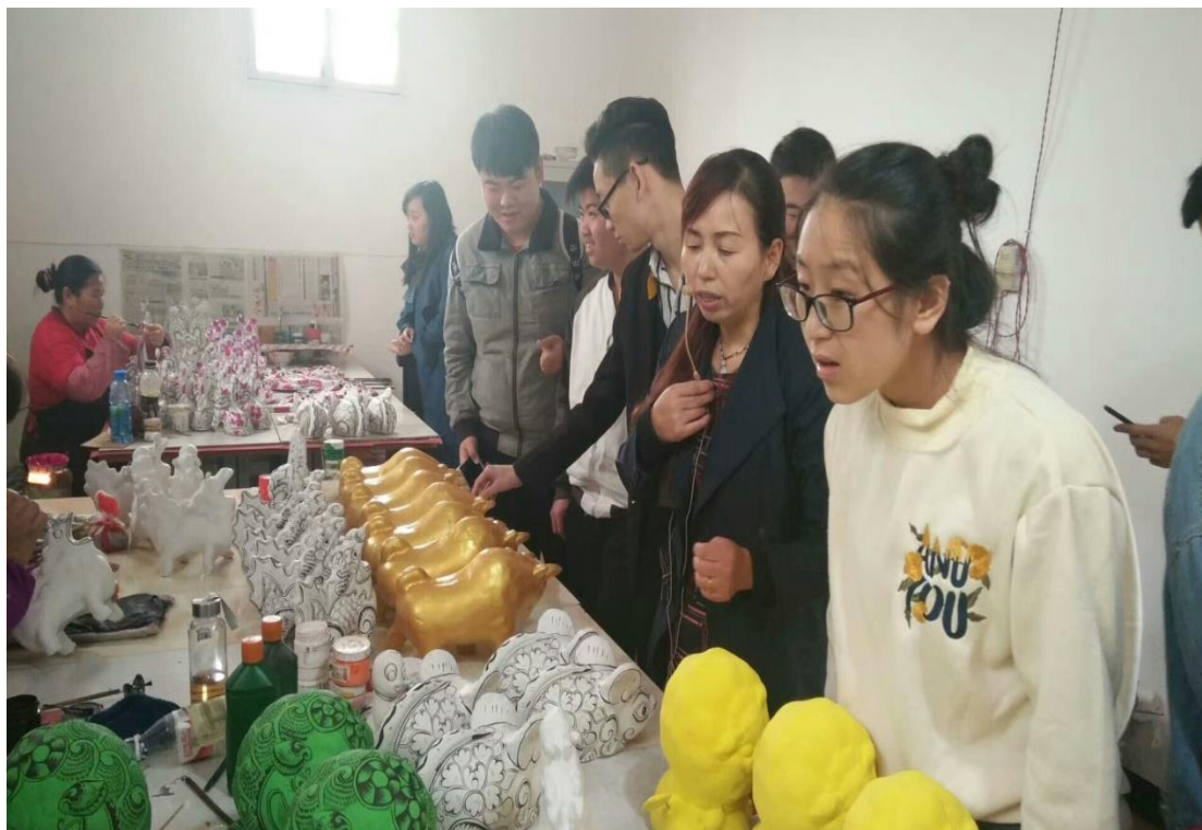
图 3.1 文化传媒系立足陕西民间艺术拓展专业特色