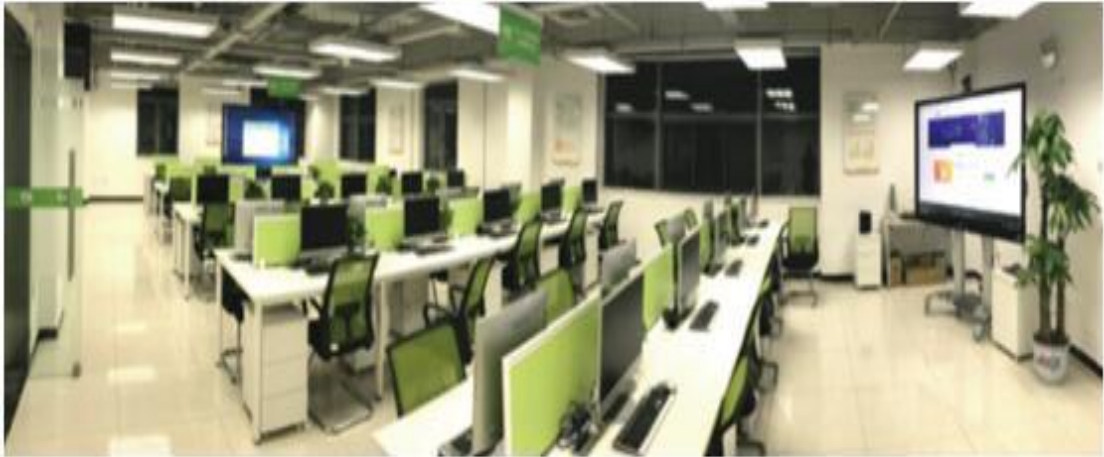
图 3.3 财经系与校企合作企业共建校外共享实训中心

程体系改造、课程建设、教材建设、实训室建设等都有了全新的合作样本。学生不仅实现了在 500 强企业就业的目标，也使得专业发展、合作模式走在前列。