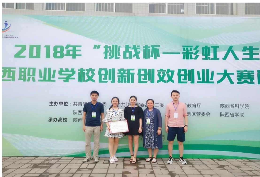
图 3.4 艺术系学生获“挑战杯—彩虹人生”创新创业大赛银奖