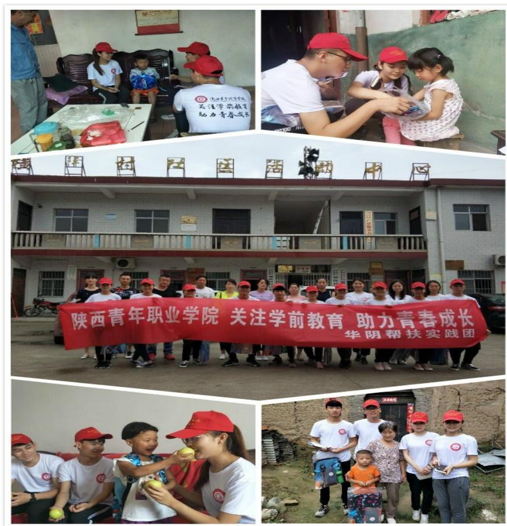
图 4.2 “青春助力脱贫攻坚”暑期专项志愿服务支教活动

得到村两委和村民的热情赞颂和肯定，而且对于学生志愿者是一场无声的爱的教育，志愿者们表示要认真学习专业知识，提高专业技能，以后有机会多参与此类社会实践活动，贡献自己的力量，做一个有爱心、有奉献精神，积极传播正能量的新一代大学生。