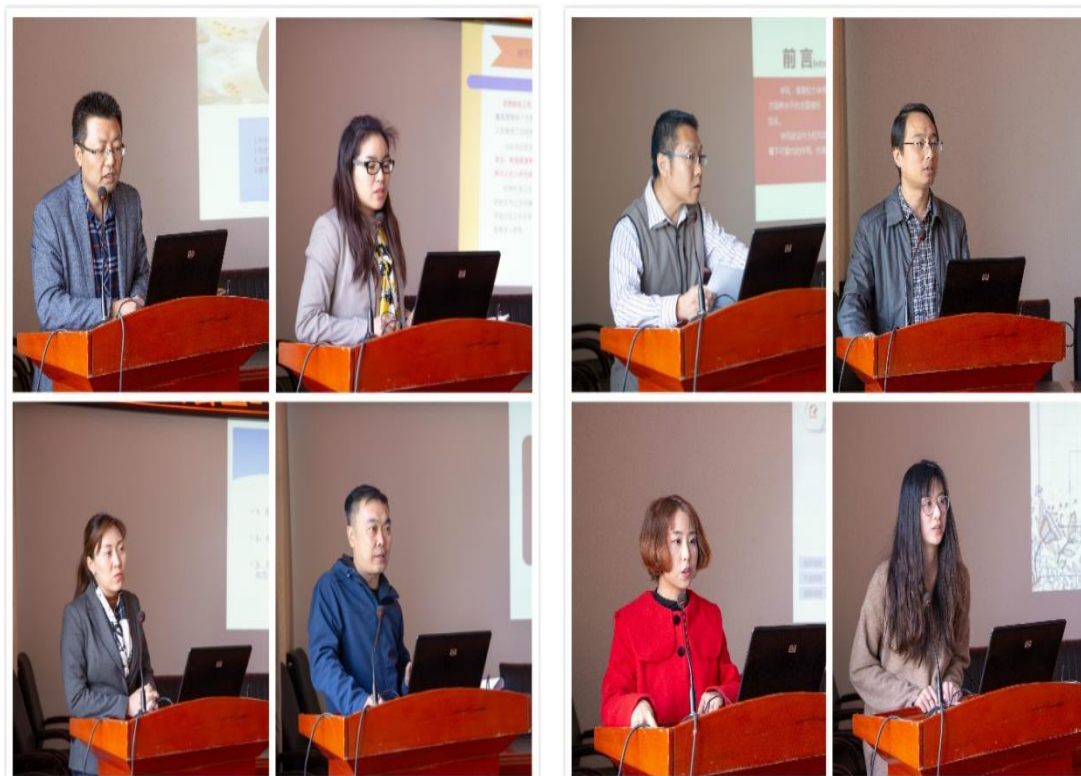
图 2.1 学院召开 2018 年学生思想政治教育调研交流会

析了原因并提出了改进措施，取得了丰硕的调研成果，有效促进了学院育人工作提升，同时也推动辅导员队伍在职业化专业化道路上大踏步前进，学工干部的科研能力、育人水平得到了显著提升。