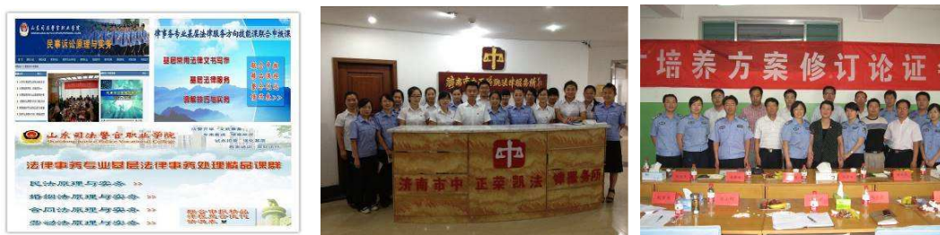
图 6 法律事务专业人才培养情况

校局（所）合作模式进一步加深。在与山东省基层法律工作者协会和山东省各地市司法局的合作下，建立覆盖全省的实习基地，并做到实习就业一体化。基层司法行政方向学生全部到司法所实习并就业；根据省司法厅文件，该专业有意愿到基层法律服务所实习的学生，实习合格后，可根据省司法厅统一部署，按照双向选择原则，由基层法律服务所通过考核录用程序逐级申报，经省司法厅审批并参加岗前培训合格后，颁发《基层法律服务工作者执业证》。