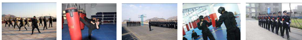
图 4 学生社团活动开展情况

法》，明确各类社团设立宗旨、定位、组织机构、活动流程、经费使用管理等社团工作细则，实现社团管理的科学化、规范化、制度化。将学生社团活动实施学分认定，纳入学院人才培养方案，围绕专业设置、专业特色的实际情况，引导学生组建专业社团，促进第二课堂专业化、课程化发展。完善大学生社团自身建设，以丰富多彩的社团活动为纽带，增强学生对社团组织的认同感和归属感，提升社团发展的生机与活力，实现学生社团健康可持续发展。推进社团内涵建设，创新工作思路，拓展活动形式，加强质量管理，以学生为主体，积极开展各类集知识性、学习性、趣味性于一体的丰富多彩的特色社团活动。依托专业打造学术型社团，强化对学生职业精神和专业素质的培养，促进学生全面发展。学院突出“警”字特色，成立了国旗护卫队、队列小教官队、擒敌拳队、应急棍队、警棍盾牌队、防暴处突队、跆拳道队等等，学院目前共注册成立学术科技、兴趣爱好、公益实践、其他类等四大类学生社团 31 个，社团成员 3414 余人。作为学院开展校园文化活动的的主力军，学生社团以塑造自我为出发点，开展了形式新颖、内容丰富的活动，进一步拓展了寓教于乐的素质教育新途径。