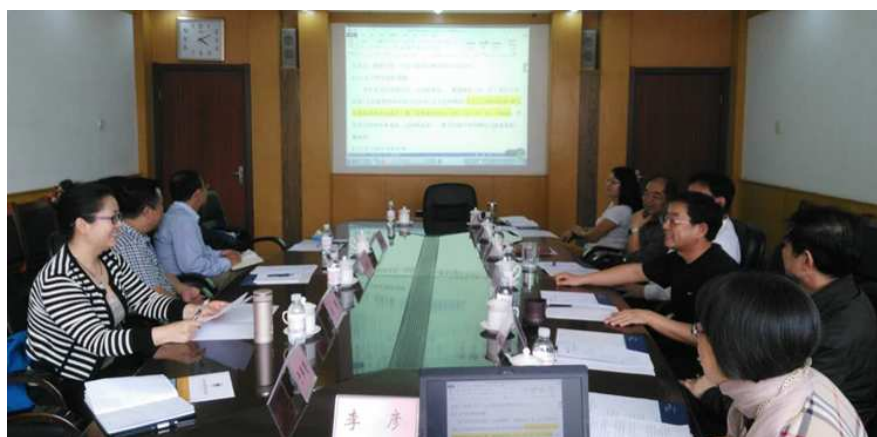
图 7 与校外专家共同研讨专业顶岗实习标准

《法律事务专业顶岗实习标准》是教育部 2015 年行业指导职业院校专业改革与实践项目，于 2015 年 10 月立项，项目组成员通过细致的统计、分析和不断的论证、完善，2016 年 9 月圆满完成了实习标准的研究制定工作。