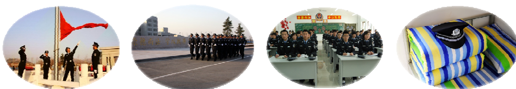
图3 学生警务化管理情况

技能训练，形成“练战”一体化；将警察文化与校园文化相互渗透，将警察顾大局、讲团结、能吃苦、打硬仗、服从命令、听从指挥、甘于奉献、敢于牺牲、雷厉风行、作风优良等品质，渗透到教学与训练之中，培养学生的警务素质，满足社会对警务人才的需要。