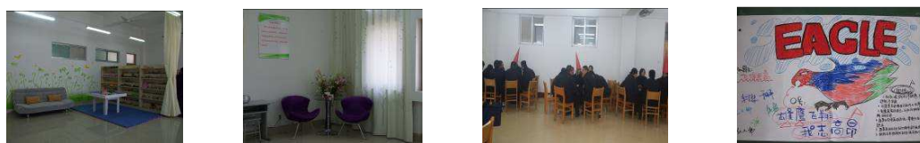
图2 学院心理健康教育中心建设及活动情况

育中心，配备了标准化的心理咨询室，建有大学生心理成长协会，开通了心理热线、QQ群等，拓宽了学生心理咨询和辅导的渠道；加强心理健康教育队伍的建设，2018年新增1名专兼职心理学教师，形成一支结构合理的师资队伍共计17名，适时面向专职心理教师、辅导员、心理成长协会会员组织开展专业理论和实务技能培训；组织开展“5.25心理健康活动月”、“走进新生”系列心理教育宣传等丰富多彩的、形式多样的心理健康教育活动；对新生进行网上心理健康状况普查，建立心理档案；完善了心理危机应急处置机制，对特殊群体给予了密切的关注和干预，迄今未发生一起因心理危机而造成的伤害事件。