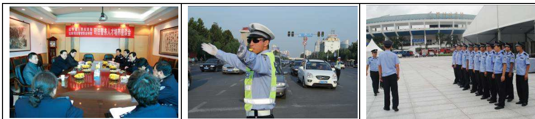
图 5 司法警务专业建设及学生实习情况

该专业学生政治法律素质高、实战能力强、社会形象好，就业实现省内外区域全覆盖、公检法司行业全覆盖，公务员、事业单位、高薪职业等高层次就业特色鲜明。