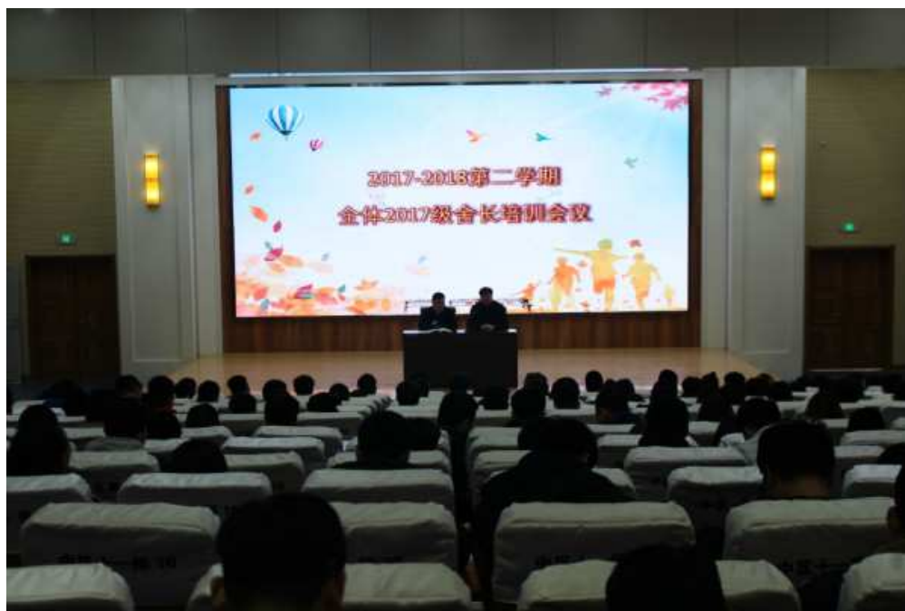
图 1-8 学生处召开 2017 级全体社长培训大会

学生公寓在学校发挥的作用日益重要，学生公寓不仅是学生学习、生活的场所，而且也是对学生进行思想教育的主要阵地。公寓文化对学生的人生观、价值观有着潜移默化的影响，起到润物细无声的作用，通过公寓文化建设，把我院学生公寓建成“思想政治工作的阵地，先进文化传播的阵地和学生学习成才的阵地”。坚持思想政治教育为先导，以养成教育系列活动为中心，以“管理为手段、服务为纽带、育人为根本”的学生工作理念指导，深化学生管理体制，创新管理模式为导向，建设适应当代社会发展所需的文化育人基地。