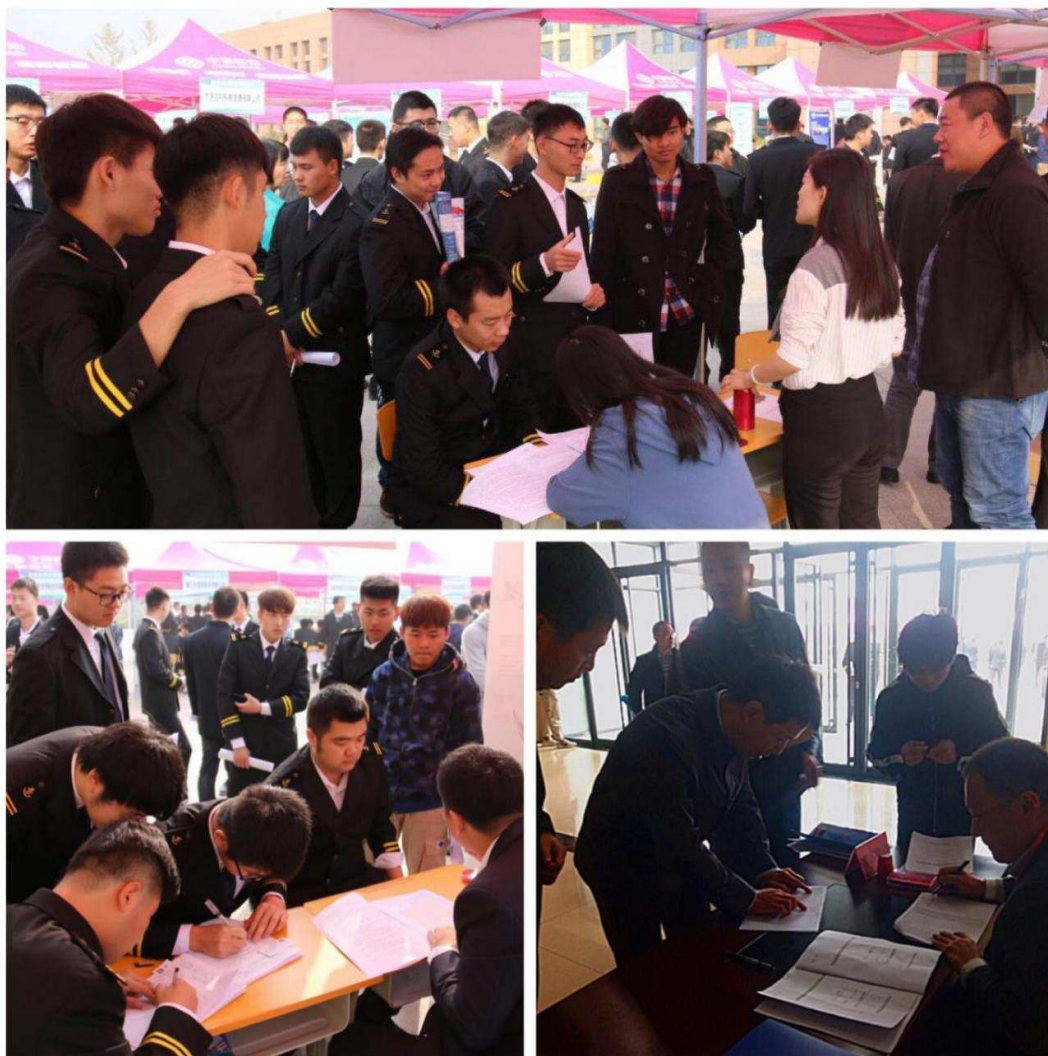
图 1-1 双选会现场

今后我校将陆续邀请更多企业来校进行就业宣讲交流，加强与企业之间的合作联系，邀请更多企业参与到学校毕业生就业工作中，为毕业生提供更多的就业机会，进一步提升毕业生就业工作质量。