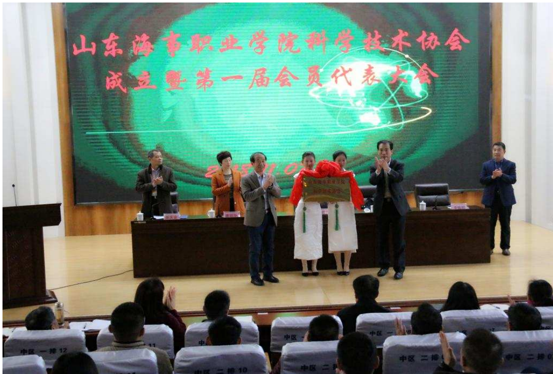
图 5-2 揭牌仪式