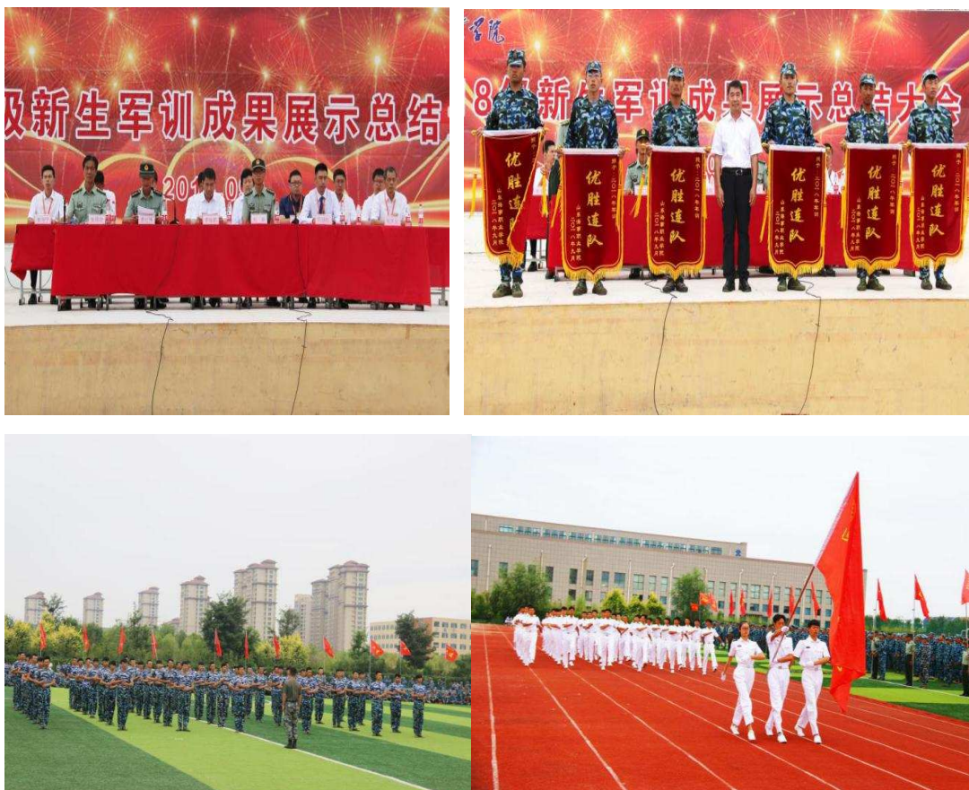
图 1-5 2018 级新生开学典礼暨军训展示现场

的管理来适应学生的发展为目的。我校坚实贯彻实施准军事化管理机制，致力于培养高素质的航海类应用型人才，根据“四个全面”战略布局，坚持立德树人根本任务，认真贯彻落实五大发展理念，深入实施航海类专业人才培养模式，以促进学生全面、可持续发展能力为目标。