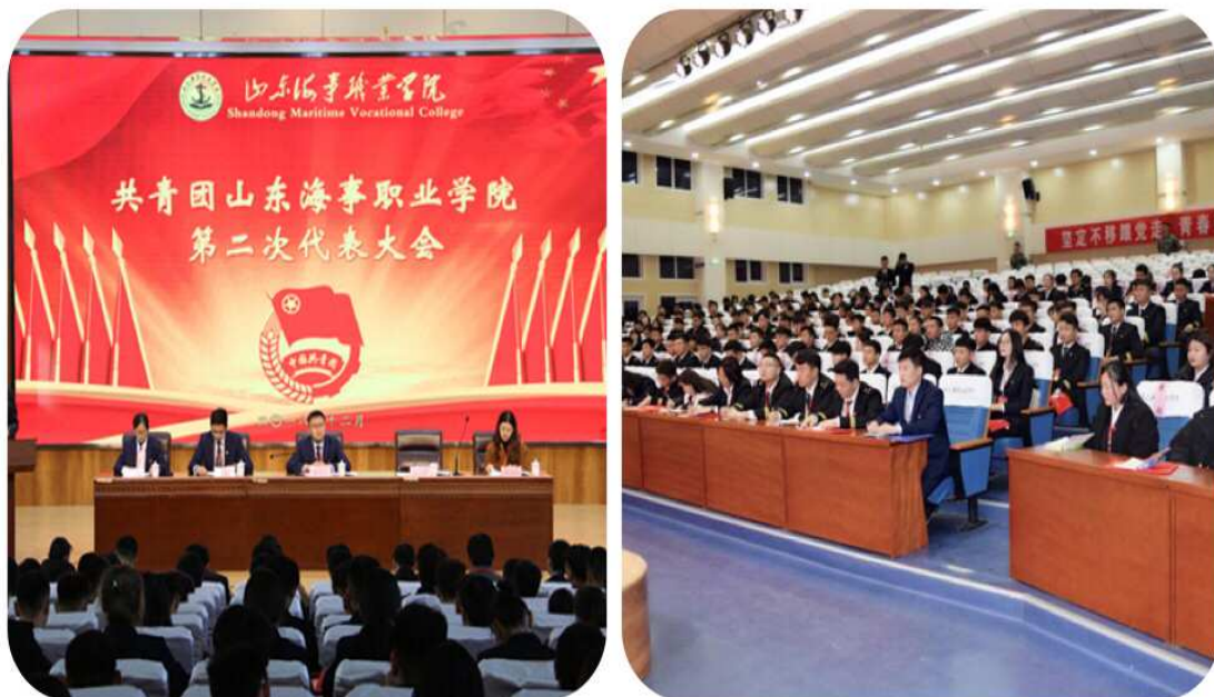
图 1-9 共青团山东海事职业学院第二次代表大会

(4) 加强团学干部队伍建设。大力加强团学干部的政治教育，认真开展“不忘初心，牢记使命”主题教育，推进“两学一做”学习教育常态化制度化。规定。稳妥慎重地开展不合格团员处置和团组织整顿工作。