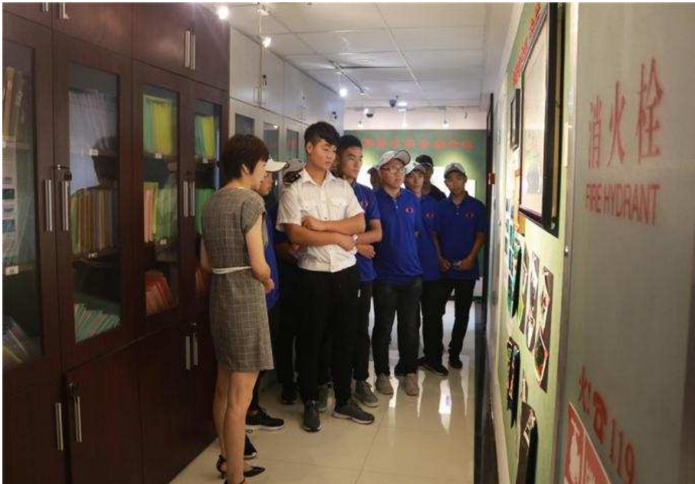
图 2-4 校企合作“华洋班”教学掠影

该班级于 7 月 5 日正式成立，其学员通过学校与企业双重选拔主要来自航海技术专业、轮机工程技术专业。根据双方校企合作育人协议，青岛华洋海事服务有限公司将为“华洋班”学员提供上船实习机会，让学生能够快速熟悉水手和机工的相关工作流程和工作内容，提高学识和动手操作能力；同时也为实习期间的学员给付实习报酬，为其家庭减轻一定的负担；另外公司还提供覆盖全体“华洋班”学员的奖学金和助学金。