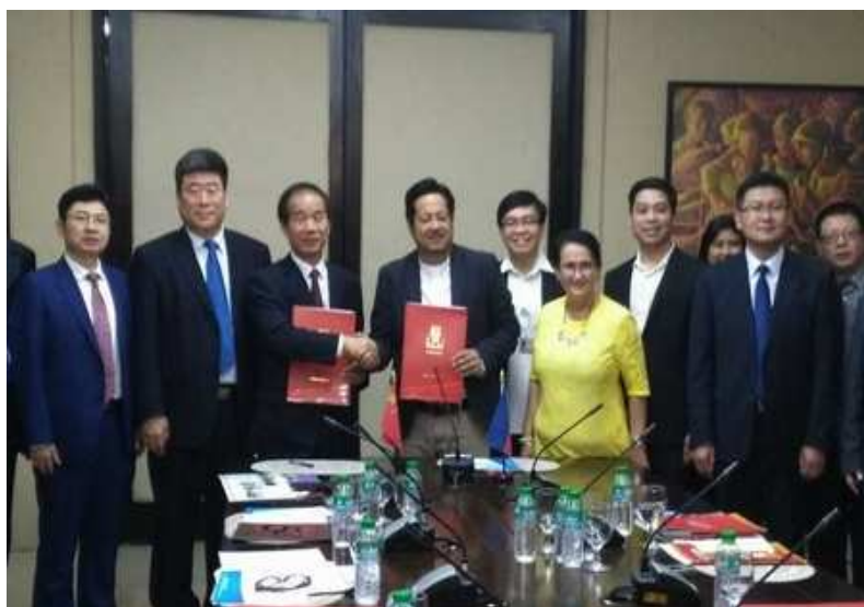
图 4-1 我校与莱西姆大学签约现场

2018 年我校航海专业群引入菲律宾莱西姆大学航海类专业教学计划，共同制定人才培养方案，推动航海专业设置、教学内容与船员培训、考核标准与莱西姆大学的对标接轨，成立山东海事职业学院—莱西姆大学航海专业交流会。以专业交流会为依托，两校就航海专业的国际行业标准、国际就业市场趋势等方面开展交流互动和信息共享，逐步建立起中菲航海高等教育长期交流机制。