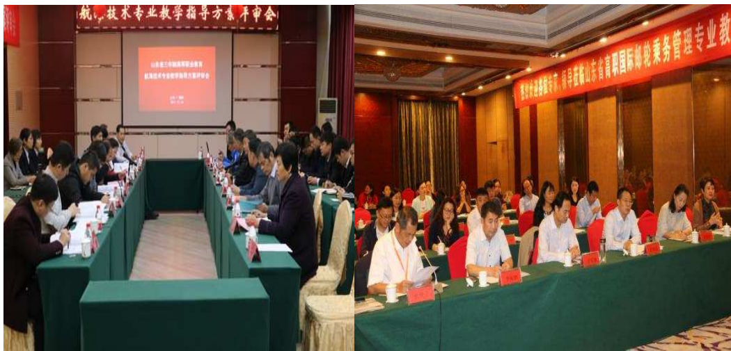
图 2-2 航海技术专业教学指导方案评审会