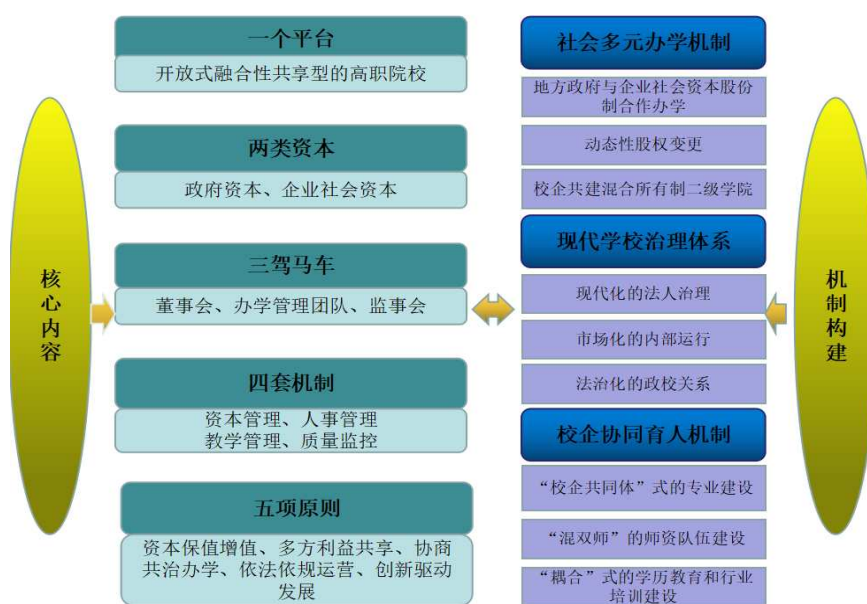
图 3-1 混合所有制办学“山海模式”

五项原则”的高职院校混合所有制办学“山海模式”，受到社会各界的普遍认可，并在全国部分院校进行复制推广。该模式，系山东省职业院校混合所有制改革唯一的办学实践试点项目，荣获 2018 年职业教育教学成果国家二等奖、省职业教育教学成果特等奖，在全国 6 所职业院校复制推广，涉资 90 多亿元，2018 年 1 月学院被推举为“全国职业教育混合所有制办学研究联盟”名誉理事长和秘书长单位。