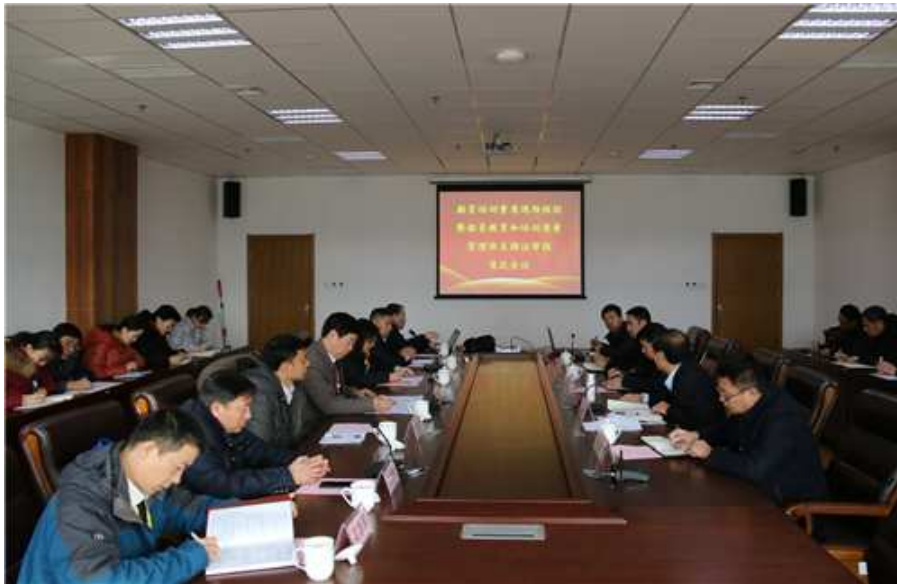
图 2-8 船员培训资质现场核验暨船员教育和培训质量管理体系会议