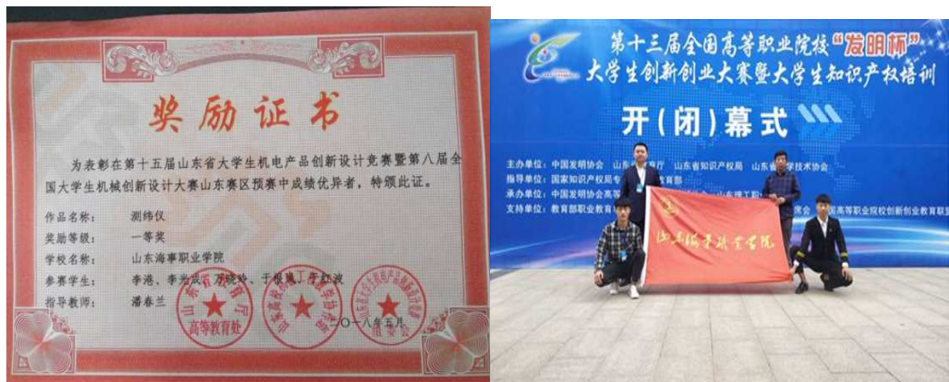
图 2-5 学生获奖现场及证书

我校王春艳、王耀强、刘甜甜老师获山东省教学能力大赛二等奖，季丹丹老师、张燕燕老师也分别获得不等名次的省级奖项。