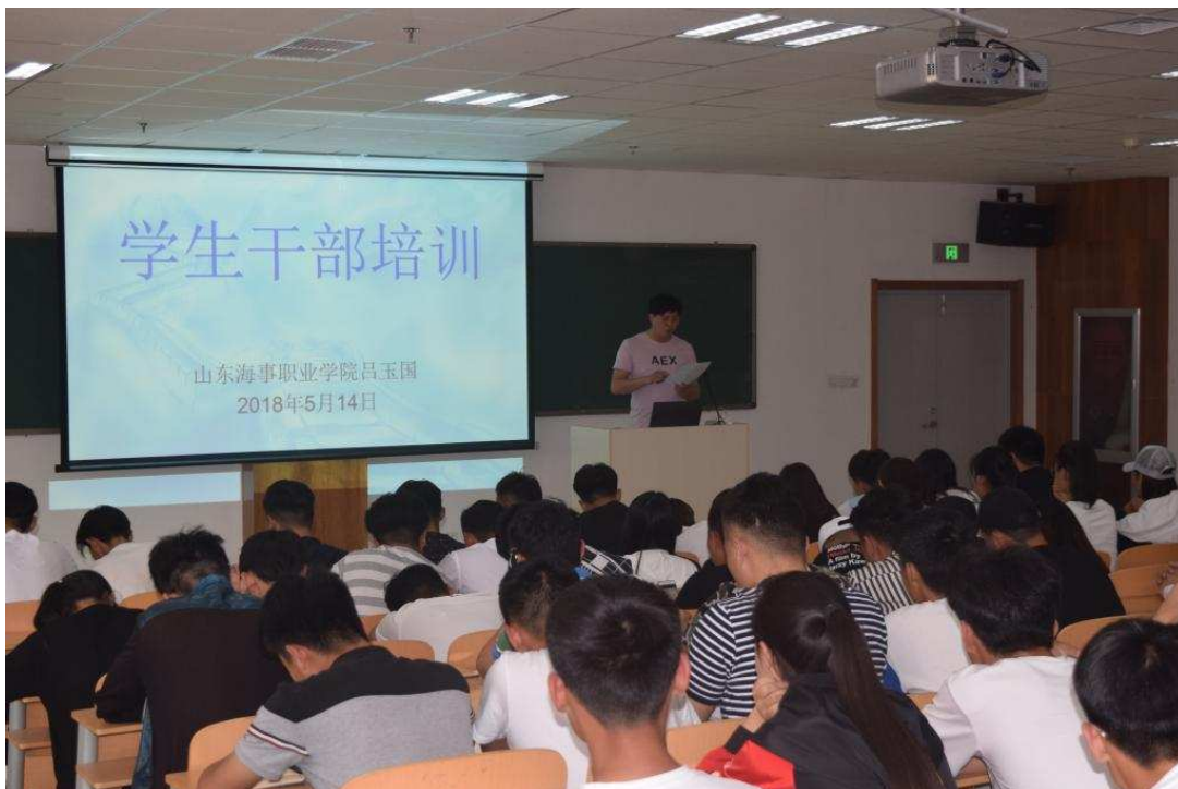
图 1-7 学生处组织召开学生干部培训大会

培养队伍，制定详细全面的培养计划，提高两支队伍的管理服务、教育技能，全力推进学生教育管理内涵和学风建设。