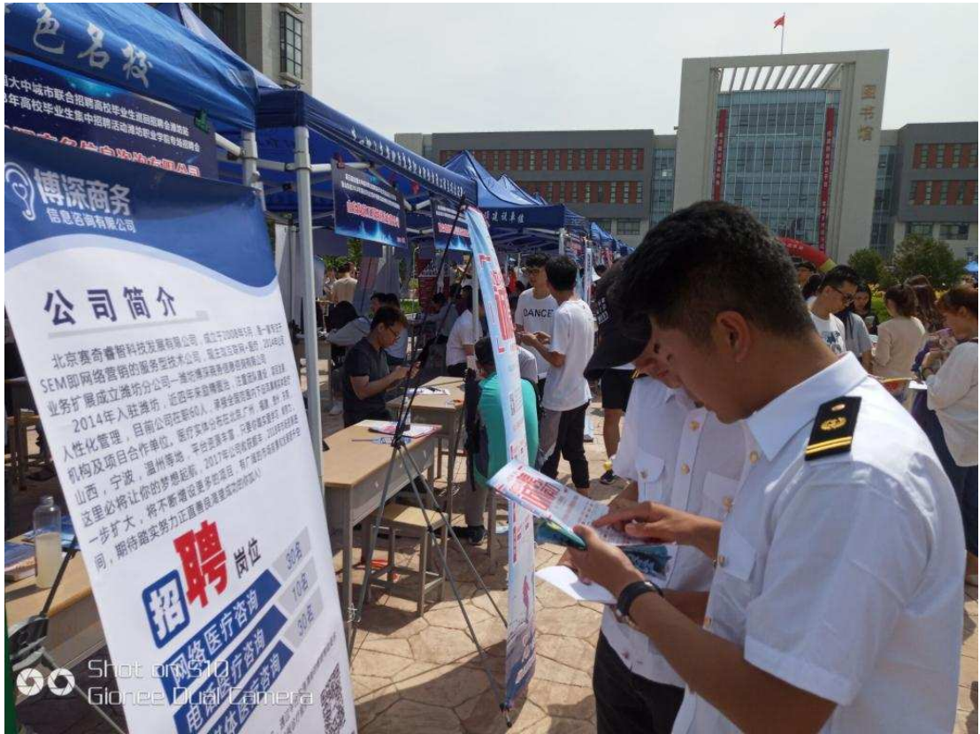
图 1-10 学生参观与交流现场剪影