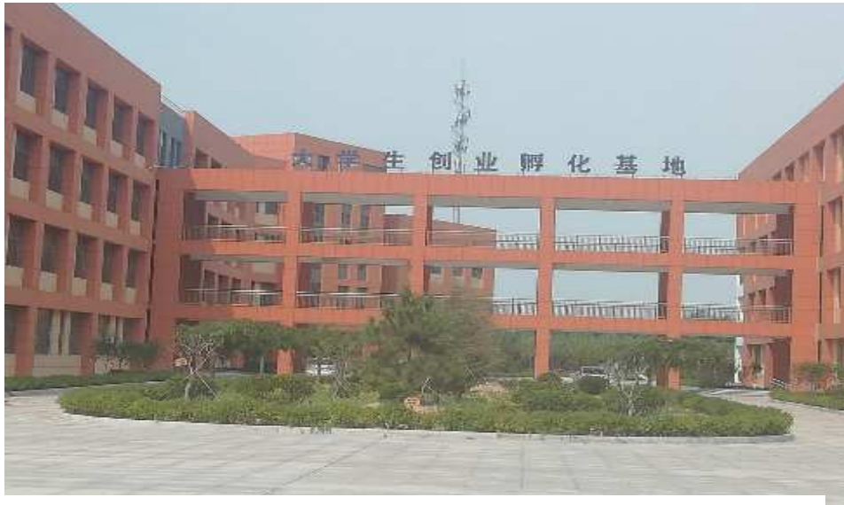
图 1-11 大学生创业孵化基地