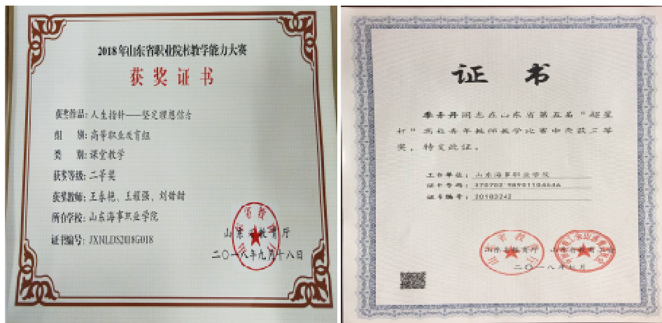
图 2-6 教师获奖证书

我校王春艳、王耀强、刘甜甜老师获山东省教学能力大赛二等奖，季丹丹老师、张燕燕老师也分别获得不等名次的省级奖项。