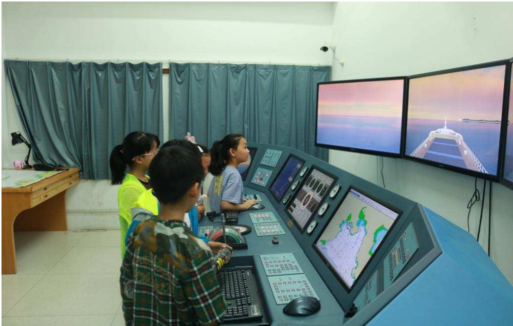
图 5-1 滨海区蓝海小学在我校青少年航海基地参观学习