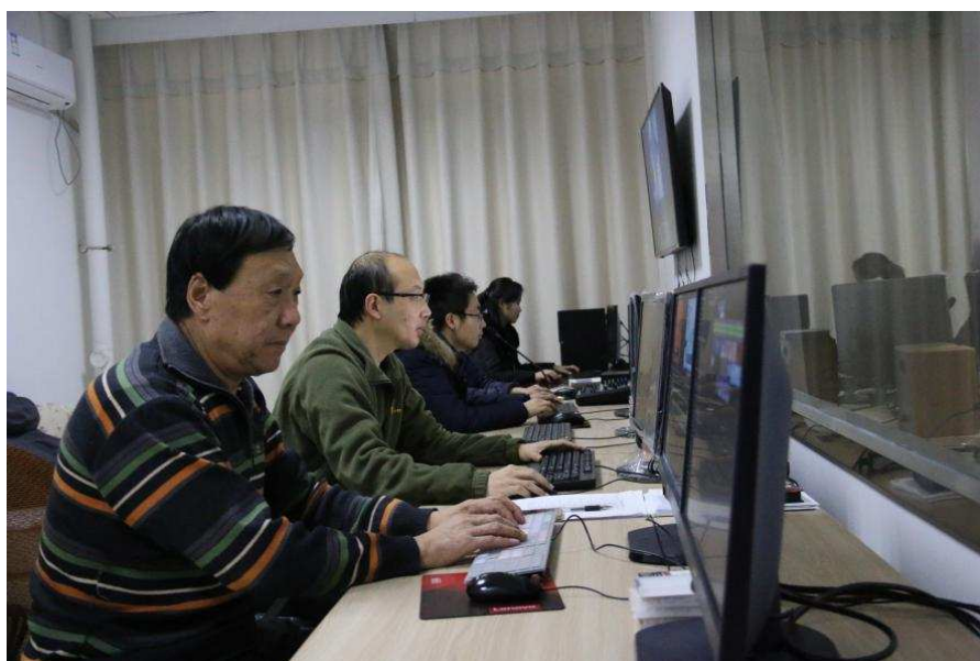
图 2-7 学院非线性编视屏制作平台