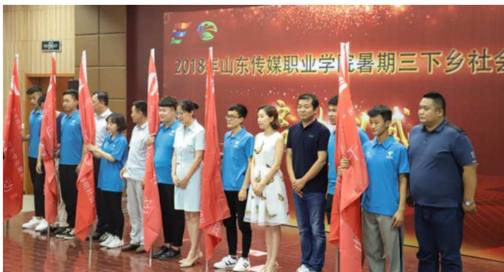
图七，学院三下乡暑期社会实践授旗仪式