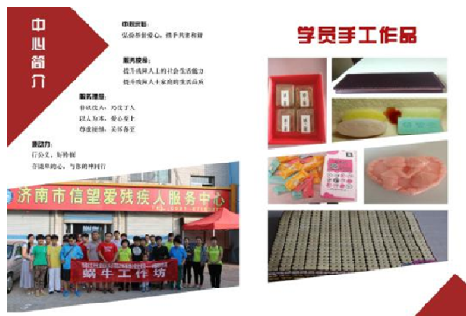
图十，我院学生设计的“信望爱”年报封面封底