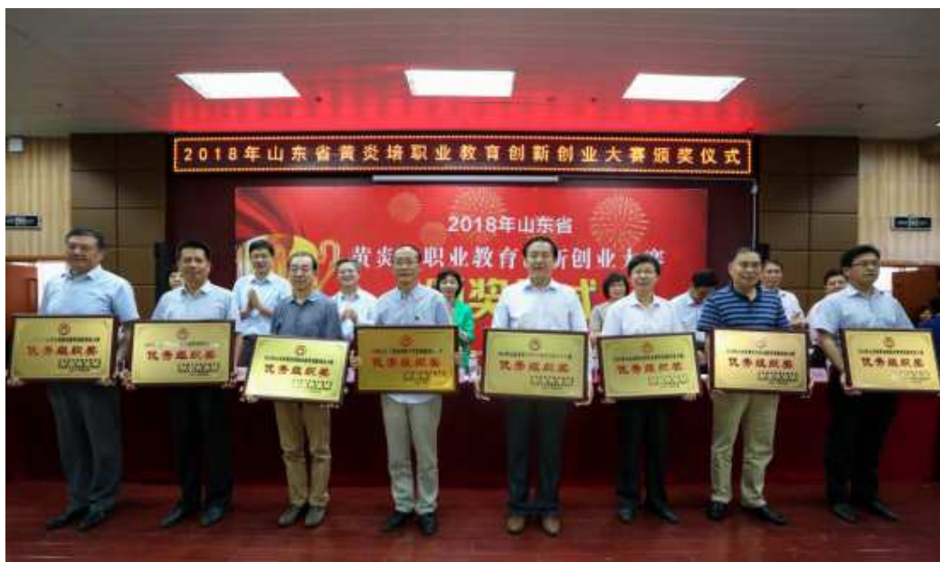
图三，黄炎培职业教育创新创业大赛颁奖仪式