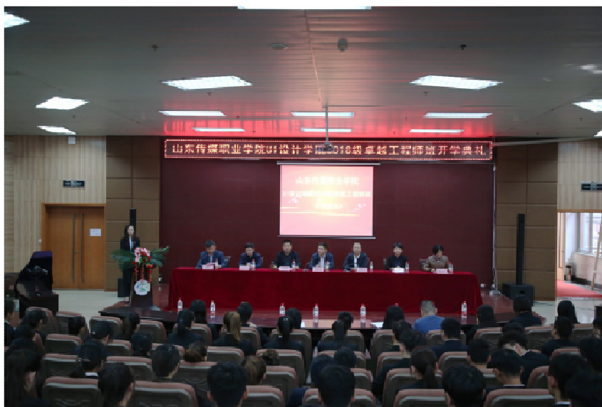
图九，校企合作班开学典礼

山东传媒职业学院与天津滨海迅腾科技集团校企合作“2018级卓越工程师班，将大数据、云计算、电子商务、物联网、人工智能等前沿信息技术引入教学实践和改革，逐步转变人才培养模式，由“2+1”模式向“2+0.5+0.5”模式转变，进一步完善了学院在校企合作方面的人才培养体系建设。重点建设“一个平台”、推进“两个融合”、实施“三个对接”，校企共同推进人才培养。