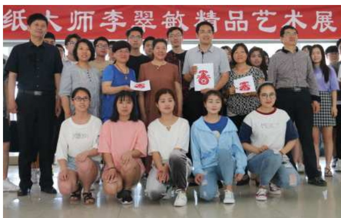
图八，学院第二届民俗文化艺术节系列活动之《剪纸艺术展》