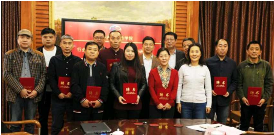
图十一，学院领导为受聘专家颁发聘书