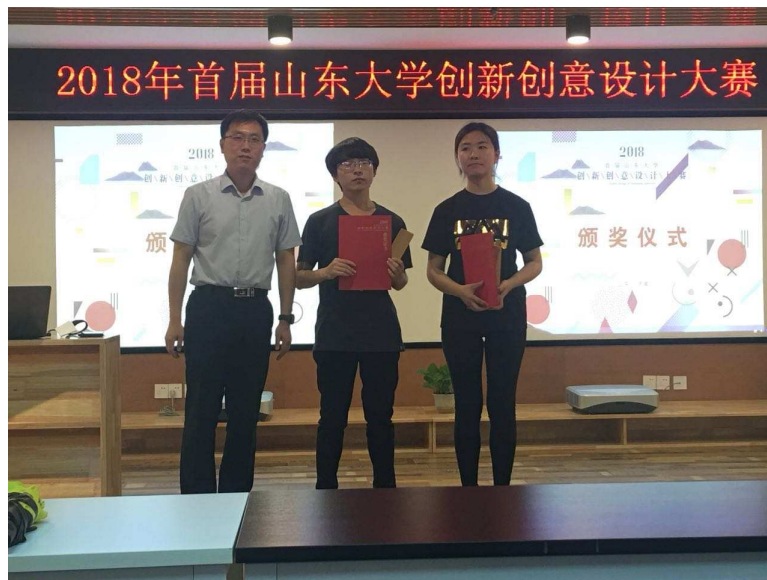
图六，山东大学创新创意设计大赛颁奖现场