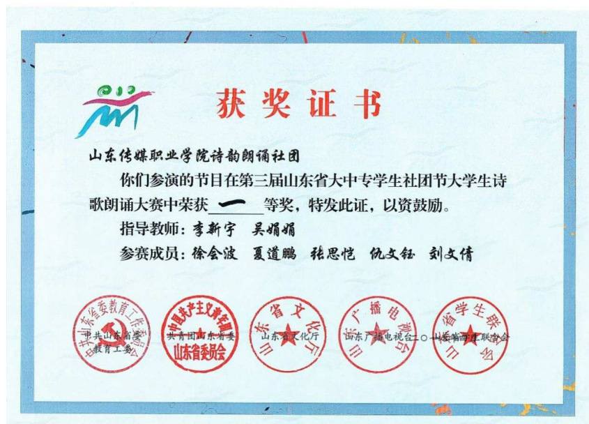
图四，2018 年第十三届山东省读书朗诵大赛

荣获大赛三等奖。第六届全国高校数字艺术设计大赛中 13 项作品获奖；第六届全国高校数字艺术设计大赛和第十届全国大学生广告艺术大赛也取得很好的成绩。