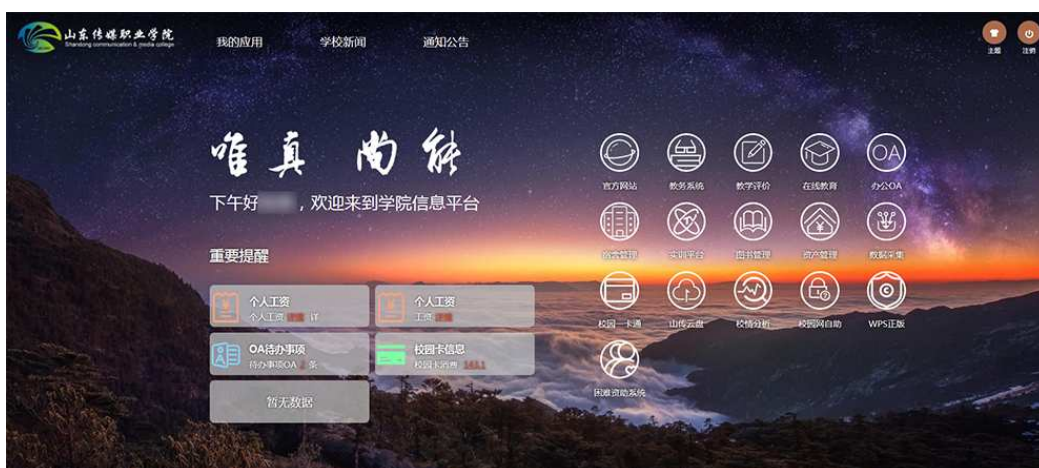
图十三，学院主页 OA 系统登录页面

息、一卡通、宿舍管理、办公自动化等 6 个已有信息系统数据资源的共享互通。完成了 OA 办公自动化平台和手机端的建设。制作上线公文流转、会场安排、公章使用、教室预订等各项流程 32 条，为实现无纸化办公进行了有益探索。完成信息化运维中心建设升级项目，运维中心是智慧校园的枢纽，其环境建设是保证校园网络及信息系统正常运行的关键。逐步推进学院软件正版化工作。为加强信息系统和各类软件的规范化管理，从源头上减少信息安全事件的发生。