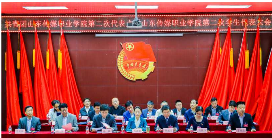
图十四，学院举办共青团山东传媒职业学院第二次代表大会