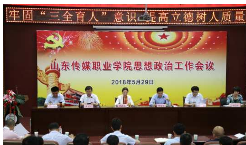
图十二，学院召开牢固“三全育人”意识 提高立德树人质量思想政治工作会议

思政工作体系，学院首次召开全院思想政治工作会议，基于全院大思政工作理念，制定下发《山东传媒职业学院思政政治教育工作考核指标体系》和《山东传媒职业学院思政政治教育工作考核评议实施办法》，推动意识形态和思政政治工作制度化、体系化、长效化。不断健全完善全员育人、全过程育人、全方位育人的思政工作体系。同时学院将以课程改革为抓手，打造既有深度又有温度的思政课程，构建立体多元的课程思政体系。