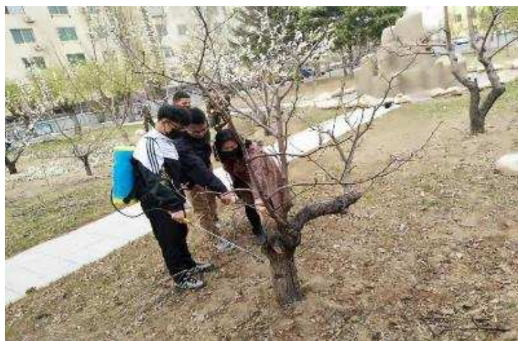
图 5-18 园林学院的师生为园区树木进行病虫害防治处理