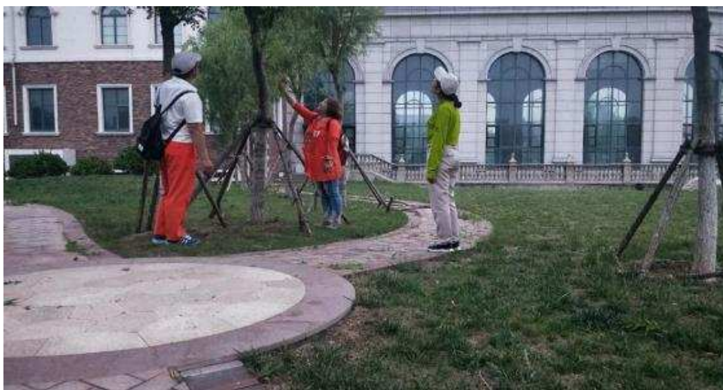
图 5-4 园林学院教师为天津滨海森林别墅区进行绿化养护