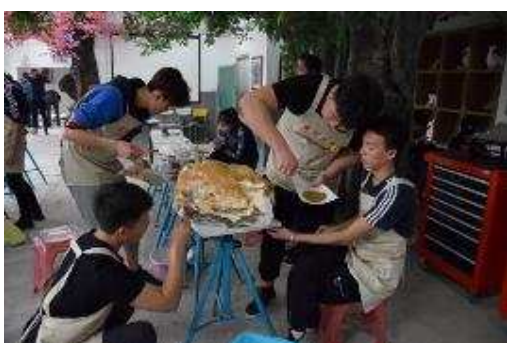
图 2-2 学生在进行石膏仿石制作后期处理上色

完成了 2017 级及 2018 级学生对玻璃钢小件工艺品的设计与制作的指导工作，完成各类小件工艺品 10 余件；完成真实石头硅胶翻模制作，并翻制出石膏制品，外观效果理想，达到设计要求。完善此前各类作品，上色补色等工作等等。