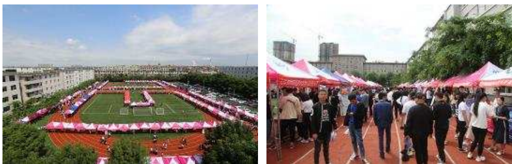
图 5-1 沈阳专场招聘会

2018 年 5 月 30 日在鞍山职教城举办鞍山专场招聘会。此次招聘会分为两个分会场，省内 103 家企业参加，提供就业岗位一千余个，吸引五百余名毕业生进场求职。