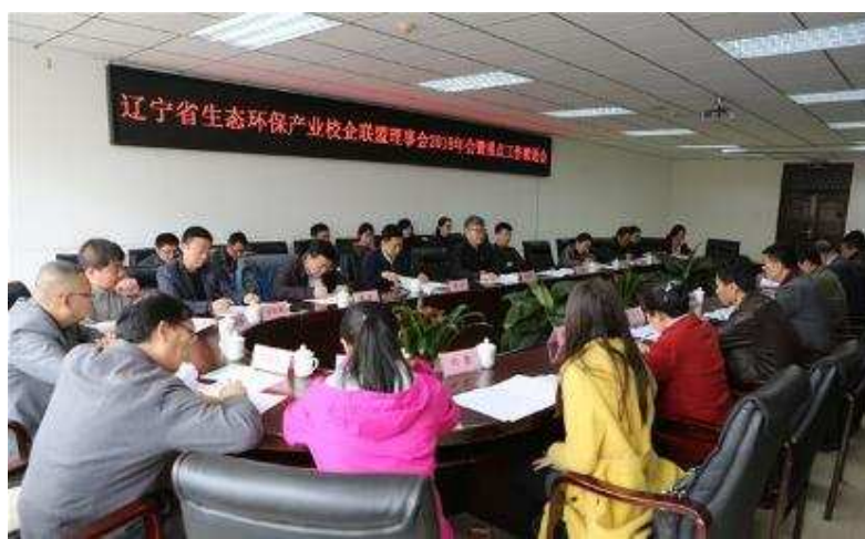
图 5-8 联盟理事会 2018 年会暨重点工作推进会

三是组织辽宁省生态环保产业校企联盟七项科研专项课题进行立项答辩。共同探索研发新模式，打造科技工作新亮点，促进科技服务地方经济发展。