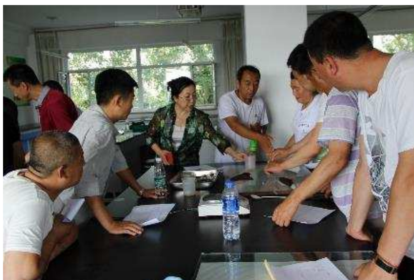
图 5-3 我院专家为农民技术员授课

我院从 2013 年开始参加辽宁省农民技术员培养工程项目，培养内容主要有林下经济、园林花木培育等，几年来参加培训的学员达 600 余人，学习了食用菌培训技术、园林植物造型、病虫害防治、植物种子处理、园林苗圃技术、林木种子生产技术、计算机基础、中草药栽培技术、苹果栽培技术、葡萄栽培技术、榛子栽培技术等七门理论课教学，学院为农民科技致富做出了贡献。2018 年选派校内外 10 名有实践经验的专家进行授课，共培训 10 门课程，培训学员 125 名。