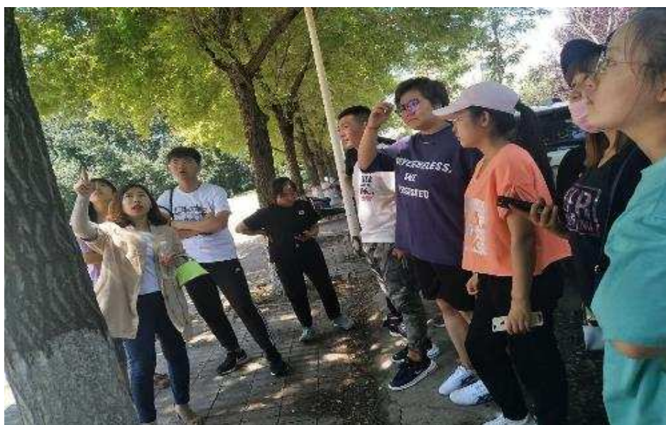
图 5-19 园林学院师生到辽宁医药职业技术学院进行植物病虫害普查工