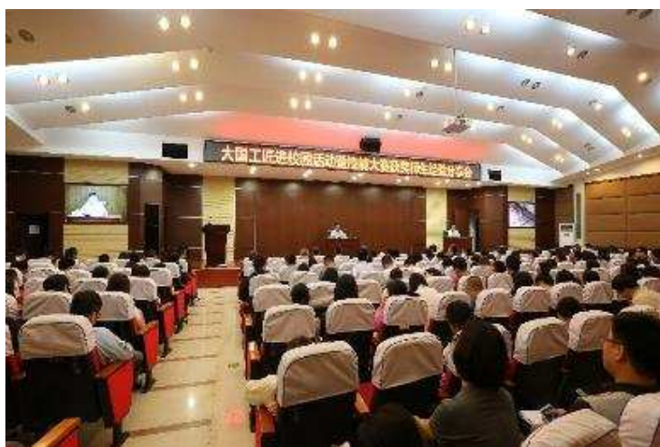
图 2-5 大国工匠栗生锐给全校师生作弘扬工匠精神的报告

司机匣加工厂加工中心操作工、高级技师，第十三届全国人大代表、中国航发首席技能专家、沈阳市特等劳动模范、全国五一劳动奖章获得者、全国技术能手、国家级技能大师工作站领创人、第三届全国职工职业技能大赛加工中心组第一名栗生锐同志结合自己的学习和工作经历，给全体师生作了一场弘扬工匠精神的精彩报告。