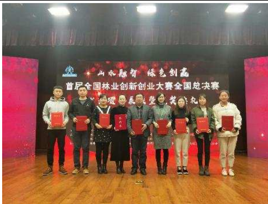
图 2-10 我院选手在“首届全国林业创新创业大赛”总决赛中获得多项大奖