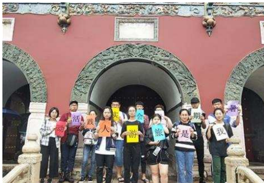
图 5-15 旅游学院师生为旅游景点作旅游志愿者服务

别在沈阳故宫、张氏帅府、沈阳昭陵、沈阳福陵、沈阳世博园、棋盘山野生动物园、沈阳北市场等景区景点进行志愿讲解服务。累计服务游客800余人，成为沈阳旅游景点中一道亮丽的风景线。