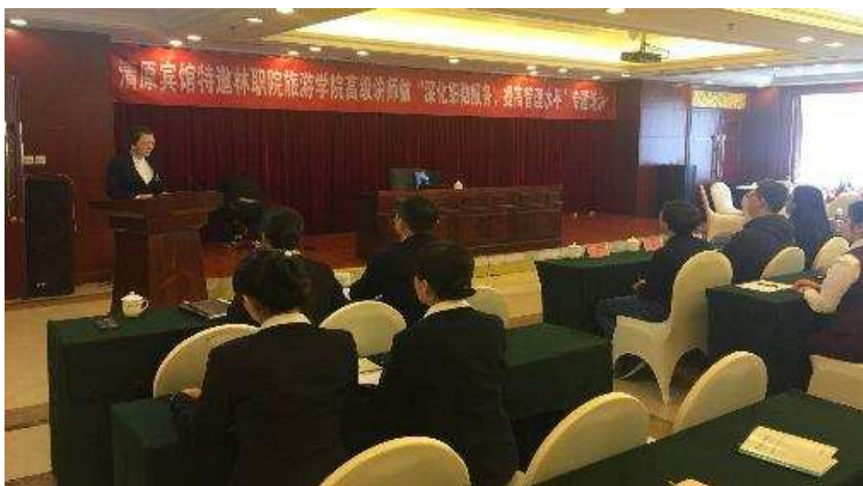
图 5-6 旅游学院教师为清源宾馆员工培训

清原县林业局十分重视本次活动。培训后，县林业局副局长候传生、清原生态旅游集团总经理王希大及宾馆领导与旅游学院领导教师开展了座谈交流活动。候局长表示清原县的经济快速发展需要高校的大力支持。王希大总经理强调旅游经济已成为清原经济高速发展的重要支柱，清原旅游事业的发展建设急需高校的专业技术支撑。阎文实院长表示服务辽宁东部地区是省政府对我校旅游学院提出的新要求，旅游学院将更好地发挥专业优势，为地方经济建设做贡献。