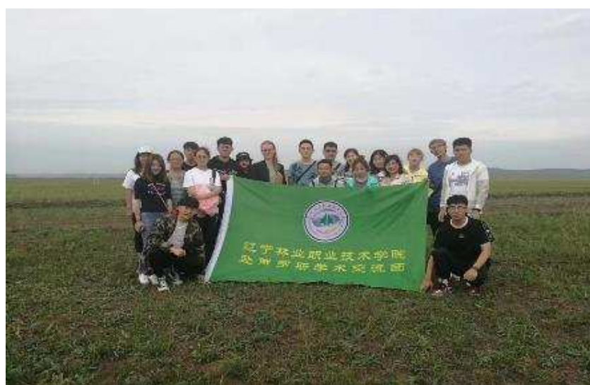
图3-5 林学院和园林学院师生赴俄罗斯伊尔库茨克国立农业大学进行学术交流