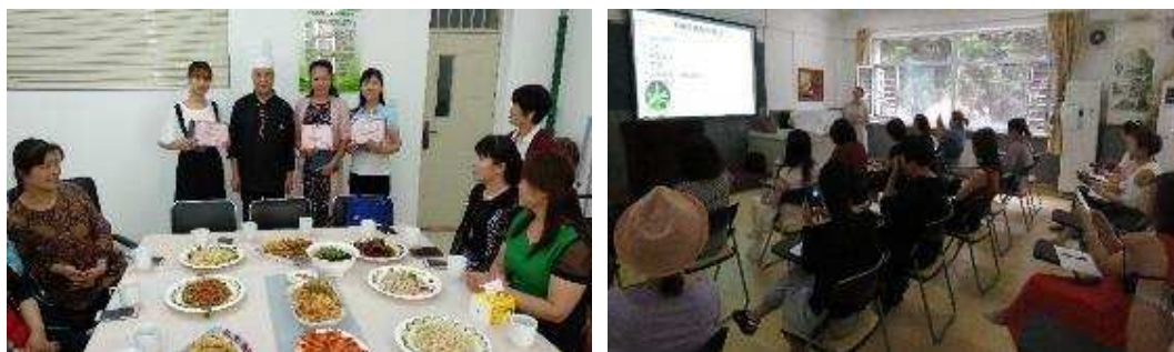
图 5-7 人文学院教师为幼教企业员工开展公益培训

人文学院依托辽宁幼教校企联盟成功举办幼儿园营养餐厨艺培训、家园沟通公益培训、育婴公益培训，培训教师既有行业大师，也有本院教师，为幼教企业发展提供了智力支持。