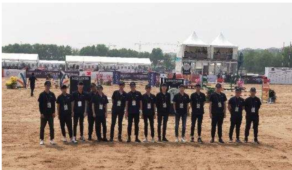
图 5-16 马术专业学生为国际马联马术比赛提高志愿者服务