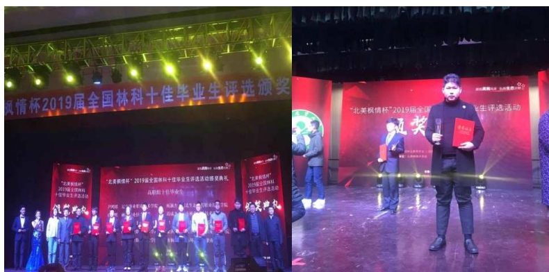
图 2-6 我院学生获得全国林科“十佳毕业生”荣誉称号