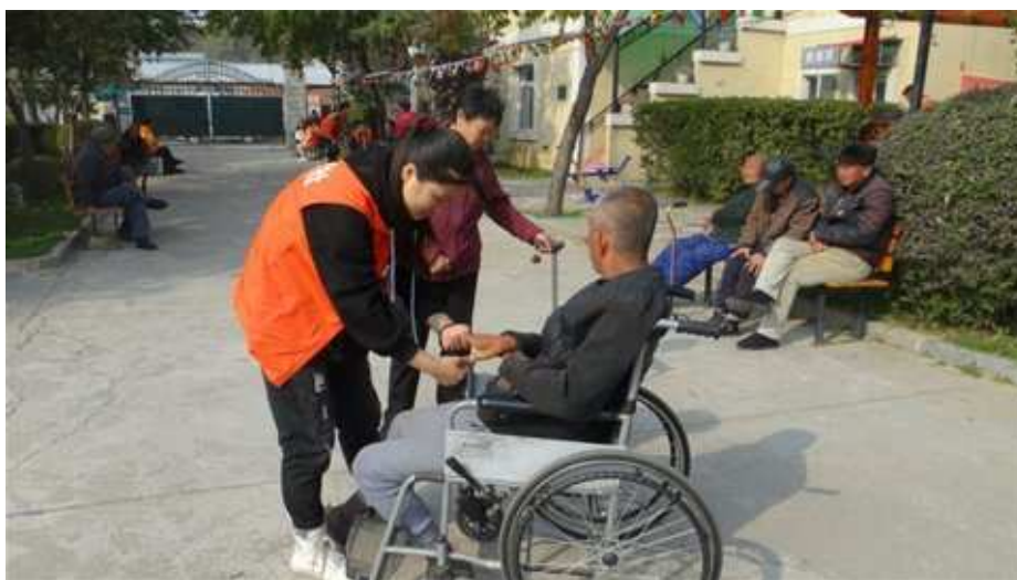
图 2-10 明理学社开展“尊老爱老 传递温暖”志愿服务活动

为了更好地弘扬雷锋精神，明理学社志愿服务部于 10 月 21 日在欣一佳敬老院组织开展了以“尊老爱老传递温暖”为主题的志愿服务活动。明理的志愿者们与沈阳希望志愿者协会的志愿者们一起为老人们分发自己掏钱买的水果、小礼物、表演了精心准备的节目，志愿者们与老人们聊天、为老人揉肩捏手，让老人们感受到爱的关怀、家的温暖。通过开展本次活动，同学们对老人们更加尊敬和理解，用自己的实际行动践行了尊老爱的传统美德。