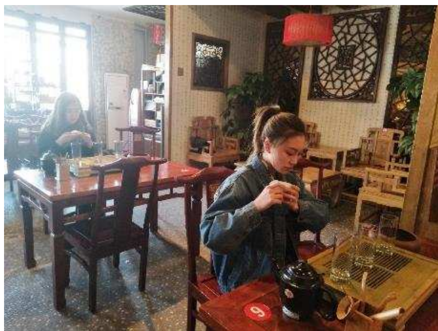
图 2-8 茶艺协会“茶艺培训”活动

茶艺师先后演示了绿茶、乌龙茶、红茶的泡制，社团学员进行了学习和交流。通过本次“茶艺培训”活动，茶艺协会成员领略了茶文化，掌握了绿茶、乌龙茶以及红茶的泡制方式，让成员们之后的茶艺更上一个台阶。相信我们茶艺协会成员会更喜欢茶艺、更加了解我国的茶文化并齐心宣传发展茶艺。