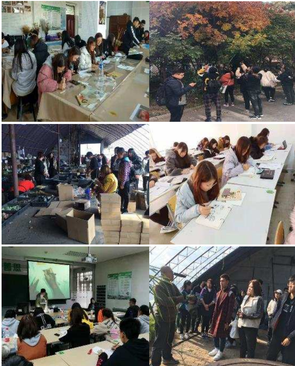
图 2-7 园林学院专业社团活动

励学社团-优秀园林鉴赏、瑾瑜文化社团、卉微社团-微型植物生产，活动内容丰富，并将其纳入学分管理，使每一个学生都能参与其中，培养与塑造学生的人生观、价值观、审美观、发展他们鉴赏美与创造美的能力，培养学生的广泛爱好与特长。