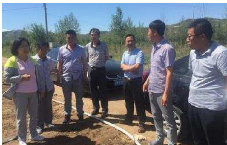
图 5-10 我院受辽宁省教育厅委托的北票市凉水河乡扶贫项目

社，实现更大范围的脱贫致富。黄精、北苍术的种植收益周期为三年。黄精三年后的利润 46275 元/亩；北苍术的利润为 83377.5 元/亩。