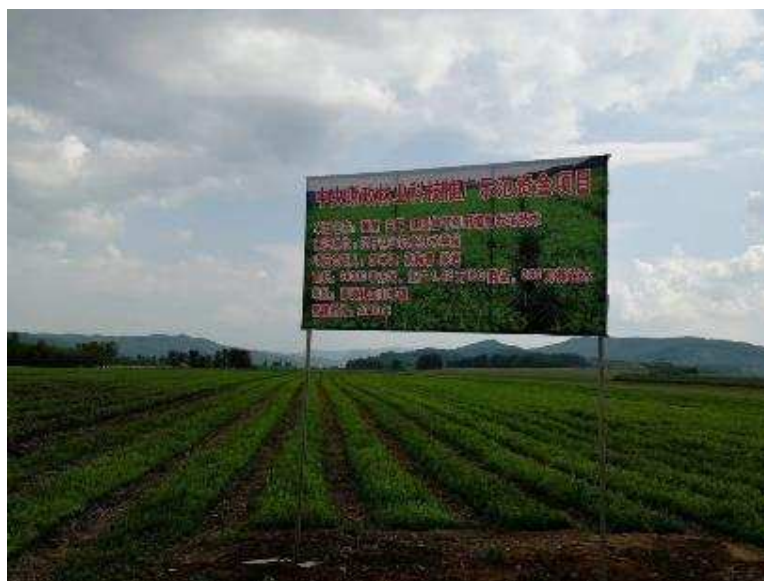
图 5-11 我院主持的中央财政林业科技示范资金项目，建立了珍贵中药材黄精栽培示范基地