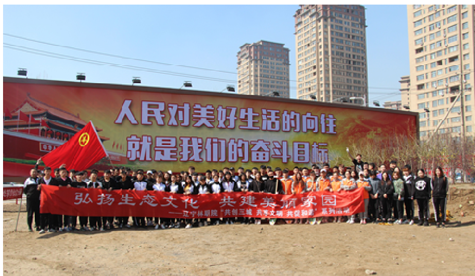
图 5-17 学院师生参加植树活动

生城市、国家健康城市、国家食品安全城市动员部署大会精神、以“三城联创”为契机，2018年4月19日，辽宁林职院与团区委联合组织开展了“共创三城，共享文明，共促和谐”系列活动之“弘扬生态文化，共建美丽家园”植树活动。学院的100名师生志愿者参与了植树活动，为建设美丽沈阳，发挥了专业所长，践行了我院“吃苦耐劳、无私奉献、团结协作、有为担当”的林业精神。