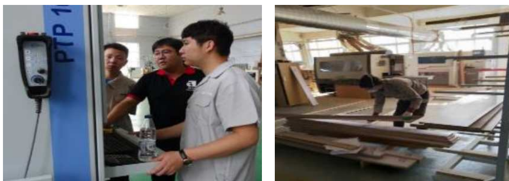
图 3-1 师傅指导现代学徒制学生实践操作

2018 年，我院与沈阳凯宾斯基饭店签订协议，在酒店管理专业开展现代学徒制试点工作。学徒制班学生通过学校老师和企业岗位师傅的言传身教，职业技能得到明显提高。