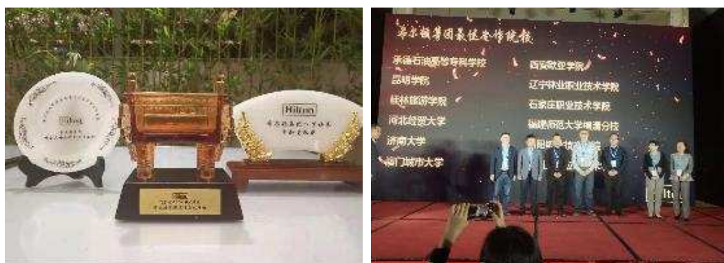
图 3-2 我院获得希尔顿集团最佳合作院校奖

基于双方良好的合作，从2013年开始，我校旅游学院一直致力于为希尔顿集团输送大量优秀的学生。在合作过程中，旅游学院有十余名毕业生已经成为希尔顿酒店的部门经理，其中12级希尔顿订单班的一名学生获得希尔顿集团北区最佳员工、此后又有多届多名学生获得最佳实习生及优秀员工的荣誉称号，我们的学生在希尔顿集团内部各项技能大赛中多次斩获殊荣。