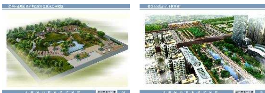
图 2-1 学生作品