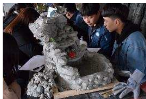
图 2-3 学生用油泥捏制的假山跌水模型