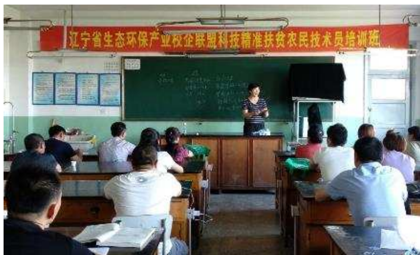
图 5-9 科技精准扶贫农民技术员培训班专家授课