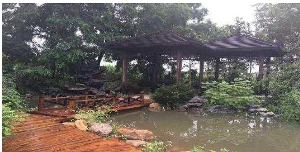
图 4-1 国家级实训基地——林盛教学基地

学院多方筹措资金，2017年度学院总收入为12,969.83万元，其中财政专项经费为2067.45万元。学院积极贯彻落实高职教育发展的资金投入，能保证我院在教育教学、学生实习实训等经费的投入，保证学院正常运转和事业发展需要。学院年生均拨款为1.29万元，达到了高职生均拨款1.2万元水平。