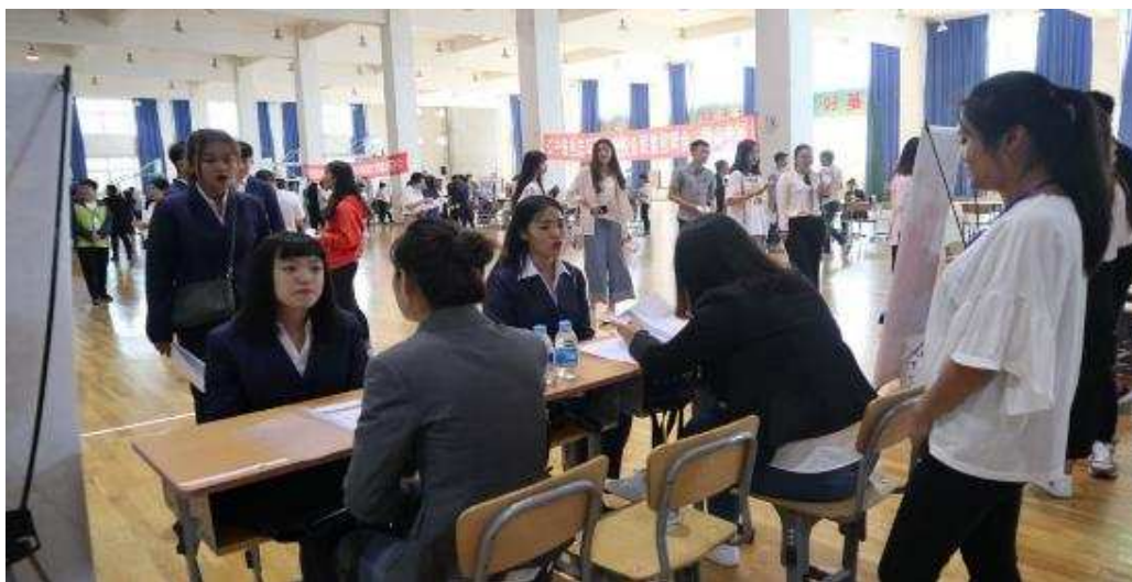
图 5-2 鞍山专场招聘会