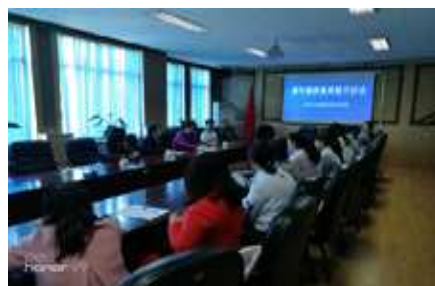
青年教师素质提升活动