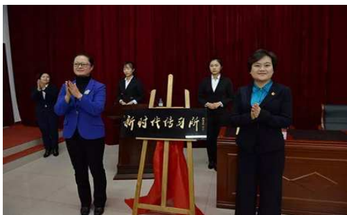
“新时代传习所”揭牌仪式

2017年11月白山市首个“新时代传习所”在长白山职业技术学院举行了揭牌仪式。参加揭牌仪式的有白山市委宣传部部长、市教育局领导、学院党委书记、青马过程学生等300余人。传习所现已开展了培训、讲座、到红色基地学习、边防实践、经典诵读等多项活动。