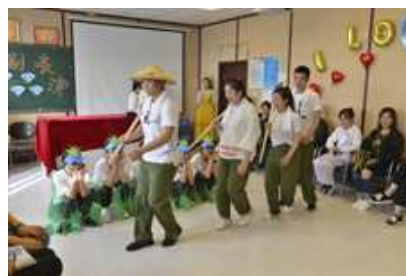
话剧社团的课本剧表演