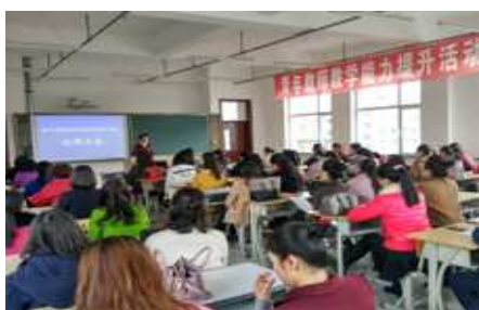
青年教师教学能力提升活动

2017—2018 年学院分别开展了青年教师教学能力提升和素质提升活动。教学能力提升活动中安排了专题讲座、公开课、撰写论文等内容。素质提升活动安排了制定个人成长规划、师徒结对、理论学习、讲座、听课、自主学习等内容。其目的是希望青年教师勤勤恳恳、扎扎实实、积极主动地参与到活动中，努力成为“四有”教师。同时也为我院打造了一支高素质、专业化、创新型青年教师队伍。