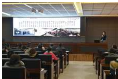
信息化教学设计大赛