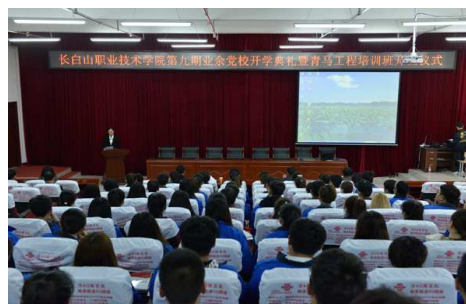
业余党校暨青马工程培训