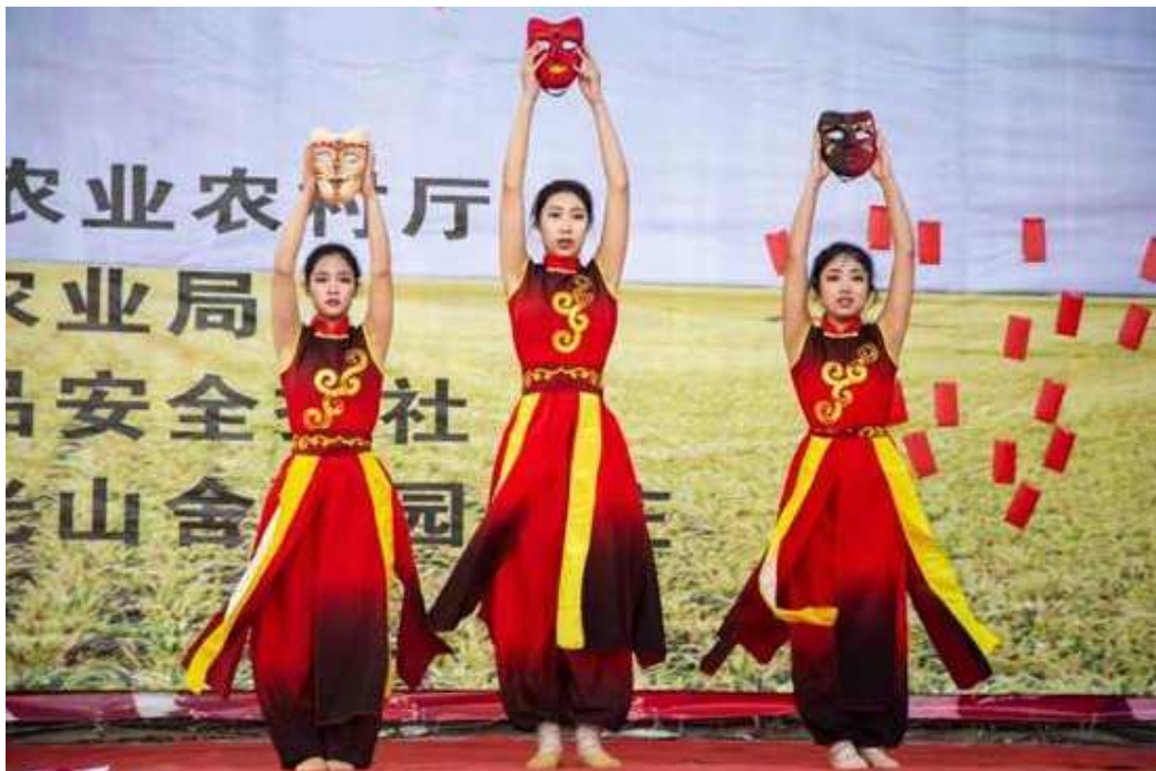
图 11 义演实景演出