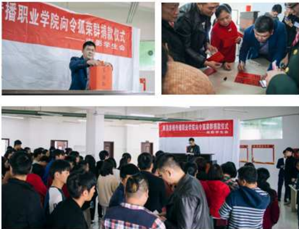
图5 爱心募捐活动现场