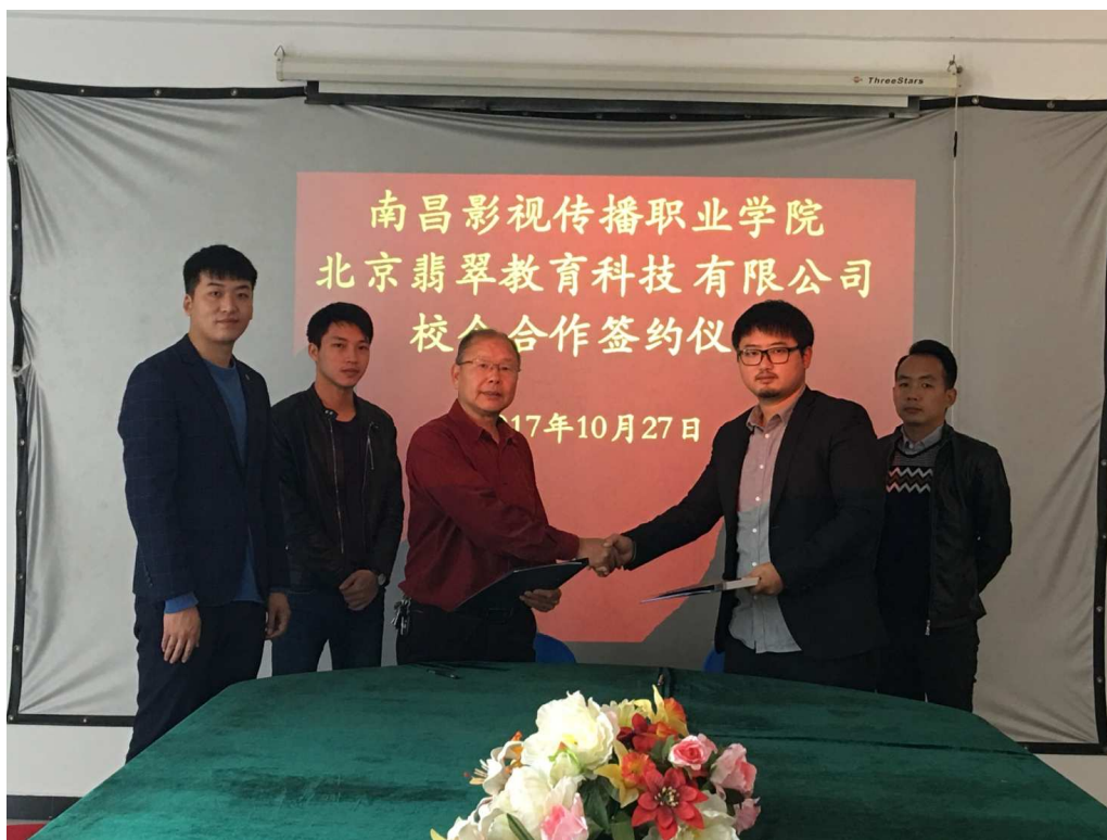
图 20 与北京翡翠教育科技有限公司合作，共同举办《数字影视制作专业》校企合作班

专业机构。公司致力于培养移动互联网、android 智能手机应用软件、IOS 平台开发、游戏研发、动漫设计等国家紧缺人才。合作主要依托北京翡翠教育科技有限公司的全新教学模式、独特的开发特点、创新的产品开发思路以及其与移动互联网一线企业全真商业项目案例教学方法和贯穿始终的知名企业全程参与的高品质教学服务方式，达到与我校共同培养移动互联网及数字娱乐产业实用技能型人才目的。