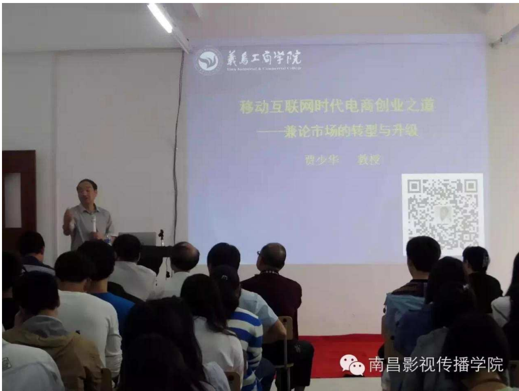
图9 创业教父贾少华教授作《移动互联网时代电商创业之道》