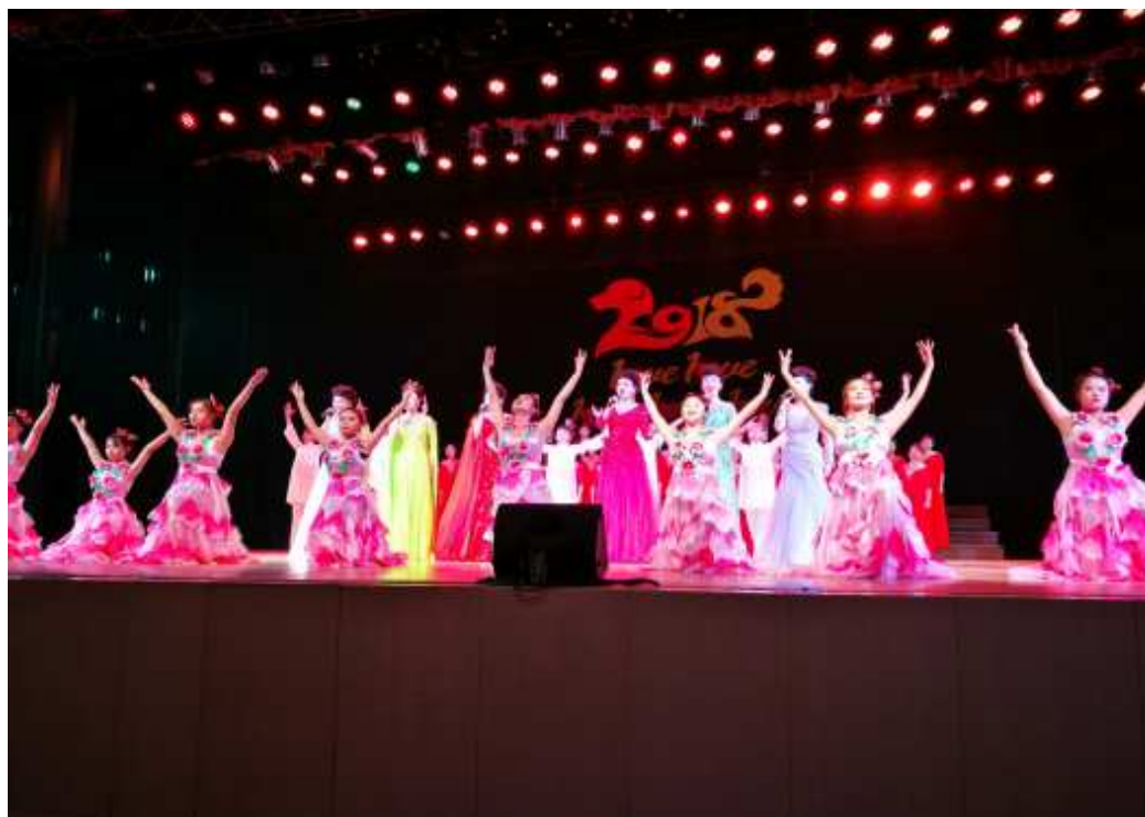
图 6 我校舞蹈表专业学生参加“2018 年江西省民主促进委员会晚会”现场

学校全面推进有特色的高技能职业教育，特别注重学生的专业技能培养，以就业市场为导向，强化操作技能训练：一是通过让学生参与实景演出，举办“我是演员”大型演义真人表演节目，组织外出参加演志愿者义演，参加大学生艺术展演活动等等（图 6-7），既检验了知识能力学习掌握的效果，也开拓了视野。第九届江西省大学生艺术展演活动学校选送三个节目参赛全部获奖，摘得了一等奖 1 项，二等奖 2 项的好成绩（图 8）。二是让学生参加服务外包项目制作，通过“游戏、动画”制作，实现软件使用实训，巩固学习成果；三是开展“联合办学”、“生产性实训”、“课程嵌入”等形式，与企业生产经营紧密结合，实施即学即用的实践教学方式；四是组织技能认证培训与考证，实现教学、认证一体化教育。