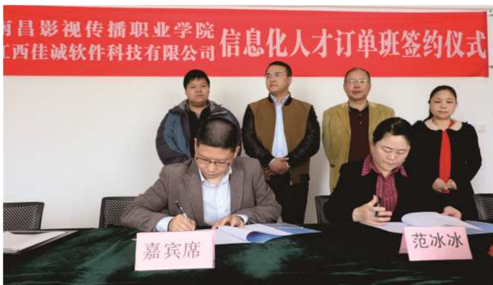
图 19 与江西佳诚软件科技有限公司合作，共同培养《互联网+财务》订单班

会计（互联网+财务）订单班作为学院特色办学项目，企业课程与专科课程统筹安排，充分、高效地利用在校学习时间，大大缩短了学生的社会适应期。通过就业企业项目订制课程的学习和考核，达到考核要求的学生直接任职知名企业，使学生省心、家长放心。