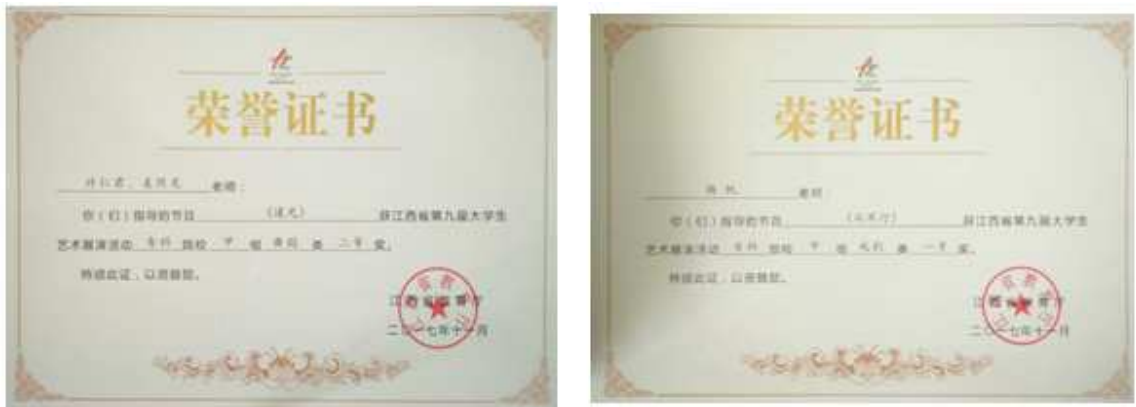
图 8 我校舞蹈表专业学生大学生艺术展演活动获奖荣誉证书