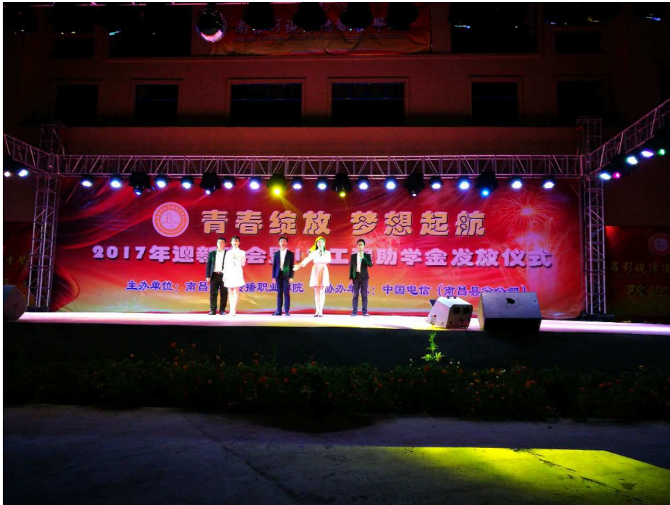
图4 “1%助学工程”发放现场