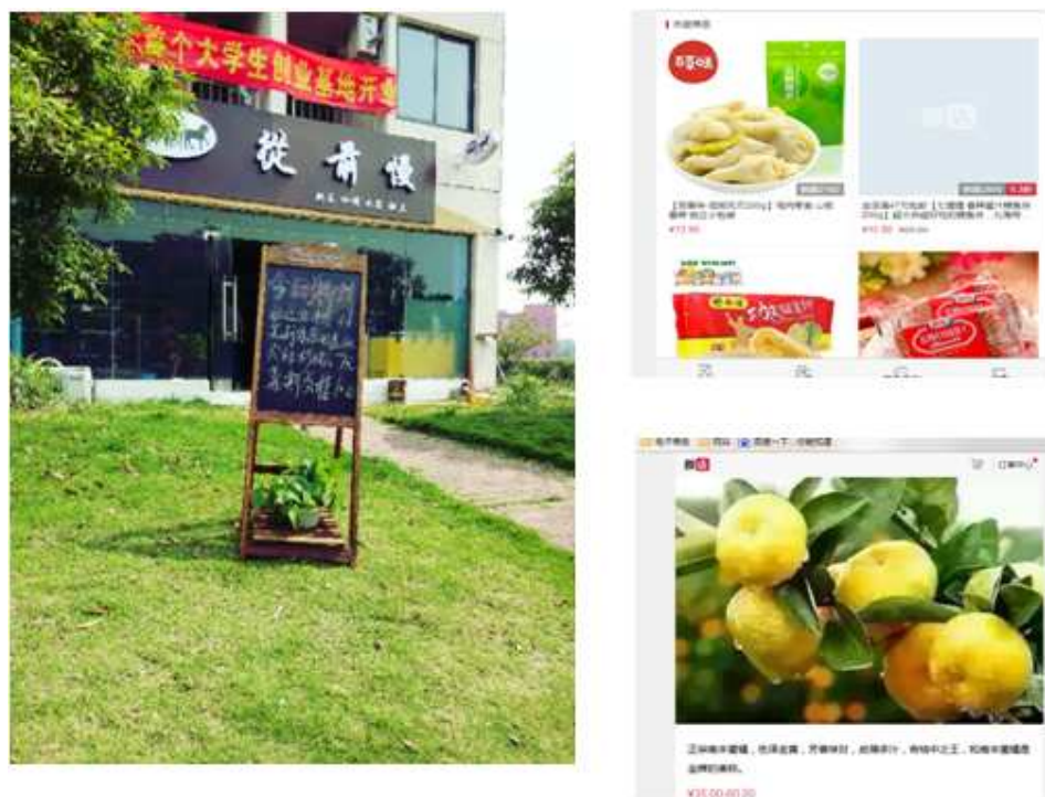
图 15 学生自主创业的“从前慢”奶茶店及学生开的微店