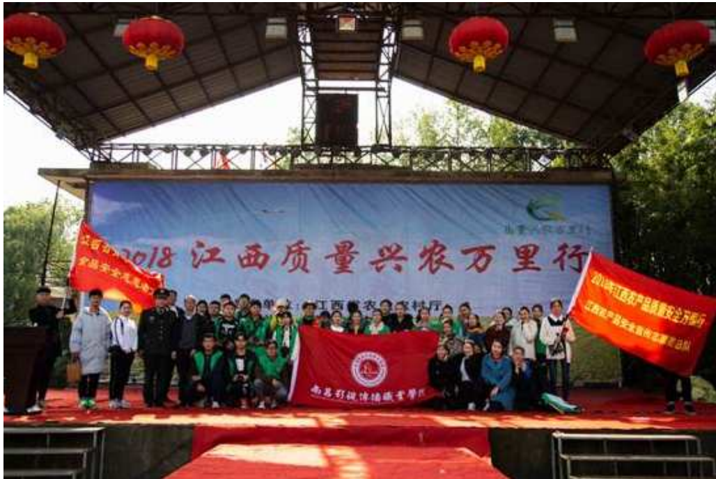
图 10 学生参与义演