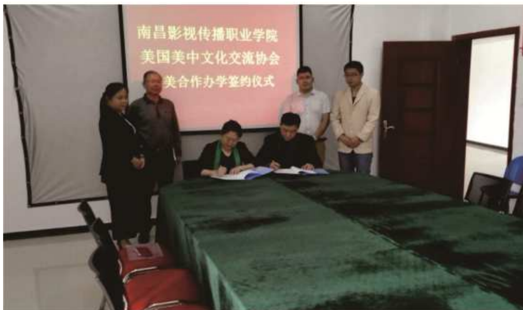
图 25 与美国美中文化交流协会签订合作办学协议