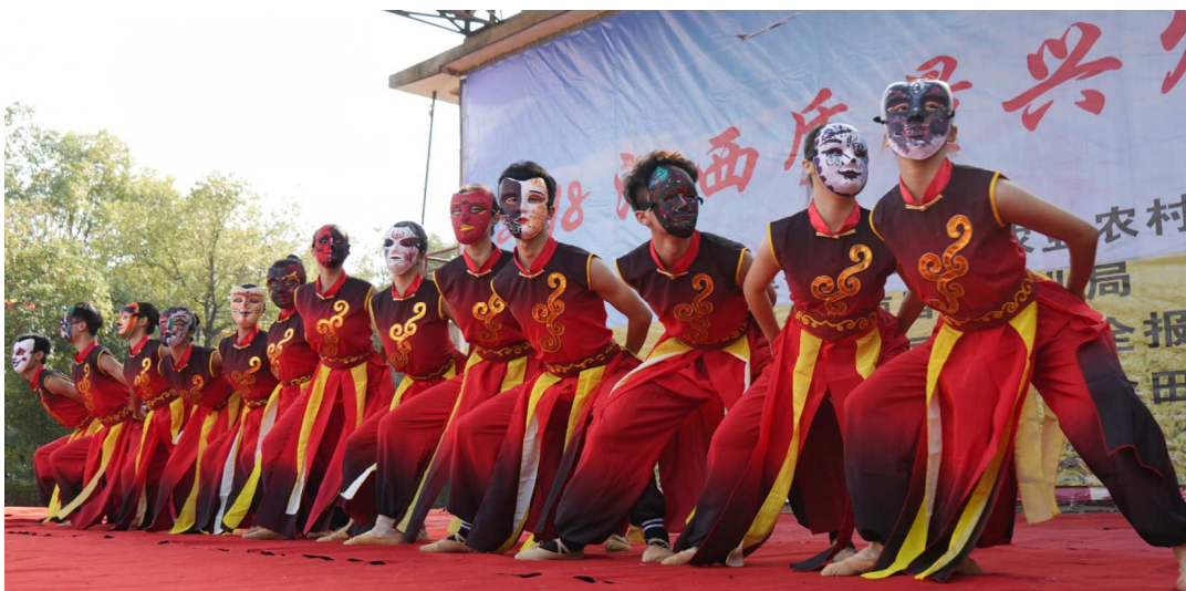
图3 我校志愿者参加“江西质量兴农万里行活动”表演中国传统文化舞蹈《雉》