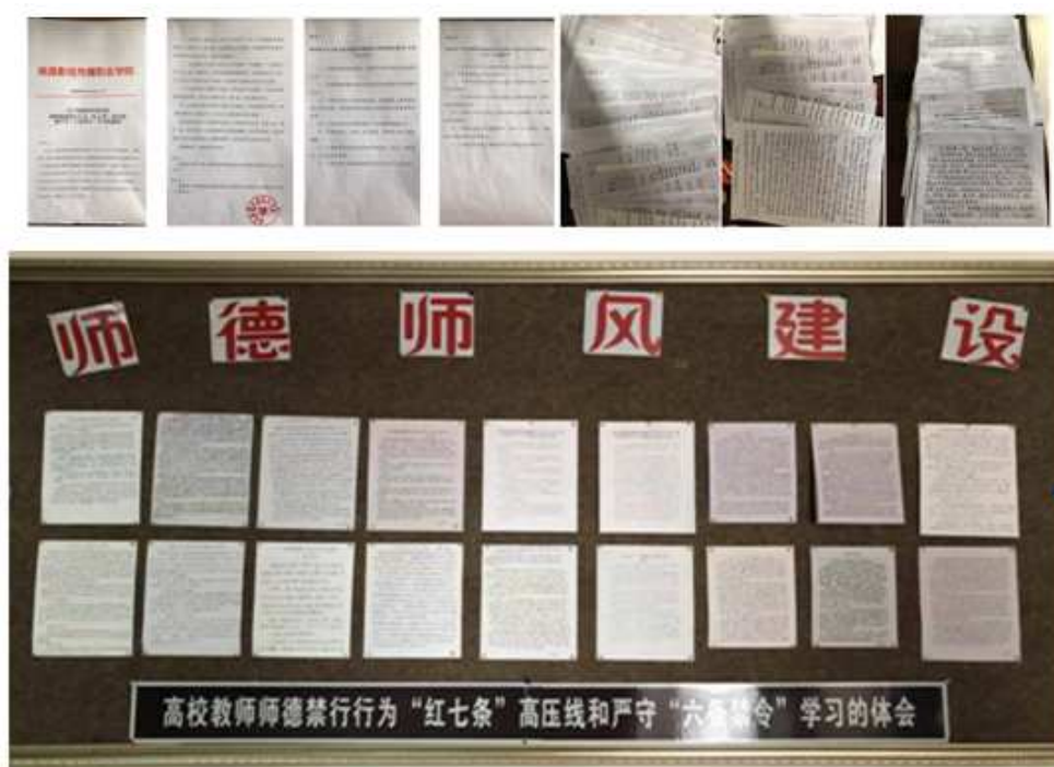
图 16 开展关于加强教育部高校教师师德禁行为“红七条”高压线和严守“六条禁令”学习活动

质过硬的高校教师队伍，我校以对党和人民高度负责的的精神，大力弘扬高尚师德师风，自觉抵制不正之风，扎实师德师风教育，办人民满意的教育，学校经常开展关于师德师风建设的活动。（图 16 ）