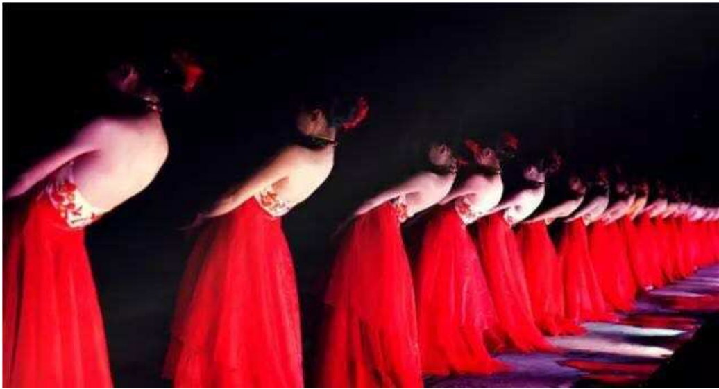
图 18 与中邮江西艺术团合作学生演出剧照

的社会影响，受到合作单位和社会各界的一致好评。艺术团不仅作为企业文化的一个宣传载体，更作为文化企业走向市场化运作。学校与中邮江西艺术团合作，借助该团社会艺术培训中心等多家综合化文化经营分支机构力量，形成了“教、演、研”一体化教育模式。