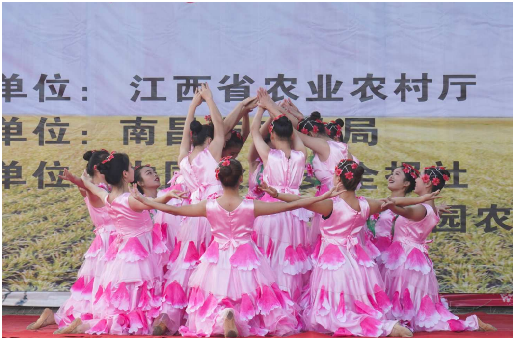
图 7 我校舞蹈表专业学生参加 “江西质量兴农万里行走进美丽蒋巷镇湖光山舍田园农庄活动”现场照片