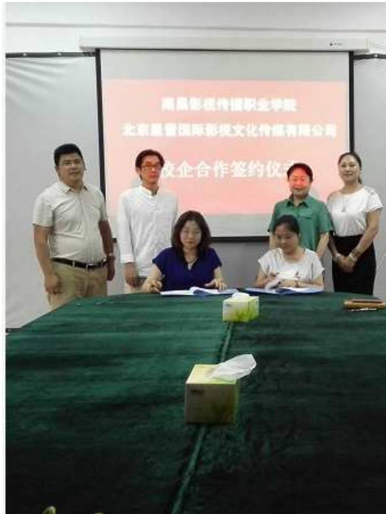
图 17 与北京星蕾国际影视文化传媒校企合作

案例 2. 与中邮江西艺术团合作，招收艺术表演、戏剧影视表演专业，培养演员、幼师、文艺节目策划等人才。