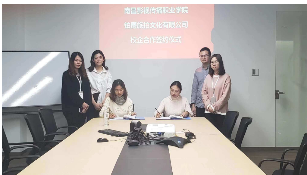
图 21 与厦门铂爵旅拍文化有限公司合作

“穿着婚纱去旅行”的全新婚纱摄影的潮流。在此战略思维的引领下，铂爵旅拍荣获中国婚纱摄影“十大杰出企业”，中国天猫旗舰店行业销量遥遥领先，客户好评持续领先。通过校企合作提升了我校人物形象设计、艺术设计、影视动画、数字媒体应用技术专业人才培养质量，为学生实习就业提供更广阔的空间。