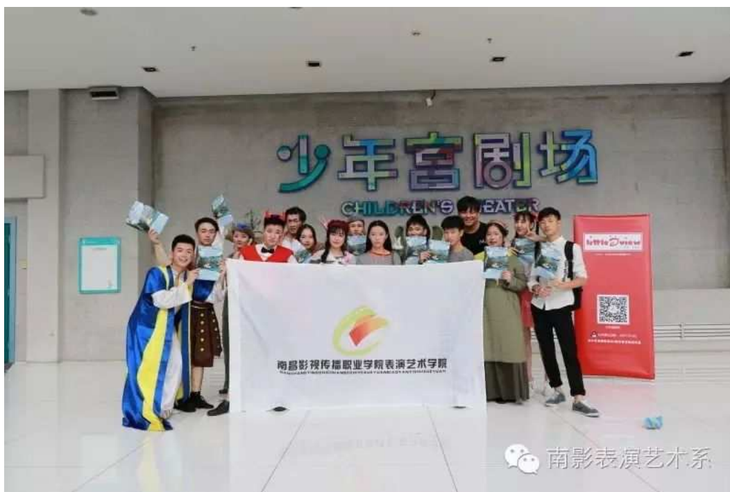
图 12 演出成功的喜悦表现