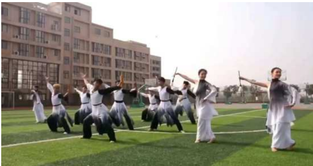
图 1 发挥学生艺术特长

组织丰富多彩的校园文化生活，积极开展各种健康有意义的课外文体活动，占领学生的业余生活阵地；利用班会、团会，组织学生开展各种小型的文化娱乐活动，活跃学生的课余文化生活；发挥共青团职能，以广大学生爱好、兴趣为纽带，增设让全校学生自主参与的活动，丰富第二课堂；学校每年举办四次以上全校性的大型文体活动，倡导学生参加，发挥学生艺术特长，让广大学生在艺术实践中得到锻炼和提高，引导校园文化向健康高雅的方向发展（图 1）。