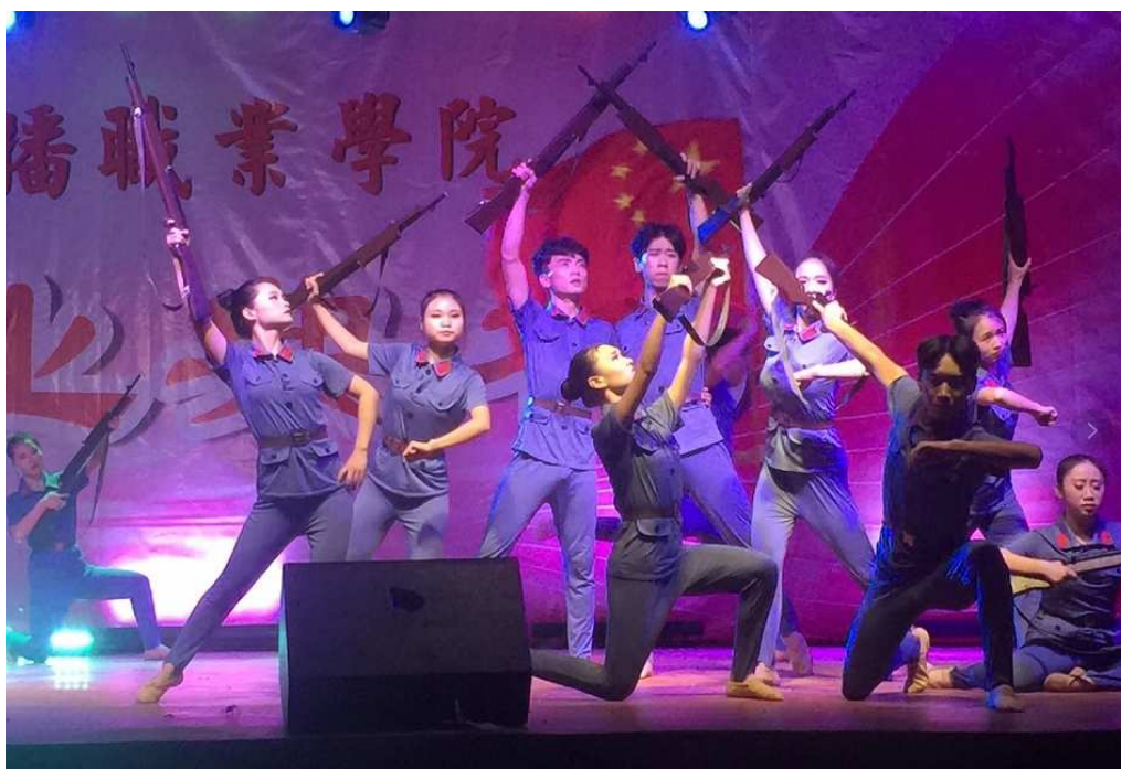
图2 排演红色经典歌舞蹈

渗透，把德育渗透于教育教学的各个环节，开设“传统文化礼仪”课程，让学生明礼诚信，同时，通过在各学科的常规教学过程中，细化对于学生情感价值观的引导，坚持用井冈山精神等红色文化资源育人（图2），学习中国传统文化（图3），突出诚信教育、法治教育和社会责任感的培养，真正做到将德育工作深入到教育教学的方方面面。充分利用宣传媒介，加强育人环境建设。完善校园网站、广播站，宣传橱窗、班级板报以及校外活动基地等宣传阵地，宣传身边好人好事、感人事迹，弘扬正气。