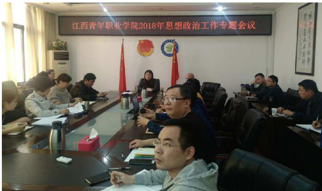
图 1：江西青年职业学院 2018 年度思想政治工作专题会议

更好地促进创新发展行动计划各项项目的建设，全校教职员工统一建设思路、明确建设目标，为顺利完成创新发展行动计划任务（项目），最终实现学院跨越式发展而共同努力。