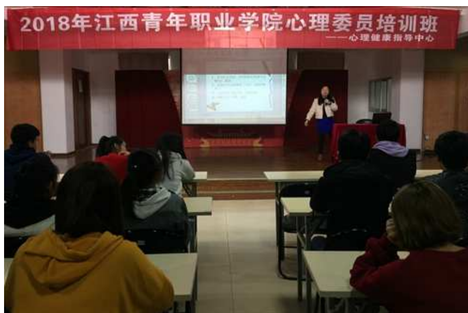
图 3：2018 年江西青年职业学院心理委员培训班

班同学的心理困惑。为丰富培训内容，课堂中穿插角色扮演、心理游戏等现场互动方式，体现心理委员沟通技能的重要性。通过此次培训讲座，心理委员明确了自己的职能、定位、内容、工作方法，提高了心理委员的职能意识和专业素质，为学院的和谐、稳定、健康发展打下良好基础。