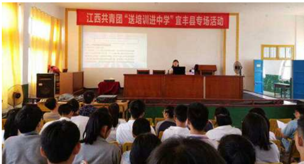
图 16：送团课进中学—宜丰县专场

为了落实江西省第十六次团代会的部署，聚焦团的基层基础工作，持续深入推进“团的基层组织建设五项重点工作”，推动“基层组织建设规范年”活动深入开展，夯实中学团组织基础团务工作，学校自 2018 年 6 月起至 12 月开展“送培训进中学”活动，此活动共计开展培训 110 场，培训人员达 10000 多人。此次培训活动是在 2017 年度“百场培训送基层”的基础上，聚焦中学中职团组织这个“强基固本”的关键，在覆盖中学中职团委书记、组织委员的同时，重点将