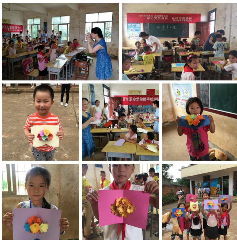
图 14：创意手工课程进小学

“创意手工课程进小学”活动是青少年教育系学前教育专业立足实践导向，强化教育教学实践性和职业性，改革创新手工教育实践课程成果转化和推动社区志愿服务活动的有机结合。课程重点改革实践环节，手工课程教育岗位实践，做到学生在老师的指导下，全程参与手工课程的设计、筹备、实施、评价过程，真正实现学后即学即用，用后又学，突出做中学、做中教，工学结合、知行合一。而志愿服务就是转移课程，校内教学与校外实践的天然结合点。