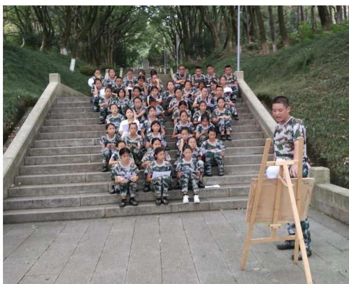
图 19：学生分享心得体会