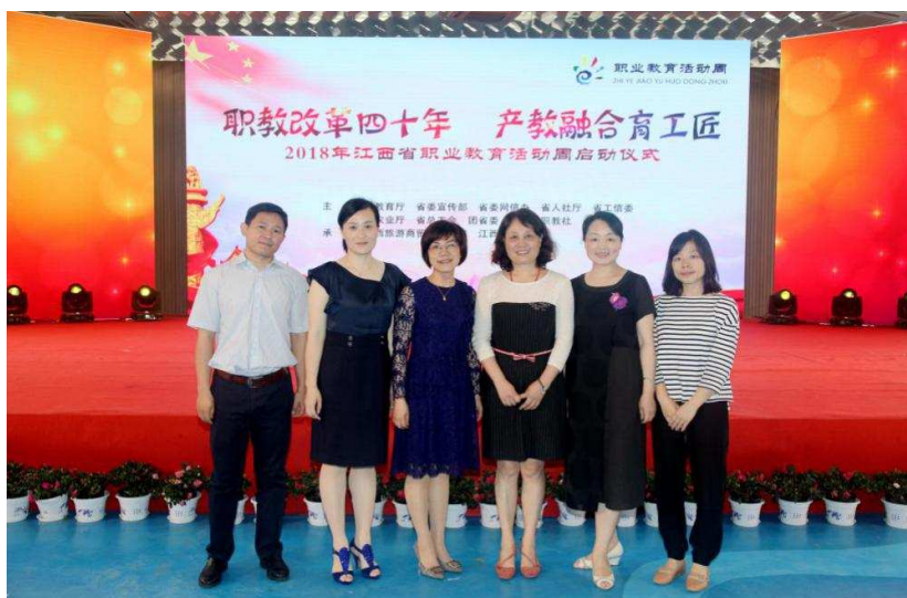
图 5：江西青年职业学院参加江西省职业教育活动周

育专业的学生作品参加了启动仪式上的职业教育技能展示活动，这些作品得到了众多的赞赏和认可，这些作品体现了江西青年职业学院同学们的精湛的技艺，宣传了江西青年职业学院的专业技能能力，展示了江西青年职业学院教育办学特色与江西青年职业学院学子的青春面貌。