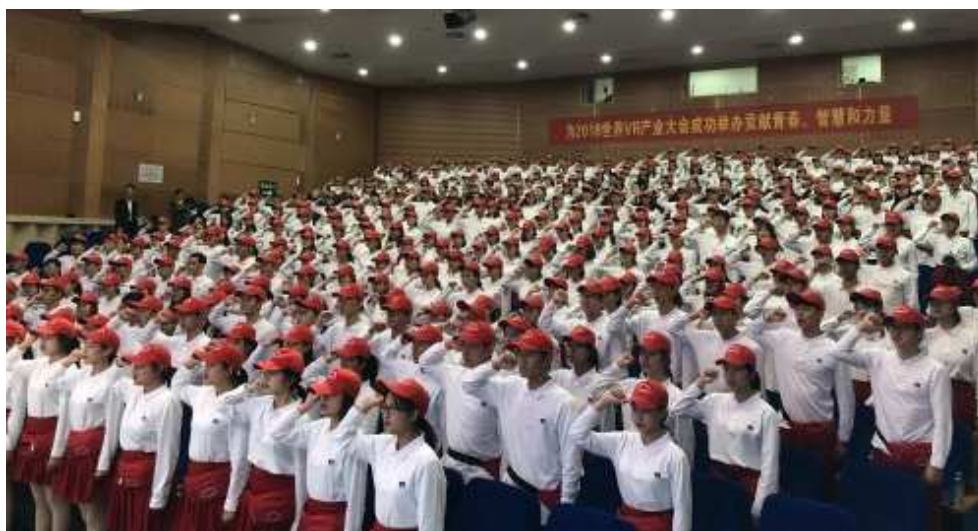
图 10：2018 世界 VR 大会志愿者誓师大会