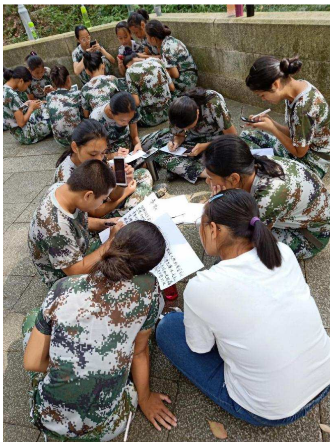
图 18：学生在讨论方志敏精神内容