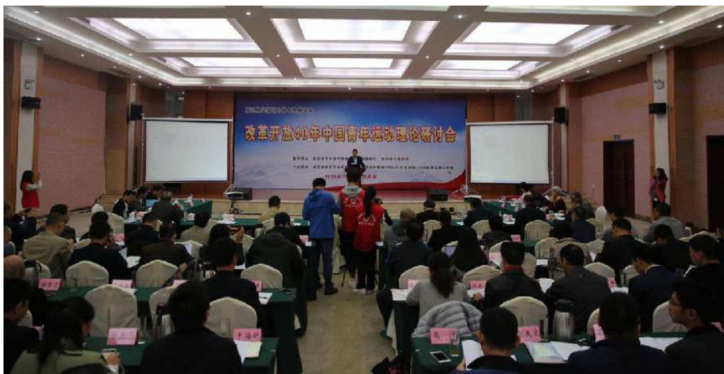
图 15：改革开放 40 年中国青年运动理论研讨会暨第三届共青团与青年发展论坛