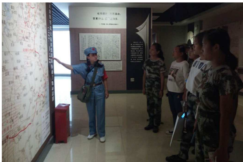
图 17：教师在方志敏烈士陈列馆教学

作为思政课实践教学一次创新性有益尝试，也存在一些需要完善和不断探索的地方，如，教师队伍不够稳定，由于需要的教师人数较多，又是在各系中不同专业的教师中选拔产生，由于各自专业和工作不同，有素质参差和临时工作难以协调的情况，需要重视加强教师的进一步前期培训，同时通过制度化加强管理。教学内容和形式也还要进一步完善和丰富，思政课的实践教学形式还需要我们作更多大胆的深受学生欢迎的寓教于乐的探索，我们将进一步结合第二课堂成绩单和周边小平小道、八一纪念馆等红色资源的参观学习，不断充实思政课实践。