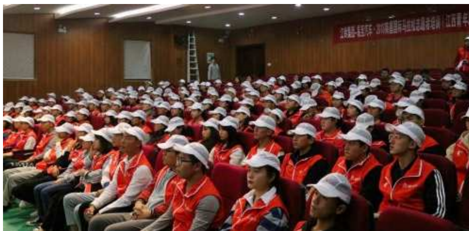
图 11：南昌国际马拉松志愿者培训