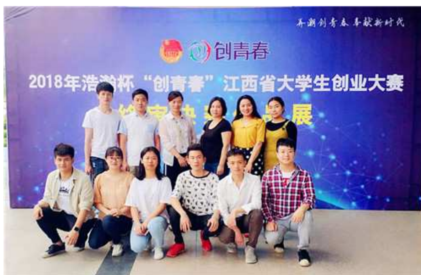
图 6：参加 2018 年浩瀚杯“创青春”江西省大学生创业大赛的师生

两项、铜奖两项，学院荣获优秀组织奖。在 2018 年“挑战杯——彩虹人生”全省职业学校创新创效创业大赛中，选送的《云团课》、《经管智创》等项目荣获银奖两项、铜奖两项，学校获优秀组织奖。在 2018 年全国职业学校创新创效创业大赛中，《云团课》、《经管智创》两个项目荣获全国三等奖。