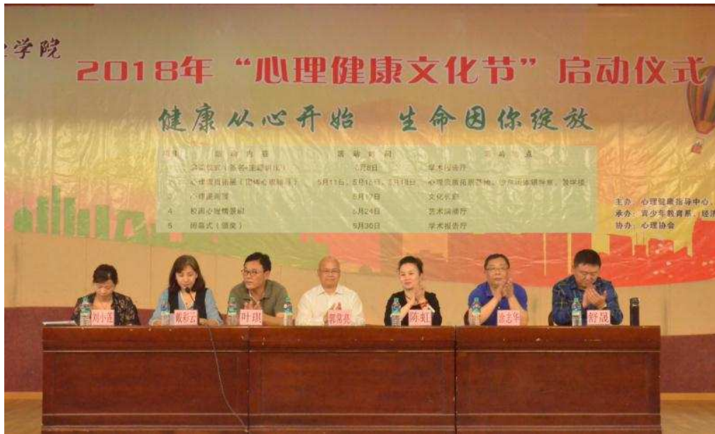
图 4：2018 年“心理健康文化节”启动仪式

次，达到了广泛宣传、普及心理健康知识的目的，营造了重视心理健康教育的氛围，为学生搭建了优化心理素质的平台。