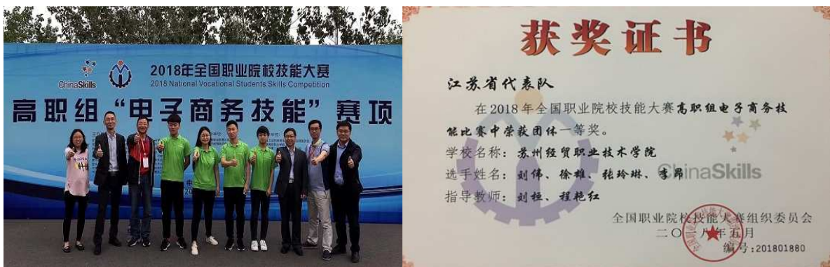
图 2：我院电子商务参赛队在全国职业院校技能大赛中获一等奖