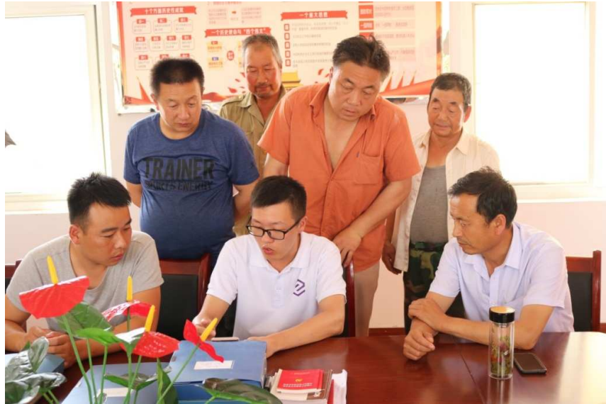
图 6: 学院电商专业学生在甘肃天水市下寨子村组织农村电子商务技能培训