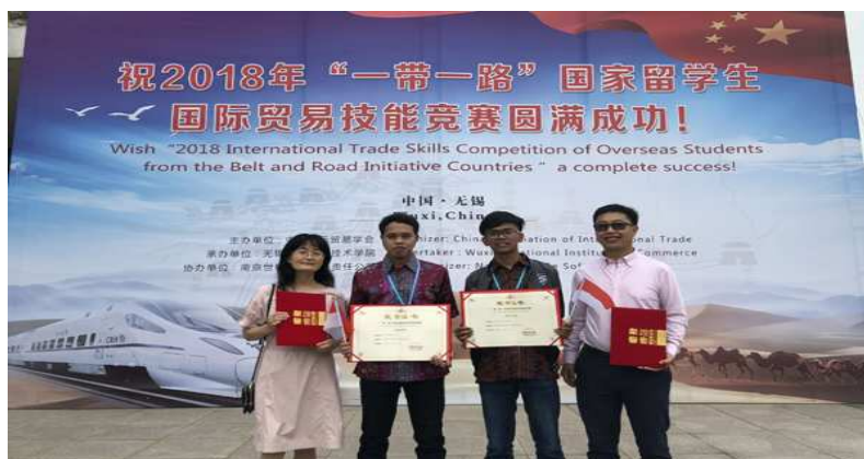
图 7：我院留学生在“一带一路”国际贸易技能大赛中获团体二等奖