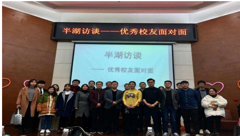
图 1：学院举办“半湖访谈——优秀校友面对面”交流活动现场