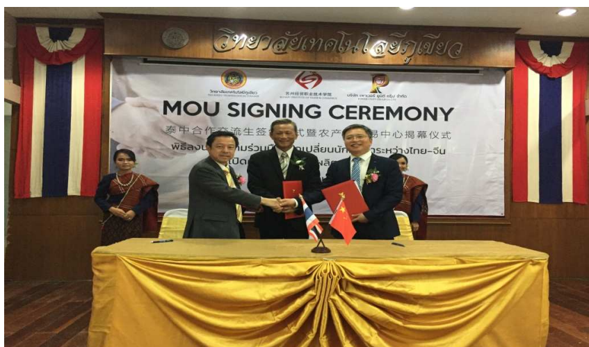
图 8：学院与泰国荣鹏集团、普桥技术学院三方合作签订人才合作培养协议

2018年5月，苏州经贸职业技术学院代表团赴泰访问，与泰国荣鹏集团 POWER UNITY GROUP Co., Ltd 及普桥技术学院 Phukhiao Technical College，签订合作培养物联网应用技术方面的留学生订单班协议。三方拟合作共建泰国职业教育中心，旨在共同培养熟练掌握汉语的专业技术和管理人才，并在企业课程、汉语培训等方面开展实质性合作。根据协议，物联网应用人才合作培养项目将采取订单培养模式，面向东盟地区招收高中毕业生。经过层层选拔，现已有 25 名来自普桥技术学院的高中毕业生正式加入该项目，在泰国学习汉语，预计明年 9 月份将正式到苏州经贸职业技术学院注册、报到，成为该项目的首批来华留学生。