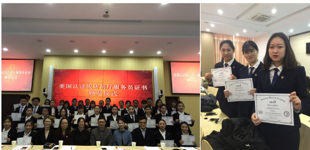
图 10: 酒店管理专业国际班学生获得美国饭店协会职业资格认证

饭店协会认证前厅服务师，通过率超过 80%。2017 级酒店管理专业国际班 45 名同学和普通班 43 位同学均参加餐饮服务师职业资格认证，通过率达 100%。今后还将继续参加注册国际饭店主管（CHS）考证实训和黄金服务认证（CGSP）等职业资格认证考试。