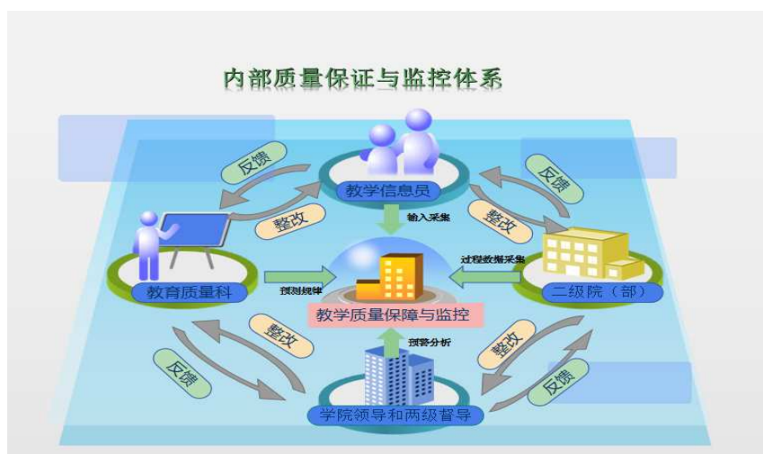
图 4：学院内部构建质量监控网络信息流的基本架构