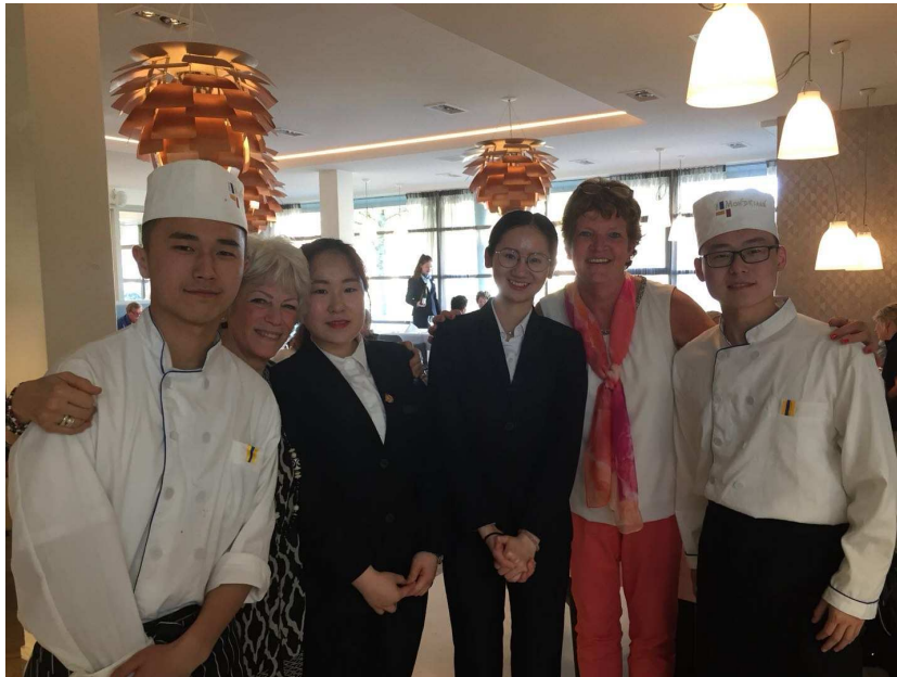
图 6-1 酒店管理和烹饪专业学生在荷兰假日酒店实习

【校企联动开创海外交流学习新模式】 南京旅游职业学院积极推进国际交流与合作，先后与13个国家及地区的25所院校建立了交流合作关系，2018年与荷兰蒙德里安酒店管理学院，联合洲际酒店管理集团共同开发了针对酒店管理专业学生的赴欧交换学习与实训项目，参加项目的学生可以赴荷兰蒙德里安学院与荷兰当地洲际酒店进行1个月的交换学习与2个月的酒店实训。项目集学习、实践与文化传播于一体，突破了传统交流学习只有理论知识学习的局限，通过理论与实践相结合，使学生在欧洲学习酒店管理知识的同时，参与海外酒店的管理运营，提升学生国际化职业素养的同时，也向荷兰当地群众传播了中国餐饮文化，为旅游类高职院校境外交流学习开创了新模式。