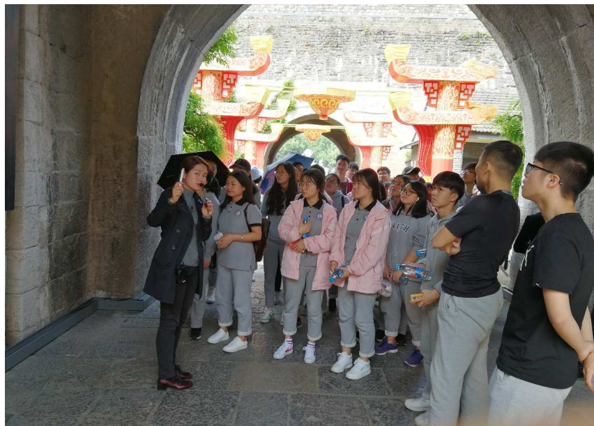
图 2-1 思政部老师带领学生参观中华门城堡景区感受红色旅游文化