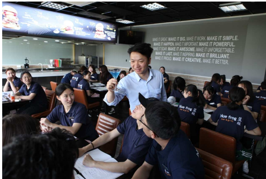
图 3-3 合作企业蓝蛙餐饮管理公司企业教师授课现场