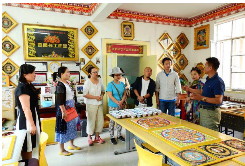
图 5-1 2018 年 8 月人文艺术系教师到青海回访唐卡非遗传承人

【非物质文化遗产研培助推教科研发展】 作为 2015 年首批入选“中国非物质文化遗产传承人群研修研习培训计划”的院校之一，南京旅游职业学院积极参与传统工艺与旅游工艺品设计研发，以“强基础、拓眼界、增学养”为目标，先后举办藏族唐卡、土族刺绣、宁夏剪纸研修、研习培训班 9 期，承办 3 期青海省非遗传承人群唐卡艺术展，为助推民族地区非遗传承与旅游发展，助力精准扶贫贡献力量。为全力做好培训，优化课程设计，实现了传承人与师生的对话、课程的跨界，拓宽了专业建设思路，孕育了一系列教学与科研成果，助推了教师的专业成长，促进了文旅融合，增强了学校传承、振兴与发展中华优秀传统文化的能力。