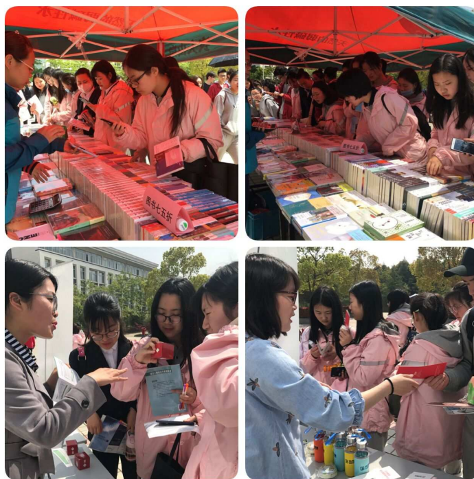
图 2-2 四月举办“爱阅读，爱分享”主题阅读推广活动

【推广“爱阅读，爱分享”主题阅读活动，积极营造学习型校园文化】 为响应国家全民阅读的号召，用实际行动迎接第23个“世界读书日”，学校举办为期一个月的“爱阅读，爱分享”主题阅读推广活动。通过举办云舟网上阅读评论竞赛、“绿色节约，知识共享”图书漂流活动、读书之星评选、专题图书展销、数字资源推广、“遨游书海，共读一本书”湖畔沙龙，以《文学中的传统文化》、《烹饪人生与我的研究》等一系列形式多样、精彩纷呈的活动，有力地推进了学校学习型校园建设，营造了积极浓烈的校园文化氛围。