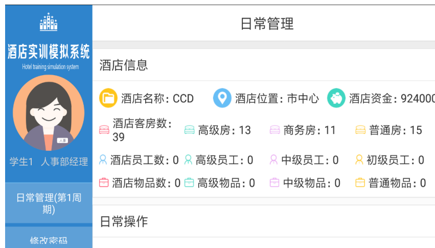
图 3-1 酒店经营管理虚拟仿真实训平台酒店实训模拟系统

有各类微课教学视频达到 50 余个，建设高规格智慧教室，建设远程互动直播教学系统、智能录播烹饪实训中心等，推进信息技术教育应用。