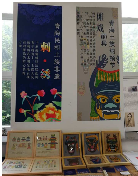
图 5-2 举办 2018 年青海土族刺绣传统工艺与旅游纪念品研发成果展