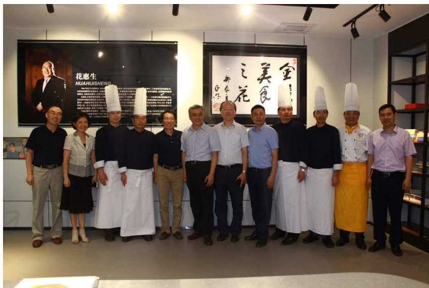
图 3-4 文化和旅游部副部长项兆伦考察学校产业教授花惠生大师工作室

【携手产业教授，打造高水准“双师型”师资队伍】 依托省示范建设，努力打造一支专兼结合、结构合理、素质优良、实践能力突出的“双师型”师资队伍。过去一年，学校依托省政府“产业教授”人才项目，聘请省内旅游企业高级管理人员3名作为产业教授，充分发挥其专业示范和引领作用，共同参与专业人才培养、技术研发、师资培养以及产学研合作等建设，共同打造“平台共建、项目共研、资源共享、成果共创、人才共培”的校企合作共同体，并为产业教授建设大师工作室，选派专业教师进驻工作室，有效地推进了“双师”素质教师队伍建设水平整体提高，为打造高水准“双师型”师资队伍提供了保障。