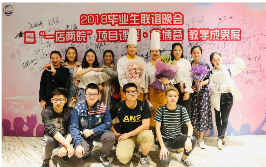
图 3-2 毕业生联谊晚会暨“一店两院”项目教学成果展在御冠教学酒店举行

【工学结合塑酒店现代学徒制新模式】 学校以校内教学酒店御冠酒店为载体，推进“现代学徒制”改革，面向酒店管理专业、烹饪与营养专业酒店管理以及烹饪类专业学生，实施“一店两院”产教深度融合实践项目，创新酒店现代学徒制组织形式，培养满足企业行业一线需求的高素质旅游专业人才，形成了“分段进阶式”现代学徒制人才培养模式，学生在酒店真实工作场景中开展专业学习，有效开展了“一日识岗”、“一月跟岗”、“一轮顶岗”和“岗位轮岗”实践，工学交替，强化了学生岗位技能训练和职业素质养成，培养了学生岗位适应性和职业认同感，提升了学生的专业实践能力和综合职业素质，增强了未来就业竞争力。