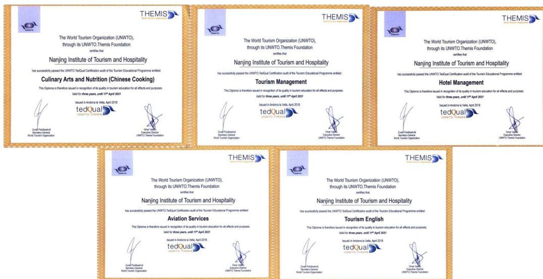
图 6-2 酒店管理 etc 5 个专业通过联合国世界旅游组织旅游高等教育质量认证

游伦理道德规范》，纳入学生专业教育之中，提升学生国际视野的同时，培养优秀的旅游国际化人才，让更多学生走向世界。通过国际认证，学校办学目标更加明确，人才培养标准更加科学，未来将在全球化的舞台上展示中国旅游职业教育的风采。