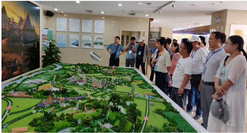
图 5-3 组织商洛市培训班学员参观江宁区全域旅游服务中心