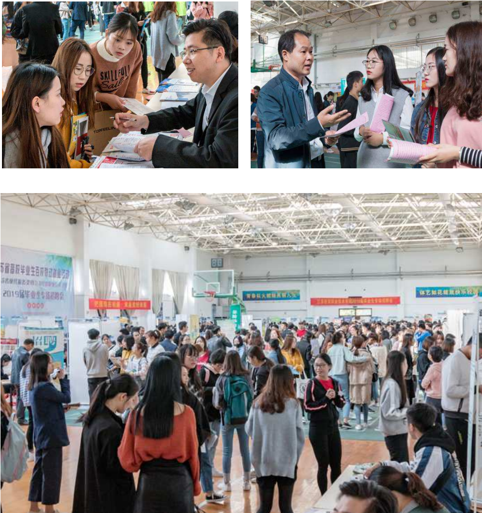
图 1-10 2019 届毕业生秋季校园招聘会实录

同时，将博雅情怀类、科技创新类、技能水平类、竞赛获奖类、创新训练类、创业实践类、社团活动类、社会实践类、志愿服务类等项目，纳入专业人才培养体系，学分化管理，确保了学生稳定 and 高质量就业。2016 年至 2018 年“计分卡”数据显示，学校毕业生就业率连续三年稳定在 99% 以上。见表 1-2 所示。