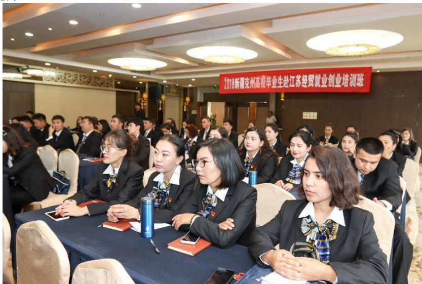
图 4-3 克州未就业高校毕业生（2018）·江苏经贸培训班学员接受就业创业能力培训。

为帮助地处帕米尔高原的克州未就业高校毕业生，特别是基层农牧民，早日创业就业，走上脱贫致富之路，我们采取“量体裁衣”式的“菜单式”培训，采取：变“输血”为“造血”，扶志扶智相融互补的方式，先后举办新疆克州未就业大学生自主创业·江苏经贸培训班 2 期，企事业单位新招录大学生岗前培训 3 期，累计培训来自阿图什市、乌恰县、阿克陶县、阿合奇县的维吾尔族、柯尔克孜族、哈萨克族等民族，共计 365 名未就业大中专毕业生。通过学习和训练，使他们学到了自主就业创业的基本技能，增添了边疆学子自强自信和自主就业创业的信心和能力。