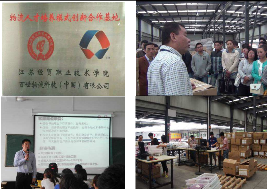
图 2-5 校企共同打造快递业“七同”育人新模式