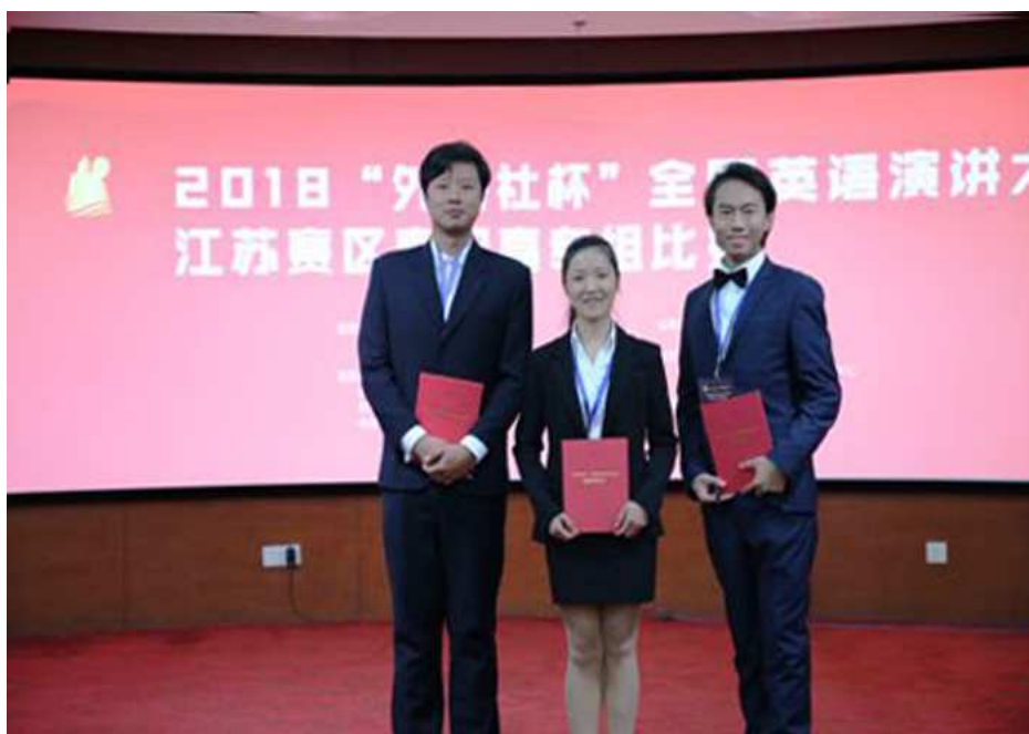
图 1-7 我校学生选手在由外研社与江苏省高等学校外语教学研究会主办的 2018 “外研社杯”全国英语演讲大赛上分获一等奖、二等奖和三等奖