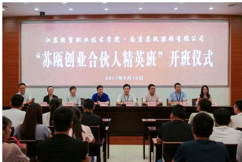
图 1-11 学校与苏瓯服饰有限公司合作开办现代学徒制模式的“苏瓯创业合伙人精英班”

为探索新商业业态下，现代学徒制的办学模式，工商管理学院与苏瓯服饰有限公司合作开办了“苏瓯创业合伙人精英班”，共同探索“互联网+”商业模式下新型职业店长的人才培养模式，以有效解决现行人才培养模式理论与实际割裂、知识与能力脱节、教学与产业脱节所造成的高职人才供求结构性矛盾。据悉截止到目前为止，已有 33 名连锁经营管理专业学生接受系统培训，其中 25 位同学已成为企业店长，其他同学已成为公司培训部、人事部、发展部的骨干员工。