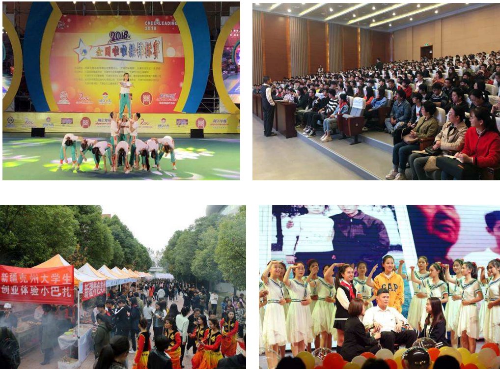
图 1-4 多形式的学术与文化艺术活动丰富了大学文化建设