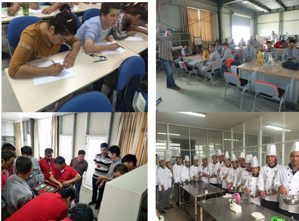
图 4-5 阿克陶县玉麦乡基层农牧民，在克州基层紧缺型技能人才江苏经贸培训班进行汽车维修、西式糕点制作等技能培训，其中学员已在当地走上了自主创业就业之路。

采取：量身定制精准培训，扶技扶业靶向帮扶方式，针对阿克陶县玉麦乡基层农牧民的专项技能培训。根据当地工业基础较薄弱的情况，我们为他们量身定制了菜单式培训计划和丰富多彩的素质训练项目。截止到目前为止，我们共举办新疆克州紧缺型技能人才·江苏经贸培训班 2 期，累计培训阿克陶县玉麦乡普通农牧民 99 人。其中，已有学员在当地开办了烧烤店、包子铺以及家电维修部等，初步实现了脱贫致富的梦想。