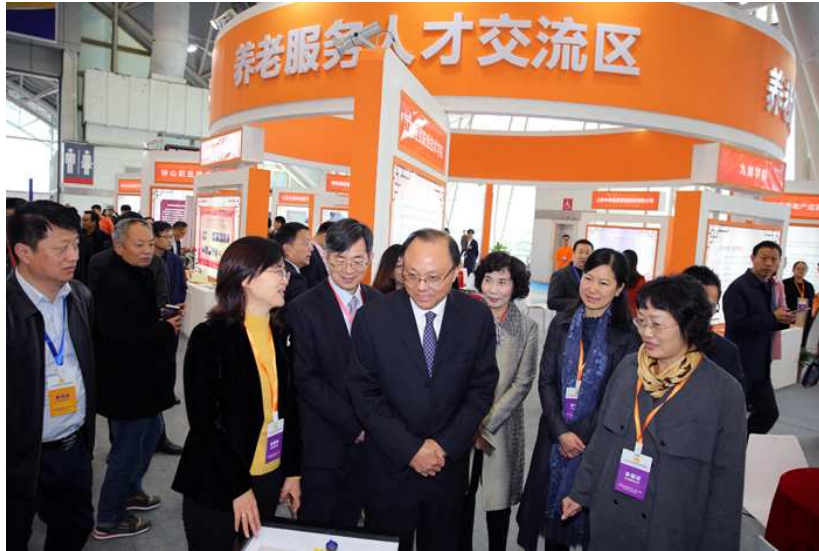
图 2-4 江苏省政府参观博览会养老服务人才交流区

依托江苏省养老服务职业教育与产业合作促进会、江苏省老龄产业协会，开展系列化养老产业专门人才培养，共同承办 2018 江苏国际养老服务业博览会“养老服务人才交流展区”暨高峰论坛系列活动，为区域经济发展积极作为。