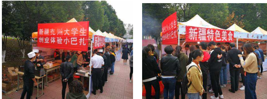
图 4-4 克州未就业大学生江苏经贸培训班学员，在校园“双创月”活动中开展自主创业体验，成为校园内的一道风景线。

采取：量身定制精准培训，扶技扶业靶向帮扶方式，针对阿克陶县玉麦乡基层农牧民的专项技能培训。根据当地工业基础较薄弱的情况，我们为他们量身定制了菜单式培训计划和丰富多彩的素质训练项目。截止到目前为止，我们共举办新疆克州紧缺型技能人才·江苏经贸培训班 2 期，累计培训阿克陶县玉麦乡普通农牧民 99 人。其中，已有学员在当地开办了烧烤店、包子铺以及家电维修部等，初步实现了脱贫致富的梦想。