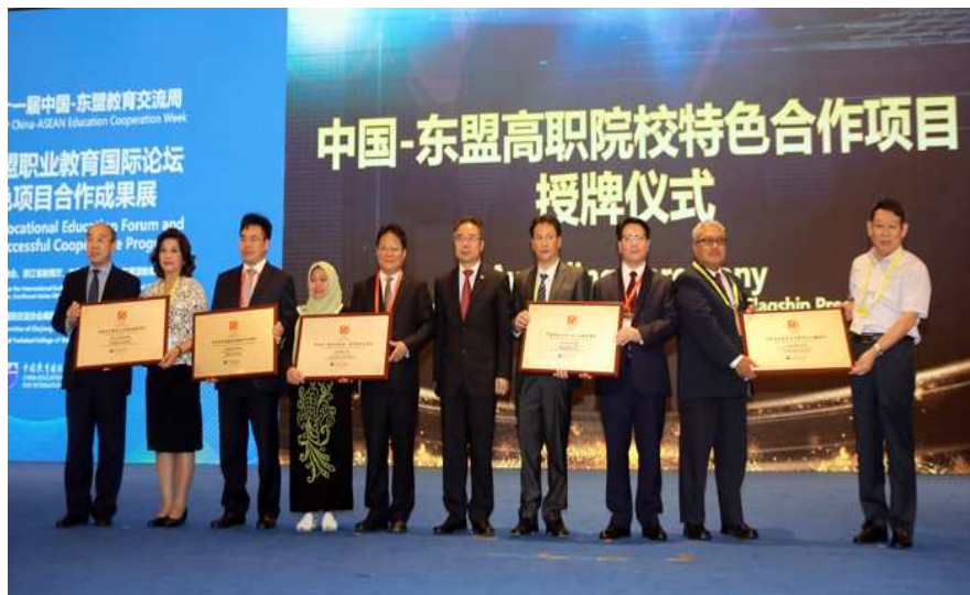
图 4-1 学校“电商谷”入选中国-东盟特色合作项目

柬埔寨合作项目深入推进。学校与柬埔寨泰州商会合作，在柬方共建的职业技能培训中心，为中国在柬企业员工提供运营管理、财务会计、数据分析、金融政策等业务培训。学校的“电商谷”项目，被“中国-东盟双百职校强强合作旗舰计划”遴选为20个具有示范引领作用的“中国-东盟高职院校特色合作项目”。