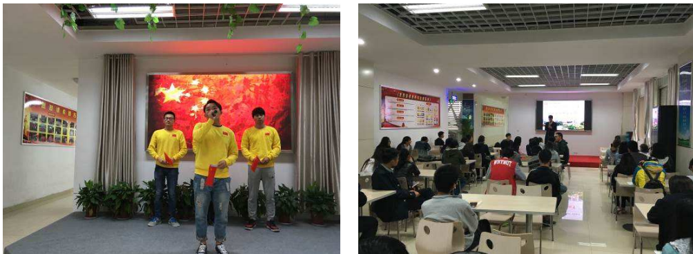
图 1-1 学生在“思政实训室”进行项目化“思政教学”实践体验

不断深化思政教育主渠道、主阵地建设。学校近年来持续深化：教材体系再改造、理论教学专题化、实践教学项目化和教学资源系统化的“一改三化”“思政教学”改革。2018 年被省教育厅遴选为省高校示范马克思主义学院建设单位。新华日报、中国江苏网、新浪网等主流媒体，专题报道了我校思政教学改革成效。