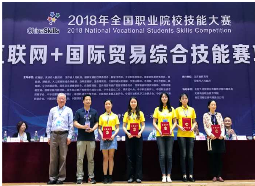
图 1-5 我校学生选手蝉联 2018 年全国职业院校技能大赛高职组“互联网+国际贸易综合技能”赛项一等奖

完善多层次技能竞赛体系。在人才培养过程中，各专业精选教学内容，将技能竞赛项目融入课程教学内容，精心组织教学过程，创新教学模式，强化过程管理，全方位培养和提升学生的综合素质，学生在全国技能竞赛中屡获殊荣。