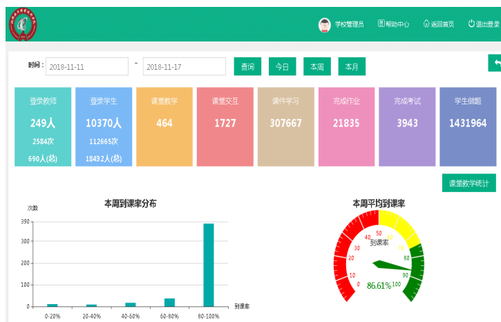
图2-2 江苏经贸职业技术学院在线课程平台

在 2017 年、2018 年江苏省信息化教学大赛上获得一等奖 2 项、二等奖 1 项、三等奖 2 项；在 2017 年江苏省高等学校微课教学比赛中获得一等奖 3 项、二等奖 2 项、三等奖 8 项；在 2017 年“领航杯”江苏省信息化教学能手大赛上获一等奖 2 项；在江苏省第二届高校教师公共艺术课程微课大赛获专科组一等奖，……。