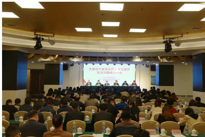
图 2-3 全国现代服务业职业教育集团西北分部，在西安成立

积极探索集团化办学新形式。学校以全国现代服务业职教集团为载体，不断深化产教融合、校企合作。成立由陕西工商职业学院牵头，联合陕西、甘肃、宁夏、青海、新疆地区的相关行业、院校和企业组建而成的全国现代服务业职业教育集团西北分部，旨在围绕国家“一带一路”发展战略，致力培养紧缺的技术技能型应用人才，促进我国西北地区现代服务业发展。