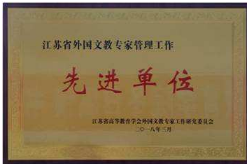
图 5-1 学校获“江苏省外国文教专家管理工作先进单位”称号