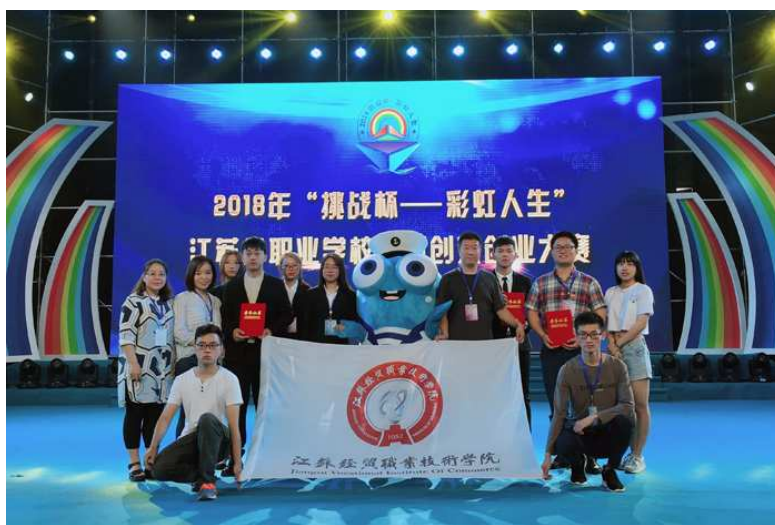
图 1-8 我校学生选手获 2018 年“挑战杯——彩虹人生”江苏省职业学校创新创业大赛决赛特等奖