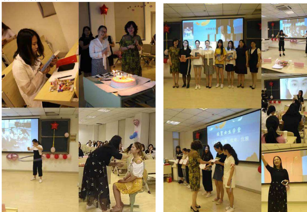
图 1-3 “经贸女子学堂”开展多形式的素质提升训练

修身养性的“经贸女生学堂”。为培养“自信、自强、优秀、优雅”的新时代女性，根植博雅，博采众长，涵盖文学、法律、体育、心理学、音乐、礼仪、金融、艺术设计、甜品制作等选修课程体系的“经贸女生学堂”，采取小班化培养模式，为培养女生健全人格、丰富人性等发挥了积极的作用，丰富了高职院校素质教育的培养形式。