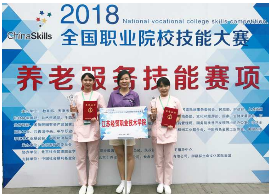
图 1-6 我校学生选手获 2018 年全国职业院校技能大赛高职组“养老服务技能”赛一等奖