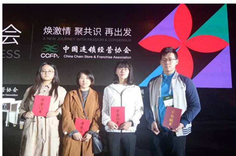
图 1-9 我校学生选手荣获 2018 年中国连锁经营协会第五届中国零售新星大赛决赛一等奖