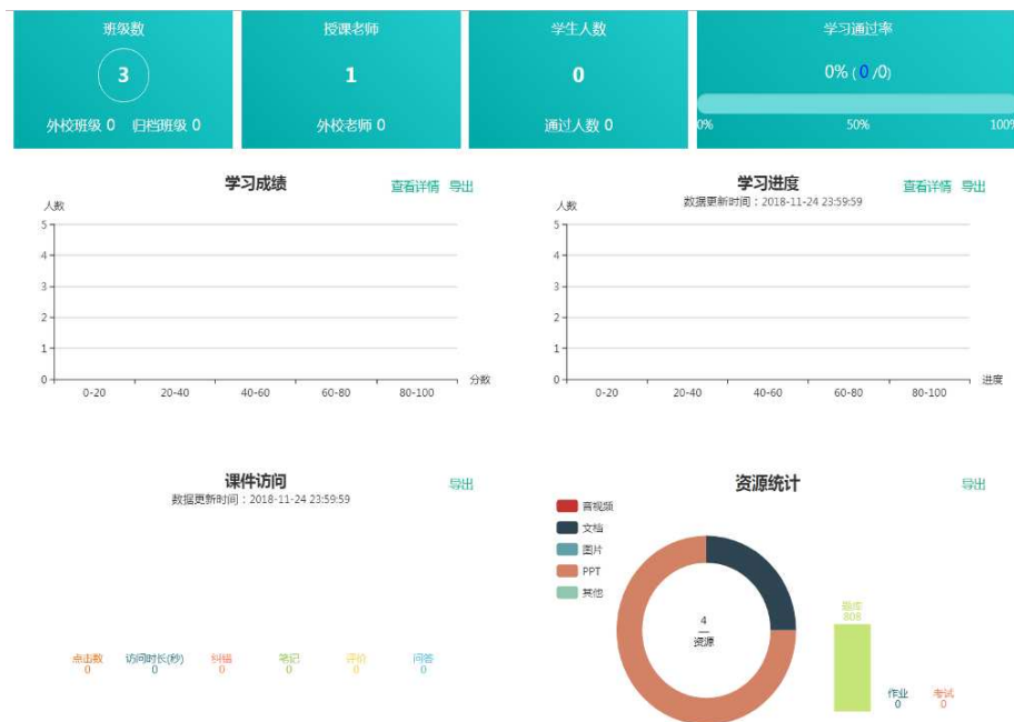
图 2-6 学校与高教社共建的教师信息技术开发应用平台

为全面提升全校师生运用信息化技术的应用水平，不断提高教育教学和人才培养质量，学校与高等教育出版社合作共建“教学资源开发实训基地及教师发展培训中心”。由学校提供场地，高等教育出版社一次性投入资金约 165 万元进行实训基地功能区环境设计、场地装修及配置先进的专业设备设施等，后期每年投入约 120 万元用于信息化课程资源开发、建设与运行维护。该建设模式，全面推进了学校信息技术在教育教学过程的应用，不仅为学校牵头建设的《连锁经营管理》、《移动商务》2 个国家专业教学资源库提供了积极的支撑，更为学校在“十三五”期间建设 300 门校级在线开放课程创造了有利条件。目前，共有教师自主建设了 328 门在线课程，参与使用教师 488 人(含企业教师、兄弟院校教师)，受益学生 18432 人(含其它学校学生)。