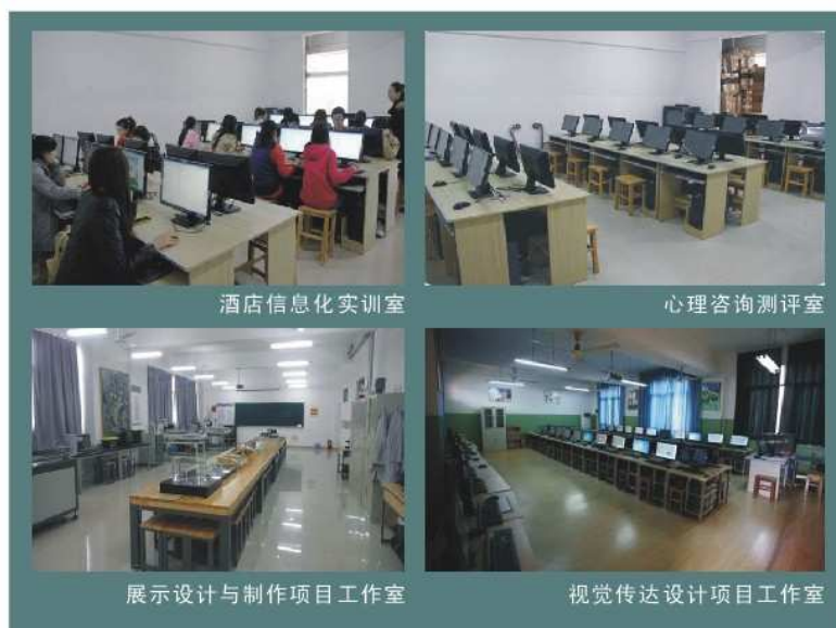
图7：部分校内实习实训基地