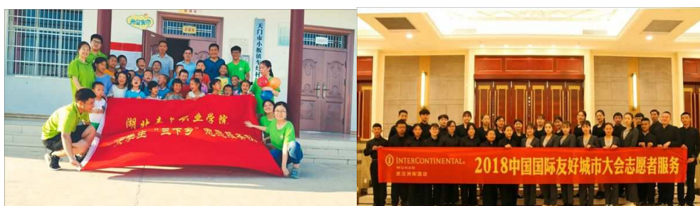
图9：我校青年志愿者开展活动剪影

学校青少年工作与管理专业的师生为留守儿童开展心理疏导服务，学校大学生志愿者在周边的社区、学校、敬老院定期开展大量的社会服务活动，并长期在黄冈团风县丁垵村小学支教，从未有过间断，赢得了当地家长及学生的好评。