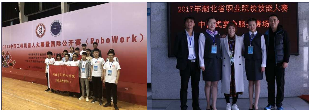
表 1：2017—2018 年度部分学生获奖情况