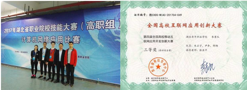
图 3：2017-2018 年部分学生参加比赛及获奖照片