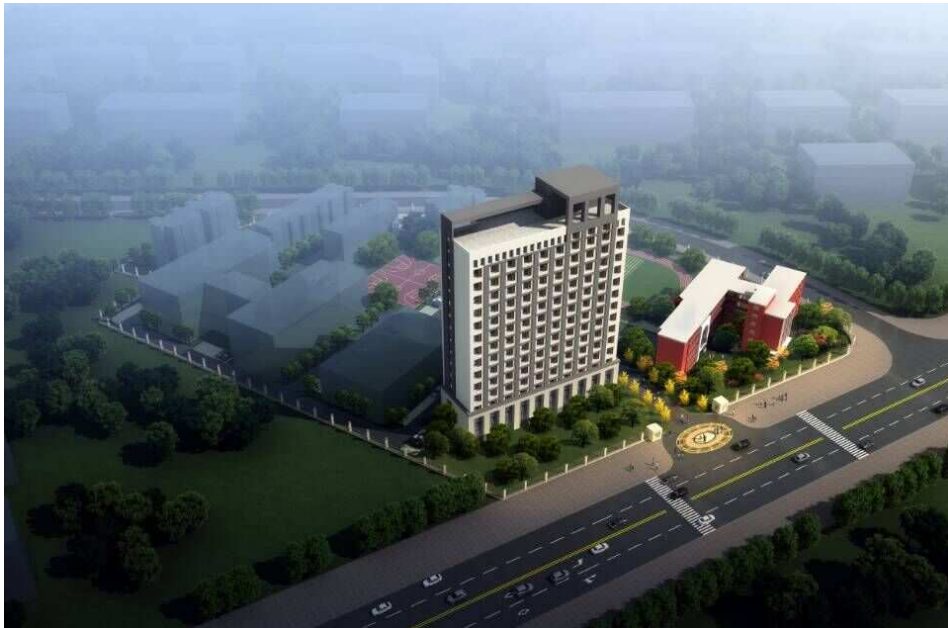
图1：学校校园二期（2018 年底已基本完工）效果图

学校设有 6 个系部和 1 个研究中心，开设计算机网络技术、信息安全与管理、青少年工作与管理、社会工作、市场营销、会计、动漫制作技术、展示艺术设计、艺术设计、建筑室内设计、旅游管理、酒店管理、建筑工程技术、工程造价、通信技术、高速铁路客运乘务、移动应用开发、汽车营销与服务等 18 个专业，形成了青年工作、信息技术、商务旅游、艺术传媒等 4 个专业群，其中有 2 个中央财政支持重点建设专业、2 个国家实训基地专业、1 个国家专项资金支持专业、2 个省级实训基地专业、10 个楚天技能名师领衔建设专业、1 个“黄鹤英才”专家领衔建设专业。校舍总建筑面积 28523 平方米，教学科研及辅助用房面积 11214 平方米，固定资产 5139.92 万，其中教学、科研仪器设备资产总值 1169.89 万元，馆藏图书 11.4 万册。拥有设施完备、功能齐全的教学楼、多功能报告厅、图书馆、羽毛球馆、餐厅、浴室等教学生活用房。