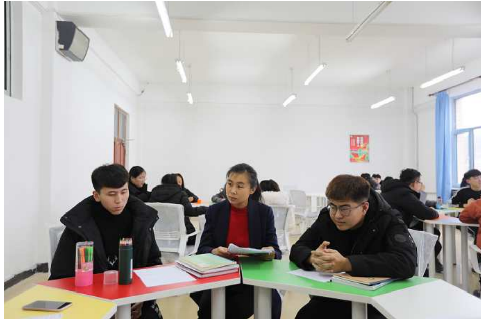
（图片 3：任课教师开展小组讨论教学，对学生开展思政教育）