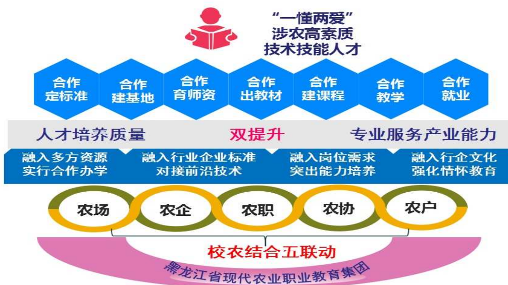
“四融入七合作双主体”人才培养模式图