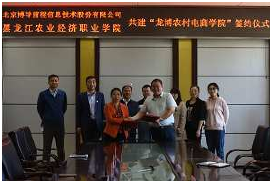
（图片 6：学院与北京博导前程信息技术股份有限公司合作成立“龙博农村电商学院”）