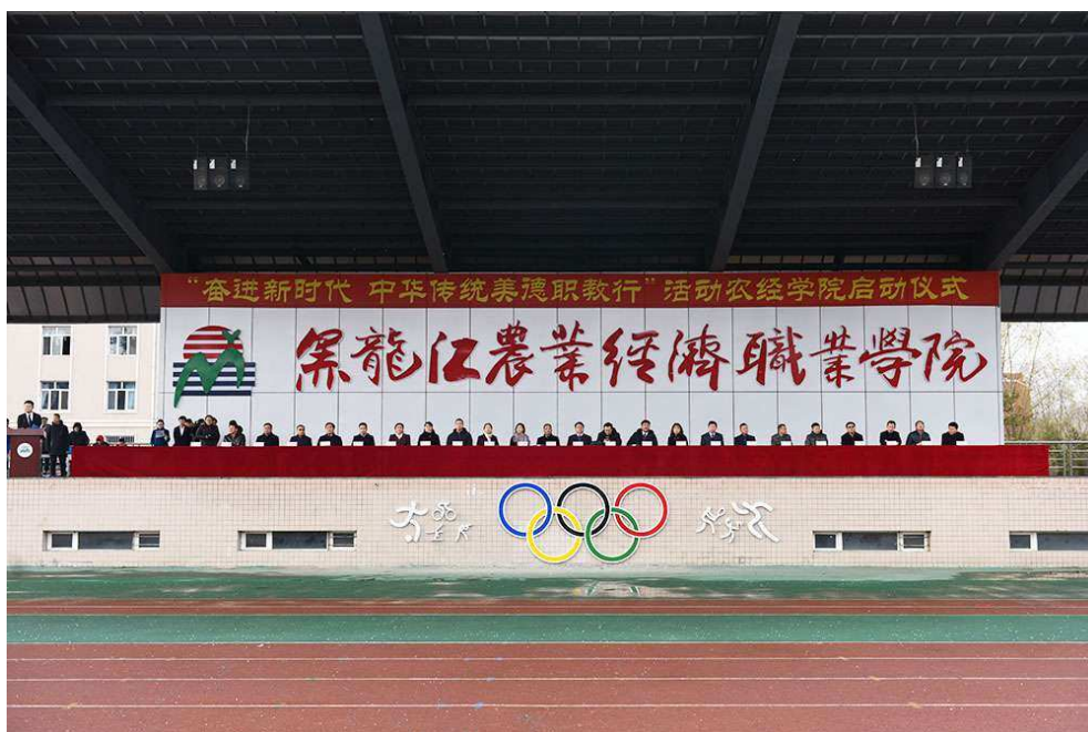
(图片 5: 学院举办“奋进新时代 中华传统美德职教行”活动)

个)；摄影作品 7 个(省级 1 个，推荐参加国家比赛 2 个)；“微信”作品 6 个(获奖省级 4 个，推荐参加国家比赛 1 个)；其他类网络创新作品 4 个(获奖省级 2 个，推荐参加国家比赛 2 个)。农经朗读者协会的多名社员参加的“讴歌改革开放 40 年.为新时代献礼——声声不息”黑龙江省诵读大赛获得牡丹江赛区团队金奖、黑龙江省团队优秀奖等多项殊荣。在全国第五届大学生艺术展演活动中，我院张永昌老师指导学生杨佳雪的书法、篆刻类作品《杨家雪篆刻选》荣获黑龙江省艺术教育实践教学成果。