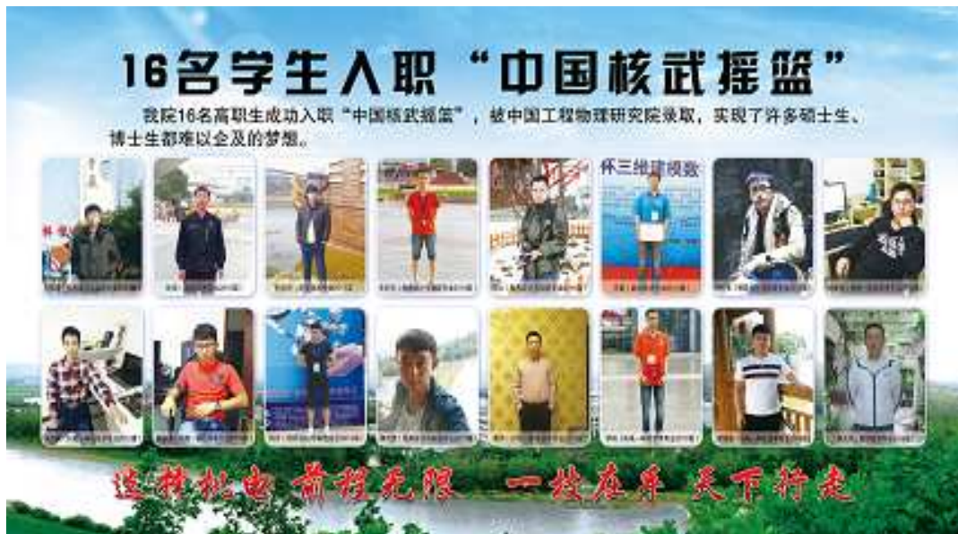
图片 1：16 名优秀毕业生成功入职“中国核武摇篮”

全国职业院校技能大赛成就了一批批优秀学子，精湛的技能征服了企业领导精英。自 2010 年获得全国职业院校技能大赛一等奖的农经学子入职“中国核武摇篮”——中国工程物理研究院以来，这一优良传统得以传承，2018 年又有 1 名学子获得专家的认可并被录用。目前，共有 16 名毕业生成功入职“中国核武摇篮”——中国工程物理研究院，实现了许多硕士生、博士生都难以企及的梦想。成绩的取得离不开学院对人才的个性化精细化培养，以“大国工匠为楷模”，精雕细琢，培养职业精英。各专业按照“学院与企业融合、学习与工作融合、理论与实践融合”的思路，构建了由基本技能→专项能力→综合岗位能力的“多层次”递进的实践教学体系，采取多种措施，强化职业能力训练和素质培养，造就了一名名优秀的农经学子、未来的国家栋梁。