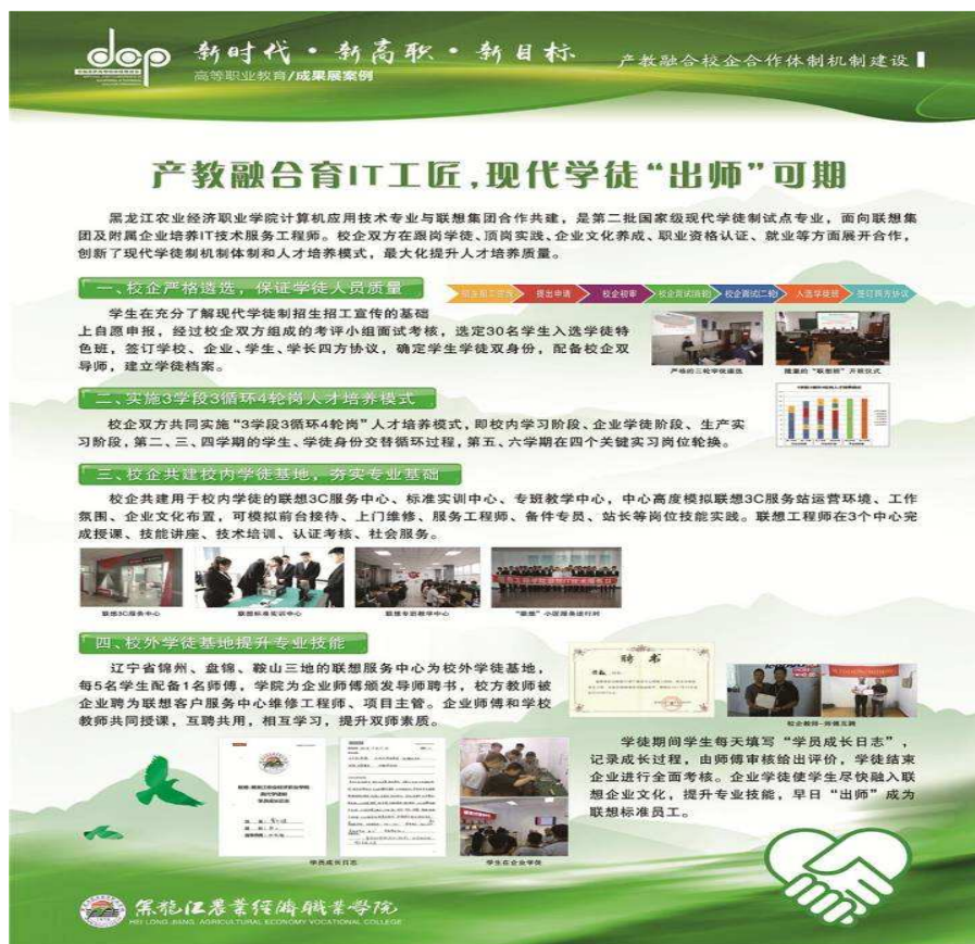
(图片 2: 学院与联想(北京)有限公司共建“现代学徒制”试点项目)