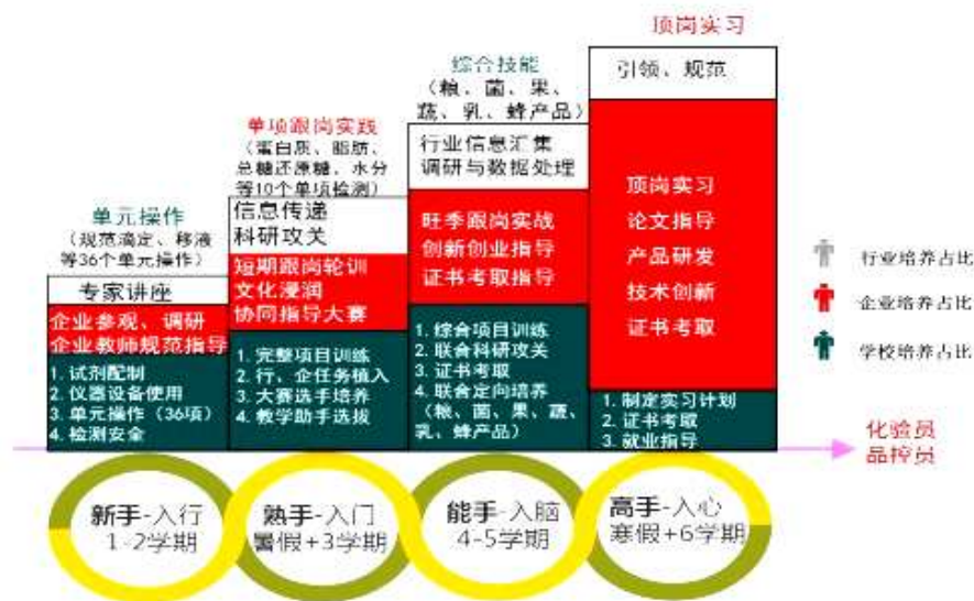
(图片 8：“四阶递进式”人才培养模式图)

创新校企行共育“四阶递进式”人才培养模式，重构岗证融合、课赛一体的“2336”课程体系，通过“三实”“五措”的育人过程，实现学生由“新手→熟手→能手→高手”的职业进阶。专业为省级重点专业、省高水平院校食品群核心专业、省级共享服务平台；制定专业、行业标准 4 个，审定品种 26 个，重大攻关 14 项；获全国农职教育研究会一等奖等十余项；建成 1 门省精品在线开放课程、2 门国家教学资源库课程、4 部工学结合教材。