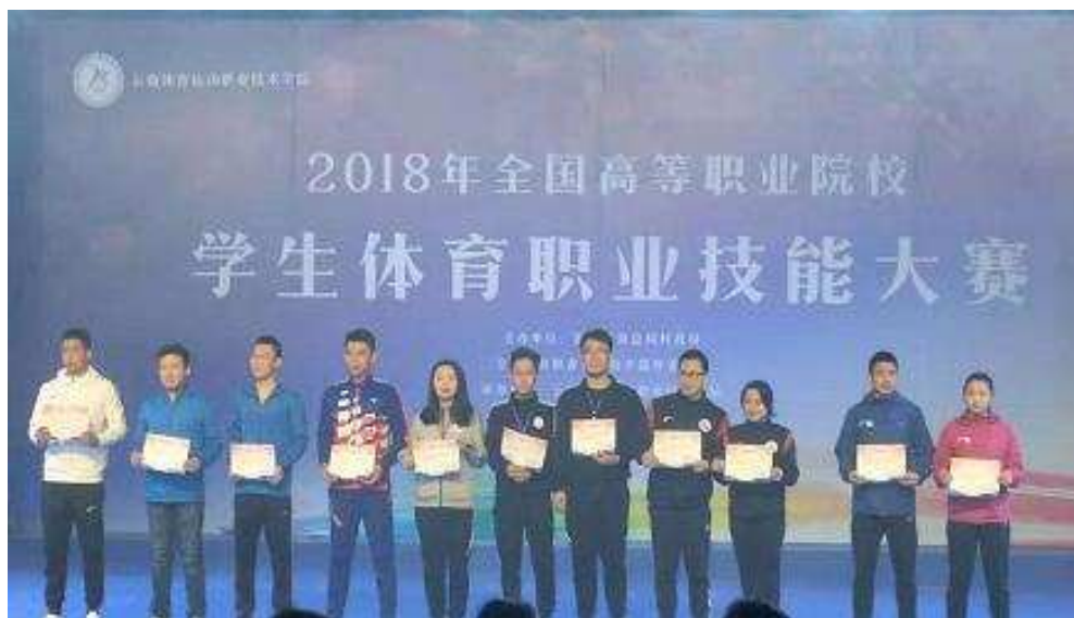
全国高等职业院校学生体育职业技能大赛

德风尚奖。在黑龙江省首届学生“行业-专业-就业”分析大赛中荣获一等奖的优异成绩。参赛选手团结一致、顽强拼搏，战胜了诸多传统强队，展示了学院风貌，专业知识和技能得到了全面的提升。