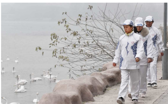
天鹅使者志愿者正在巡回保护天鹅

学院志愿服务活动形式多样、内容丰富。有倡导文明的交通协管、市容保持、保护白天鹅活动；有到福利院、敬老院和孤儿院送温暖等活动；有暑期科技、文化、卫生“三下乡”社会实践等活动；