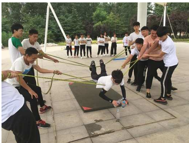
素质拓展训练现场

依托，以培训为方式，以感悟为目的，利用周末课余时间激发个人潜能，培养乐观心态和坚强意志，树立相互配合、相互支持的团队精神，增强团队合作意识。学院在校内建立了素质拓展训练中心，自 2018 年 3 月 9 日第一期素质拓展开营到现在共举办了 20 期素质拓展训