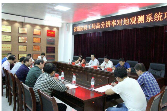
高分河南中心三门峡分中心建设研讨现场

高分分辨率对地观测系统河南数据与应用中心三门峡分中心（简称高分河南中心三门峡分中心）于 2018 年 3 月经河南省国防科工局批复同意依托三门峡职业技术学院建设。自建设工作启动以来，分中心建立了高分三门峡分中心运行机制，完成了高分遥感影像数据平台、卫