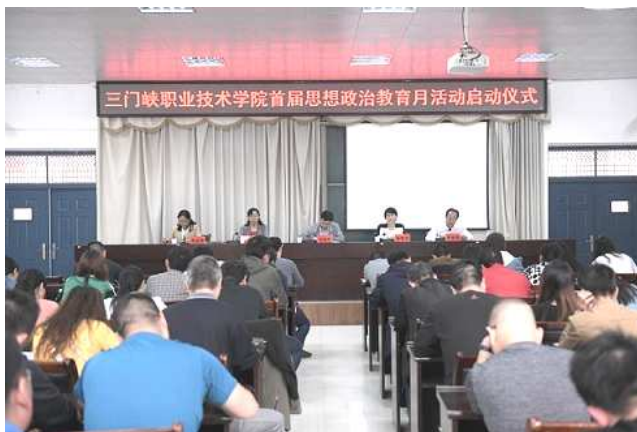
首届思想政治教育月活动启动仪式

传活动，深刻领悟习总书记在全国高校思想政治工作会议讲话精神，完善思想政治工作方法，创新思想政治工作载体，坚定不移地把思想政治工作贯穿人才培养全过程。二是开展社会主义核心价值观教育。以爱国主义教育为重点，以校园文化为宣传思想阵地，以思想政治教育月活动