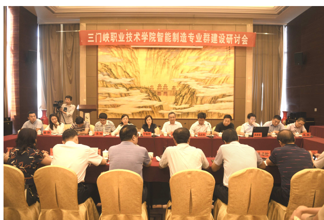
与固高集团合作成立智能制造学院

学院先后与广东永顺实业集团、浙江人本集团、中国青年旅行社、德国F+U萨克森职业培训学院、上海锦明地产有限公司、河南速达电