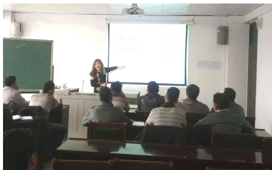
印尼留学生正在进行汉语学习

为积极响应国家“一带一路”经济发展战略，提升国际影响力，三门峡职业技术学院与锦江铝业（印尼）有限公司校企合作，共同为锦江铝业（印尼）有限公司培养具有国际视野、通晓国际规则、能够参与国际事务与国际竞争的国际化人才。首批锦江铝业（印