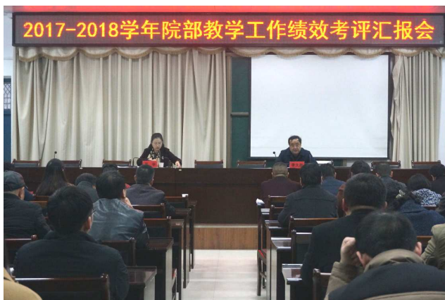
学院开展院部教学工作绩效考评

根据教育部《高等职业院校内部质量保证体系诊断与改进指导方案（试行）》和河南省教育厅《河南省高等职业院校内部质量保证体系诊断与改进工作实施方案》的精神，学院制订和修订了《三门峡职业技术学院院部两级教学管理工作条例》《三门峡职业技术学院院部教学工作职责》《三门峡职业技术学院院部教学工作绩效考评办法》《三门峡职业技术学院学生学业预警实施办法》等教学