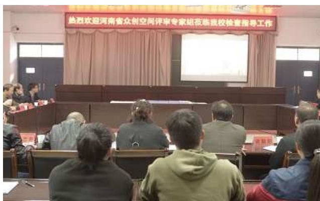
建设河南省高校众创空间项目

根据三门峡市委、市政府对国家“一带一路”战略和“中国制造 2025”“互联网+”行动计划的积极响应，以及学生创新创业的需求，三门峡职业技术学院在整合、升级和改造部分实训资源的基础上，打造三门峡市众创空间暨创业孵化基地，成立毓之源众创空间和三门峡毓之源创业服务有限公司，开展创业孵化项目申报评选、创业培训和创业实践；举办 6 届大学生创新创业大赛、6 届大学生创业设计大赛、5 期创业大讲堂、首期“互联网+”创新创业大赛；与北京创大科技有限公司合作举办 5 期创大特训营，成立创新创业协会；支持孵化企业 41