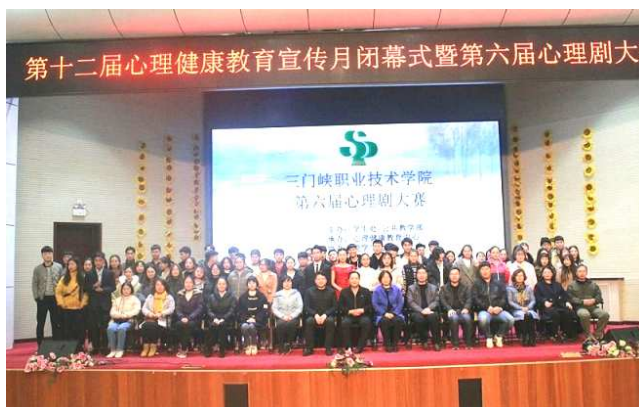
心理健康教育宣传月

一是建立心理危机预防与干预系统。健全学院、院部、班级、宿舍四级心理危机预警系统，每年新生入校后，对学生开展心理健康普查，分析数据、筛选学生，并开展团体辅导和个别咨询，建立学生心理健康档案，撰写普查报告。二是以活动月为载体，心理健康教育系列活动丰富多彩。举办了 5·25 心理健康教育系列活动，第十二届心理健康教育宣传月系列活动，相继开展心理知识讲座、心理普查、心理沙龙、主题班会、心理影片赏析、心理素质拓展训练、心理委员培训、心理知识竞赛、心理剧比赛等一系列活动。三