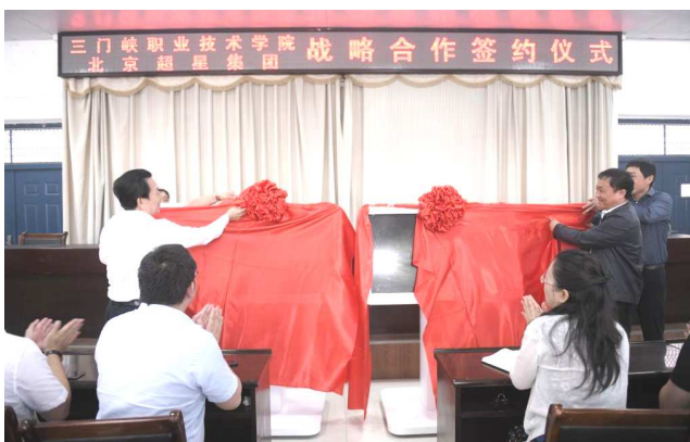
与超星集团合作开发信息化课程

为了巩固教学改革“三年三步走”的成效，持续推进“六步四结合”课程教学模式改革的实施，本年度，学院大力实施课程建设信息化工程，深入推进课程改革，探索构建信息化条件下的课