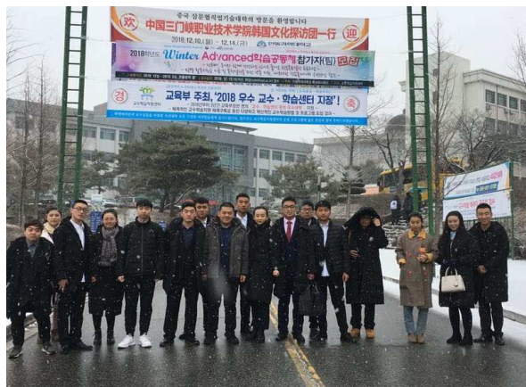
我院师生赴韩国安东科学大学文化探访

2018 年 5 月 29 日至 31 日,韩国安东科学大学中国文化探访团师生 18 人到我校交流访问。韩国师生通过参观校园和实训基地、体验陶艺和茶道、观看演出、师生联欢、城市文化探访等活动,对我校、对三门峡都有了深刻的了解和认识。