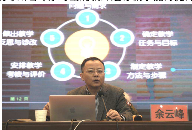
教师教学能力大赛专家余云峰教授做培训报告

本年度，学院继续以教师教学能力提升为主题，开展校本教师培训，先后邀请中国高等教育学会职业技术教育分会会长、浙江金融职业学院党委书记周建松，高等教育信息化专家、麦可思公司副总裁、研究院副院长周凌波博士，教师教学能力大赛专家余云峰教授，全国高职院校校长联席会常务理事、威海职业技术学院创校校长金志涛教授等知名专家对全院教师进行教学能力提升培训，不断更新教师教育