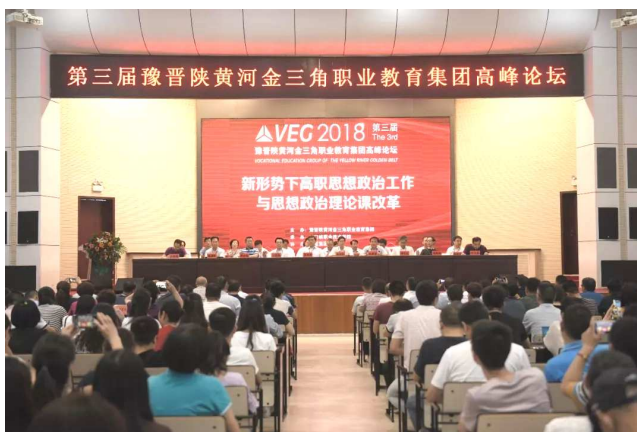
举办职教集团第三届高峰论坛

以“新形势下高职思想政治工作与思想政治理论课改革”为主题，交流和研讨新形势下高职院校思想政治工作改革与创新、新形势下高职思想政治理论课改革与创新等议题。来自豫晋陕三省七市 11 所高职院校、河南省六市 7 所高职院校及 10 余家