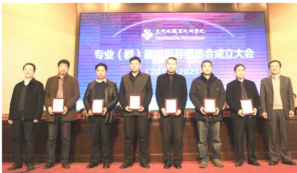
组建 2018-2021 年专业（群）建设指导委员

相关的支柱产业培养人才。学院以提高质量为核心，重点打造机电一体化、软件技术、建筑工程技术、电气自动化技术、物流管理、食品加工技术、学前教育、护理等 8 个优质骨干专业。