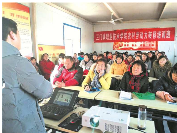
农村劳动力转移培训班

学院坚持“立足三门峡、面向金三角、服务大中原”的办学定位。时刻坚守为地方经济发展服务的宗旨，不断强化服务全市人民的意识。依托全日制教育各专业的办学资源和社会优势，重视社会培训，积极与企业、行业开展合作，紧跟市场需要，培养地方经济社会发展急需人才。参与河南省农民工学历与能力提升行动计划—“求学圆梦