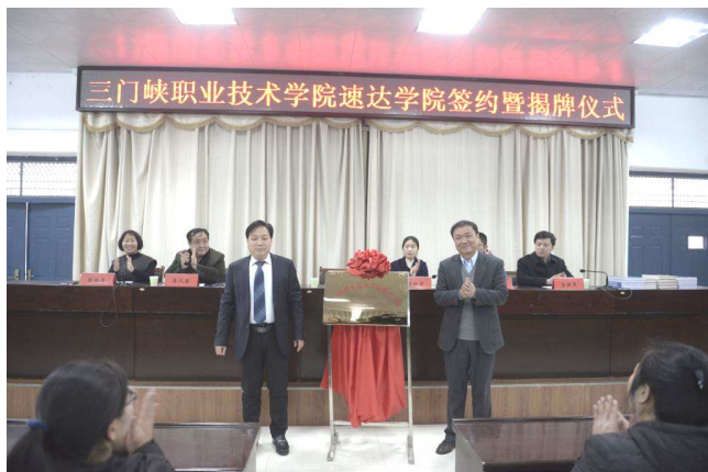
成立三门峡职业技术学院速达学院

为进一步加快推进现代学徒制试点工作，深化产教融合、校企合作双主体育人机制，提升人才培养质量，三门峡职业技术学院与三门峡速达交通节能科