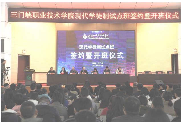
举行现代学徒制试点班开班仪式

根据教育部办公厅和河南省教育厅办公室《关于做好 2018 年度现代学徒制试点工作的通知》要求，学院从目前院级现代学徒制试点专业建设中，遴选确定了机电一体化技术、建筑装饰工程技术、旅游管理 3 个专业申