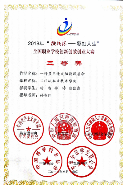
建材协会获挑战杯国赛三等奖

学院高度重视社团活动，鼓励怀有不同兴趣和不同特长的大学生积极参加社团活动，充分发挥学生社团在高校“第二课堂”的育人功能。我校社团分为专业学术类、体育健身类、文化娱乐类、科技创新类、公益服务类，社团数达 73 个，社团人数 7279 人。丰富多彩、精彩纷呈的社团活动极大丰富了大学生的校园文化生活，提高了社团成员的综合素质，锻造学生自信健全的人格品质。一年来，学院社团在全国、省市各类比赛中取得优异的成绩。建材协会荣获 2018 “挑战杯—彩虹人生”全国职业学校创新创效创业大赛三等奖，自动化协会获 2018 年全国职业院校技能大赛高职组河南省选拔赛“工业机器人技术应用”项目团体优秀奖，RGB 街舞团在河南省第十六届大学生科技文化艺术节获一等奖，绿色环保协会在第二届全国大学生环保知识竞赛中获优秀奖，计算机协会荣获 2018 “挑战杯—彩虹人生”河南省职业学校创新创效创业大赛三等奖，创业协会荣获 2018 “创青春”河南省大学生创业大赛三等奖。