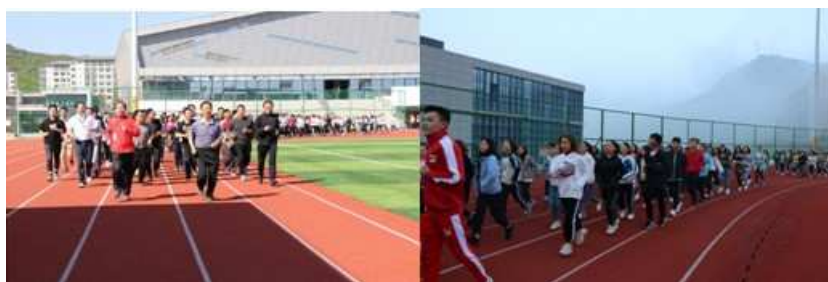
图4 我院领导班子成员及学生参与晨跑