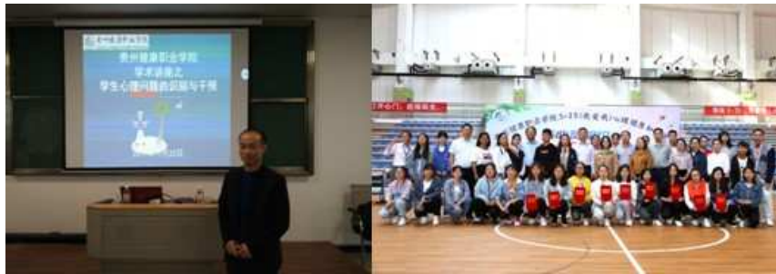
图6 心理健康专题讲座及竞赛