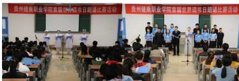
图5 世界读书日活动