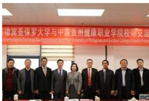
图 16 与菲律宾圣保罗大学交流洽谈

院开展访问，协商双方合作事宜，并与我院师生进行了座谈，详细介绍了菲律宾圣保罗大学相关情况，并邀请学院师生赴该校进行学习交流。