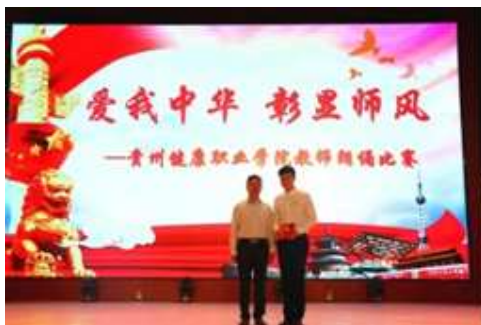
图 8 教师朗诵比赛

教师是学生意识形态教育工作的主体，加强学生意识形态教育工作建设，需要把师德建设提到更加突出的地位。我院以新时期加快建设师德师风的“四个统一”、“四有好教师”为指导，以建立健全我院教师师德师风相关考核制度为契机，实行师德师风“一票否决制”。通过“爱我中华，彰显师风”主题朗诵比赛、组织教师宣读《贵州教师誓词》等多种形式引导教师以德立身、以德立学、以德施教。