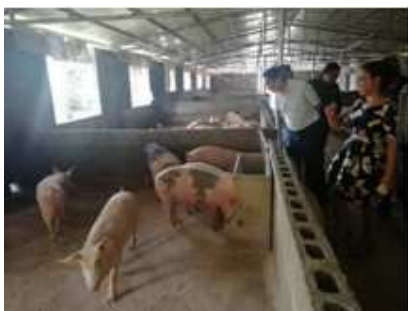
图 18 我院陈太雄副院长赴松桃、江口开展校农结合调研

持的课题《铜仁市农村精准脱贫户家庭收支调查及稳定脱贫模式研究》，为脱贫攻坚提供智力支持；我院探索“校农结合”模式，帮助当地农民打开市场，拓展销售渠道，将脱贫攻坚工作落到实处；我院邓云云老师抽调到脱贫攻坚市级督导组，对铜仁市思南县开展了为期2个月的驻县督导工作，身体力行助力铜仁市脱贫攻坚。