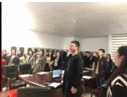
图 9 宣读《贵州教师誓词》