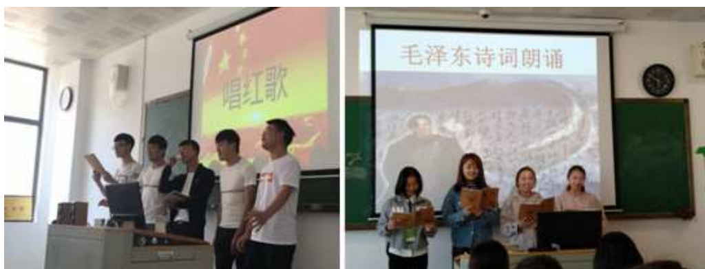
图 12 红歌和毛泽东诗词进课堂

思政组教师一改传统的思政课讲授方式，通过让学生“唱红歌、忆传统”“朗诵毛泽东诗词”等方式，激发学生对思想政治课的热情，调动学生的学习积极性，把课堂转变为以“教师为主导，学生为主体”让呆板的课堂变得生动起来。