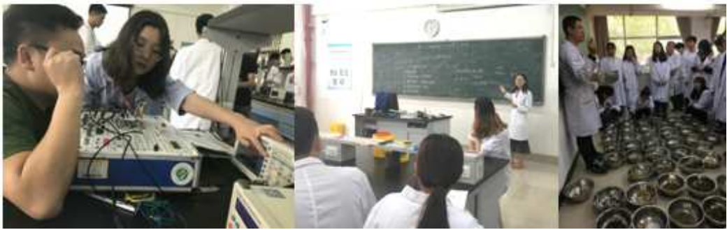
图 10 我院教师在重庆医药高等专科学校、天津医学高等专科学校 进修期间参与带教