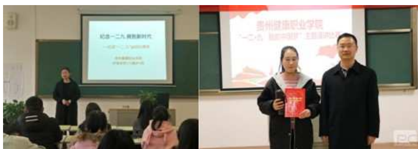
图3 “纪念一二·九”主题班会及主题演讲

通过以上活动，我院学生面貌焕然一新，2018年在省级各类比赛中连夺佳绩，我院录制的微电影《学费》在贵州省“光影透真知 校园表诚信”大赛中取得第四名（二等奖）的好成绩；学院女子足球队在贵州省第四届大学生运动会足球比赛上取得了第8名的好成绩。