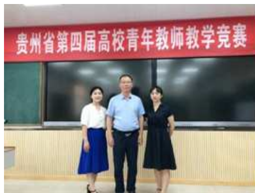
图 11 我院教师参与贵州省第四届高校青年教师教学竞赛

为引导教师深入钻研教材，夯实教学基本功，有效提升教师的专业素养，促进我院教育教学水平朝着更加健康、优质的方向发展。同时为教师搭建一个相互交流、相互学习的平台，我院组织全体教师开展“教案课件评比活动”“教师说课比赛”。2018年7月，我院组织选拔2名教师组队参加由贵州省教育厅、省总工会联合举办的“贵州省第四届高校青年教师教学竞赛”，与来自全省59所高校的191名教师进行角逐，分别取得高职高专工科组“一等奖”和思政组“优秀奖”的好成绩。