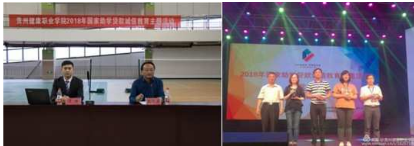
图7 资助贷款诚信教育专题讲座及主题微电影获奖