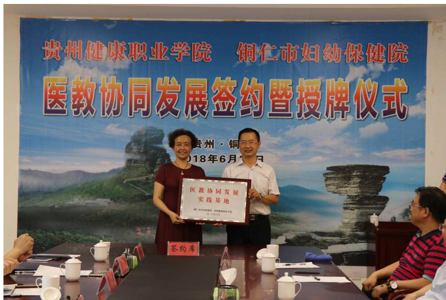
图 13 “医教协同”签约暨授牌仪式

学院与铜仁市妇幼保健院签订“医教协同”发展协议。充分发挥双方的资源优势，建立“资源共享、优势互补、协作攻关”的协同发展模式，进一步提升医院的医疗服务能力和学院的办学水平，共同培养高质量技能型人才，更好地服务社会经济的发展。