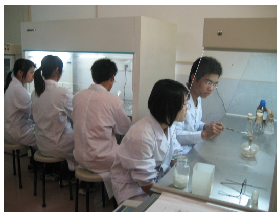
图 6 学生进行育苗接种实验