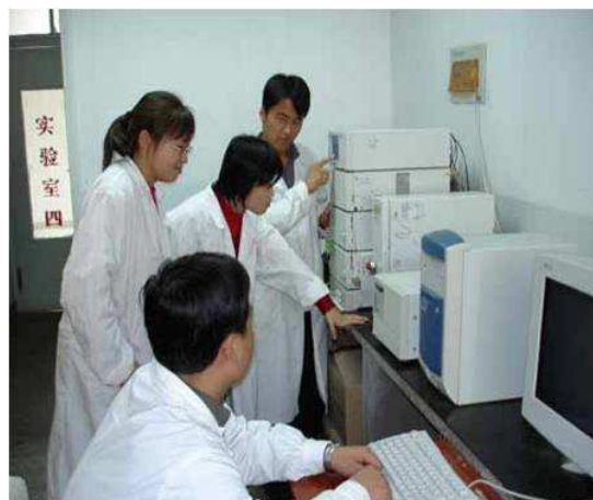
图 5 学生使用高效液相分离植物有效成分

才培养方案更适应产业转型升级及产业链的岗位需求，协同推进人才培养模式改革；与桂林纽斯达医药科技发展有限公司合作生产植物化学成分标准品，企业为学生提供岗位，让学生参与植物化学成分标准品的生产过程，并对学生进行技术培训。