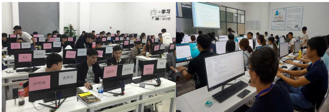
图1 校内实训基地建设和教学