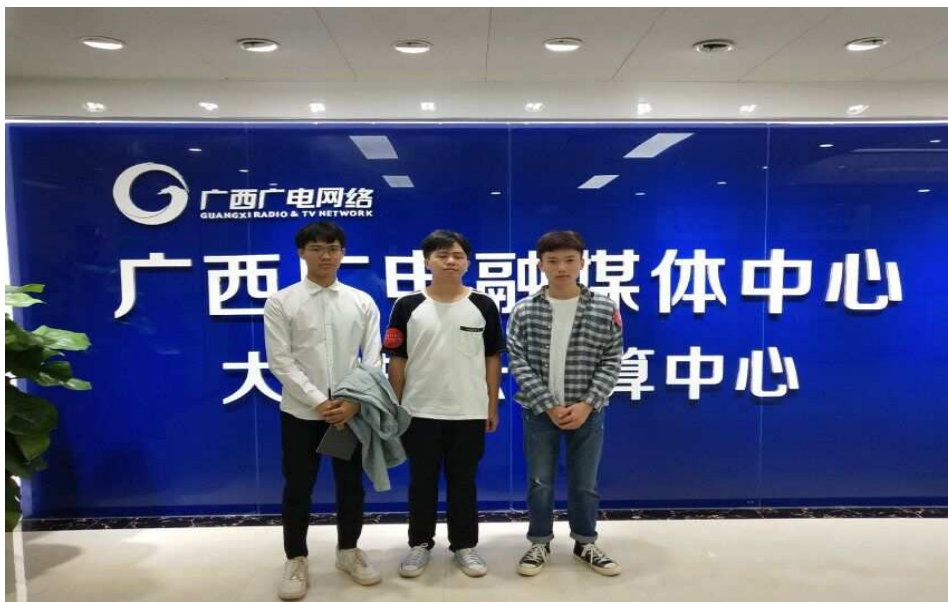
图六：“寻找未来投资家”模拟投资比赛成绩优异学生赴上市公司参观学习