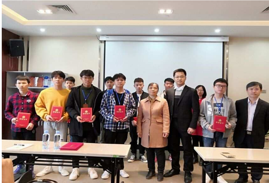
图五：公司给学生颁发荣誉证书和奖金