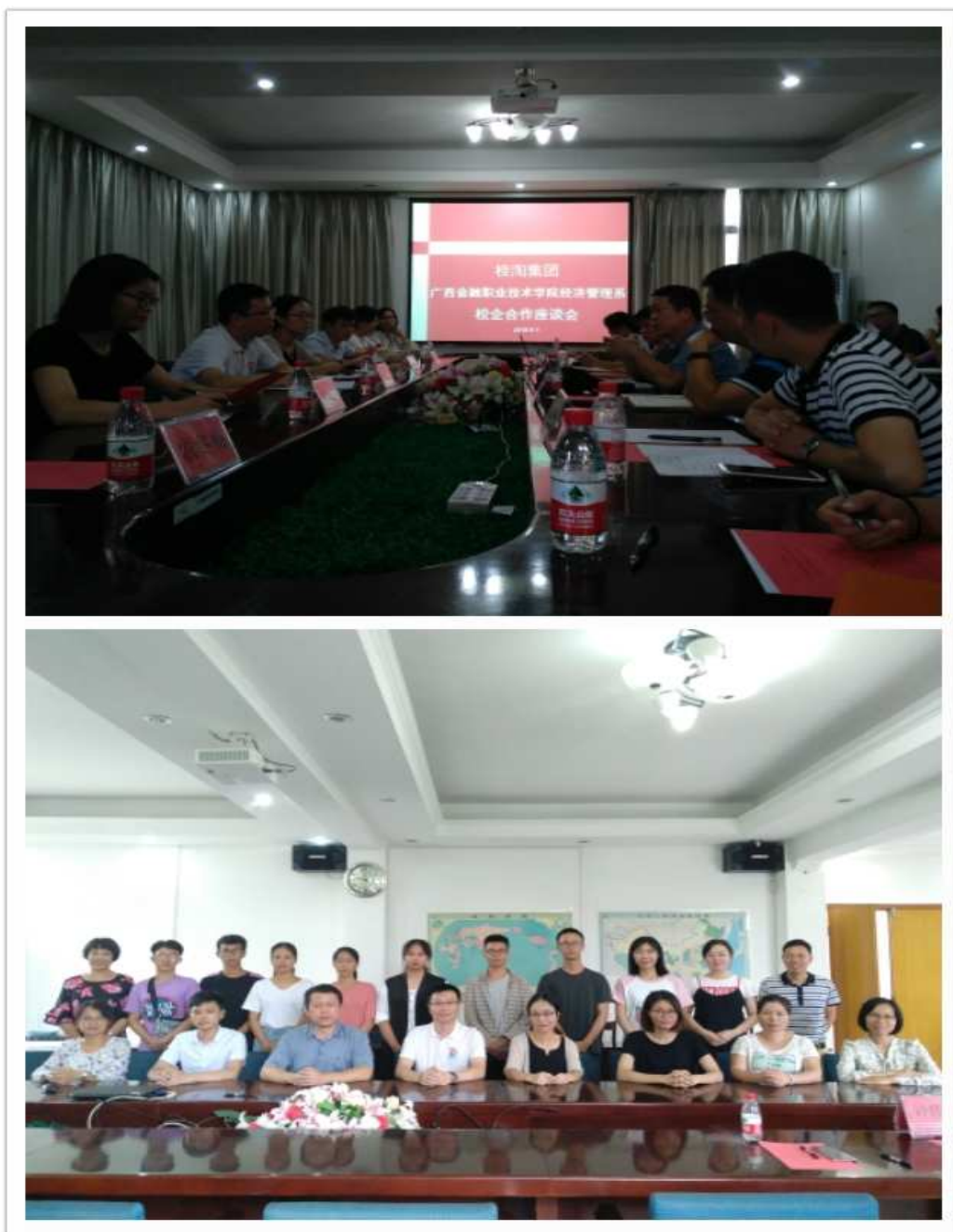
图 3 桂淘集团与经济管理系师生就校园创业项目召开座谈会