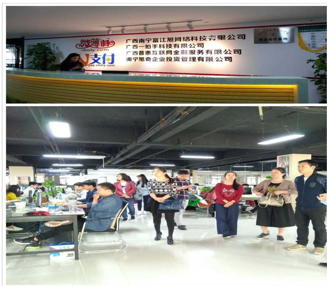
图2 经济管理系教师一行到广西南宁富江旭网络科技有限公司参观交流