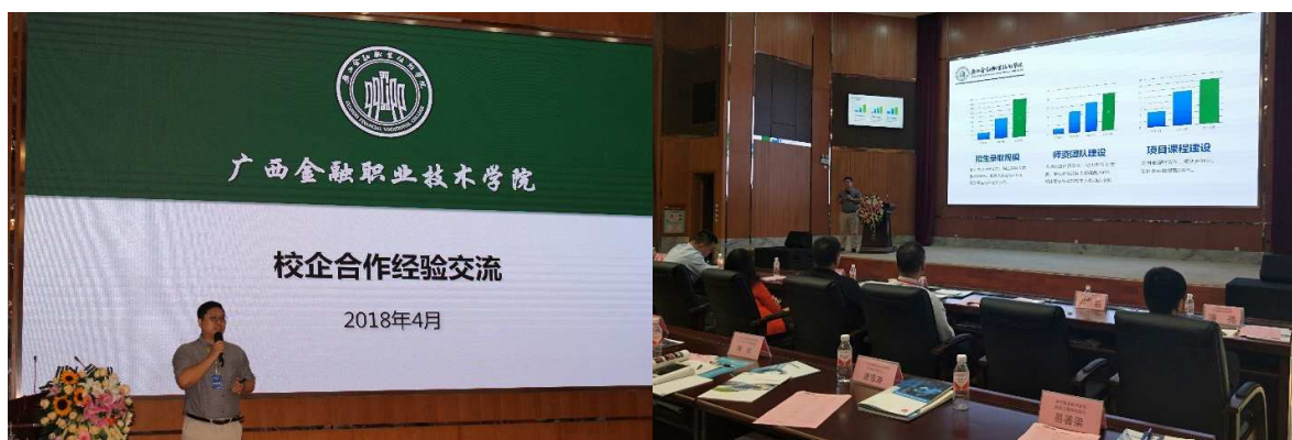
图3 校企协同育人专业共建经验交流