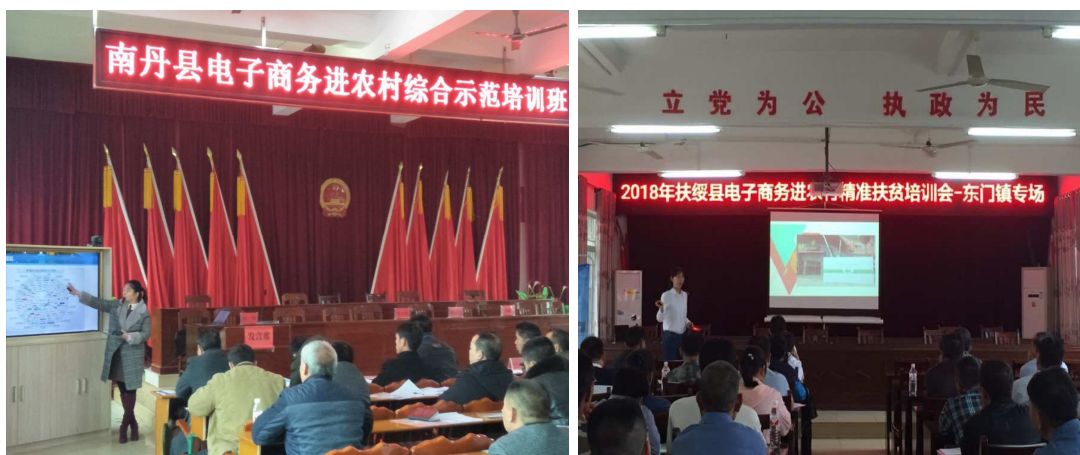
图1 我院教师赴基层进行农村电商授课