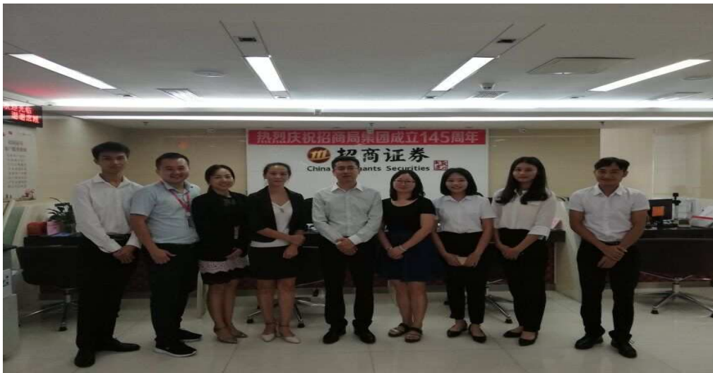
图一：获得证券从业资格证书学生在招商证券深圳分公司顶岗实习

而在证券从业资格考试方面，学生报名人数和考证通过率也明显提升，我系 2016 级在今年 9 月前获得证券从业资格证书的学生 6 名，基金从业资格证书的学生 1 名。在校园实习就业招聘会上，获得从业资格证书的学生直接就被招商证券深圳分公司福华三路营业部接收为实习生。