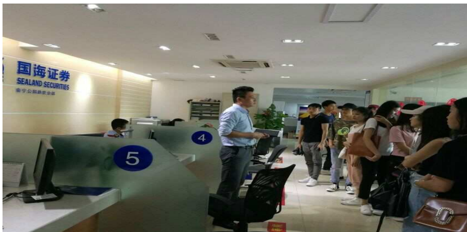
图三：国海证券公司广西分公司公园路营业部现场教学