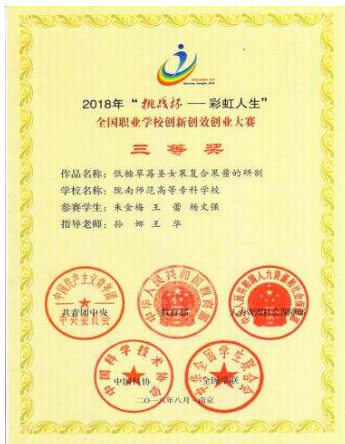
双创成果获国家奖项

区建成运行。该园区是在原有各涉农专业校内实践基地的基础上，始终按照高等职业教育的“五对接”原则和“基于工作过程的一体化课程教学改革实践”为总要求，采用“产教融合、校企合作”方式运行，划分有园林苗圃、智能温室、小型食用菌生产试验中心、小型家禽孵化养殖场等9个功能区域。