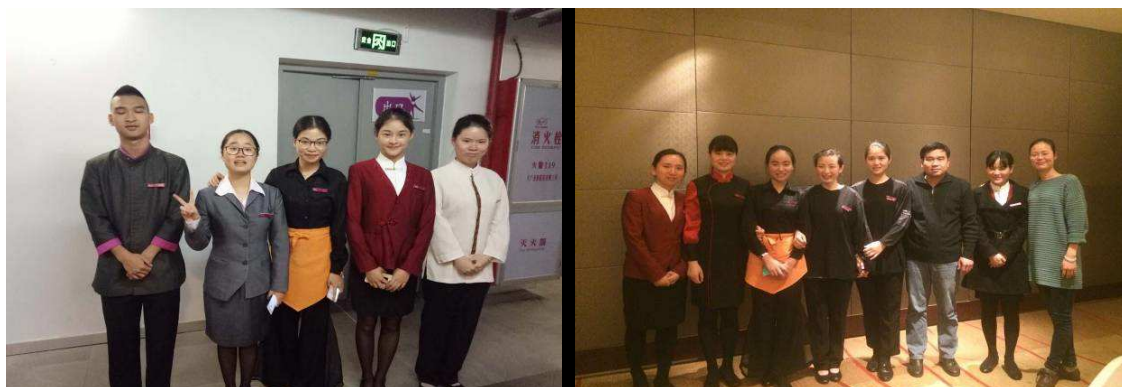
学生参加毕业顶岗实习

(4) 为厦门、龙岩乃至海西酒店业培养了高水准的一线服务员和中基层管理人才，一定程度上缓解了酒店业人才紧缺问题，也节约了用人单位的培训成本，最终使学校、企业、学生、社会满意。