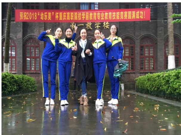
图 15 我校学生参加重庆市技能大赛活动

比赛中同学们不畏强手，沉着应战、勇于拼搏，取得了优异成绩，共 7 名同学斩获 1 个二等奖、3 个三等奖。