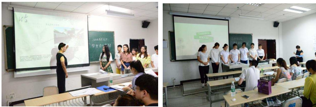
图 16 项目制毕业设计答辩现场

学院毕业设计工作从选题、开题、中期检查、预答辩到正式答辩，历经 6 月，评选出优秀项目组会在毕业典礼上隆重表彰。其中，多不作品获得合作单位好评。多组作品被选送至铜梁电视台等媒体播发。