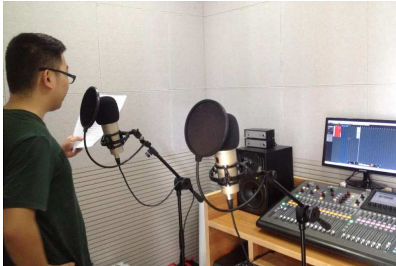
图 17 学生在录音棚录制节目

【案例 4】铜梁广播电视台合作每天一小时的广播节目，深受铜梁区人民的喜爱。我校学生朗诵十九大报告，以及参与铜梁区乡村振兴报告