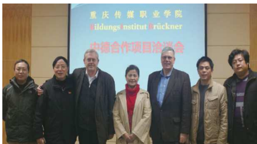
图 21 学院领导与德国专家洽谈合作项目