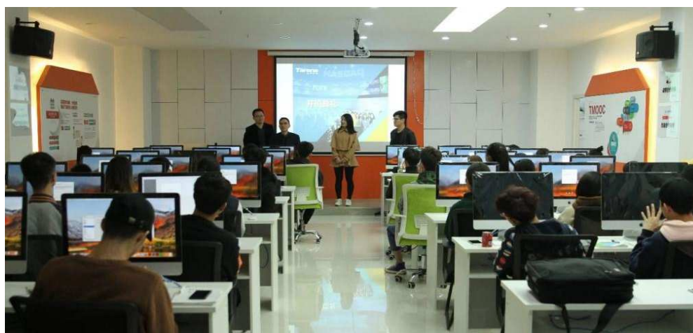
图 14 达内教育集团实训基地

北京中鸿、北京通用航空、重庆德瓦科技等大型企业建立了长期的校外实训基地。同时还开设了具有行业特色的“德瓦科技”、“国际邮轮乘务”、“北京通用航空服务”、“电子商务”、“新媒体”等定向班。学生在校期间即可参与企业项目制作，实现零距离上岗。学生顶岗实习率达 100%，一次性就业率持续保持 95%以上。