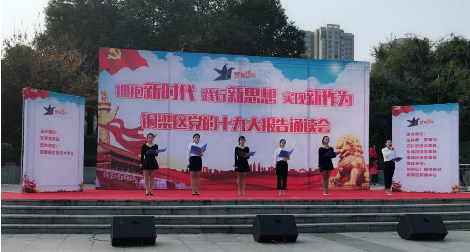
图 18 学生代表参加铜梁区党的十九大报告诵读会