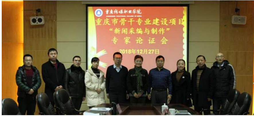
图 10 重庆市骨干专业建设项目专家论证会 1