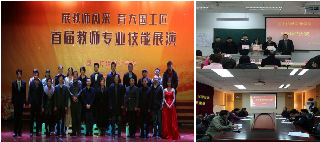
图 12 教师专业技能展演系列活动

学能力，促进教师专业发展，提高教师综合素质，加强我校教师队伍建设，提高教育教学质量我校组织开展了首届教师专业技能展、多媒体课件比赛以及教师作品展。