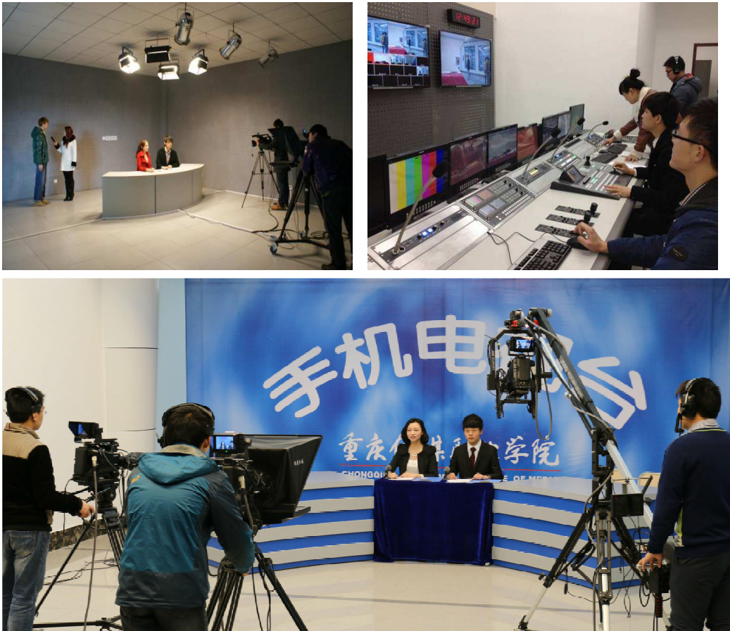
图 13 学院部分实习实训基地

学院具有丰富的校内外实训基地，建有演播室、钢琴房、录音棚、灯光室、摄影棚、新闻中心、达内 AI 创新工场、学前教育幼儿游戏室、学前教育幼儿保健室、康复理疗实训室、手机电视台、非线性编辑室、动漫画实训基地、数字媒体专业群综合实训室、电视节目制作室、艺术创意工作室、动漫画实训基地、物流与报关综合实训基地、财务管理实训中心等校内专业实训平台。