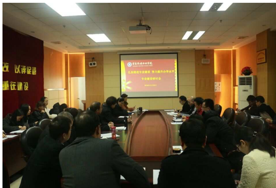
图 8 重庆传媒职业学院专业建设研讨会