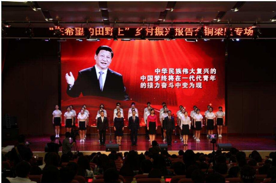
图 19 学生代表参加乡村郑兴报告铜梁区专场