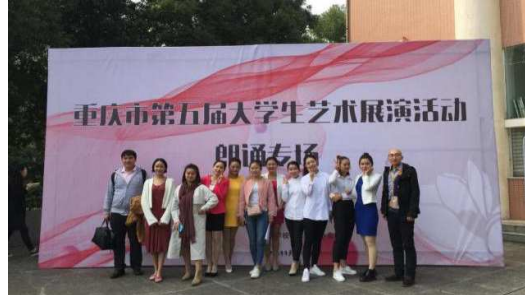
图 2 第五届大学生艺术播音与主持活动纪念