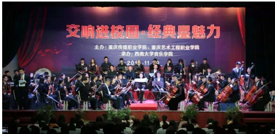
图 3 重庆传媒职业学院学术厅“西南大学交响乐团演出”活动现场