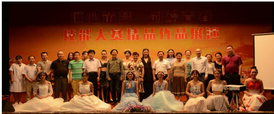
图 4 重庆传媒职业学院学生技能大赛精品作品展演