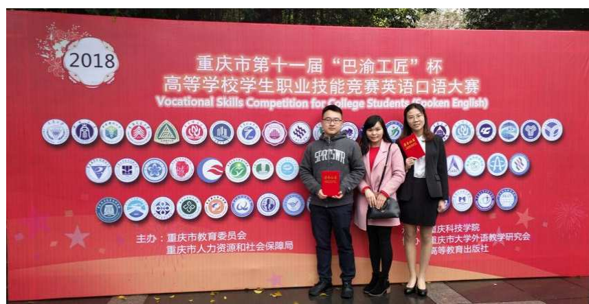
图 15 学院学生参加“巴渝工匠”杯英语口语大赛喜获佳绩