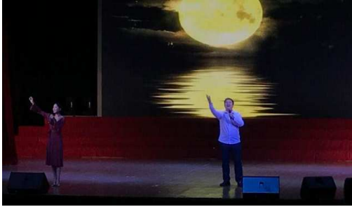
图 1 第五届大学生艺术播音与主持比赛现场

2. 学生参加第五届大学生艺术展演和各类比赛获奖颇多,2016 级播音与主持专业的学生在朗诵项目中荣获二等奖和三等奖,舞蹈专项比赛中荣获一等奖受到组委会一致好评。