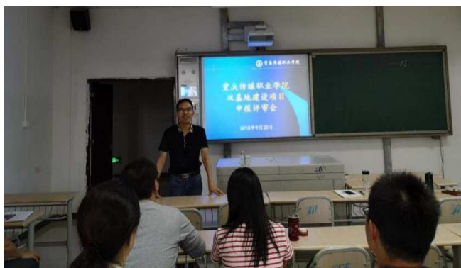
图 7 我校教学负责副院长支持召开“双基地建设项目”评审会

根据重庆市教育委员会、重庆市财政局关于开展高等职业教育双基地建设项目申报工作的通知，我校积极申报，