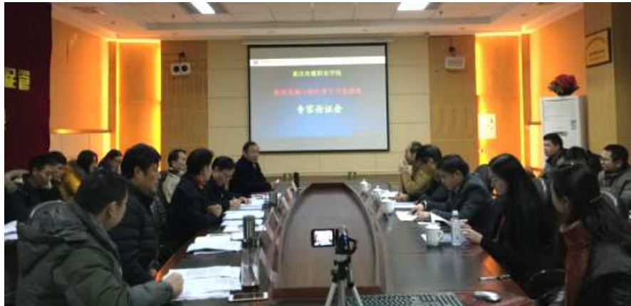
图 11 重庆市骨干专业建设项目专家论证会 2