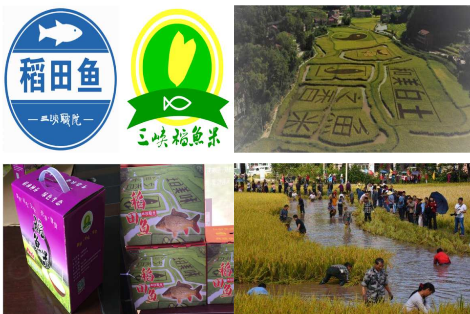
图 4 重庆三峡职业学院精准扶贫图片

稻渔综合种养产业紧紧依托“智慧稻渔产业脱贫创新团队”支撑，以大林村为示范稻渔种养示范基地，带动三峡库区相邻区县发展稻渔产业，打造集“智慧种养、文化传播、产品营销”于一体的“智慧稻渔”平台，将“三峡稻鱼米”和“三峡职院稻田鱼”2 个商标打造成重庆知名商标，完善三峡库区稻渔产业链，助推三峡库区精准扶贫和乡村振兴。