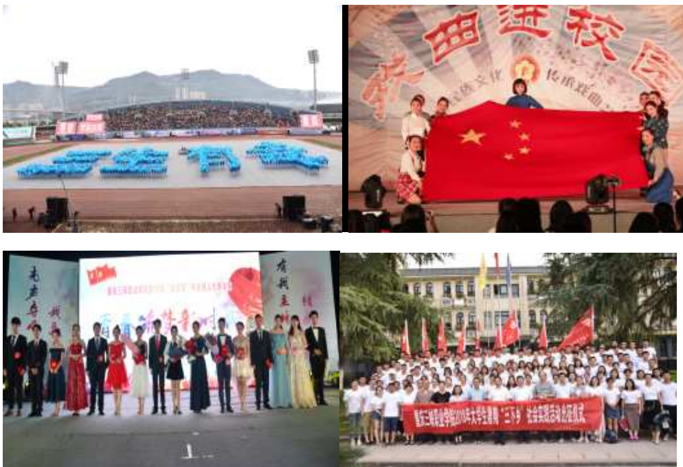
图1 重庆三峡职业学院学团工作情况

通过“一会一品”工程、“专业+社团”的品牌发展模式、“1+100”制度等多种形式，鼓励学生结合自身专业学习，跨系部、跨专业开展第二课堂活动以提升自身素质、培养工匠精神，为自己的可持续发展打下坚实的基础。