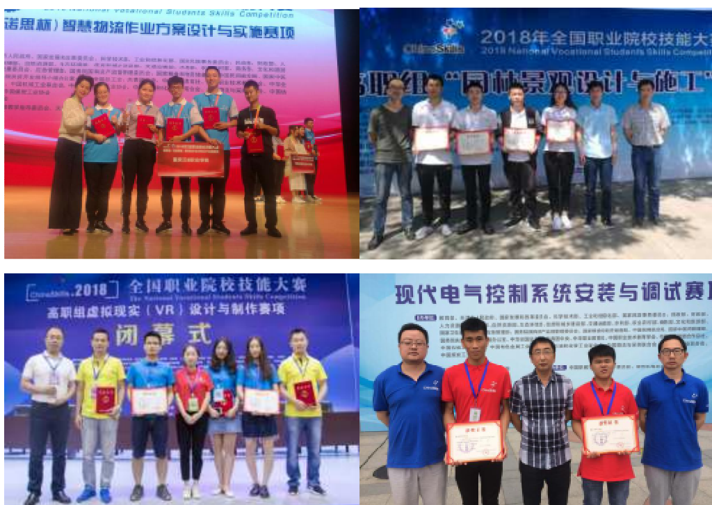
图 2 重庆三峡职业学院学生参加全国职业技能大赛获奖

虽然在技能大赛中取得了不俗的成绩,但学院没有懈怠,而是将此作为改革发展的动力,一如既往地进一步优化课程体系与教学内容,持续开展适应教学新业态的教学模式改革,抓住“互联网+教育”的转型时机,使线上线下资源更好地融合,让全院师生更加方便快捷地融入大赛,以期在未来的各级职业技能大赛中取得更好的成绩。