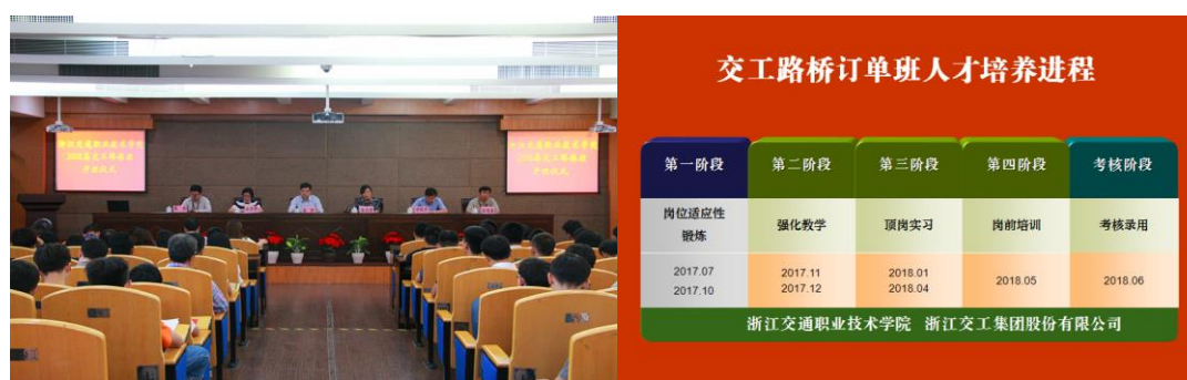
图2 订单班开班仪式及2018年交工订单班人才培养进程

基于浙江交工集团股份有限公司与浙江交通职业技术学院校企合作框架协议精神，已建立四届“交工深度合作订单班”（图2），招生人数60人。通过订单培养，以突出理论知识与实践技能高度融合为基础，使所培养学生直接面向本企业施工一线的项目施工与管理、质量管控、安全管理、试验检测等专业技术岗位，具备相应的职业岗位技能，爱岗敬业、团队协作强，能够完成公路工程建设项目的测量放样、试验检测、施工、工程管理等主要工作任务，实现学校与企业需求无缝对接（图2）。