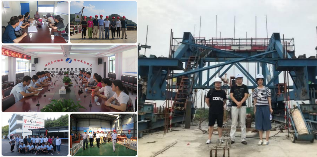
图 5 暑期锤炼双师 图 6 施工现场指导