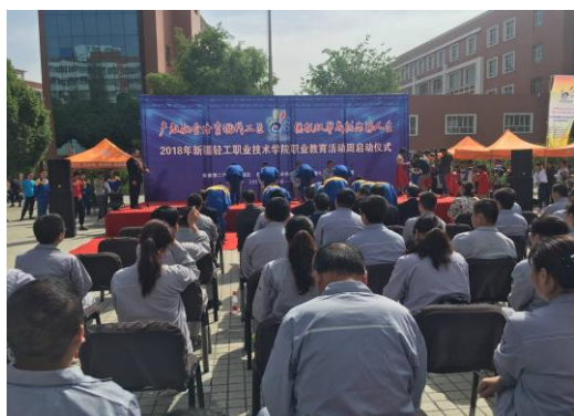
中泰学院拜师仪式

2018年5月12日中泰学院组织开展了来自中泰集团阜康能源、华泰公司、巴州金富、富丽震纶的38名企业专业导师与中泰学院176名学生之间的现代学徒制拜师活动。通过学校、企业深度合作，教师、师傅联合传授，实现“五个对接”提高人才培养质量和针对性，积极培养“工匠精神”型人才。