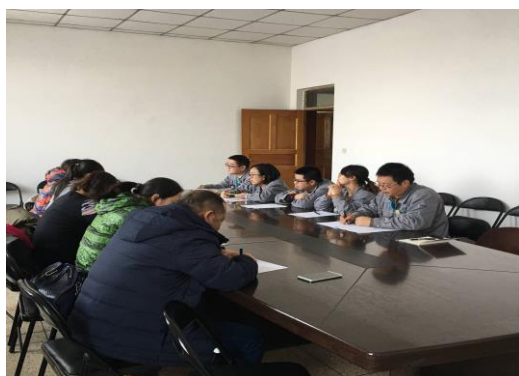
教师工作站出站答辩