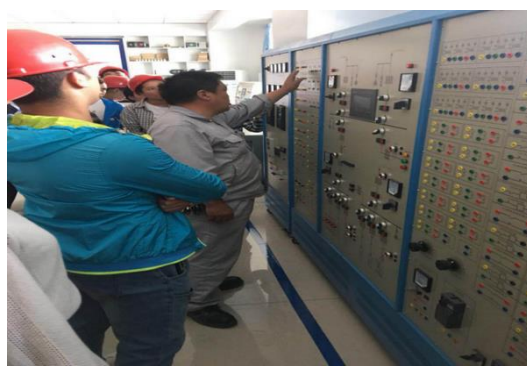
中泰学院学生在企业认知实习