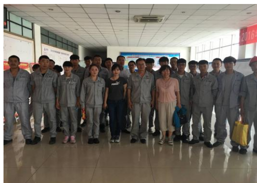
学生到中泰顶岗实习