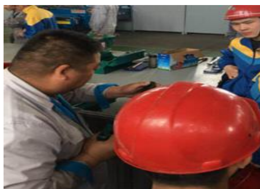
企业导师现场指导

通过现代学徒制试点培养模式，让学生在较短的时间学到更多更专业的技能，本着传、帮、带的职业精神，不仅能为学生提供快速学习的平台，还能带动企业技能人才与学生