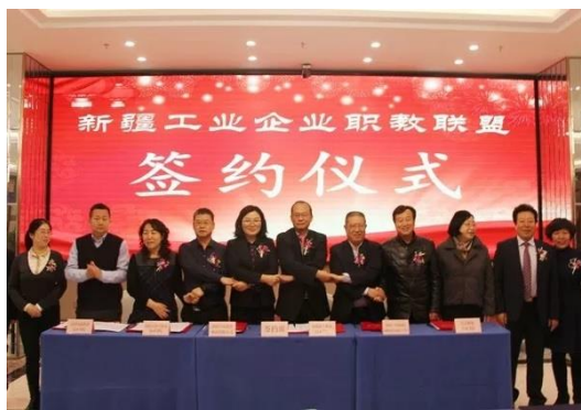
新疆工业企业职教联盟签约仪式

中泰集团从 2005 年开始与学院合作，从订单培养逐步深入，2018 年，与学院合作成立“中泰学院”，共同建设由校内带头人、骨干教师、技能大师、技术人员组成“双导师”师资队伍和教学指导委员会。中泰学院在共建过程中，紧紧围绕“管理融合、产教融合、科技融合、文化融合”的合作办学思路，构建“双主体”育人机制体制，采用现代学徒制培养模式，校企共同招生、共同管理、共同培养、共同考核，从入口到出口的全面合作培养工作，实现一体化协同育人。目前，中泰学院合作办学项目已被自治区深改办和教育厅列为自治区职业教育改革的试点项目，有 6 个专业，11 个班级，503 名在校生。