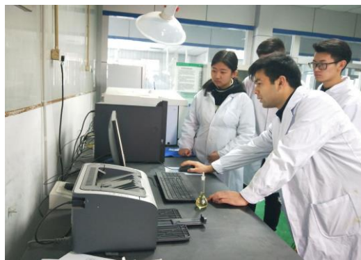
师生共同开展检测项目