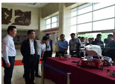
市教委领导视察京东物流展示活动展

集团与天津交通职业学院之间的校企合作模式双赢，成功案例典型。通过校企合作对集团物流人才储备做出贡献的同时，有效探索进行了物流人才培养校企合作模式，促进了中国职业教育物流人才培养发展（现代学徒制）。