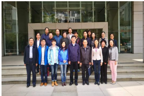
教育部领导指导怒江帮扶工作

4. 京东联手天津交通职业学院开办了全国范围职业院校物流教师能力提升班，本次共计 15 名老师报名参加，分别在京东集团总部和天津交通职业学院两地展开的培训课程：游学京东、良师计划训练营一阶、校企合作模式分享、物流专业建设与课程设计以及物流国赛成果转化。