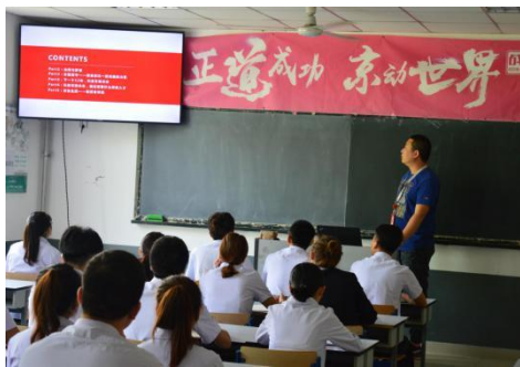
企业教师校内授课