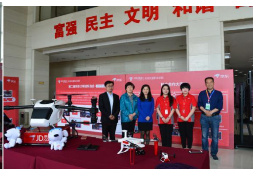
天交院-京东物流合作展示